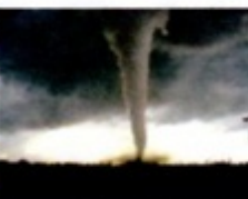
↑大嵐で波乱の日々が始まるのはまだまだ先か。

6月に入ってから、暖かくなるはずが、暑くなく山火が噴火したり地震が起ると今年はずっとやらない年なんだと思ったりする。今年も普通通りやらない年なんだと思ったりする。今年も普通通りやらない年なんだと思ったりする。今年も普通通りやらない年なんだと思ったりする。