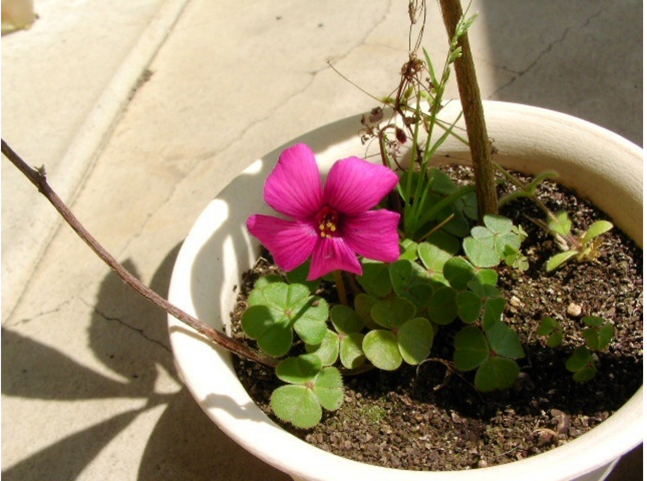
今年もベニカタバミが咲きました。

寒い冬を葉っぱで過ごして春の中ごろにようやくお花が咲きました、こちらは勝手に生えてきて育ってしまったものなのですが冬を耐えて派手な花を咲かせるのがとても印象的です。