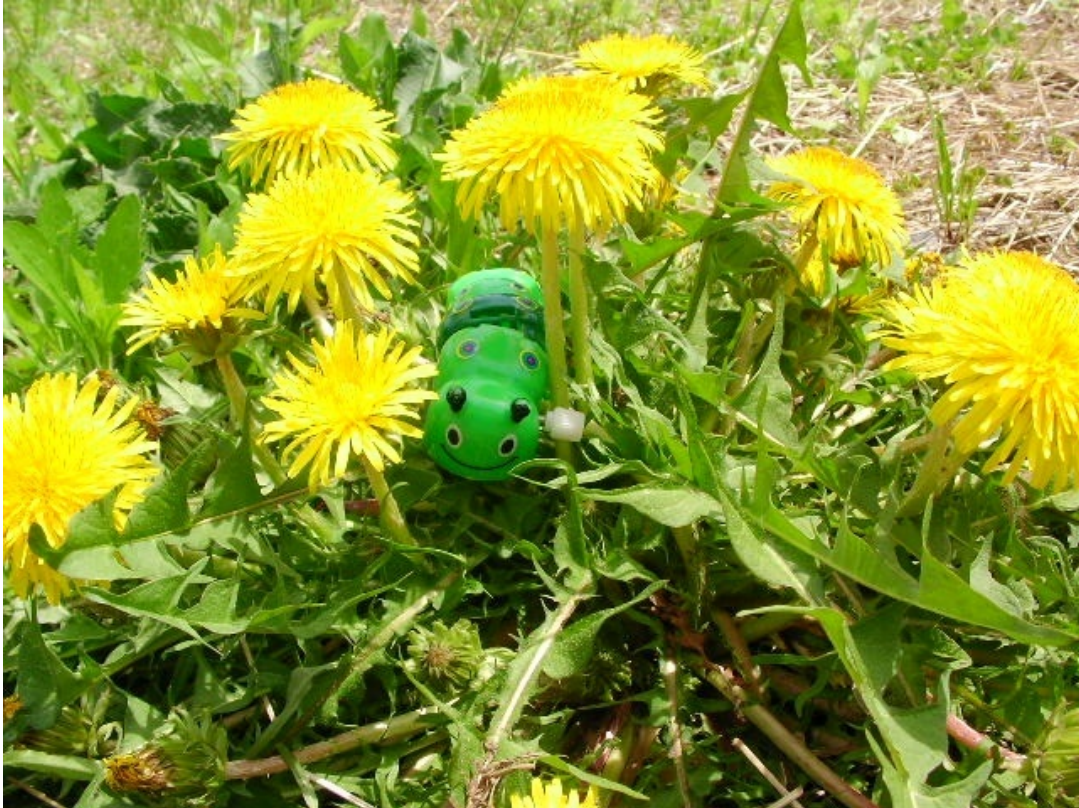
春の朗らかなお日様

お散歩にはぴったりの季節ですね、お花たちが咲き競うこの季節はお散歩をしている私も自然と笑顔になります。