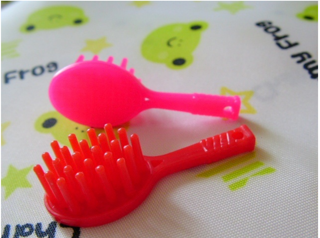
ラケット型のクシ

こちらのコーナー始まって以来の女の子のおまけです。テニスのラケットの形をしたクシですね。