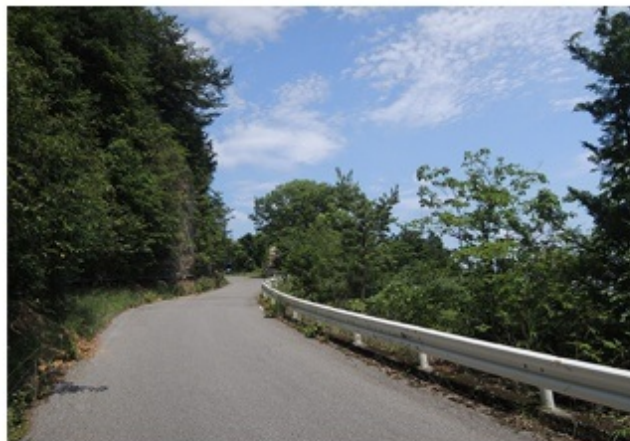
↑傘杉峠付近。空に向かうような道にワクワク