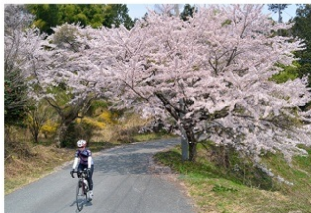
↑桜も新緑も紅葉も美しいファームライン♪