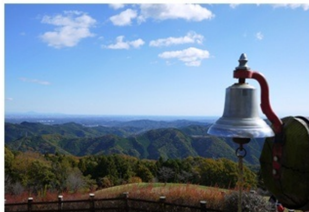
↑秩父高原牧場からの絶景！