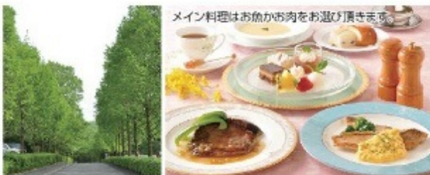
メイン料理はお魚かお肉をお選び頂けます。