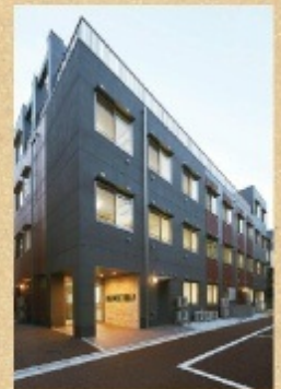
大東市の身近な施行例 カインドコート住道(赤井1丁目)

「介償付き賃貸マンション」という土地活用の提案として誕生。建物を作るだけでなく、運営や関連企業等トータルで紹介。