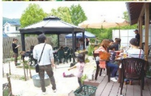
①ビニールハウスなので雨でも収穫できます。また高床式の砂栽培は、作業が楽で衣服も汚れません。 ②ハーブガーデンでは採れた野菜をBBQで。