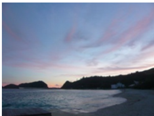
父島の二見港ちかくの海岸。