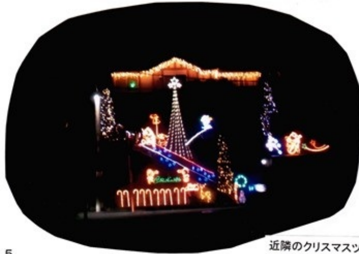
近隣のクリスマスツリー