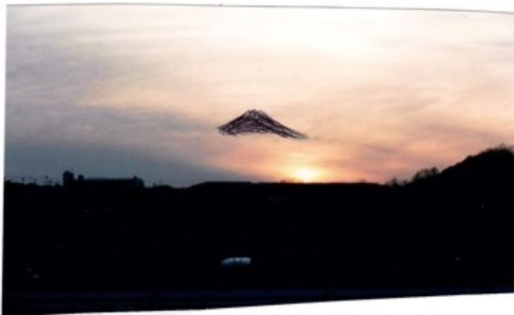
変な雲が出た <富士山の裾野に沈む夕日>