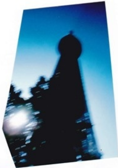
スカイツリーの眺め