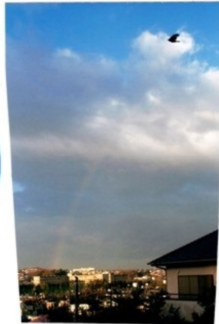
カラスかトンビか