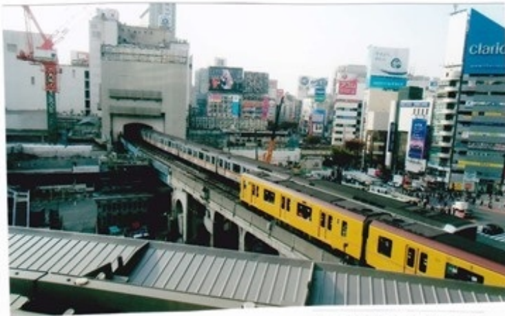
渋谷のリニューアル風景