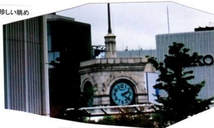
銀座の珍しい眺め