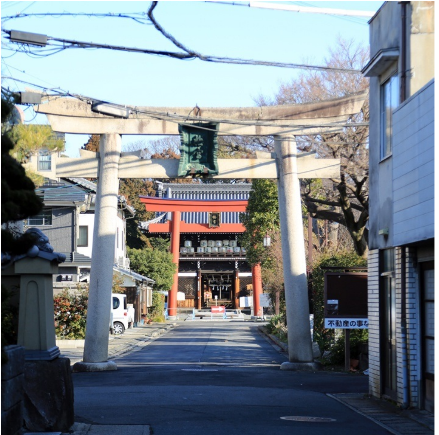
梅宮大社は住宅街にあります。