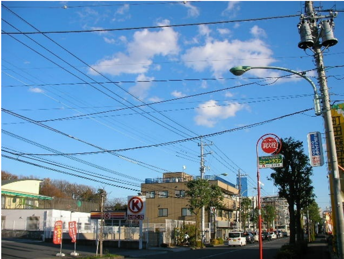
冬の晴れの空は綺麗な青空

冬の青空は寒い季節の唯一のぬくもり、そんな気がします。陽射しのぬくもりが直接降り注ぐような感じ、ですが澄んだ青空は実際には寒いのですよね。