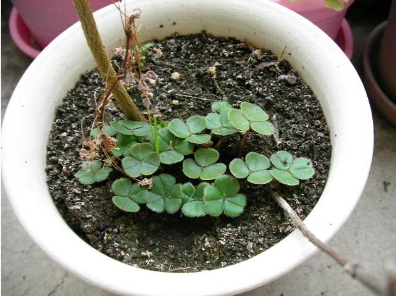
今年もひょっこりと

ベニカタバミが顔を出しました。実はこの場所は以前ご紹介しました普通のカタバミが生えていたところなのですが今はすっかりベニカタバミに取って代わられています。これが雑草の力なのでしょうか？本当に強いです。この小さな鉢の中で季節ごとの姿を見せてくれてそれがまた楽しいです。