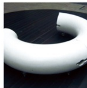
ストリートファニチャー