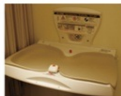
※おむつ交換台イメージ

おむつ交換や多目的トイレなども下通繁栄会各店に設置しております。 その他、赤ちゃん用のミルクを作る際に必要な「白湯」の提供も致しております。 お気軽に店舗スタッフにお声掛け下さい。