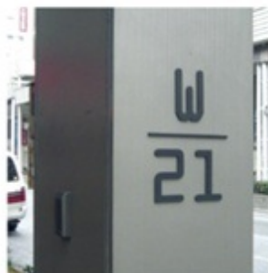
目印となる柱の番号

各所に設けられたストリートファニチャーはお買い物途中の休憩場所として、アーケードの柱に記された番号は、待ち合わせの目印代わりにご利用いただけます。下通は、誰もが楽しく、安心して時間を過ごせる空間を通して、“やさしい街づくり”を目指していきます。