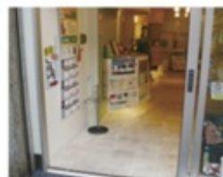
※バリアフリーの店舗(イメージ)

下通繁栄会各店では、アーケード路面と店舗入り口の段差が少ないバリアフリーの店舗がございます。 車いすやベビーカーでも入店しやすいので安心してお立ち寄り下さい。 (バリアフリーの表記が無い店舗でも、入店される際はお気軽に各店スタッフにお声掛けください)