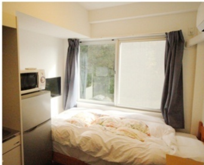
▲ 電化製品完備の便利なお部屋。