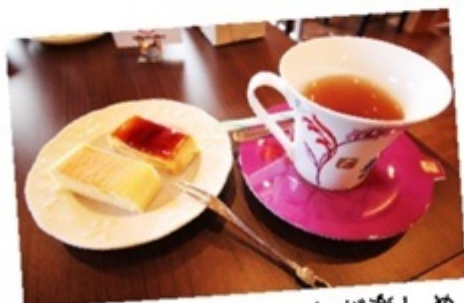
▲優雅なティータイムが楽しめる