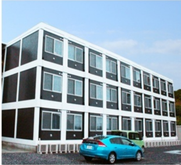
▲ モダンなデザインの外観。