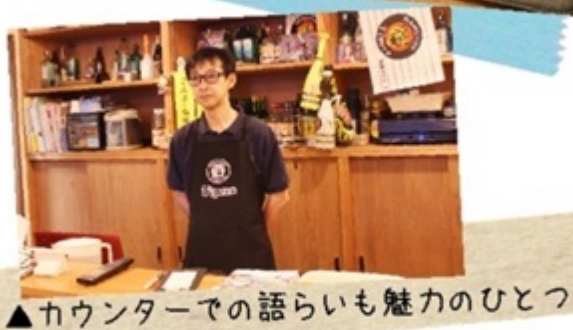
▲カウンターでの語らいも魅力のひとつ