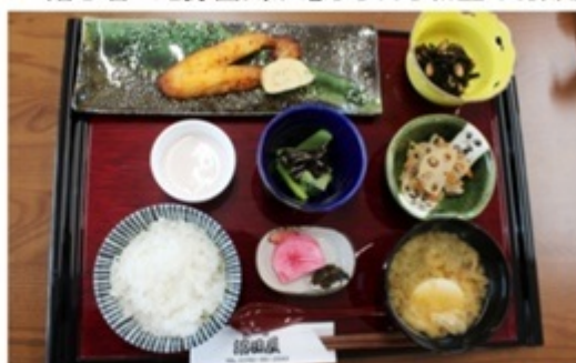
▲ ヘルシーな和食は女性にも嬉しい。