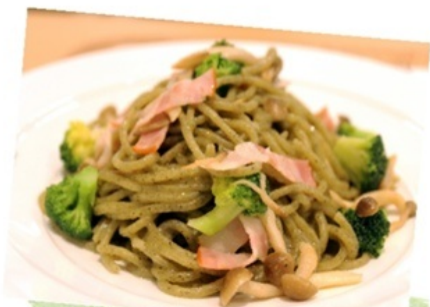
▲バジルの利いたオシャレなパスタ