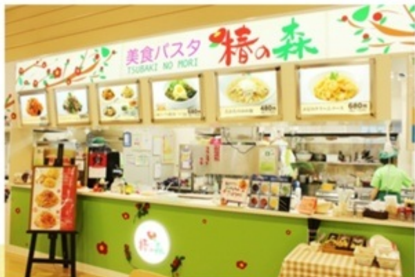
▲パスタの麺は高田オリジナル