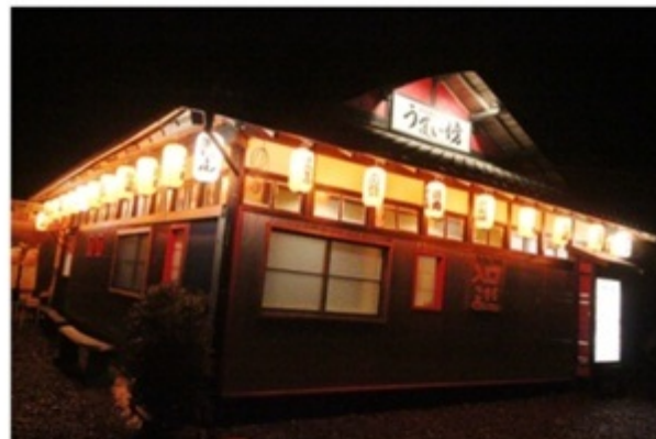
▲横田町の夜に突如現れる灯り