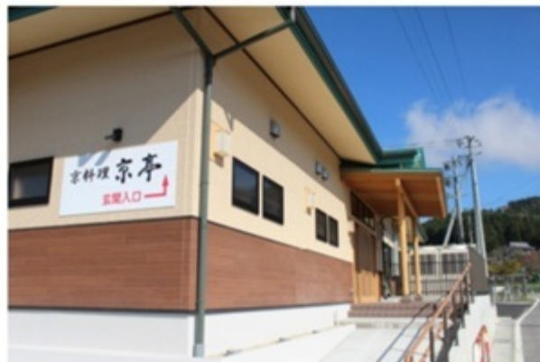
▲ご予約の上でどうぞ！