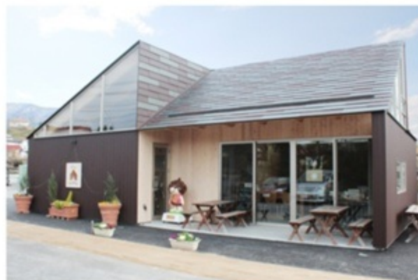
▲本設でも三角屋根が目印です