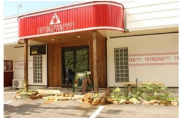
▲「ハイカラごはん」の伝統を引き継いでオープン！