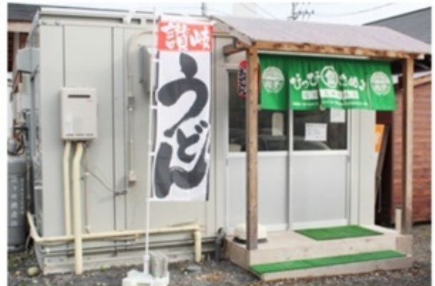
▲竹駒食堂の隣にあります