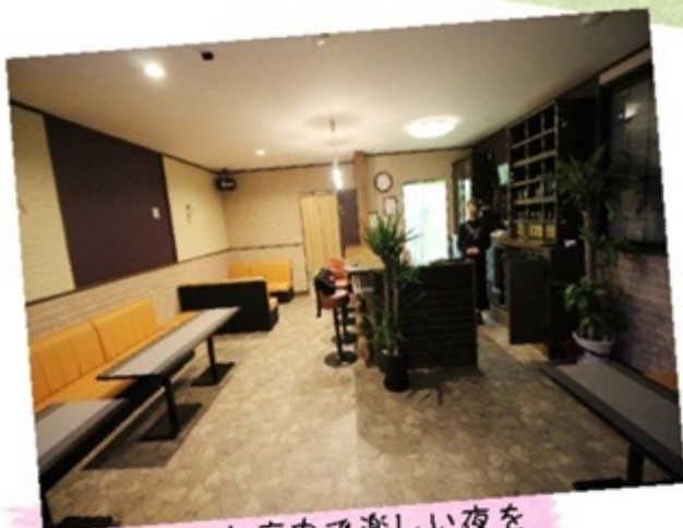
▲広々とした店内で楽しい夜を