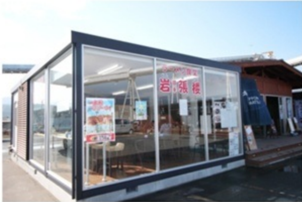
▲全面ガラス張りで見晴らし良好