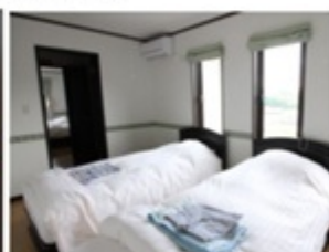
▲ ふかふかの布団でぐっすり眠ることができる。