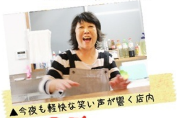
▲今夜も軽快な笑い声が響く店内