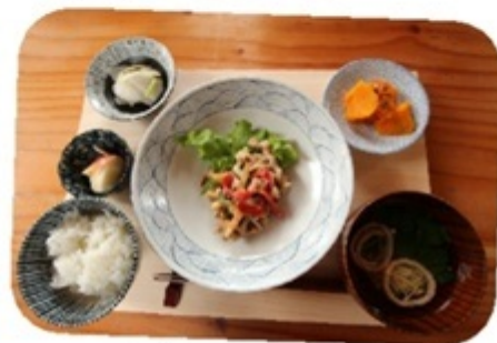
▲お母さんたち手作りのランチは栄養満点♪