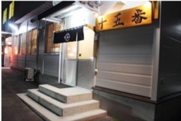
▲店名の由来は昔の電話番号