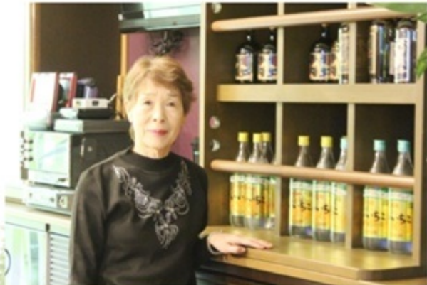
▲スナック新宿はこのママがやっています