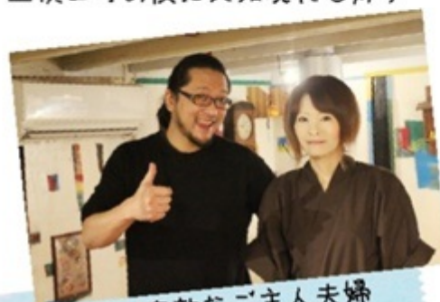
▲笑顔が素敵なお主人夫婦