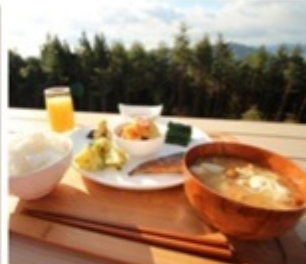
▲ こだわりの朝食はテラス席でも味わえる。