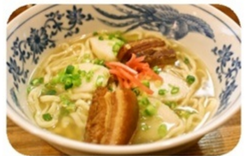
▲あしべ自慢の沖縄そば