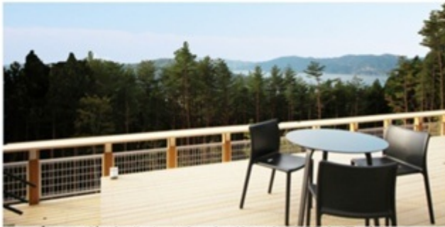
▲ 高田の海を眺め、ゆったりとした時間を過ごす。