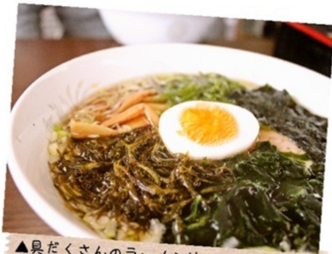
▲臭だくさんのラーメンは あつあつのうちにどうぞ