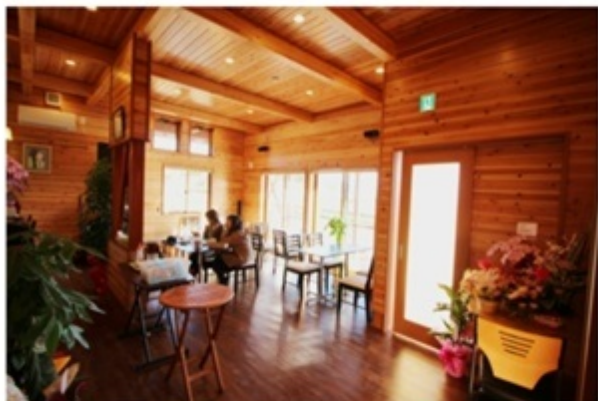
▲出窓から光が差し込む気持ちのいい店内