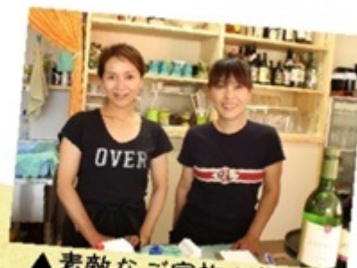
▲素敵なお家族が経営