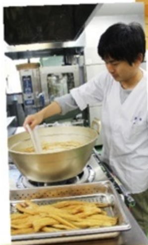
▲大きな鍋で仕込み中