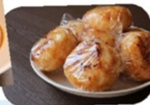
▲懐かしい味が自慢の家庭料理▲