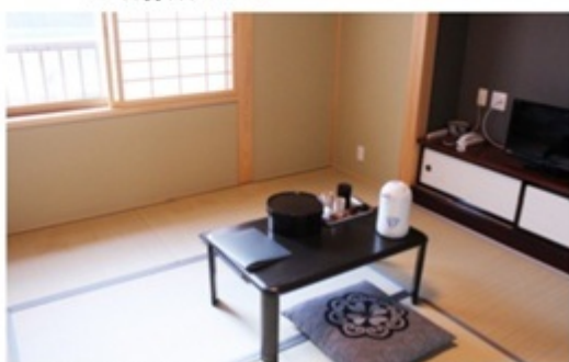
▲ 落ち着いた雰囲気を感じられる和室のお部屋。