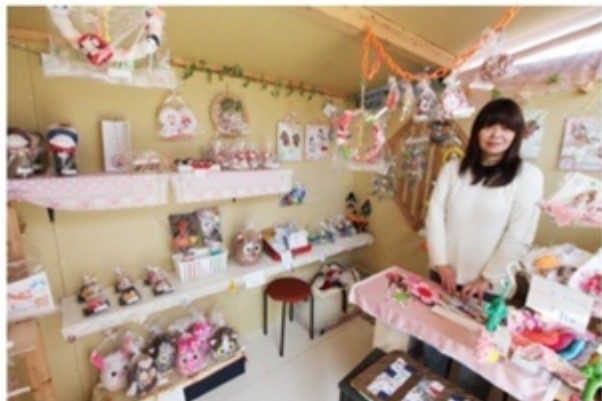
▲店内の雑貨は全て手作り！