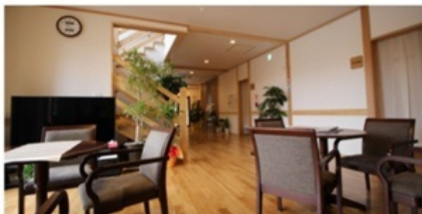
▲ ゆっくりくつろぐことのできるロビー。