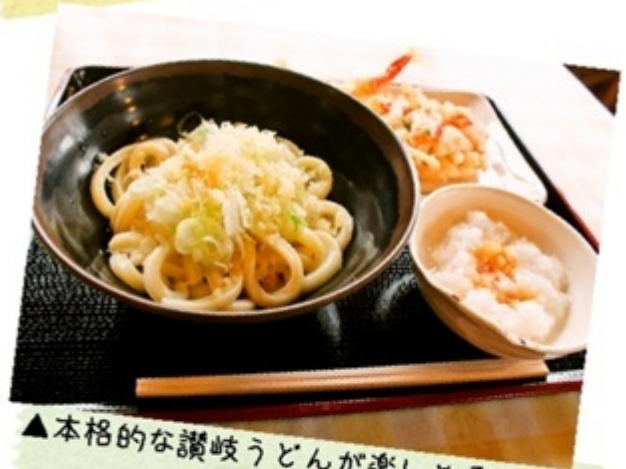
▲本格的な讃岐うどんが楽しめる