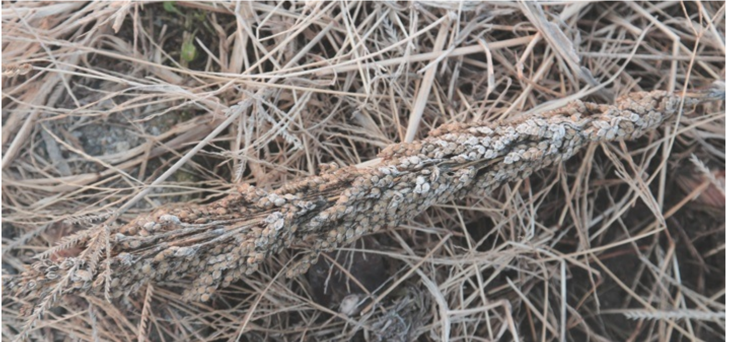
トウモロコシの雄花の穂 白く見えるのは霜がついているせい