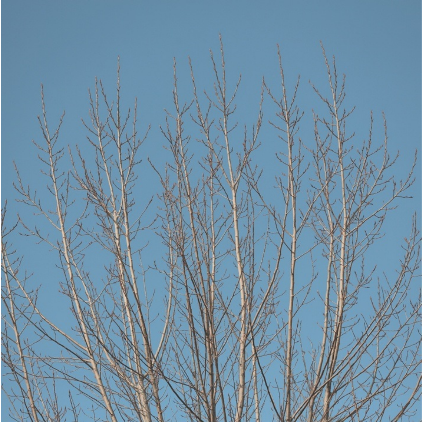
枝と樹が同じ形なプラタナス