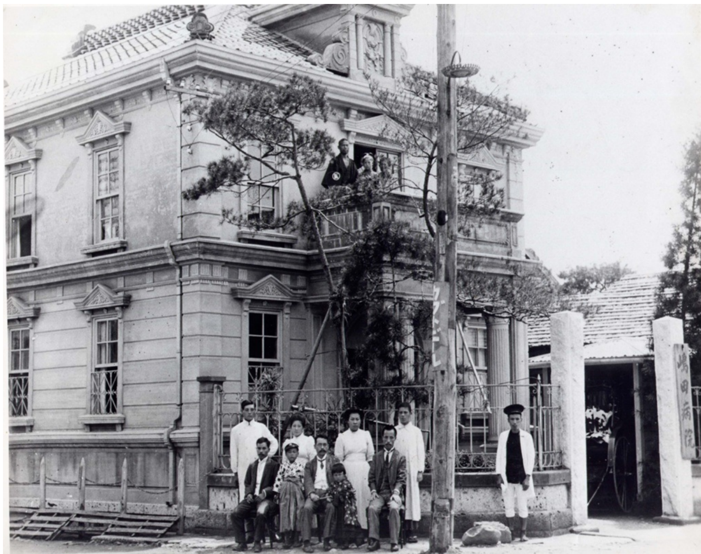
なんと明治40年頃 嶋田病院