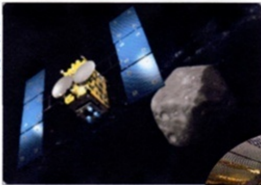
↑はやぶさ2 到着した時の想像図