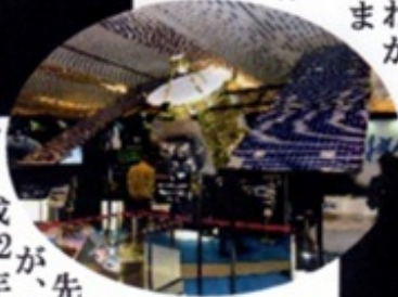
↑はやぶさ2 第1回 国際宇宙会議で 展示された はやぶさ2の模型