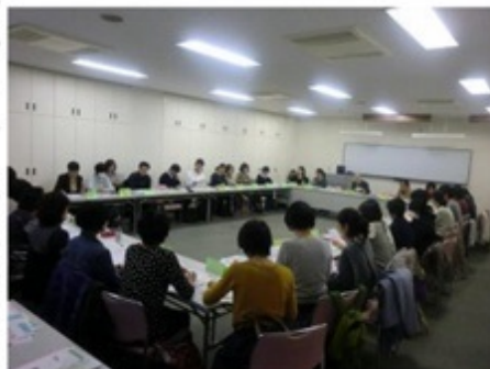
11月28日 中小企業センターにて

他の参加者からの意見や質問もあり、今後もこのような会議や、区政に関心を持つことが大切であると実感できる有意義な場となりました。