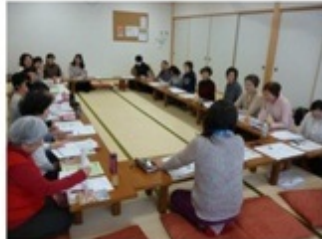
定例連絡会の様子

6月から始まった保育サポーター養成講座が、無事終了しました。今年は30名の参加がありました。皆、夏の保育実習も積極的に参加し、皆勤率も◎！！修了者は、29名でした。毎月定例の保育サポーター連絡会での「新人歓迎会」も終え、近日中に認定保育サポーターとして、派遣保育えくぼ、昭和通りおばちゃんち、品川宿おばちゃんちなどにデビューいたします。よろしくお願いいたします♪