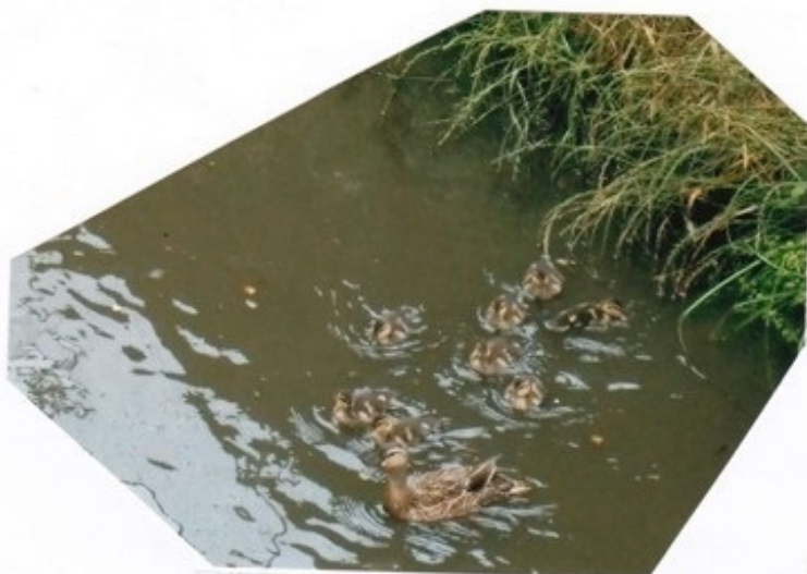
黒須田川にて 8羽の子ガモ連れ