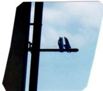
都会と田舎の小鳥