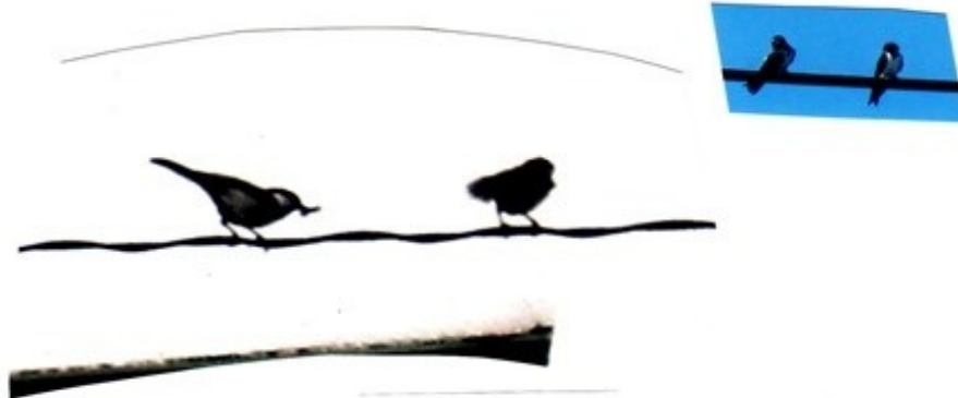
我が四軒長屋前にて