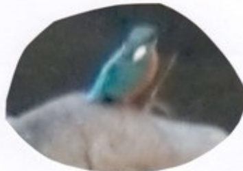
既本のカワセミ大集合