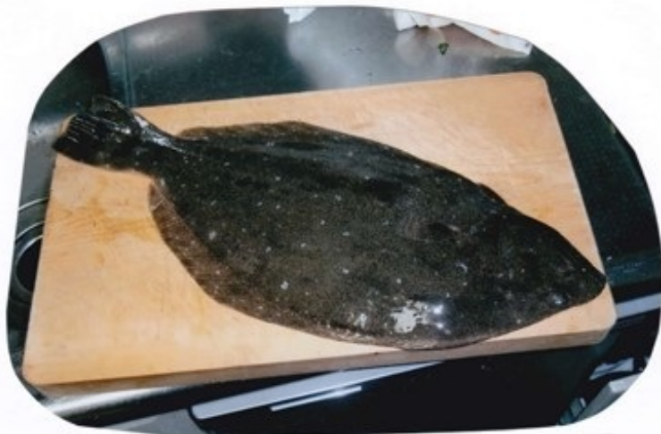
ご近所からの頂き！