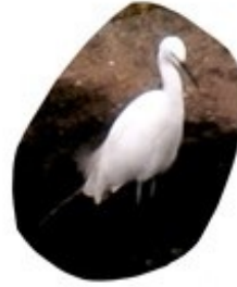
既本の白鷺大集合