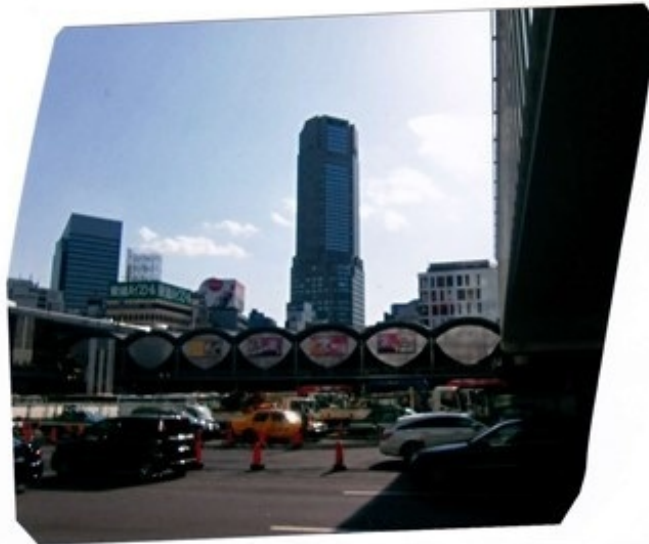
懐かしの渋谷東横地上駅