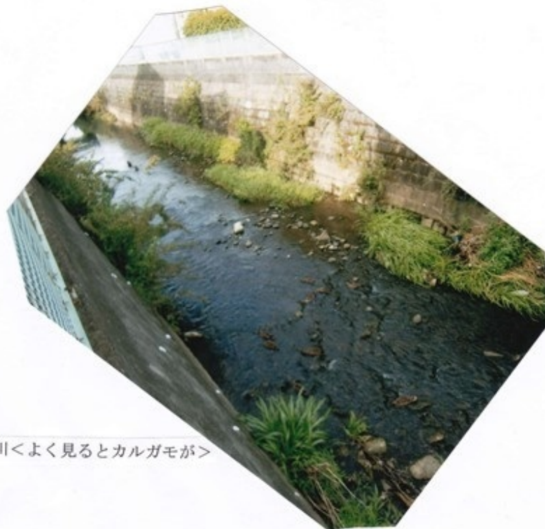
黒須田川<よく見るとカルガモが>