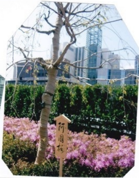
新歌舞伎座の屋上庭園