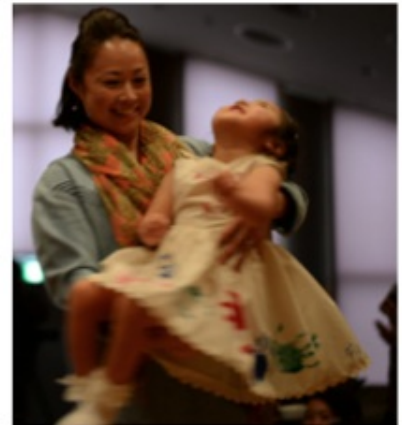
Handstap Art Project

1からすべて手作りです。実は2週間前にお願ひしました。直前にも関わらず快く引き受けてくれました。