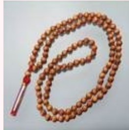
お香のベースとなる香りと、涼を呼ぶ木として知られるサンダルウッド・マーラー(108+1ビーズ)サ...

まず持ち物として、「ジャパラマーラ」 (マントラ瞑想用の数珠)が必要とのこと。これは瞑想の授業で使用します。