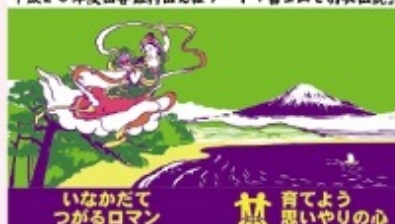
平成26年度田舎館村田んぼアート「富士山と羽衣伝説」

田舎館村の田んぼアートは田植えから稲刈りまで、すべてを手作業で行っています。今年度は15,000平方メートルの大キャンパスに「富士山と羽衣伝説」が描かれます。