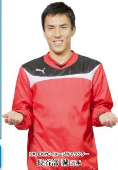
KATEKYOイメージキャラクター 長谷部 誠選手