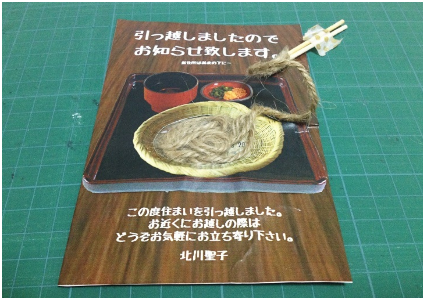
爪楊枝を引っ張ると麻ひもがするするついてくる。