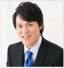
プロフィール | ビグの部屋 おかしなブログ | ビグの部屋