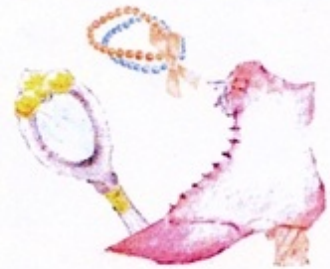
Illustrations / Texts Design Hayase Yamagishi Mami Takahashi

お気に入りのマーケットを見つけたり、お友達とも行ってみましょう。探検の仲間と、見て、触れて、笑って。疲れたら、カフェで飲み物を片手に、宝ものを見せ合いましょ。