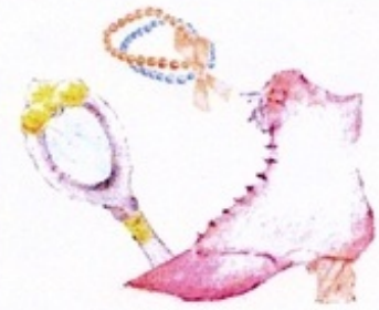
Illustrations / Texts Design Hayase Yamagishi Mami Takahashi

お気に入りのマーケットを見つけたら、お友達とも行ってみましょう。探検の仲間と、見て、触れて、笑って、疲れたら、カフェで飲み物を片手に、宝ものを見せ合みましょう。