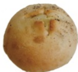
■ ポテサラ ■ ポテトサラダを 包んだ人気ベーグル