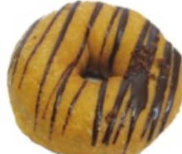
■ コーヒ-ちょこ ■ ほろりのコーヒ-風味 がアクセント