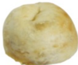
■ メイプル ハニーナッツ ■ はちみつ+メイプルと たくさんのナッツがやみつき