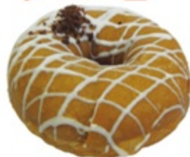
■ キャラメル マキアート ■ コーヒー生地にチョコ キャラメルでデコレーション