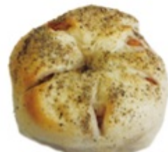
■ ガーリック ペーコングリッチ ■ がっつり系セリ辛が 大人の味♡