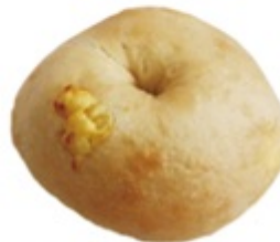
■ クリームチーズ ■ チーズたっぷり 飽きない定番