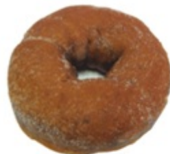
■ ちょこちょこ ■ チョコ生地にチョコ チップがたっぷり!

ピンクののれんが目印。ギフトボックスもかわいらしく 差し入れにもピッタリ! ネット販売や予約も受付けて くれるので便利です。地方発送もOK! 冷凍なので 焼き立てを味わえます。店内もかわいいので訪問もオススメ。