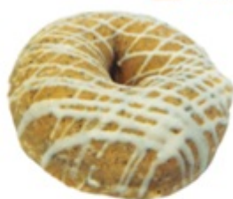
■ アップルティー ■ 系紅茶生地+リンゴ +カスタードの相性が◎