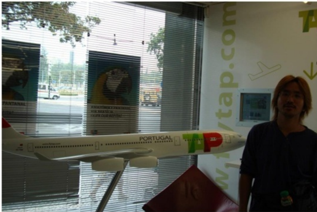
空港会社のオフィス。スペインまでの航空券を予約。