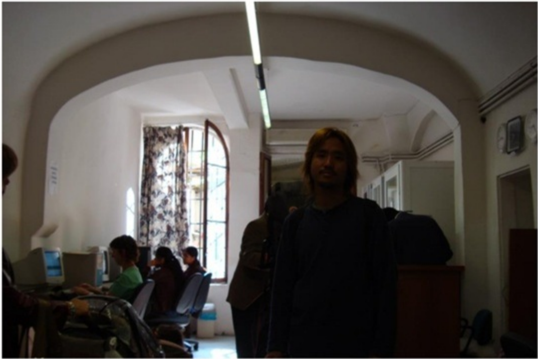
フィレンツェのホテル前にあったインターネットカフェ。