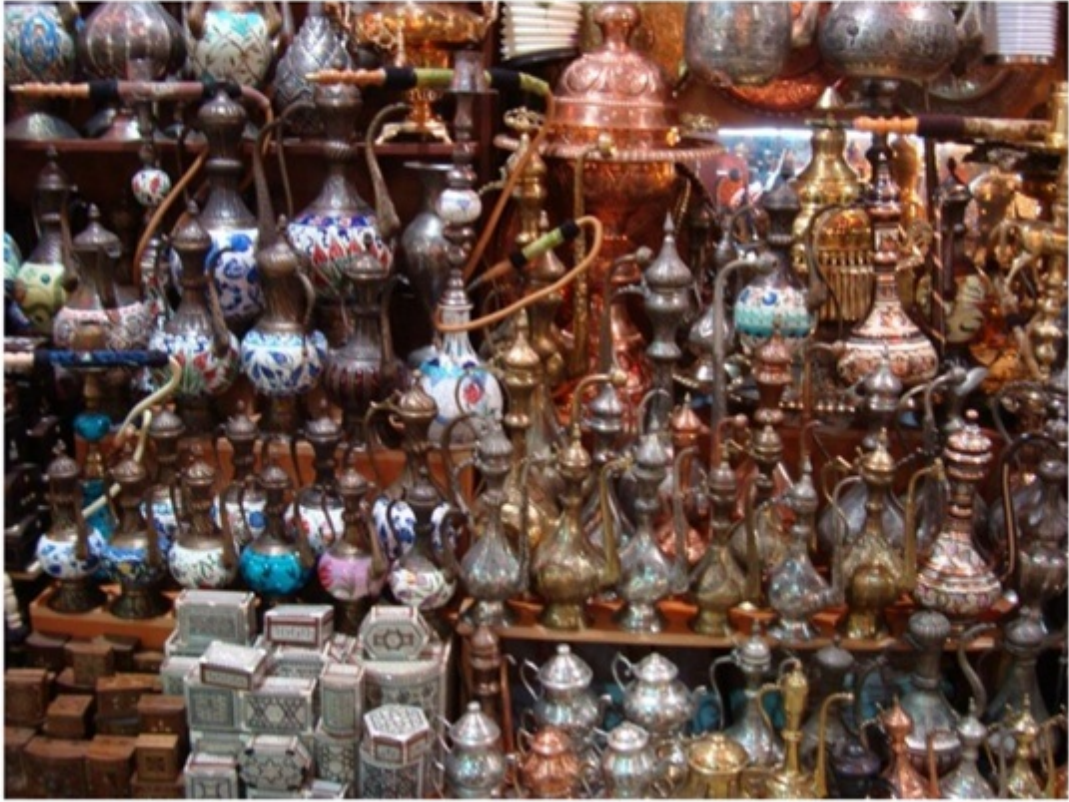
グランドバサール。楽しそうなものがいっぱい。