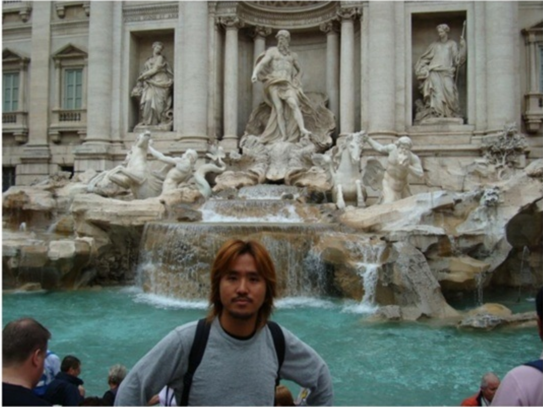
トレヴィの泉。コインを投げ入れると願いが叶う。