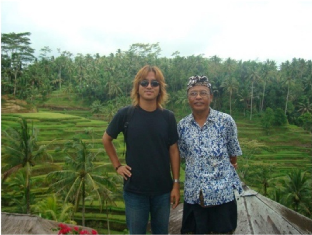
日本語を話せる現地ガイド。