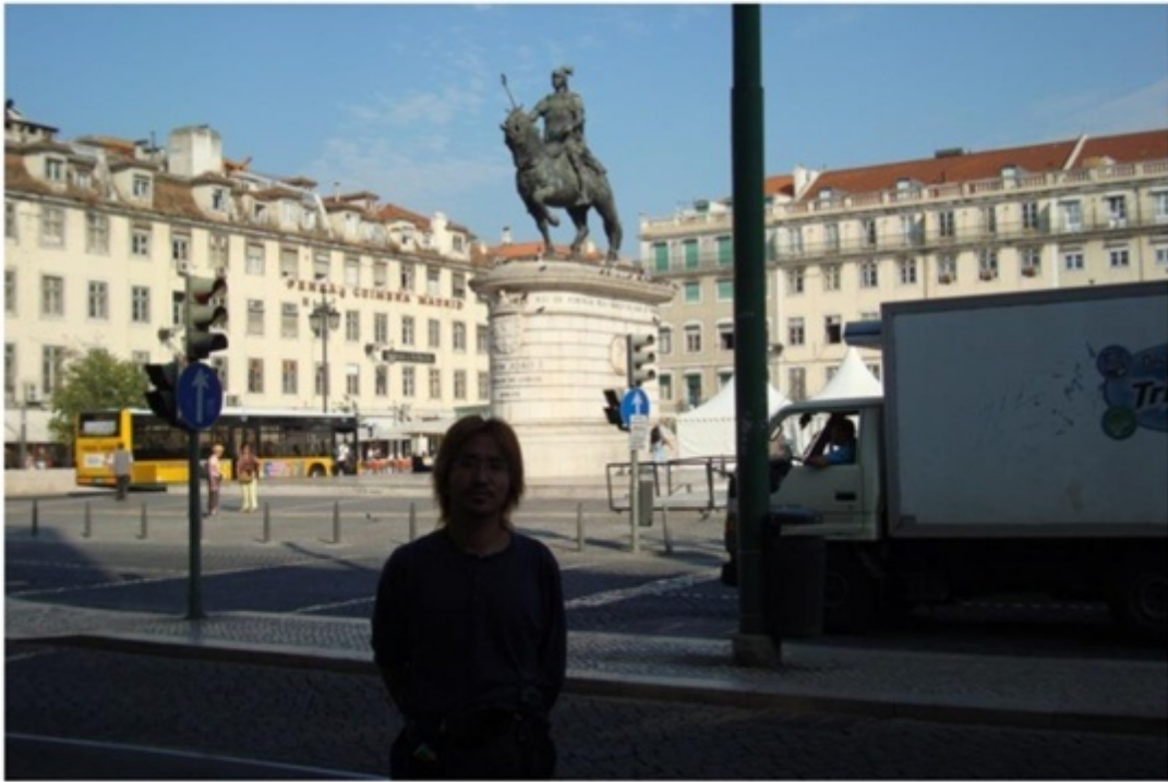
リスボンにある広場。