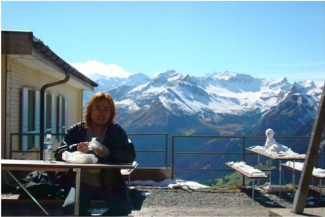
山頂で、手作りのおにぎり弁当。激ウマ。