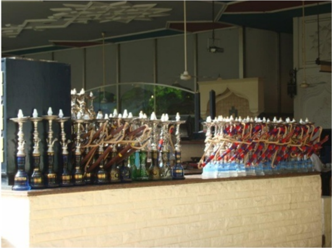
水タバコ（シーシャ）。