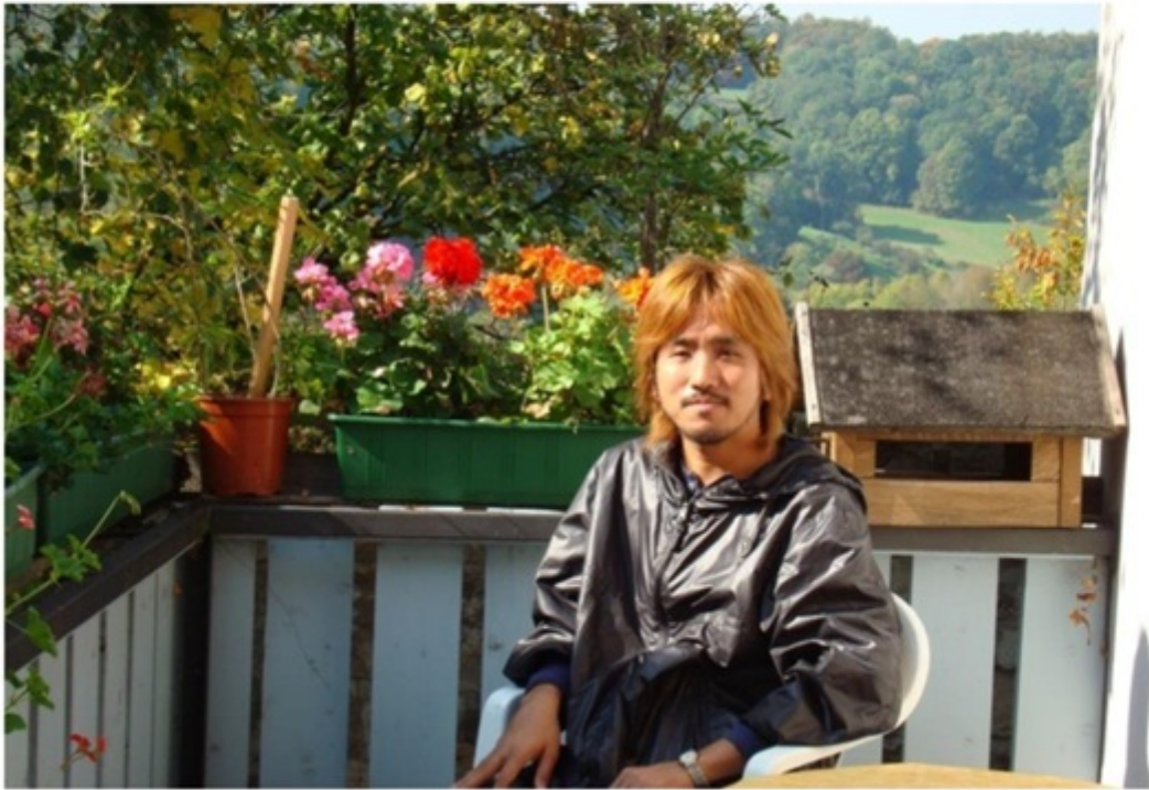
ホテルのベランダ。