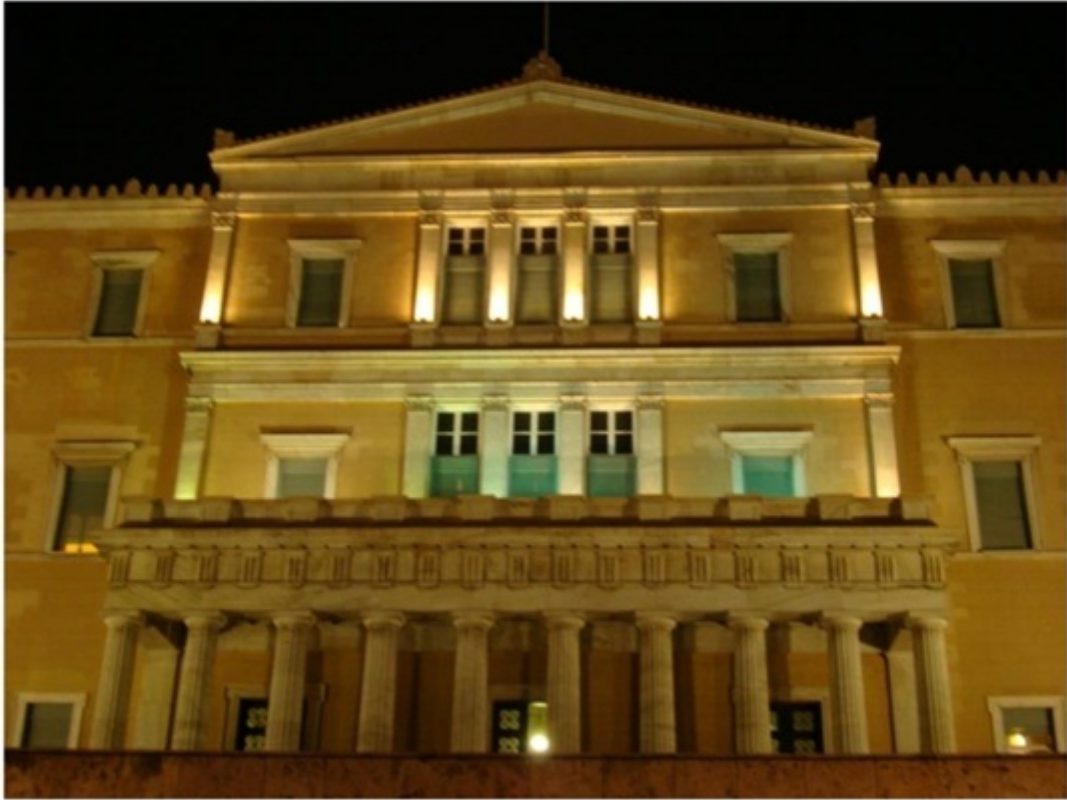
国会議事堂。衛兵交代式も見れた。