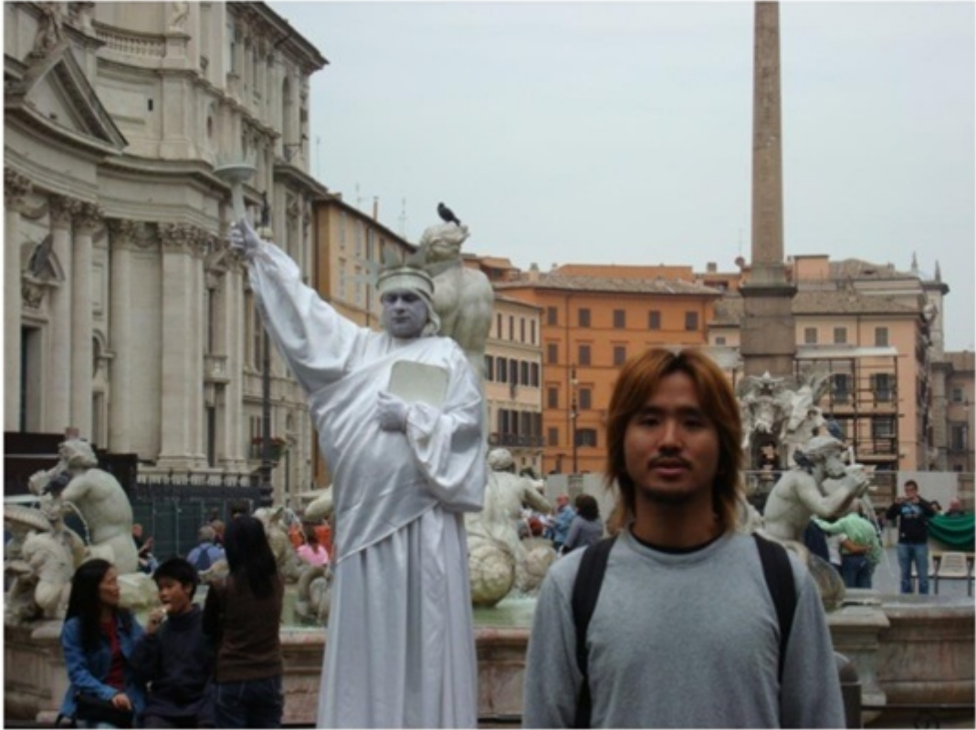
ローマでのストリートパフォーマー。