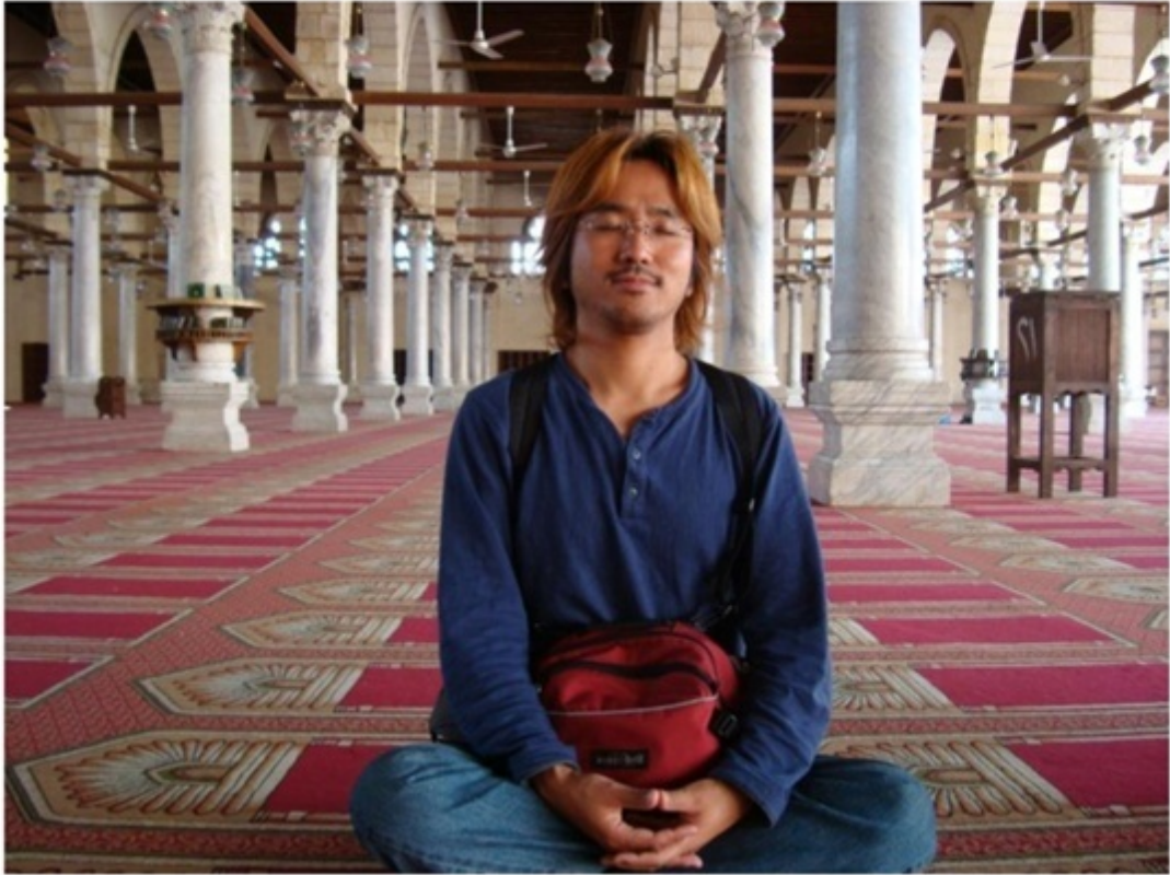
オールドカイロ地区にあるアムルのモスク。