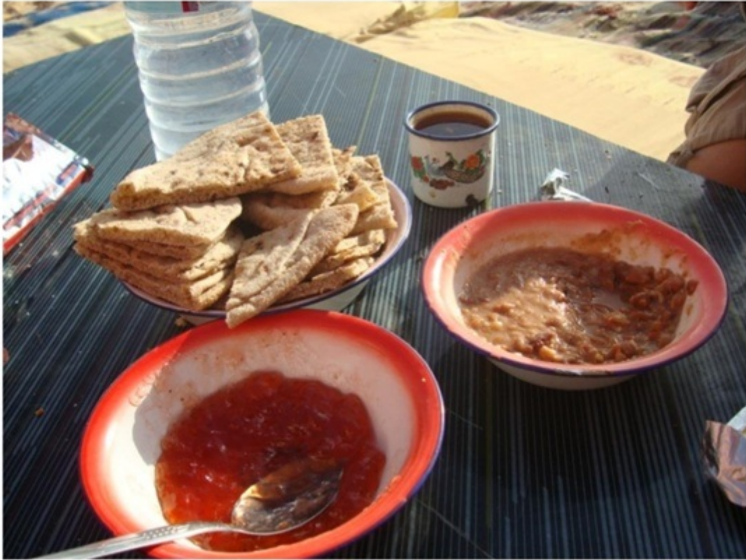
砂漠ツアーの食事。パンは砂まみれ。