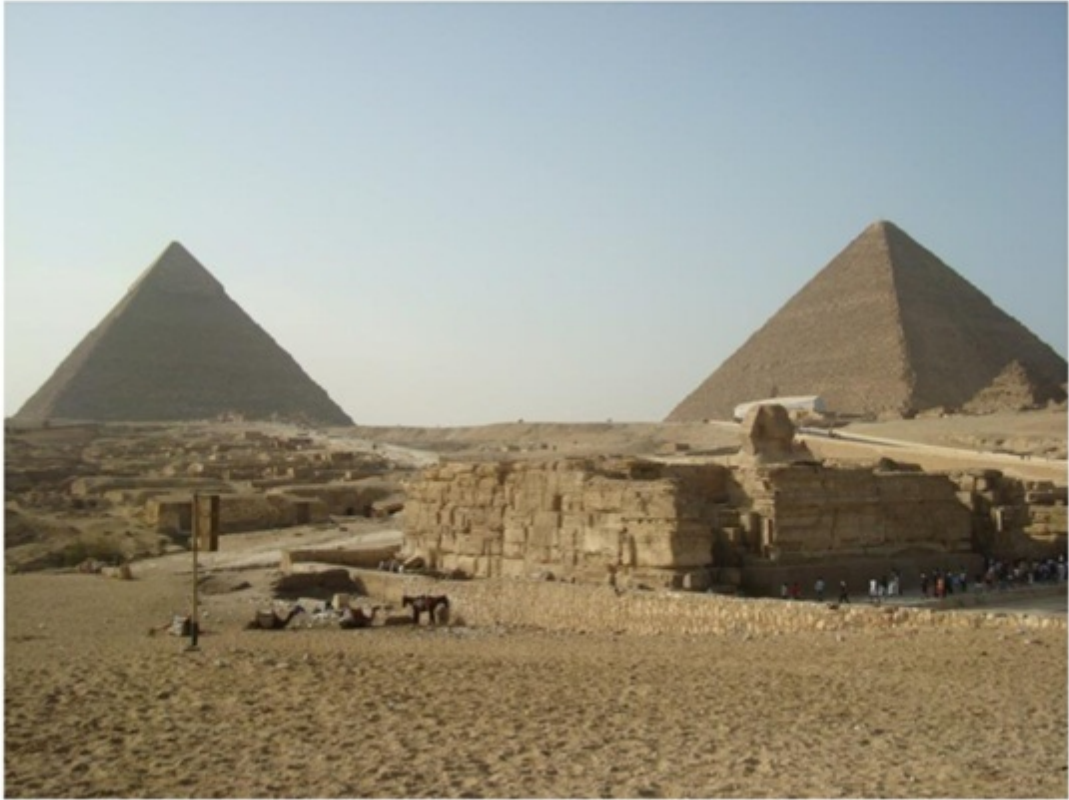
ギザのスフィンクスと三大ピラミッド。