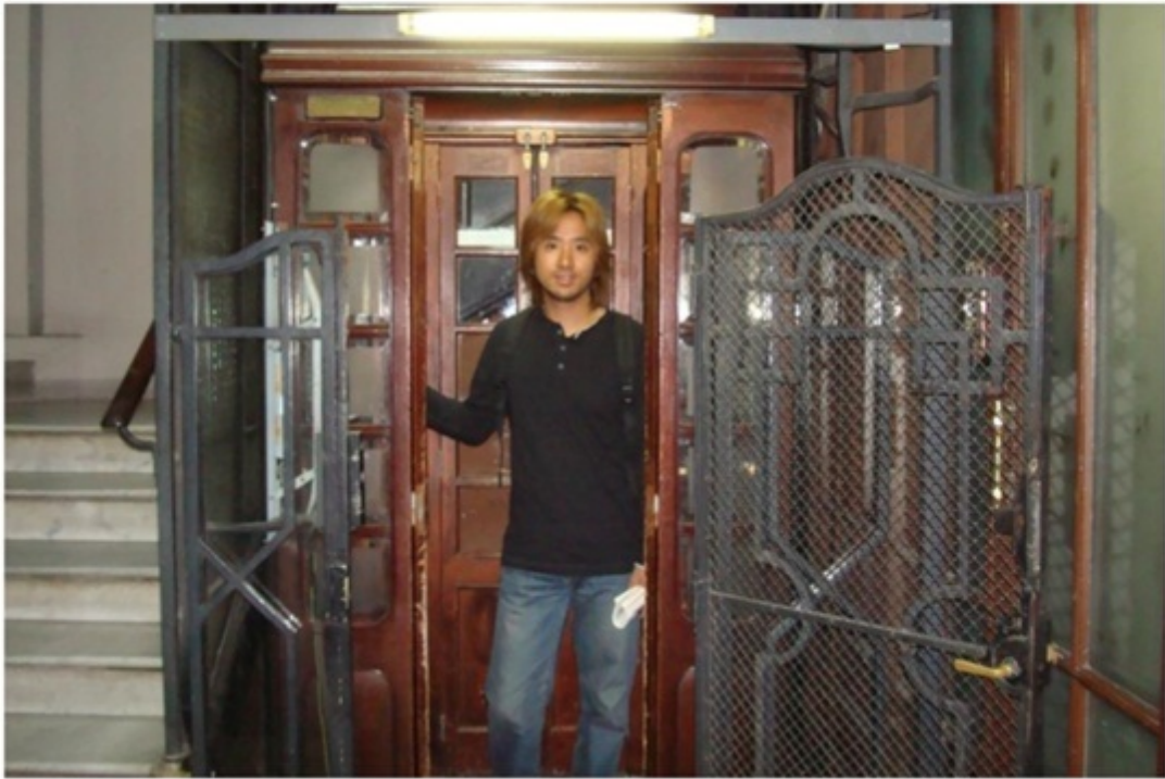
ホテルのエレベーター。かなり古くて、スリル感あり。