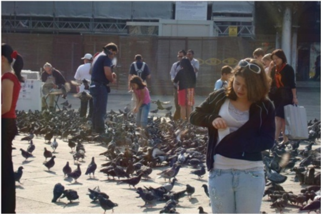
サンマルコ広場。鳩だらけ。