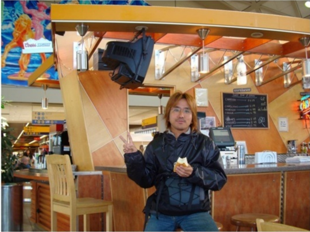
カルガリー空港で朝食。カルガリーからトロントへ。