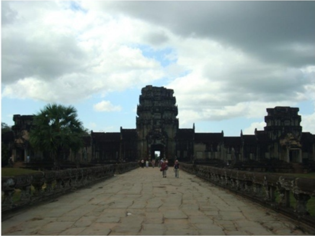
アンコールワットの西大門。