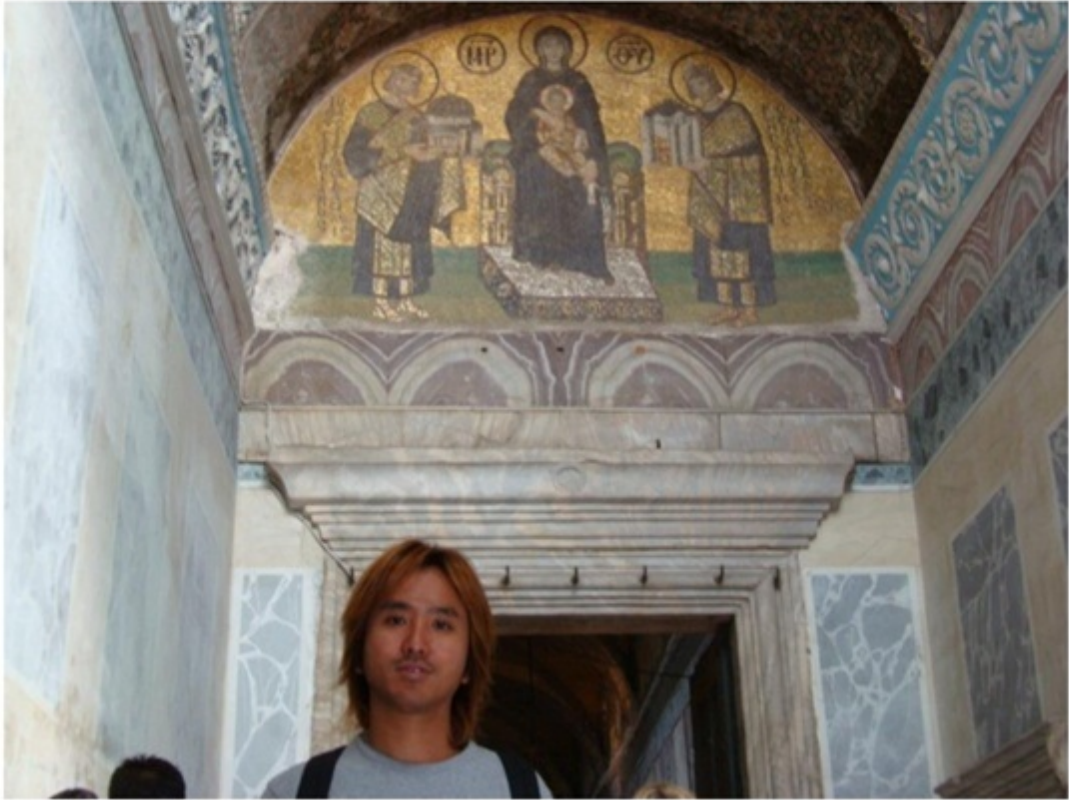
ビザンティン教会。