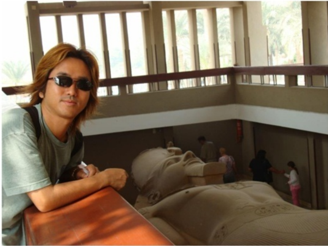
ラムセス2世の像。15メートルもある。