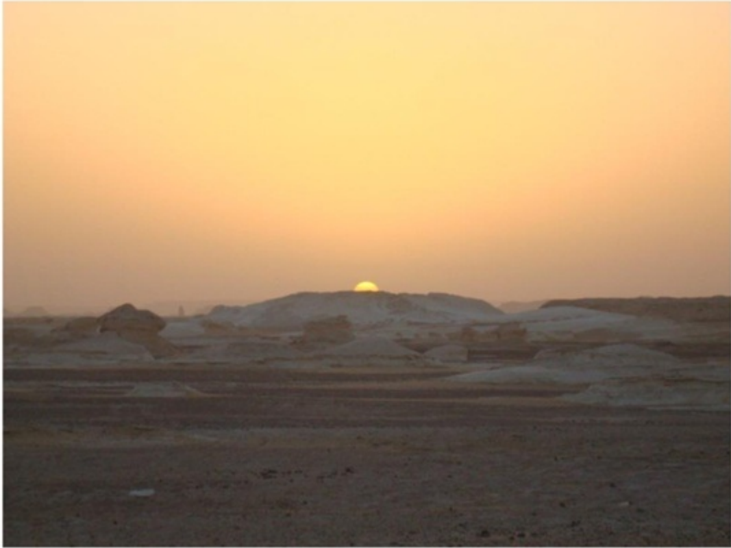
砂漠ツアーで見た日没。