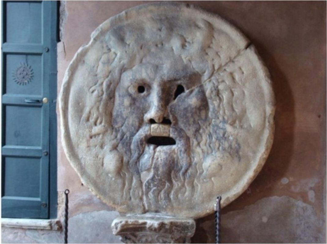
真実の口。ローマの休日で有名。