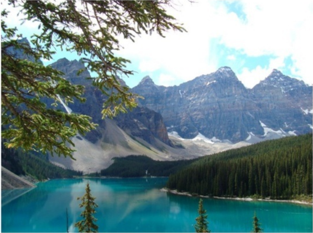
エメラルドレイク。合成写真のようにキレイ。