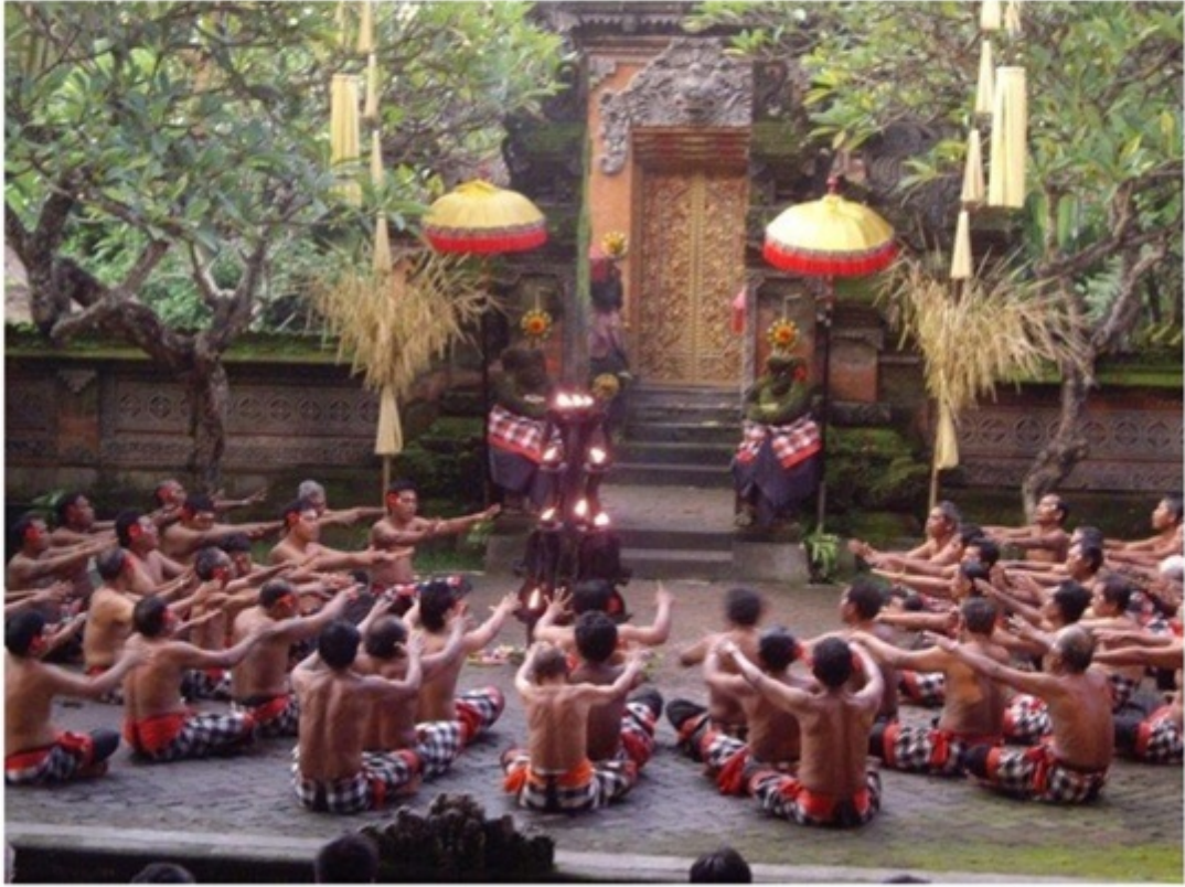
ケチャックダンス。