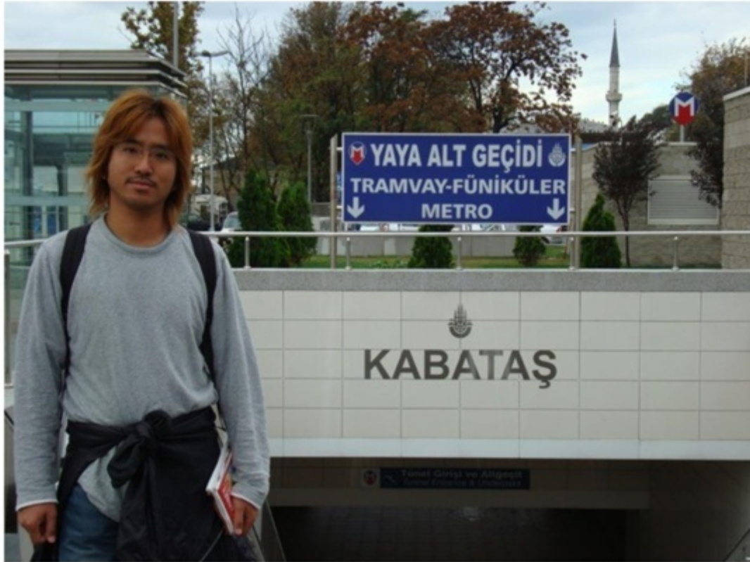
イスタンブールの地下鉄。