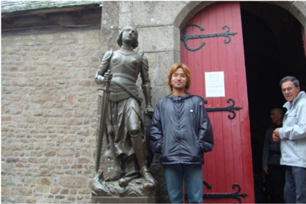
モンサンミッシェル内のジャンヌダルク。