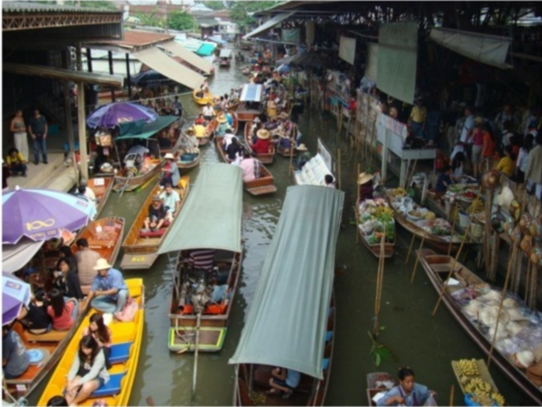
水上マーケット。観光客で渋滞。