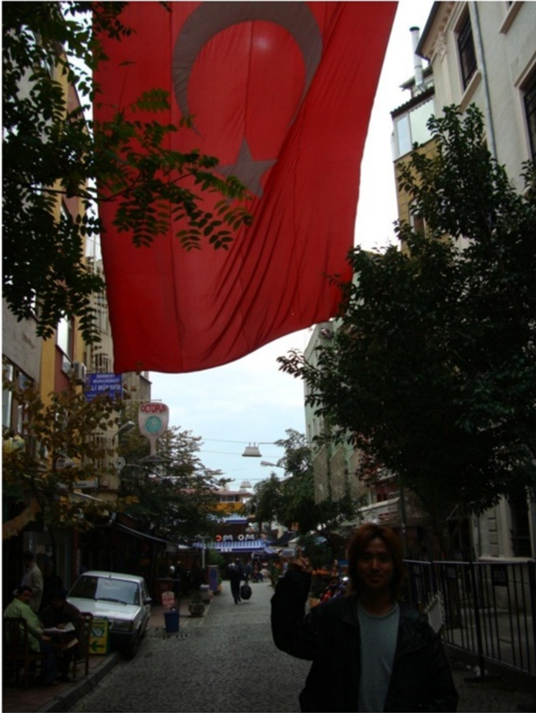
2007.10.22 Istanbul, Turkey