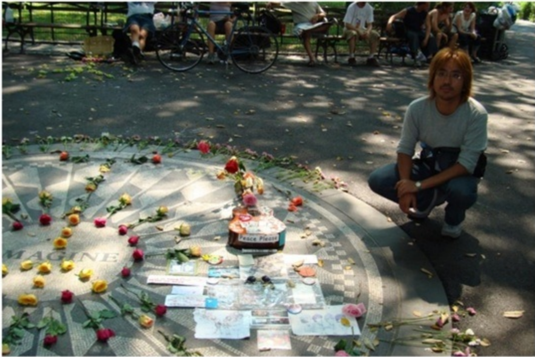
ストロベリーフィールド。ジョンレノンっぱい人が多い。