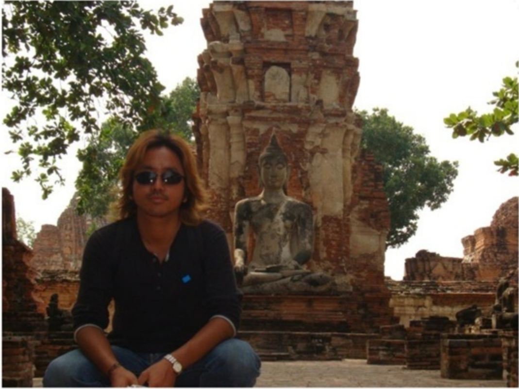
ワット・ラーチャ・ブーラナ。