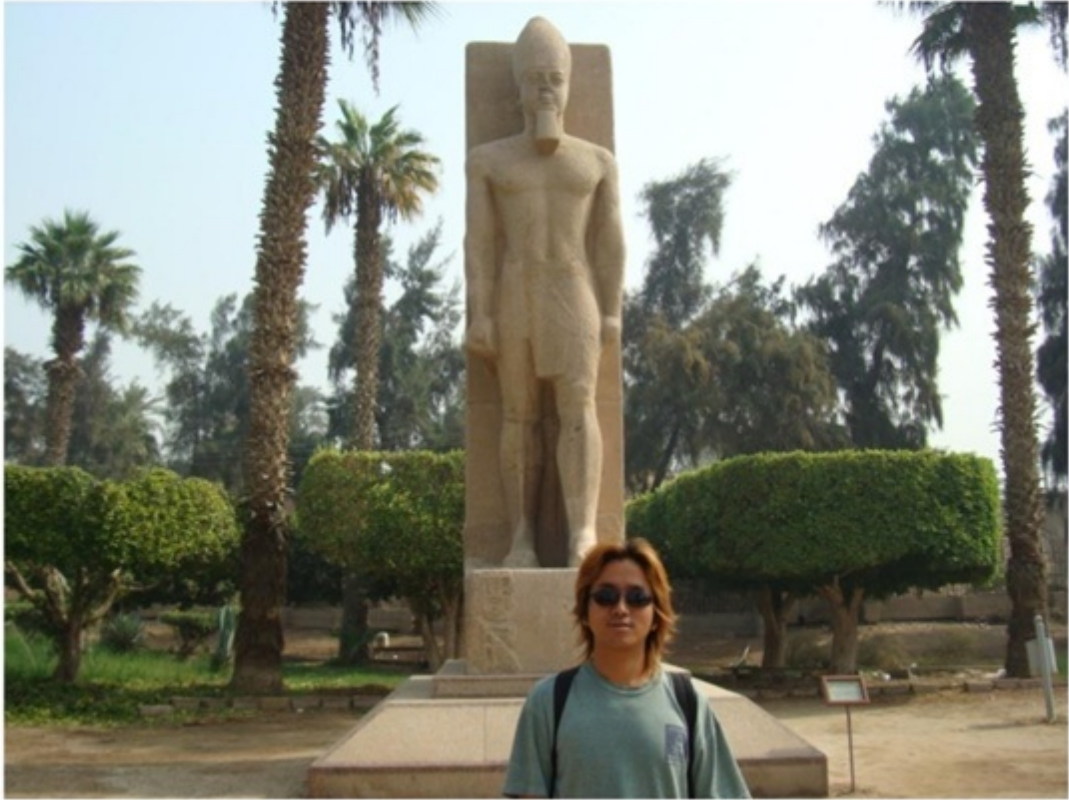
メンフィスの遺跡。