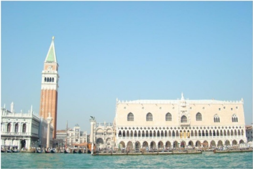
水上バスからの街並み。