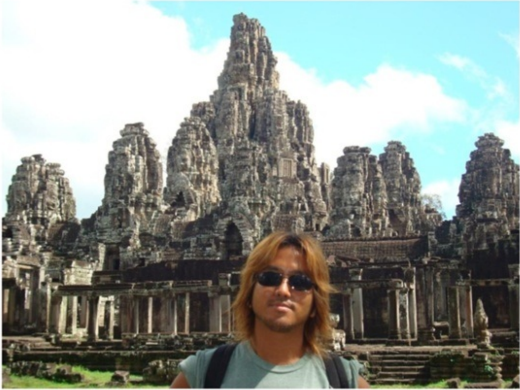
アンコール・トム。アンコール遺跡の一つ。