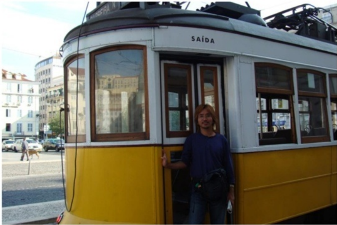
リスボンのアンティークな路面電車。石畳の道路。