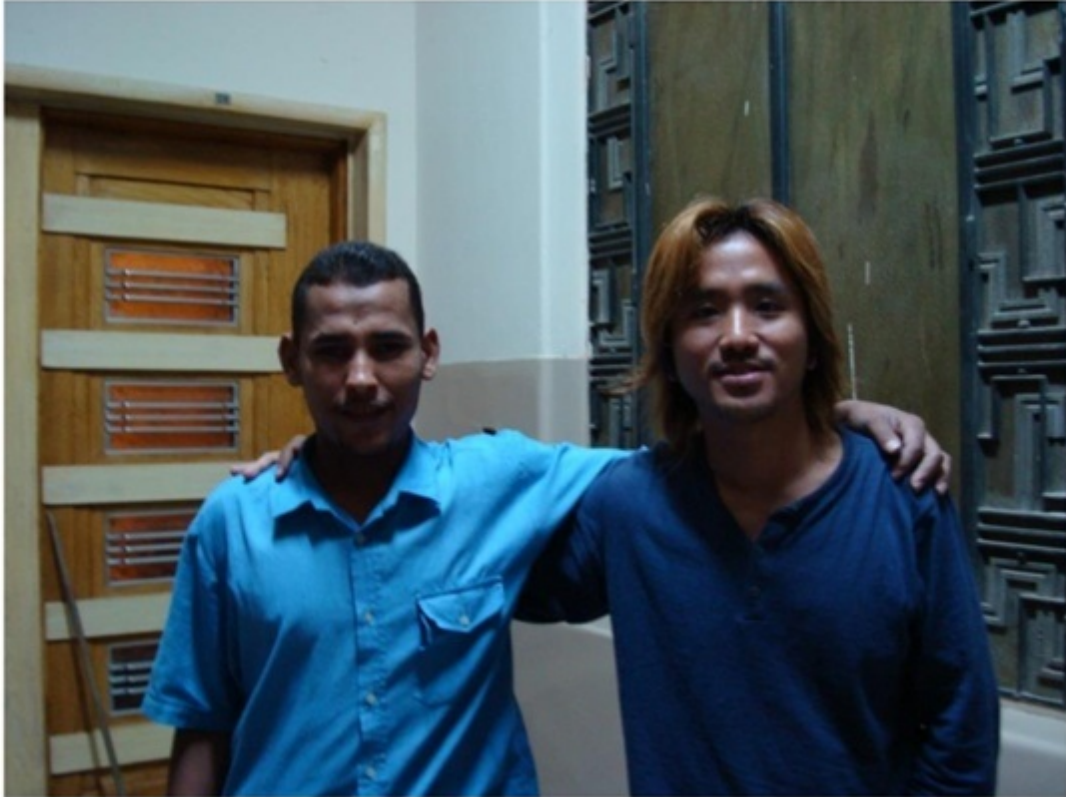
タハリール広場沿いにあるバックパッカー宿。