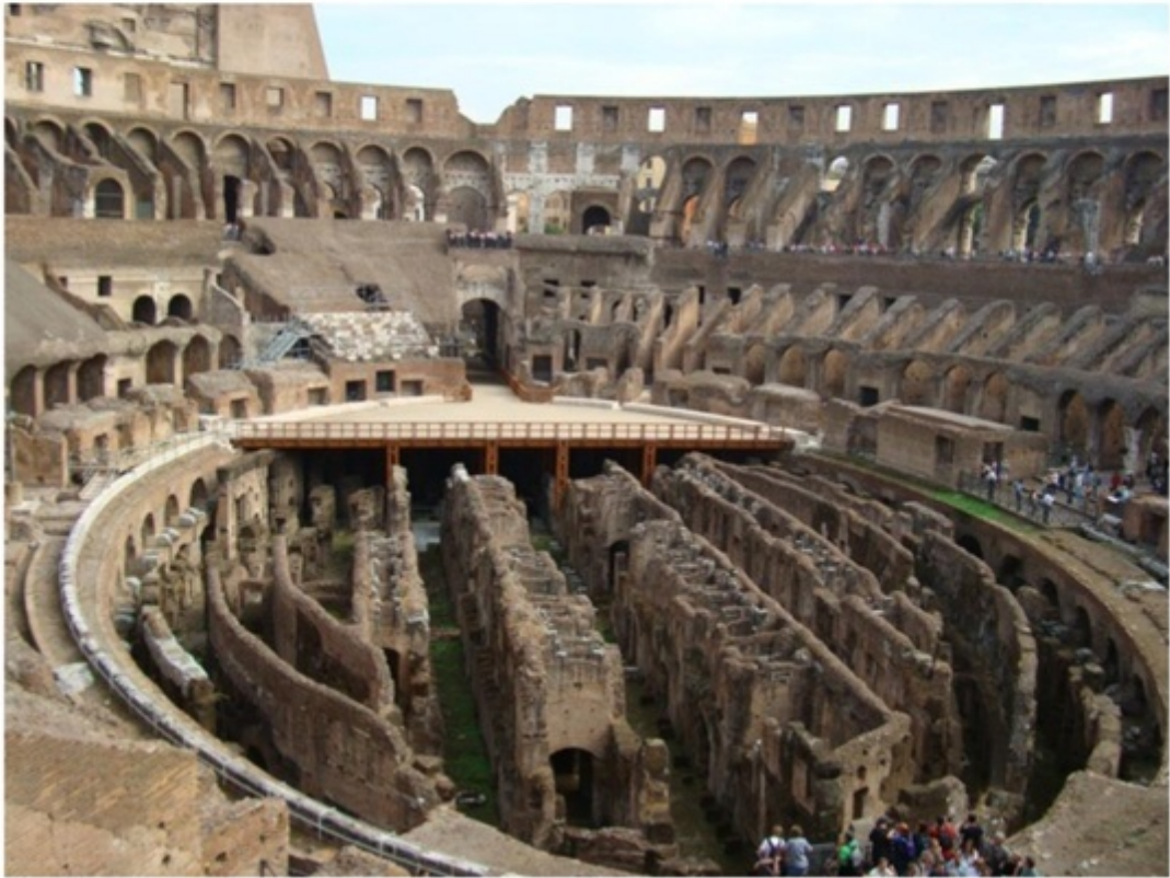
コロッセオの内部。