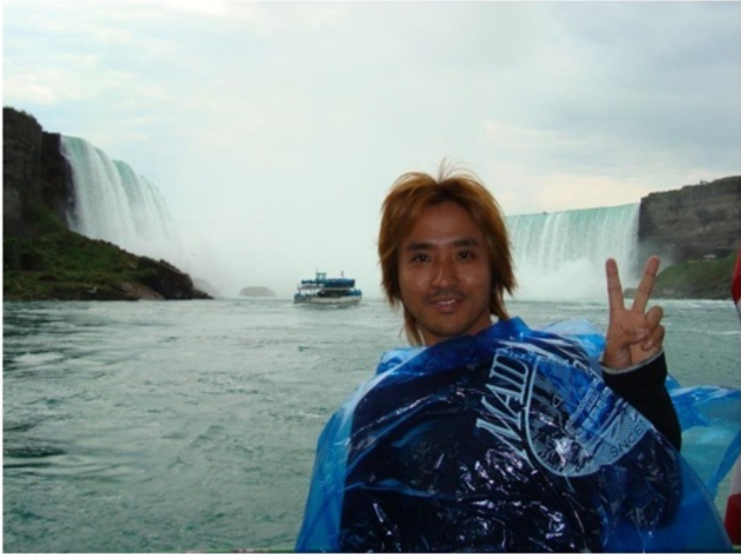
ナイアガラの滝つぼ近くまで船で接近。