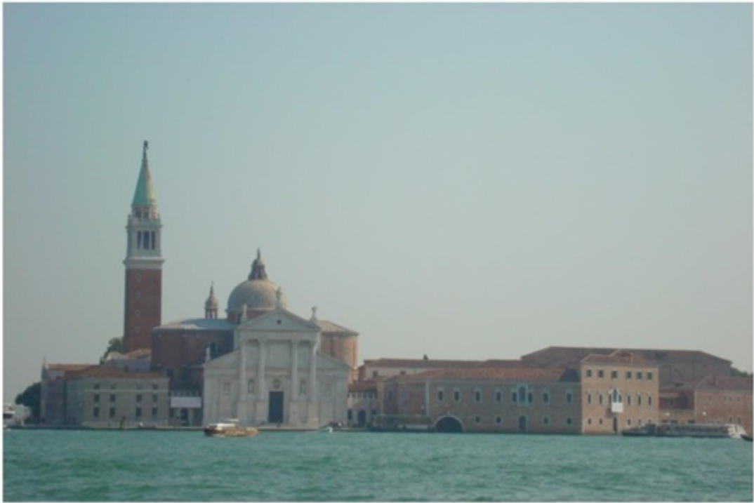
水上バスからの街並み。