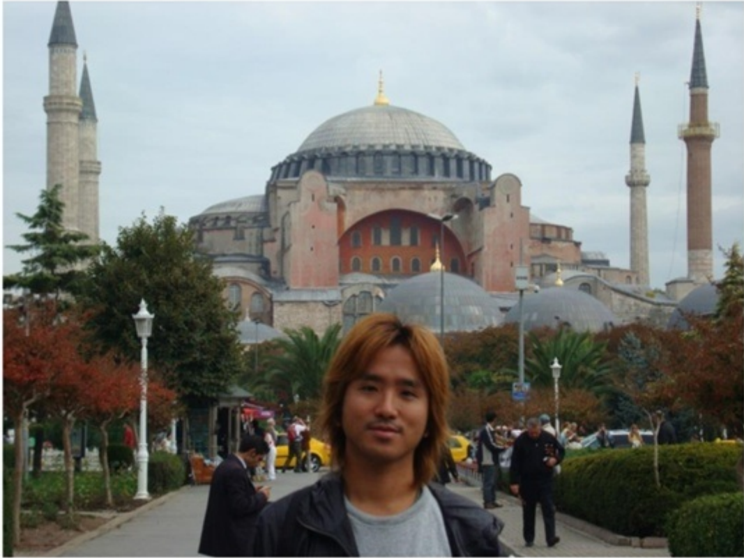
世界遺産のアヤソフィア。