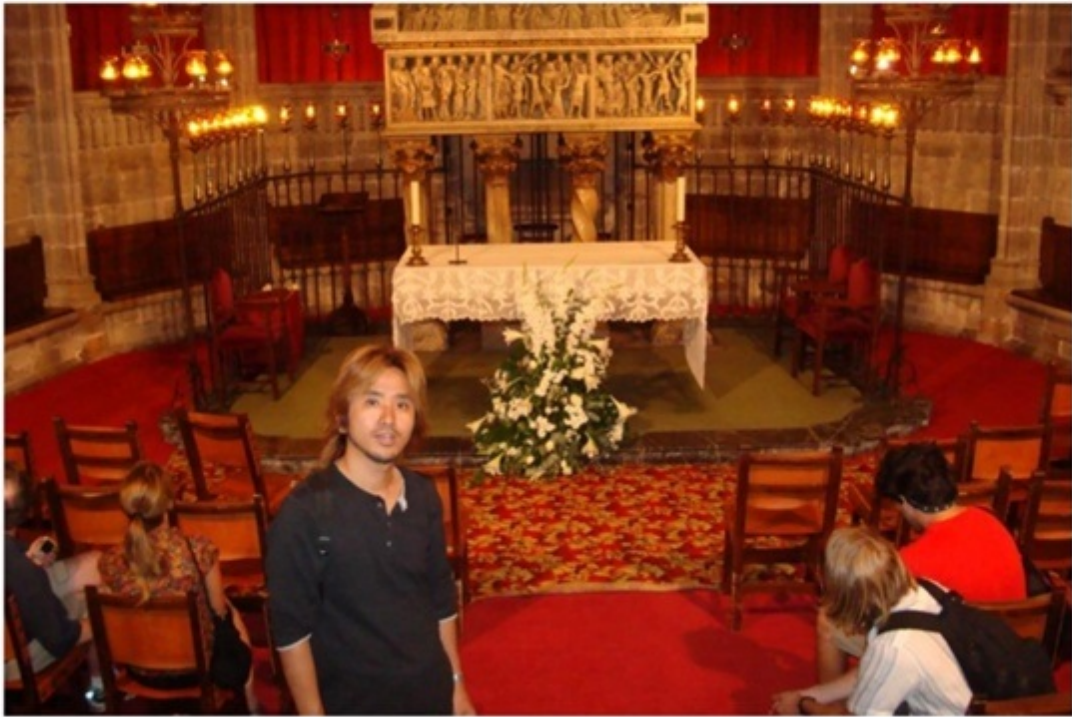
カテドラル（大聖堂）。