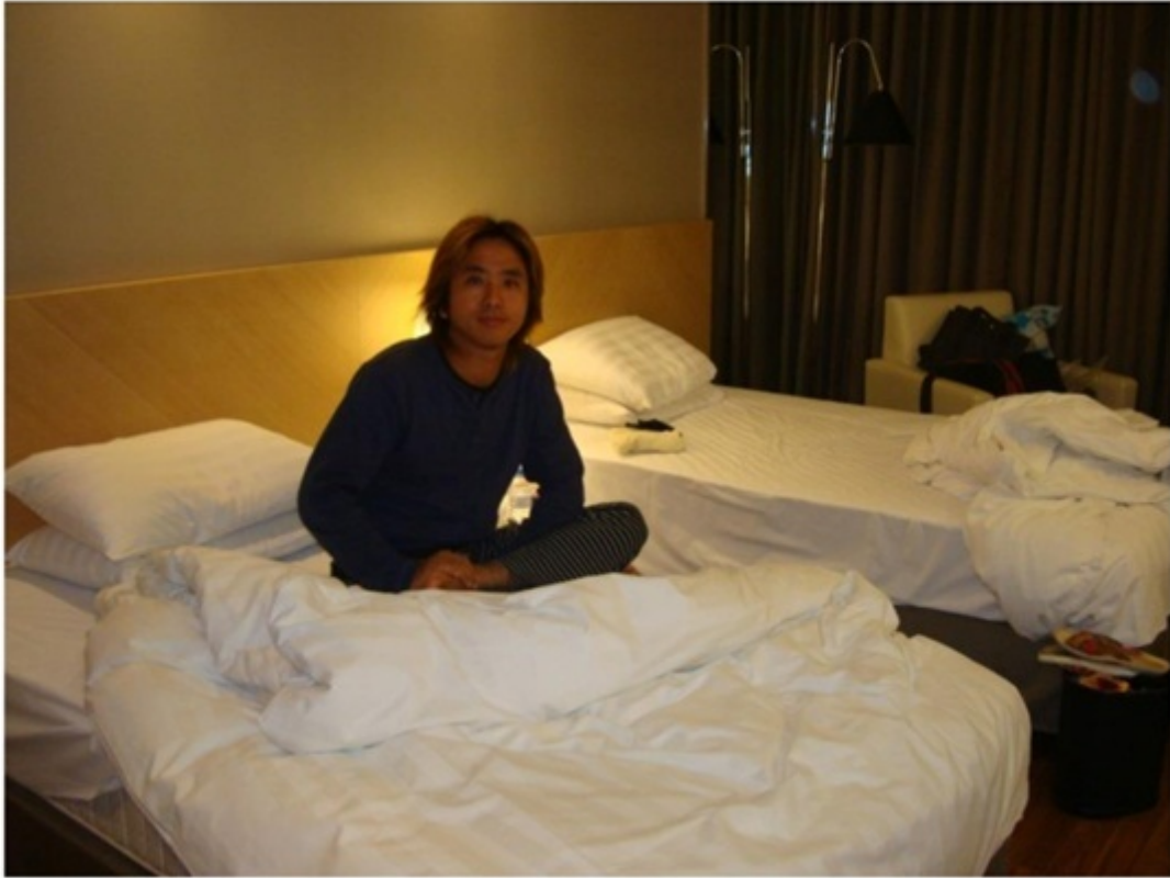
高級ホテル（ツインー泊 8,000 円）。最後に奮発。