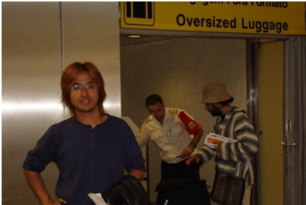
ポルトガルの空港。荷物がオーバーサイズでひっかかる。