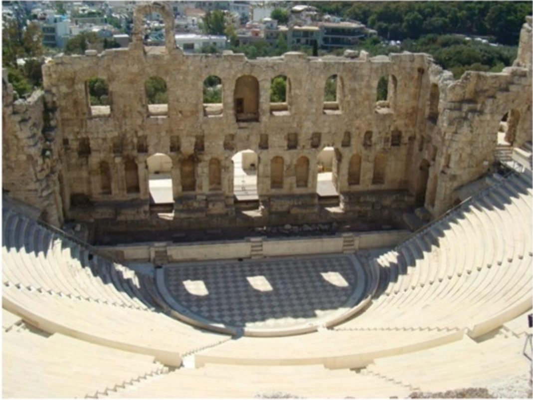
イロドアティコス音楽堂。