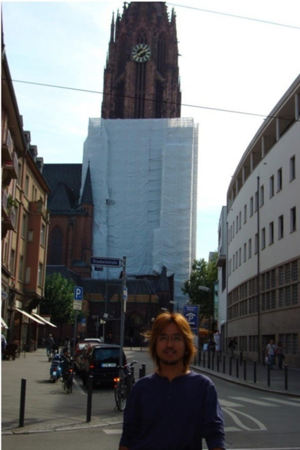
ドイツのフランクフルト。