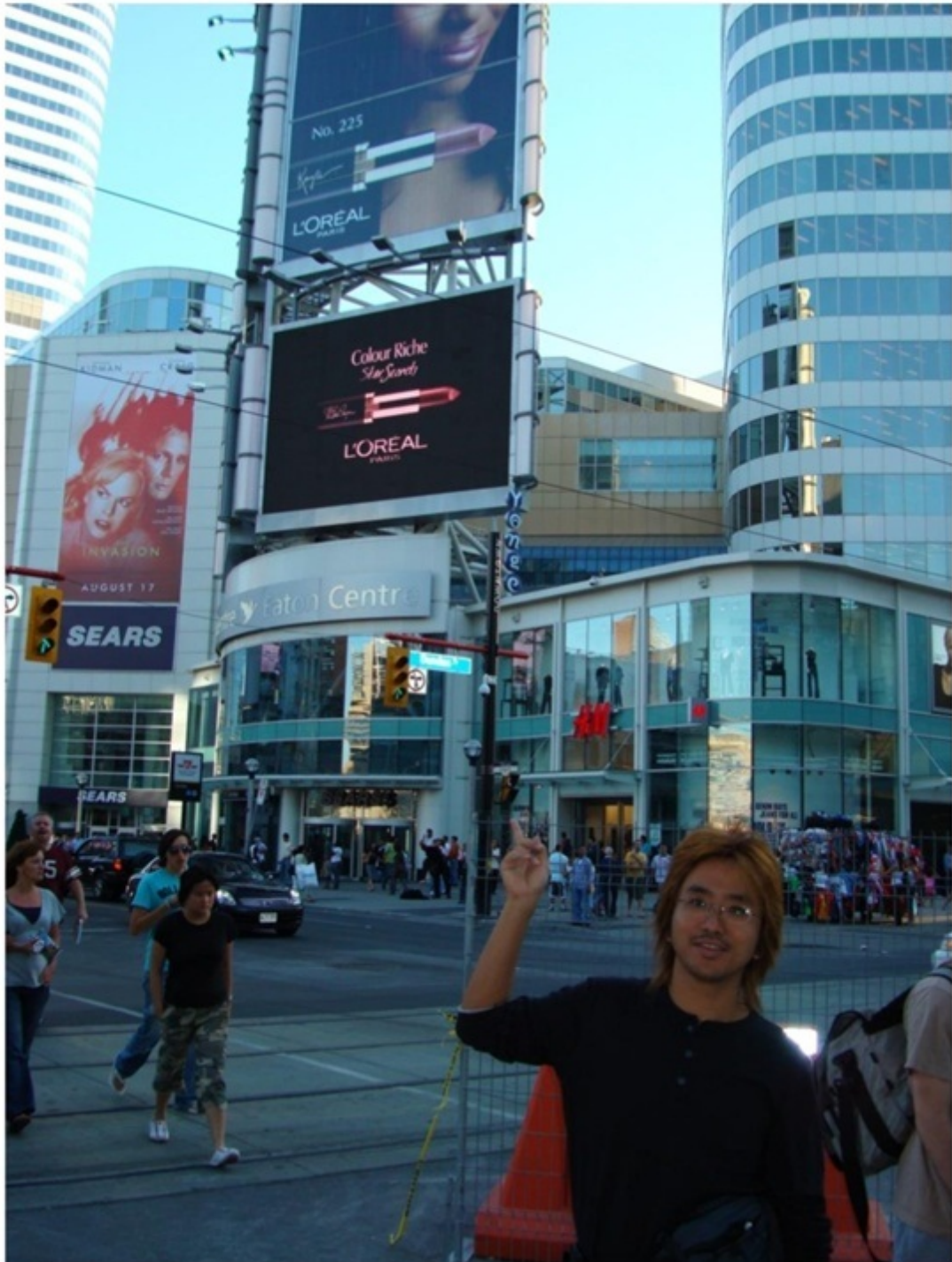
トロントのメインストリート。