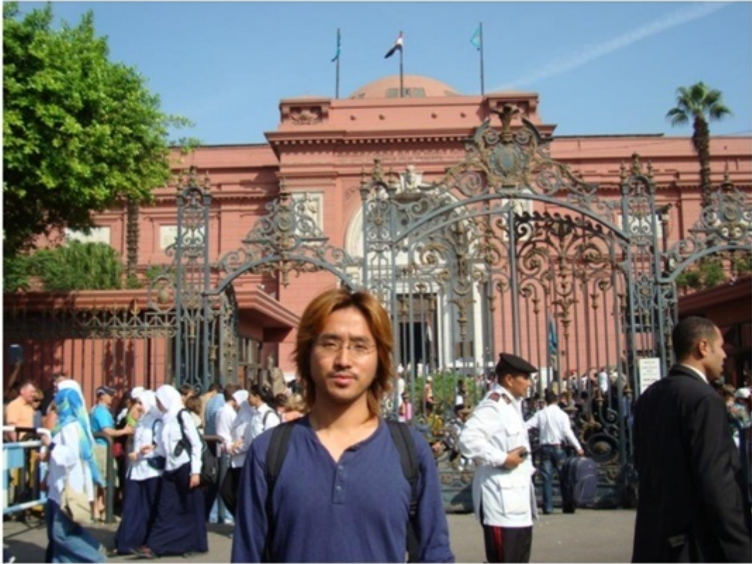
エジプト考古学博物館。ツタンカーメンの黄金のマスク。