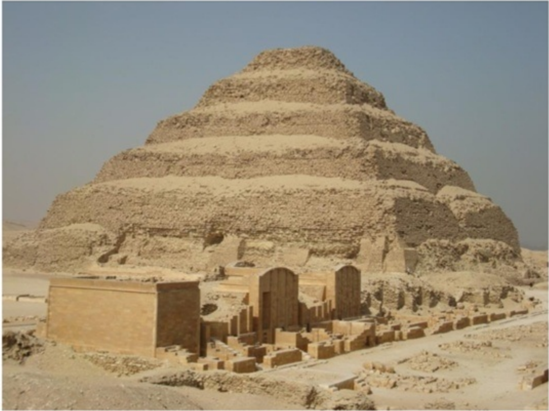
ジェセルの階段ピラミッド。