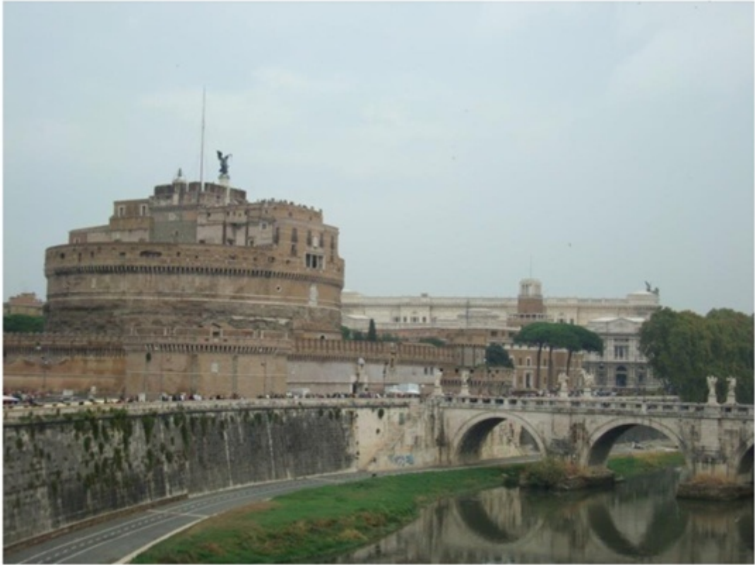
バスから見たサントンジェロ城。