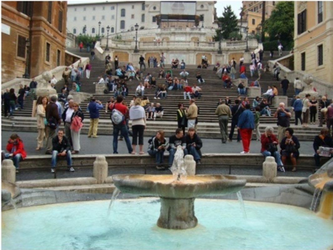
スペイン広場。テレビでもよくみる場所。