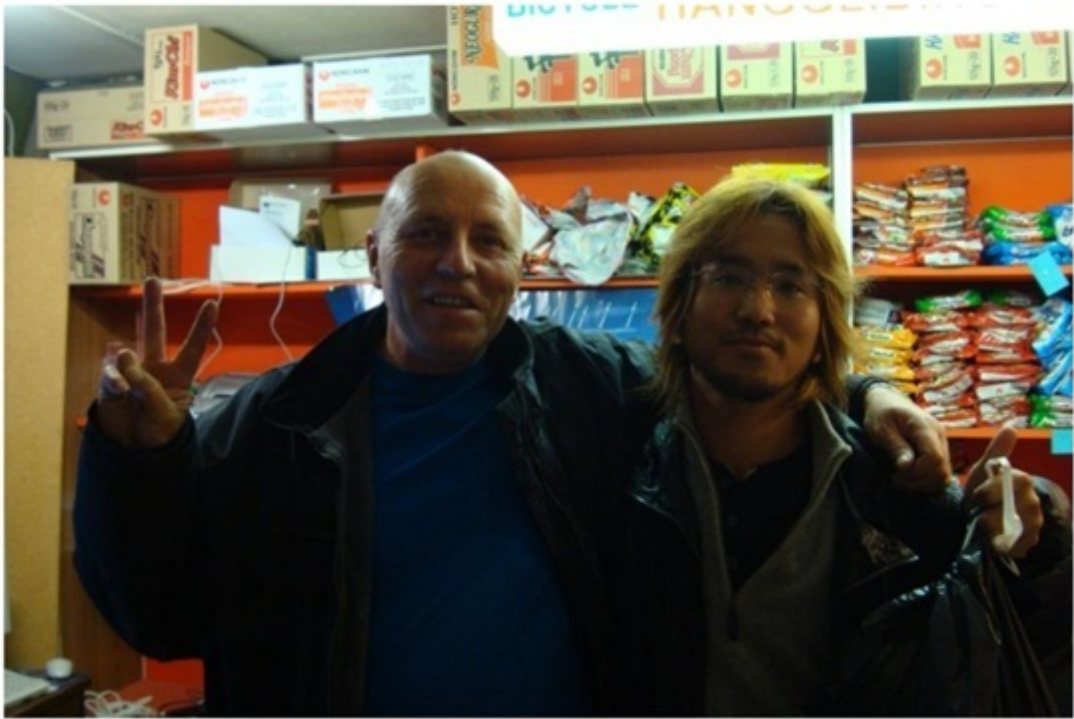
コインランドリーのマスター。