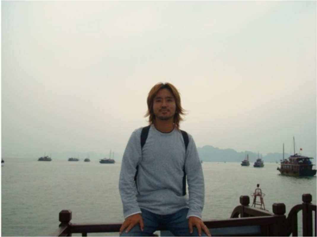
ハロン湾クルーズの船上にて撮影。