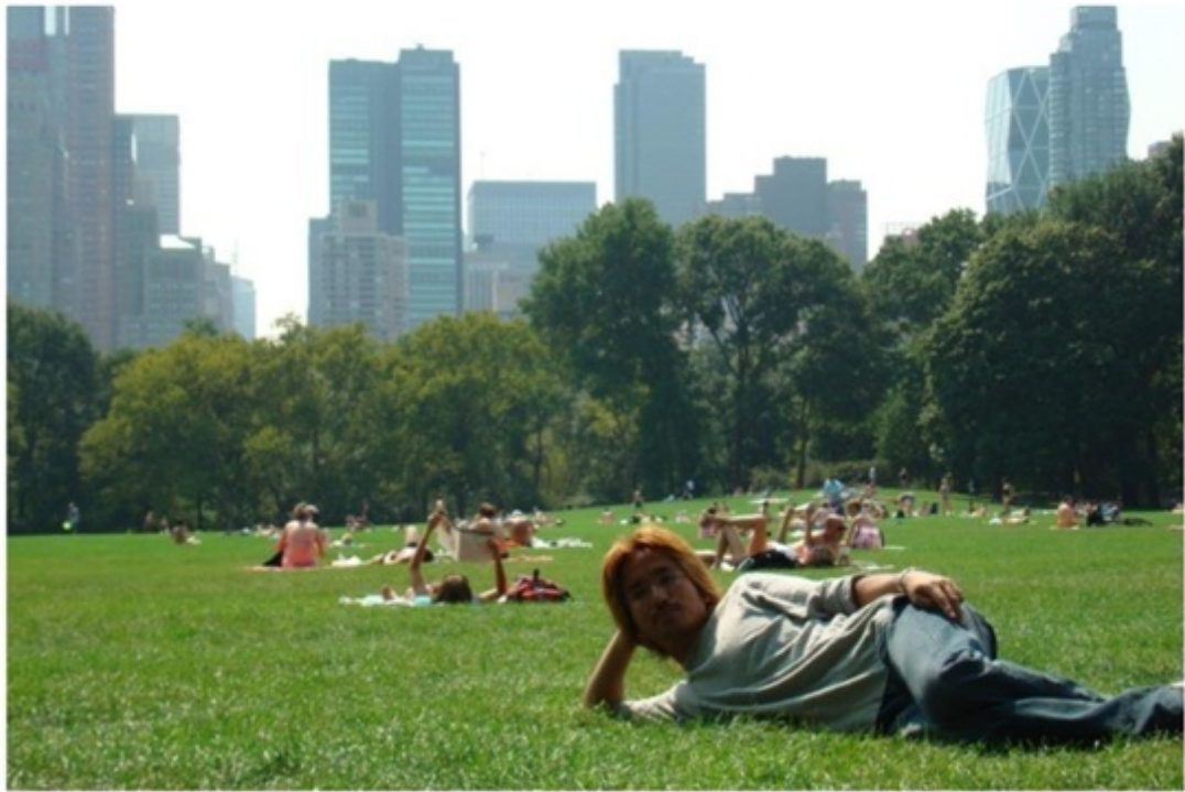
セントラルパーク。市民の憩いの場。