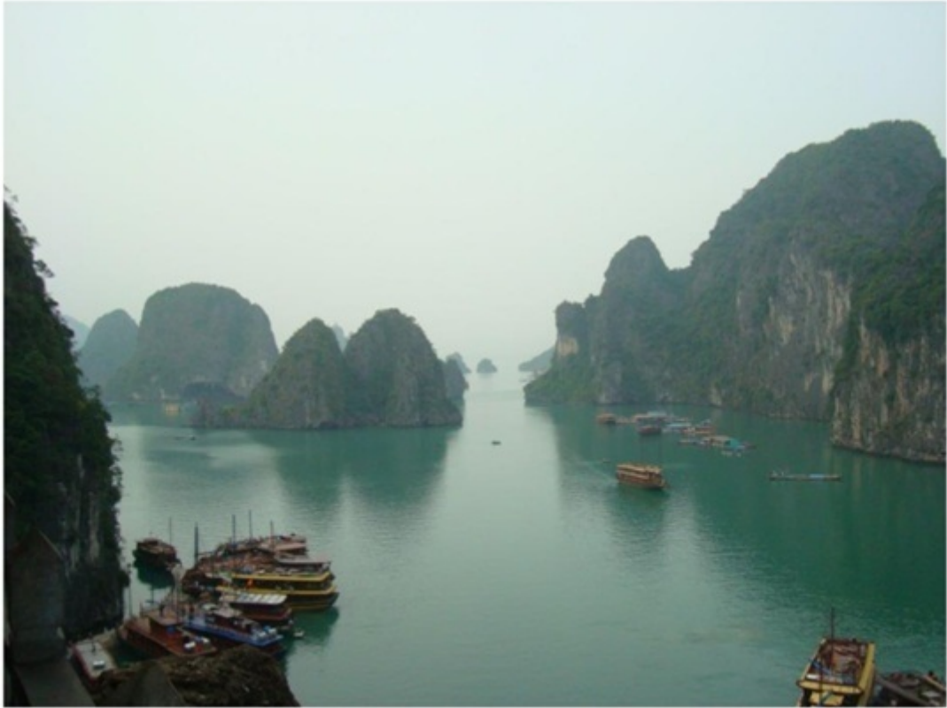
ハロン湾でよく紹介される光景。