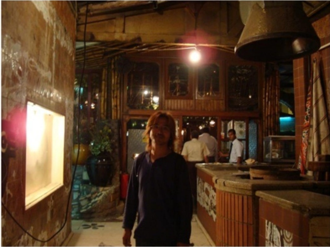
タハリール広場近くの中級レストラン。