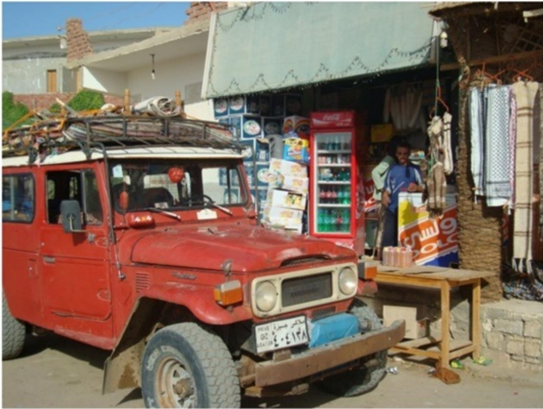
砂漠ツアーに参加。