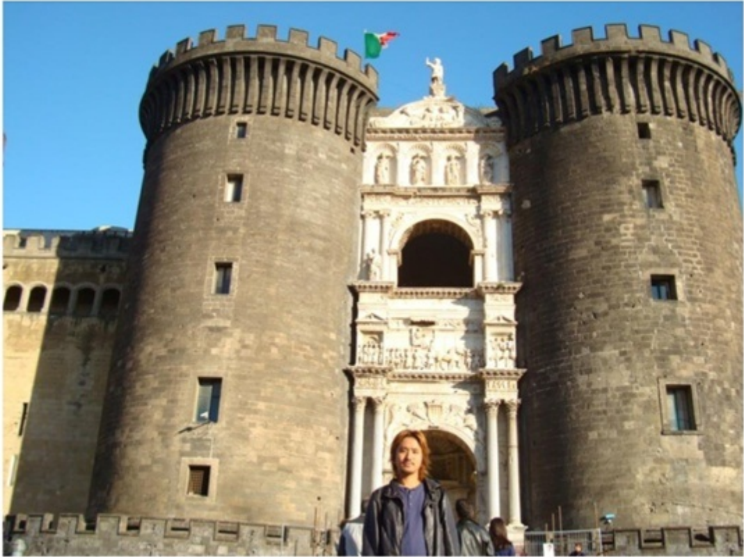
ナポリにある世界遺産のヌオヴォ城。