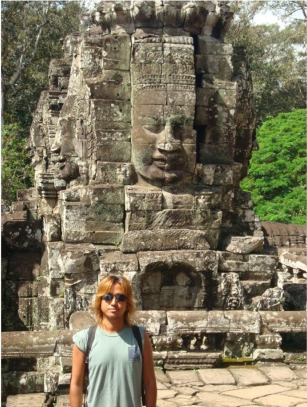
2007.11.14 Siem Reap, Cambodia