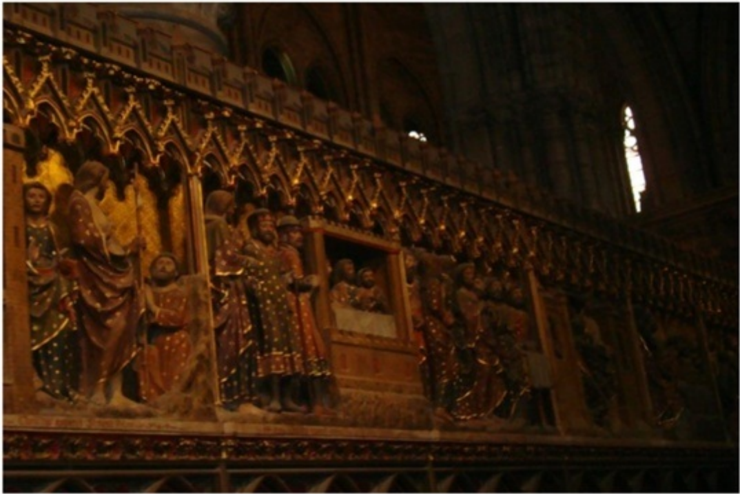
ノートルダム大聖堂。