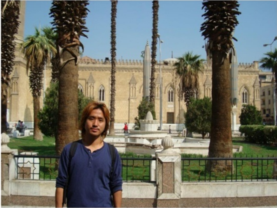
ハン・ハリール市場の前にあるモスク。