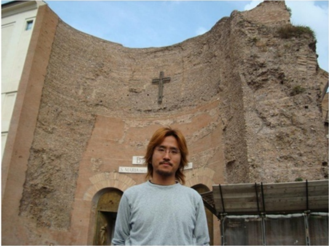
オープンバスで市内観光。