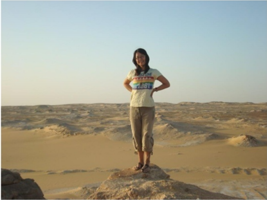
砂漠ツアーに参加していた日本人バックパッカー。