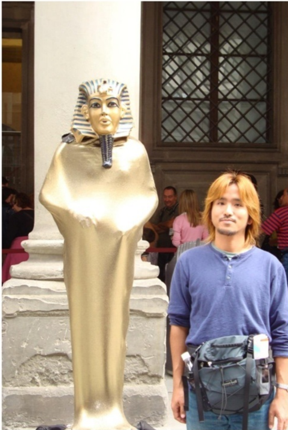
観光客の多いところは、ストリートパフォーマーがいる。