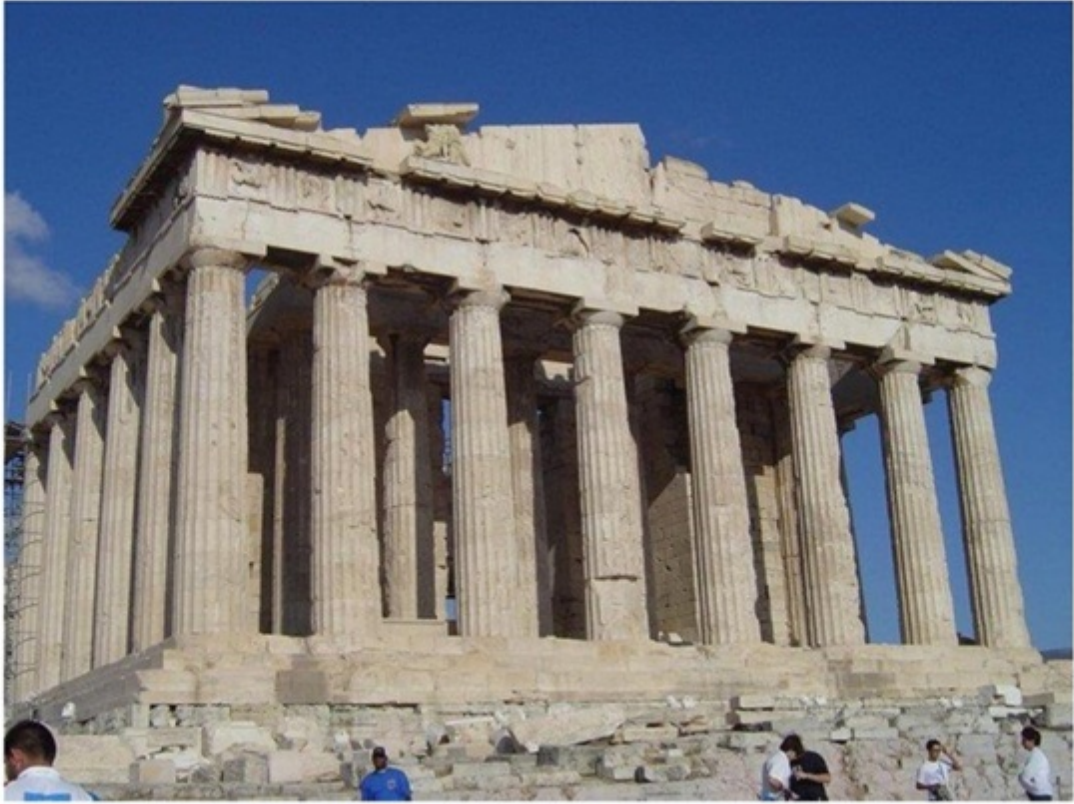
パルテノン神殿。世界史の教科書でよくみていた。