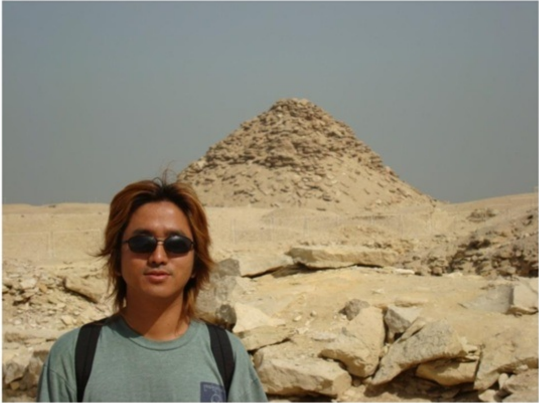
サフラーのピラミッド。