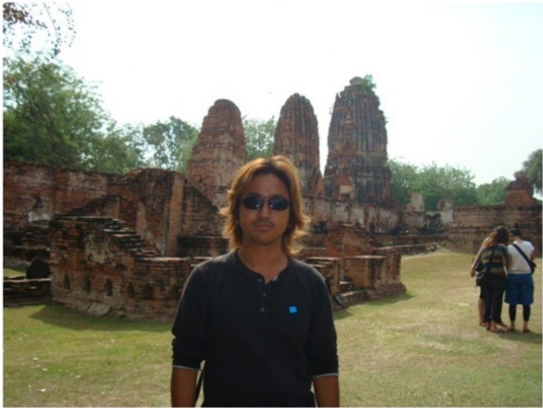
ワット・チャイ・ワッタナーラーム。