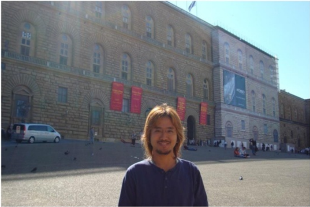
ピッティ宮殿。ルネサンス様式の広大な宮殿。