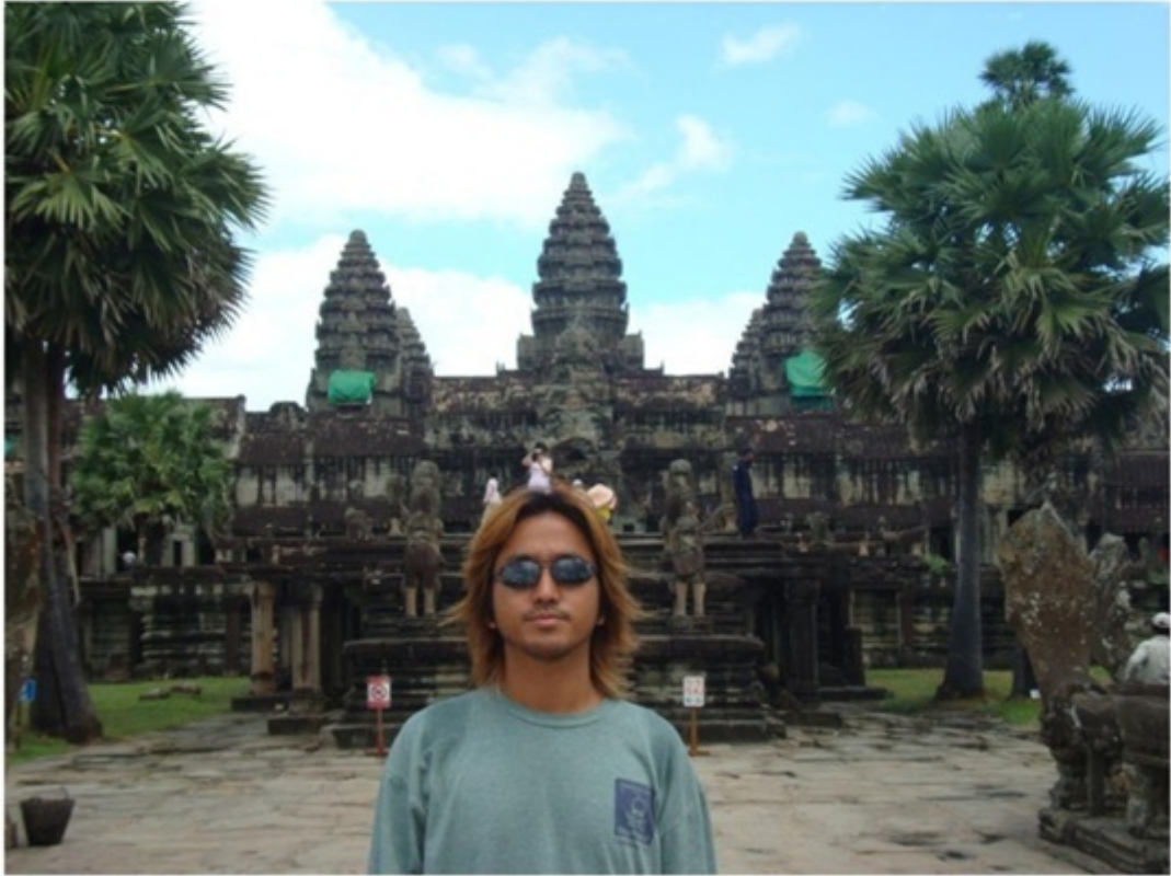
アンコールワットの中央祠堂。