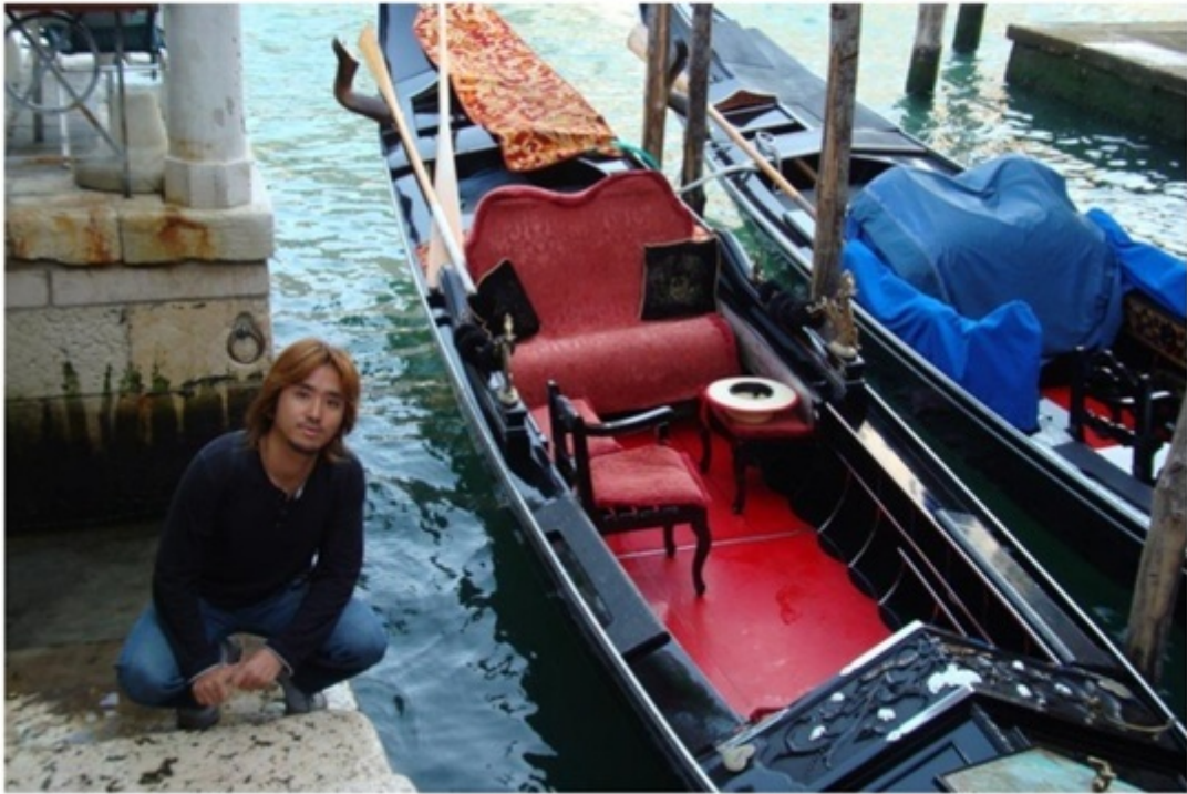
ゴンドラセレナーデ。観光客用に利用されている。