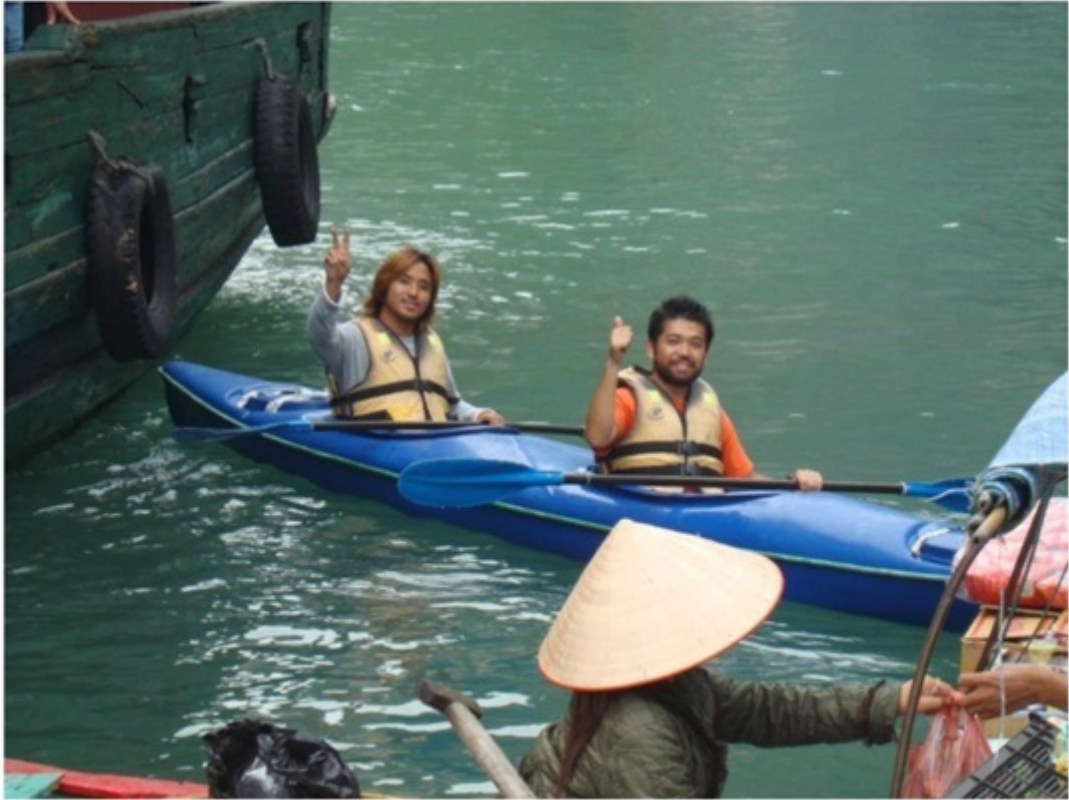
ハロン湾ツアーで知り合った日本人バックパッカー。