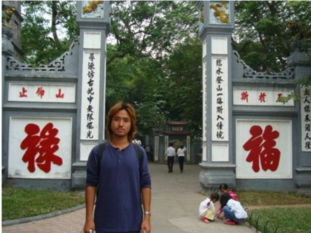
ホアンキエム湖の玉山祠.