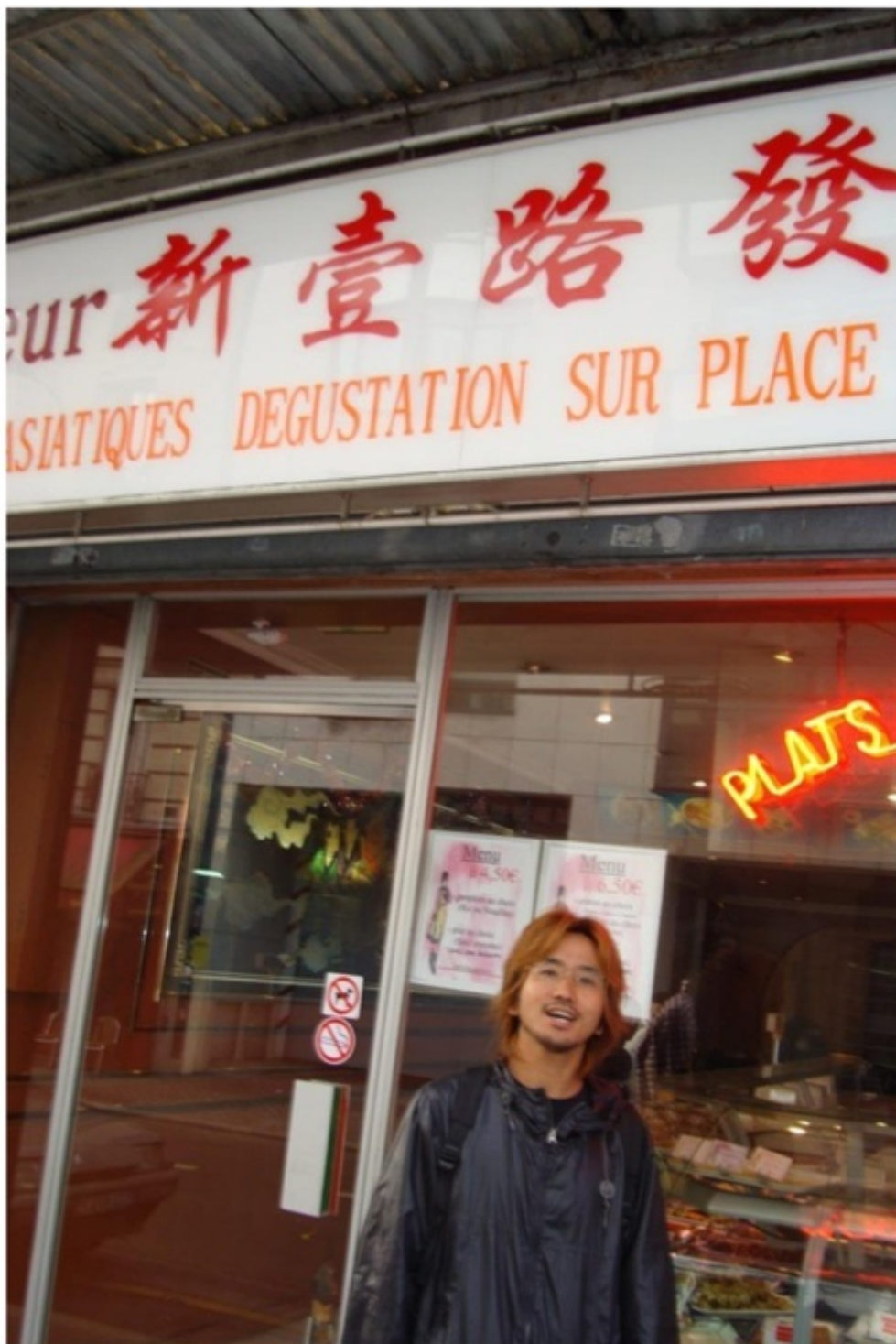
テイクアウトの中華料理。ユーロ高でも格安。