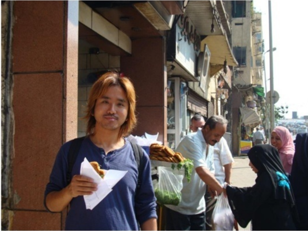
エジプトのカイロ。コロツケのような食べ物。