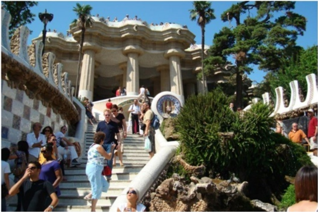
ガウディ作のグエル公園。