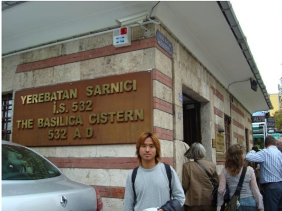
地下宮殿の入口。内部はすごく神秘的。