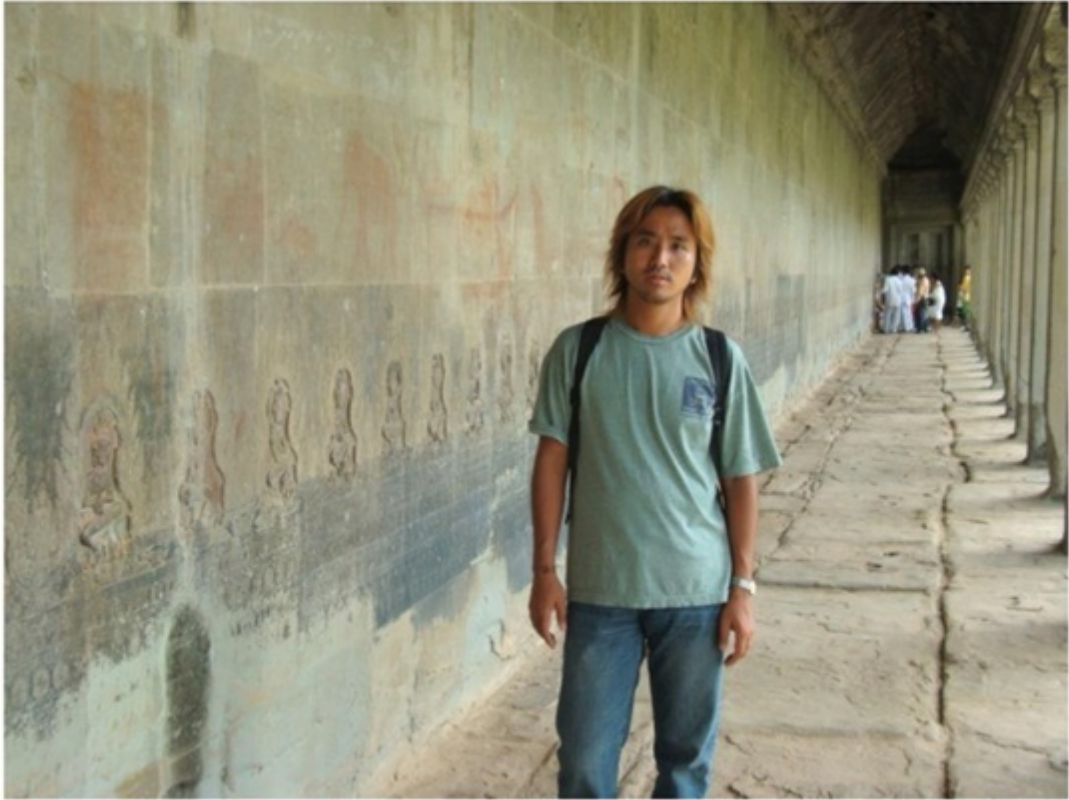
アンコール・ワットの内部。