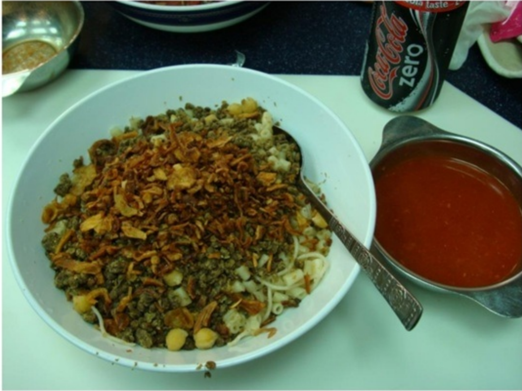
コシャリ。価格が安く、庶民に親しまれている料理。