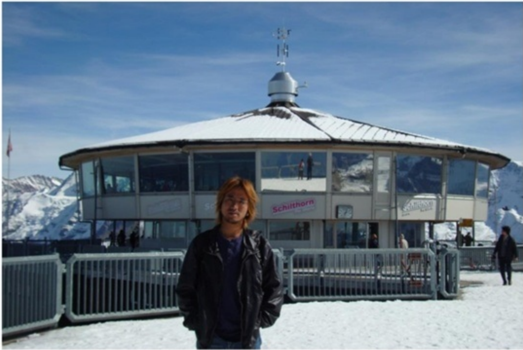
シルトホルン山頂。世界初の 360 度回転展望レストラン。