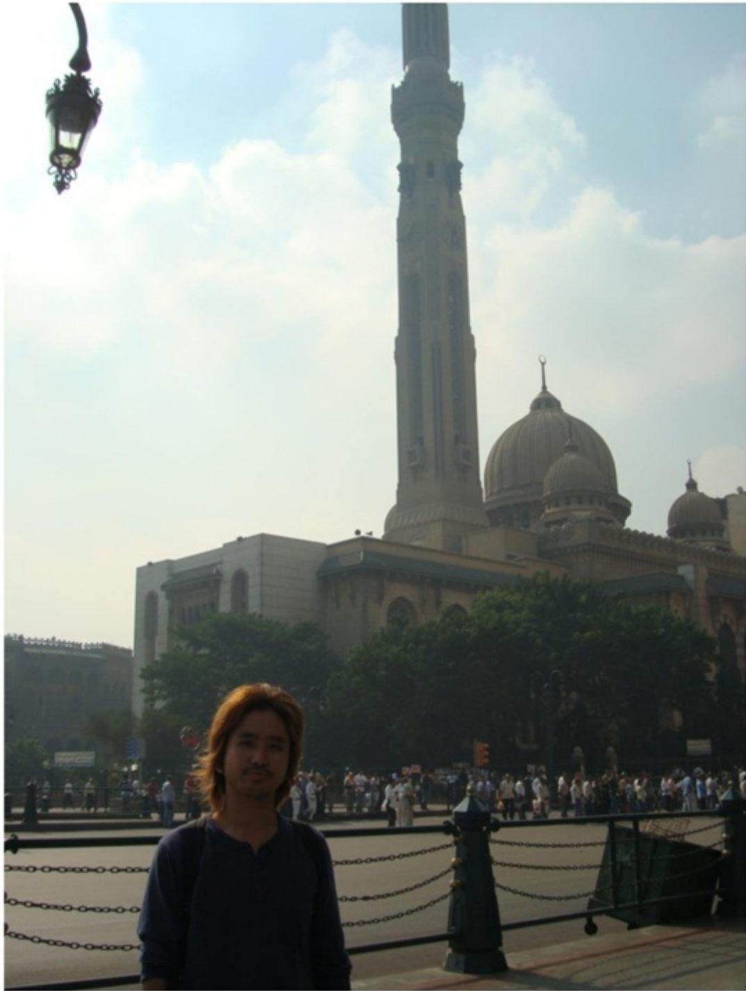
2007.10.26 Cairo, Egypt