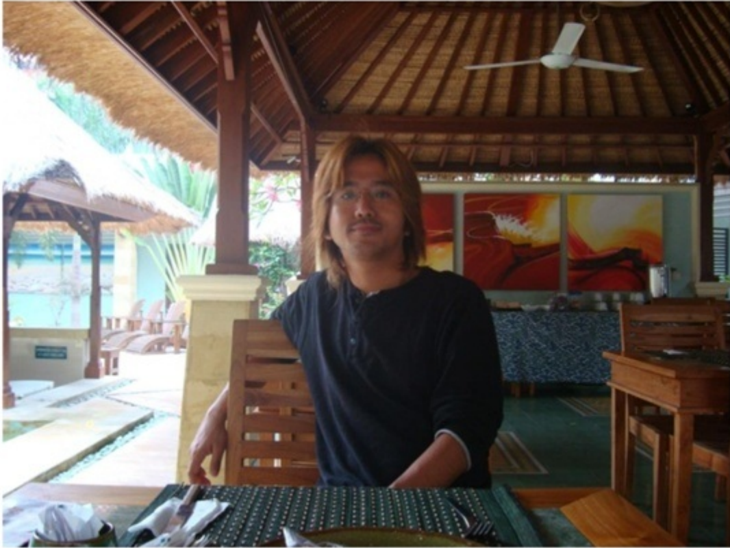
ホテルのレストラン。ナシゴレンが美味しかった。