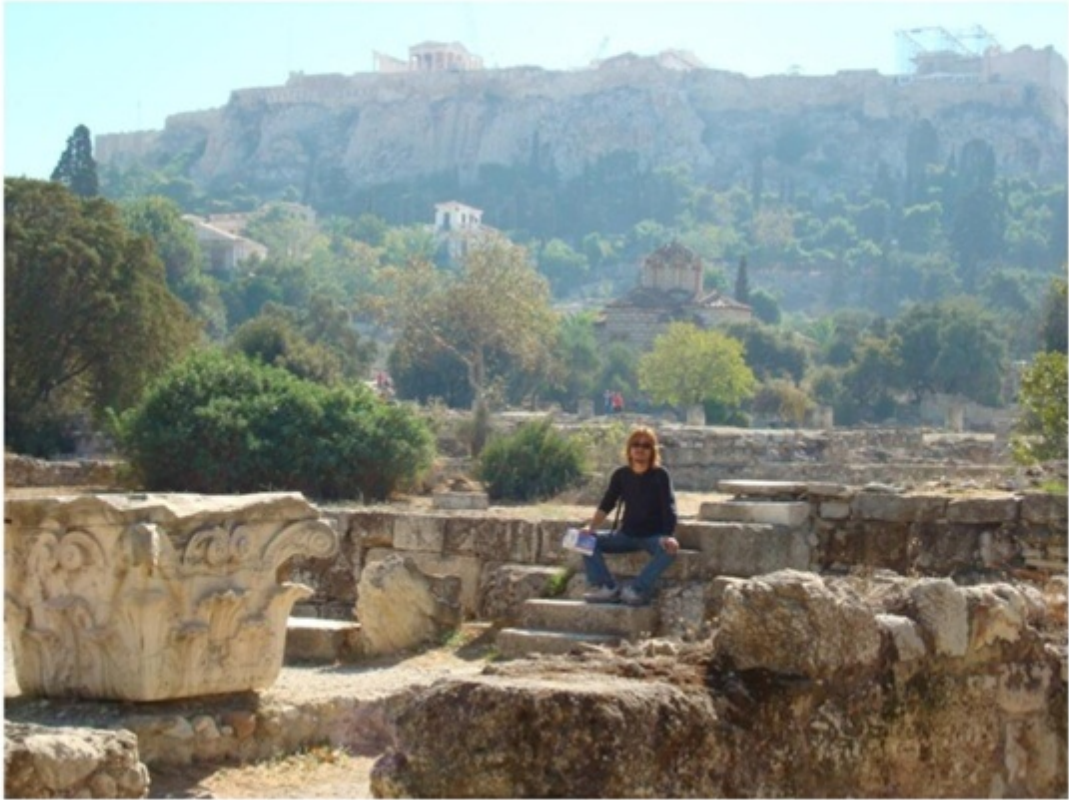
後ろに見えるのがアクロポリス。