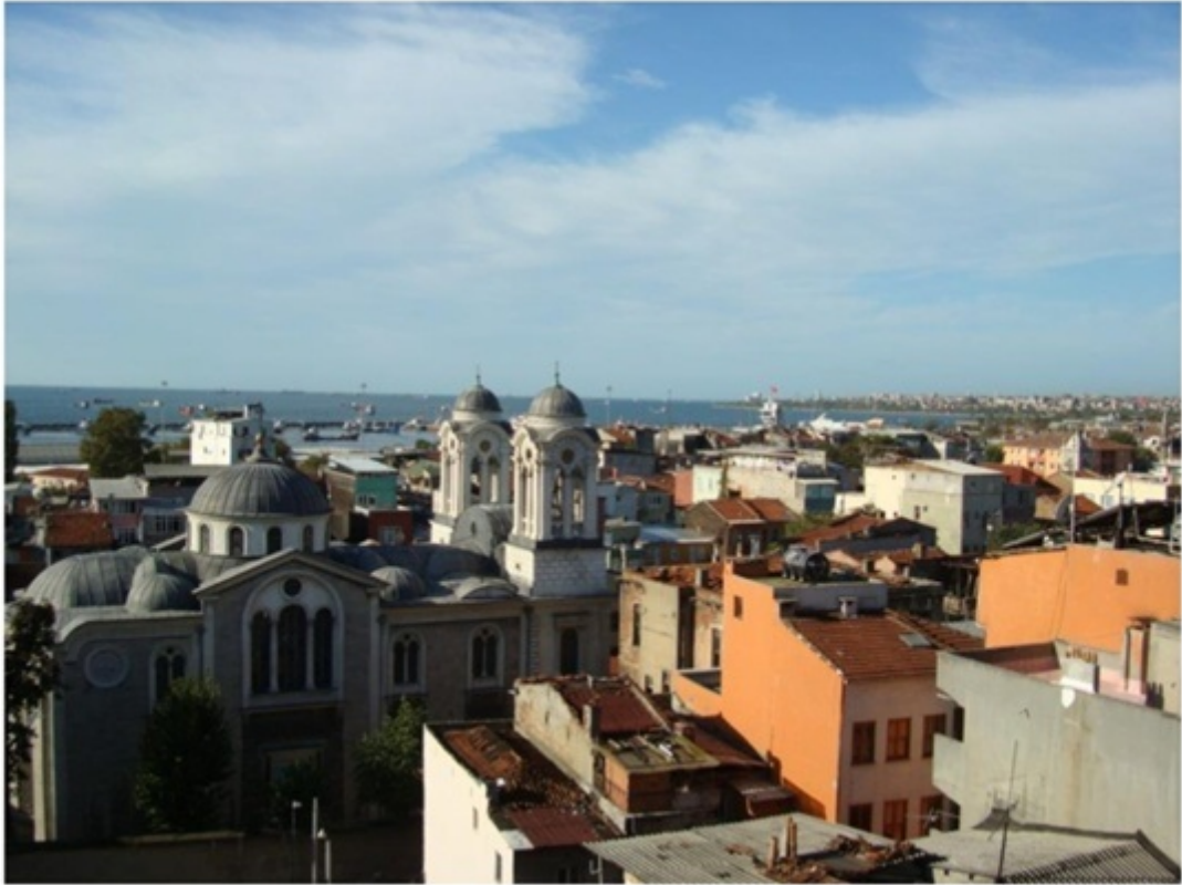
ホテル屋上からの景色。