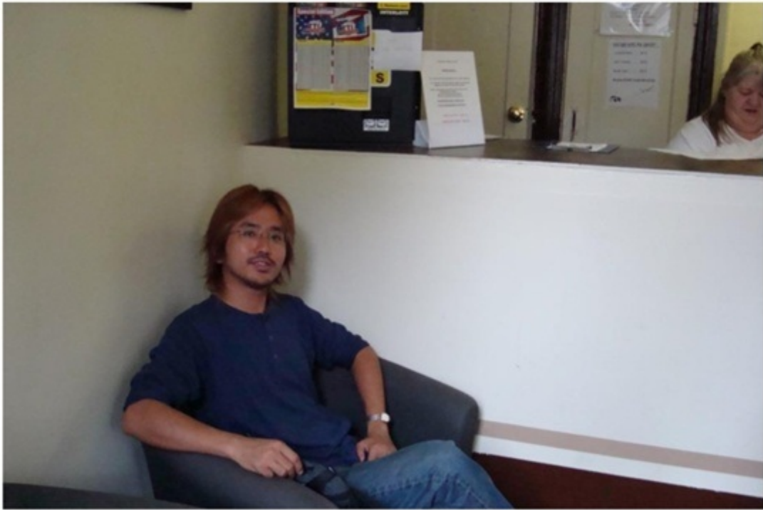
ニューヨークのホテル。バックパッカーには物価が高い。