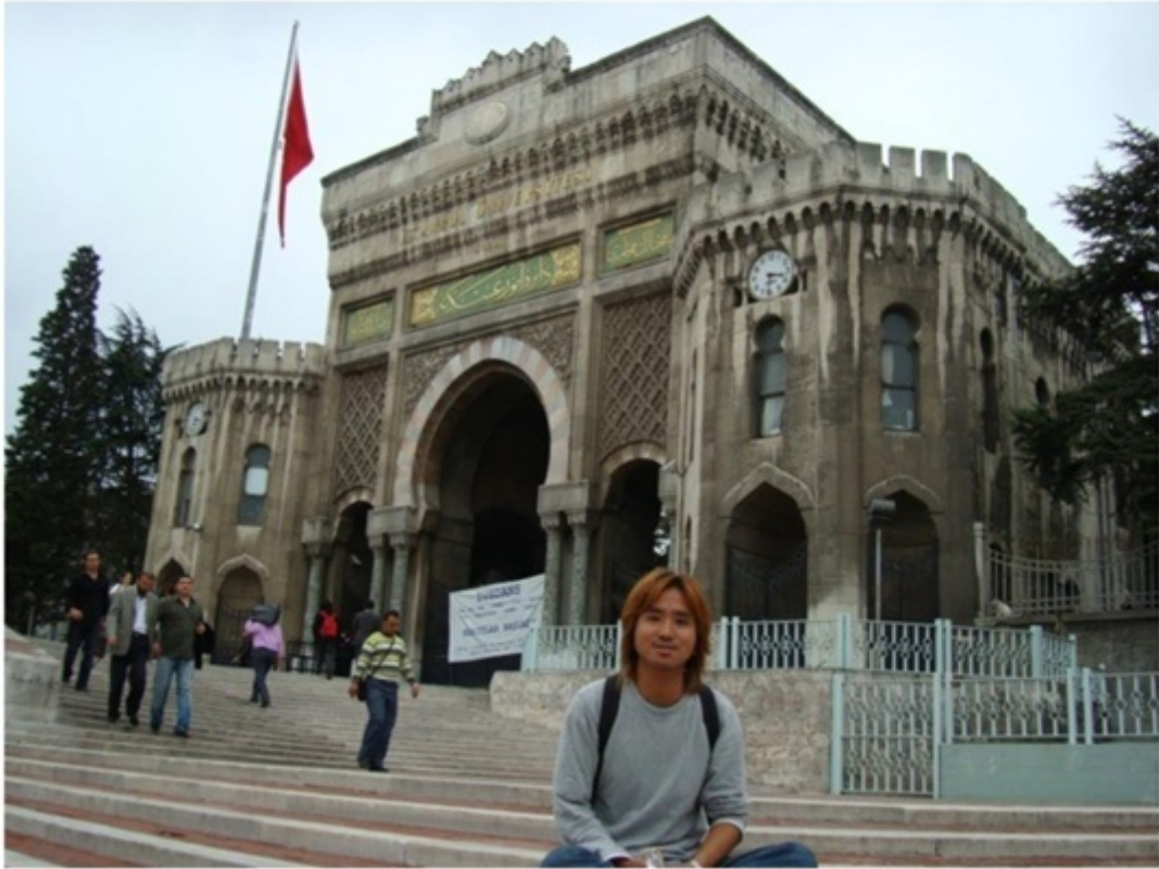
マルマラ大学。ブルーモスクの隣にある校舎。