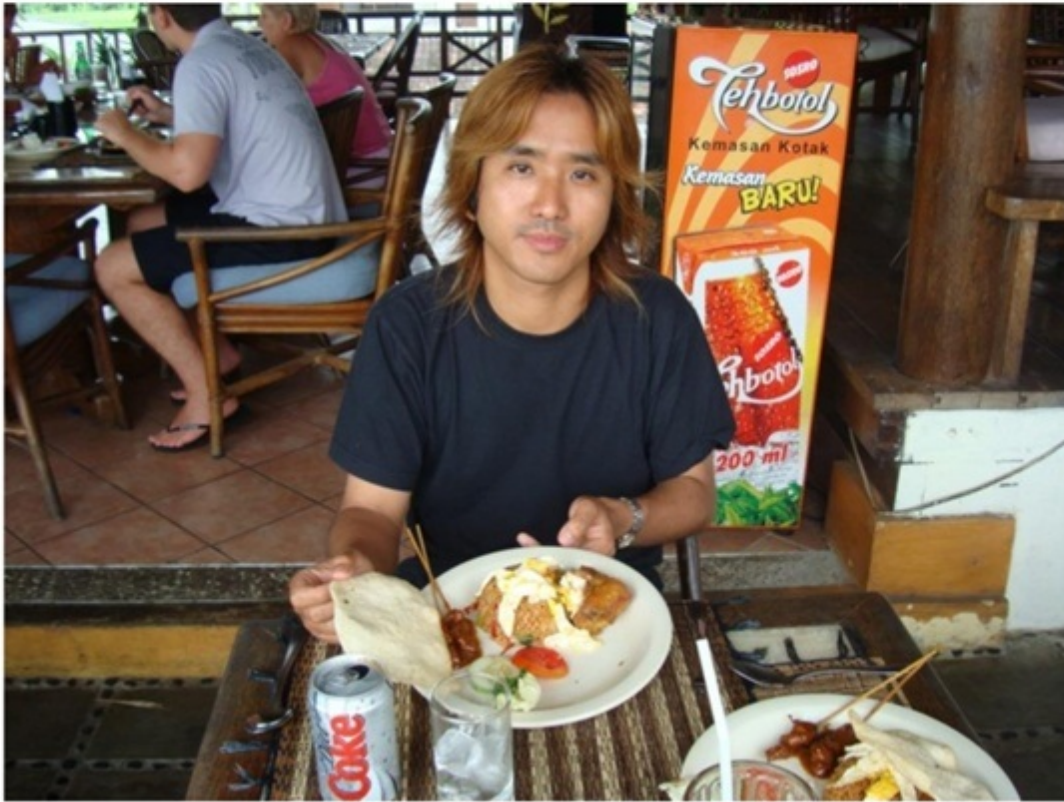
ウブドのレストラン。やっぱりナシゴレン。