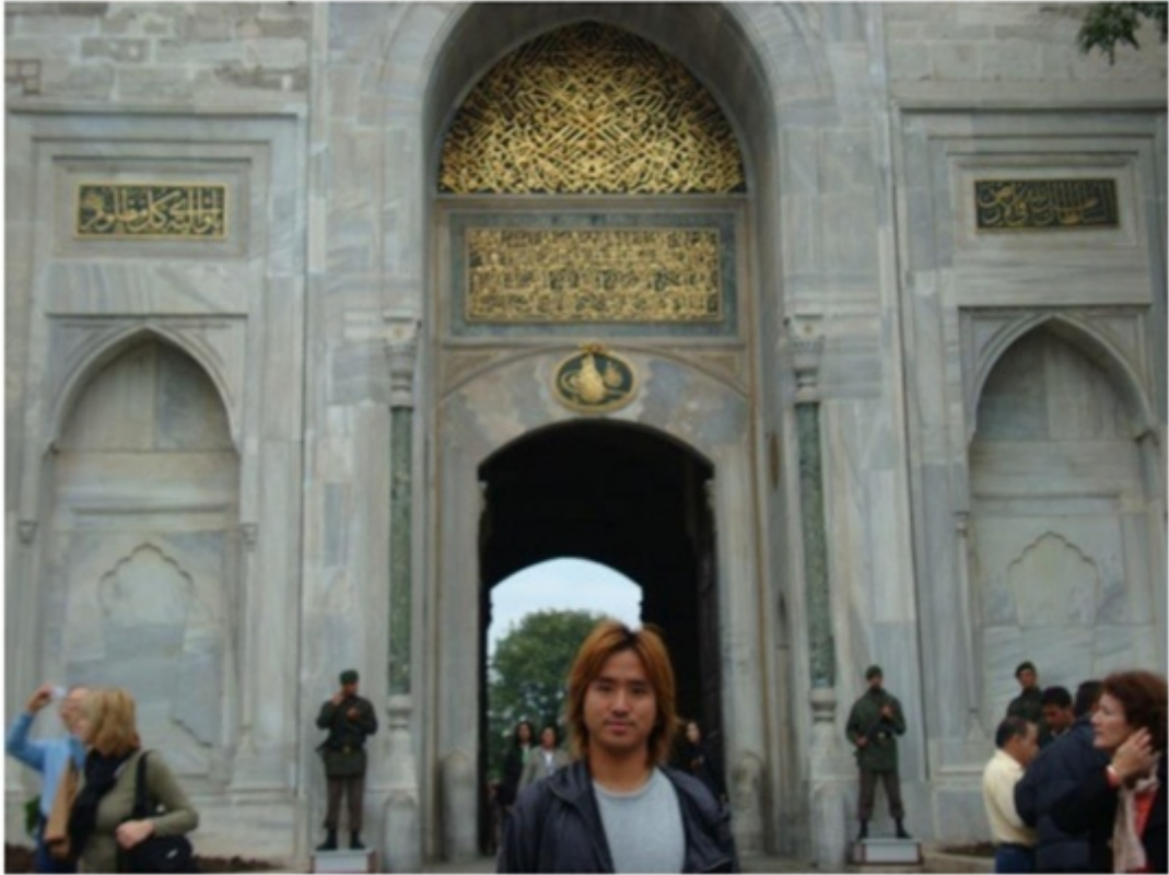
トプカプ宮殿。アヤソフィアの近く。