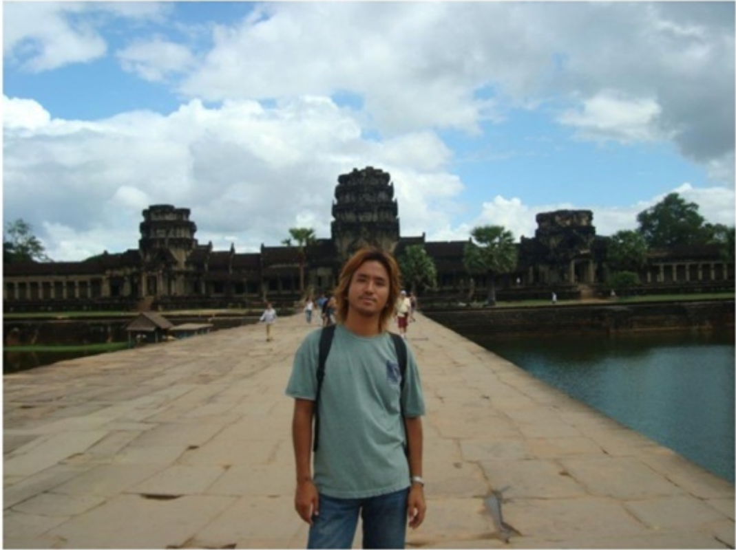
アンコール・ワットの入口。