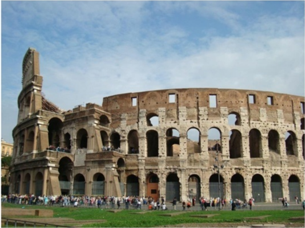
コロッセオの外観。