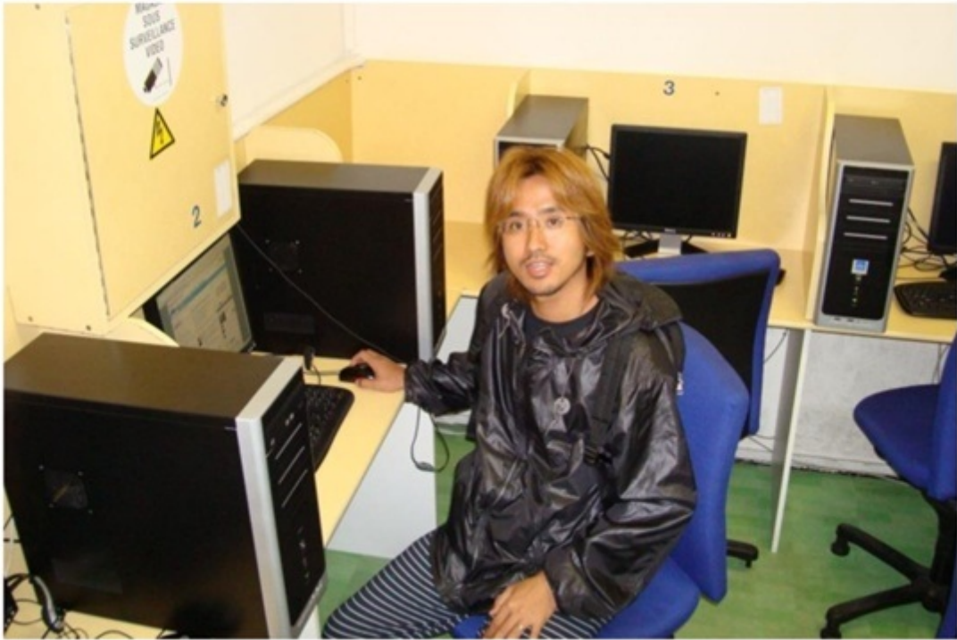
インターネットカフェ。旅の情報収集によく利用していた。