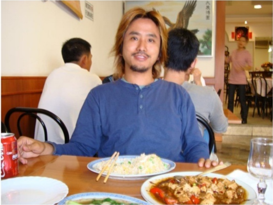
ナポリでの中華料理屋。リーズナブル。