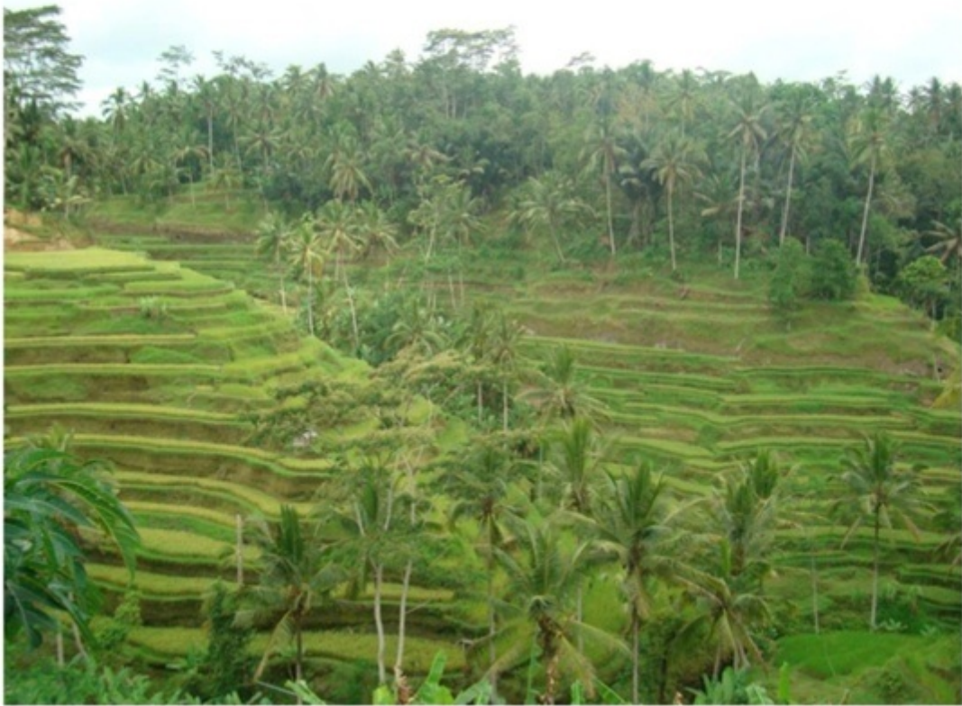
ウブドにある田んぼ。