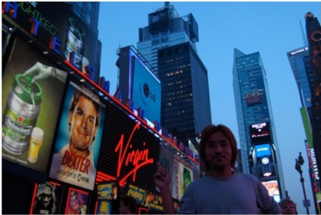
タイムズスクウェア。エンターテインメントの中心。