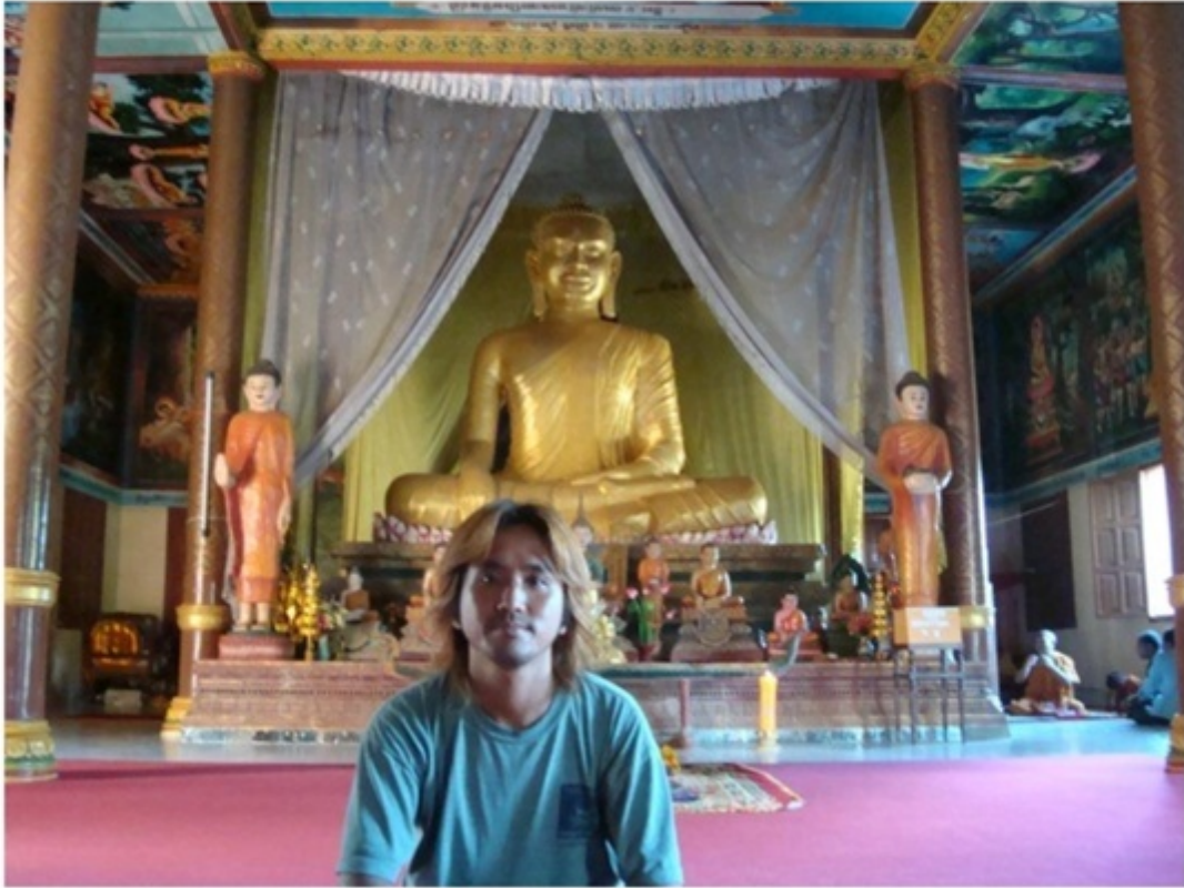
ワットポー寺院。シェムリアップ最古の寺院の一つ。