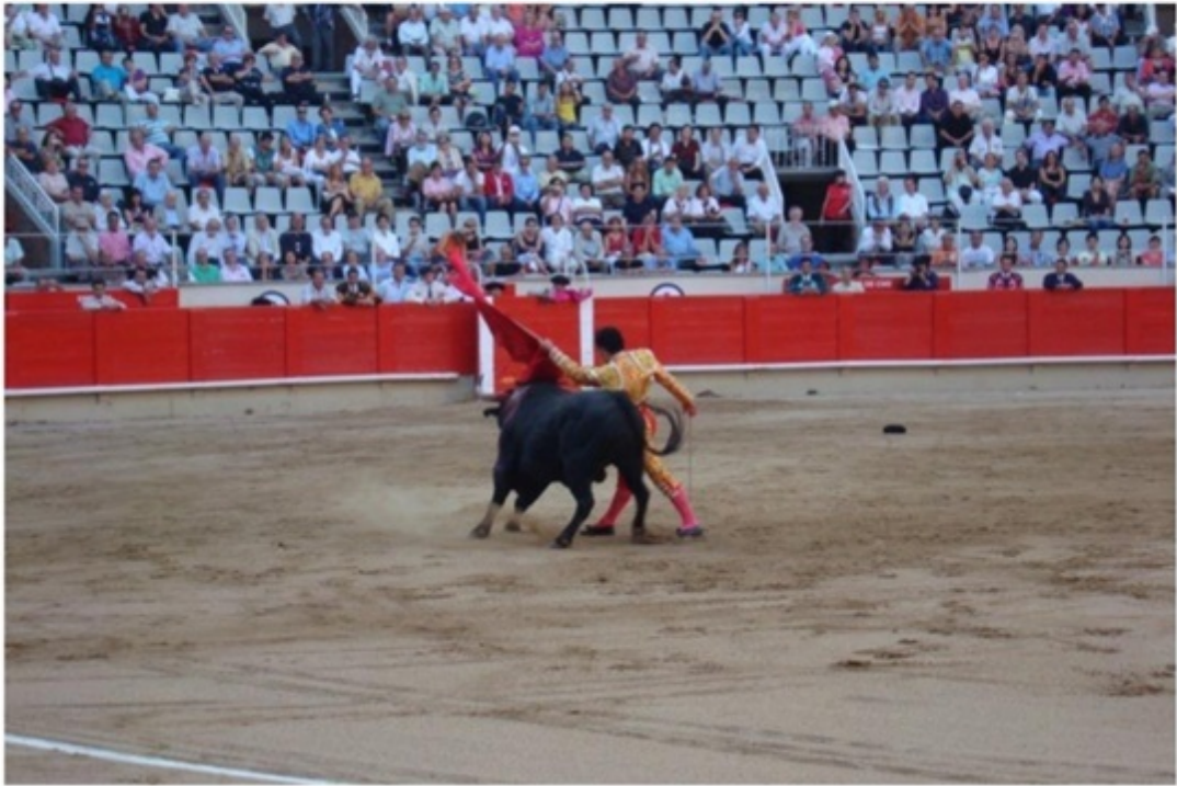
スペイン伝統の闘牛場。前から3列目の良席。