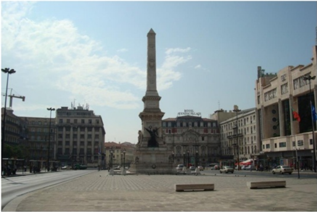
リスボンにある広場。