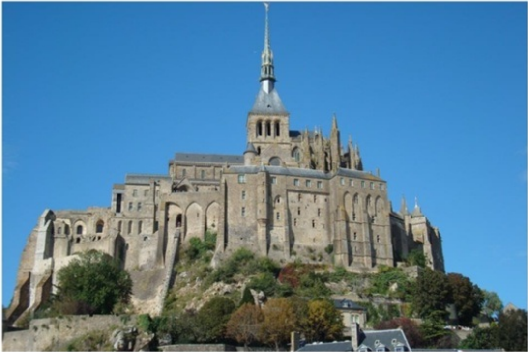
モンサンミッシェルの全体像。