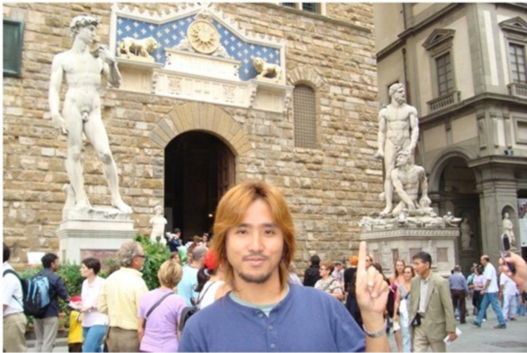
ヴェッキオ宮殿。ミケランジェロの像が迎えてくれる。