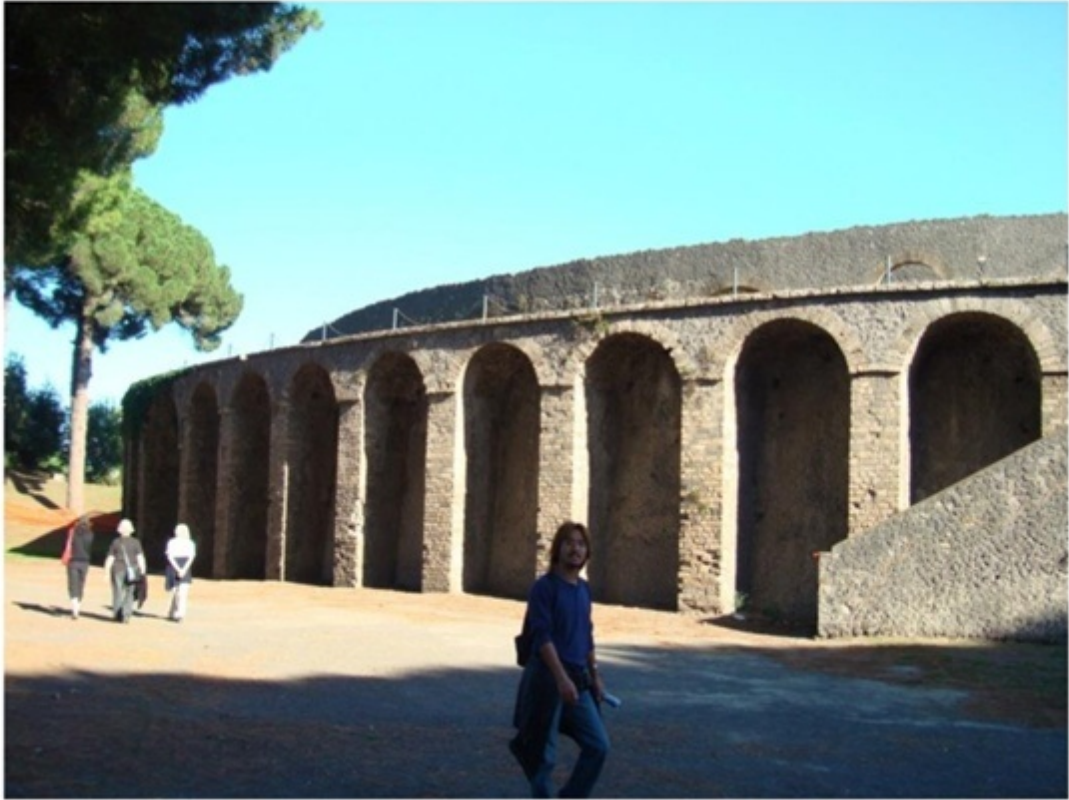
ポンペイの競技場。