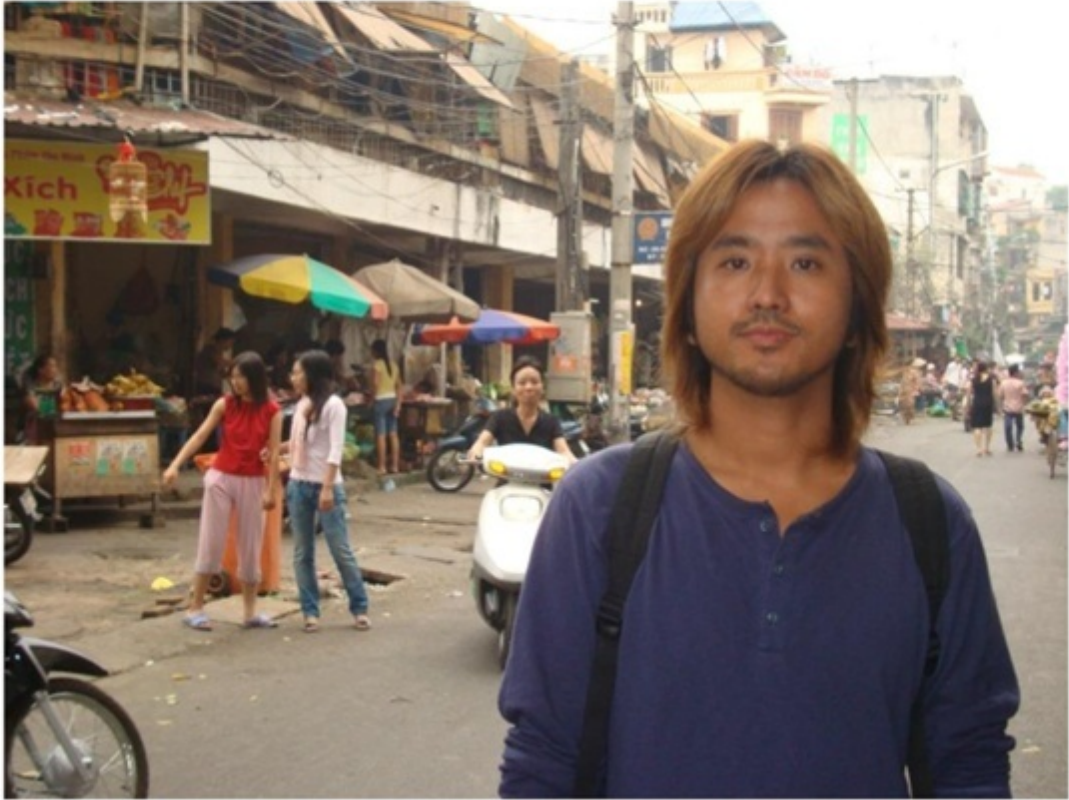
シムリアップの街中。