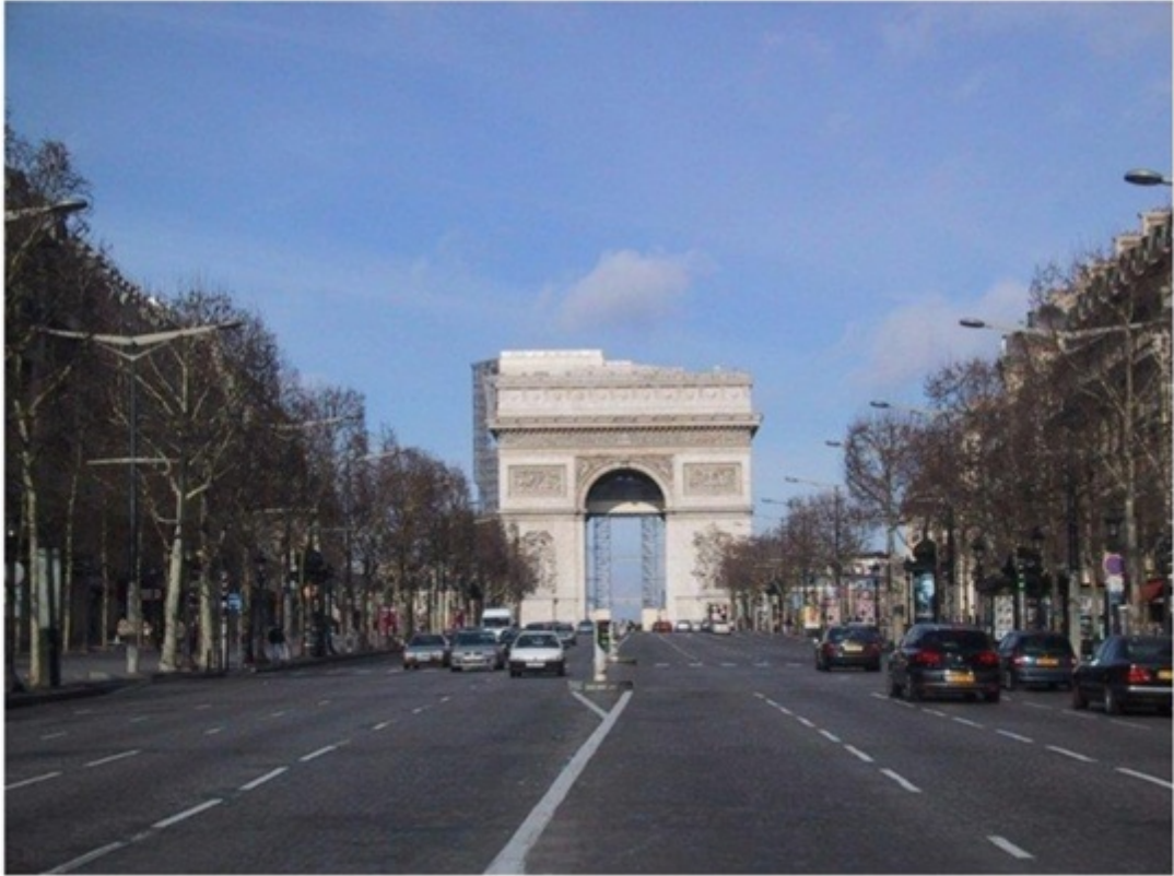
シャンゼリゼ通り。パリで最も美しい通り。