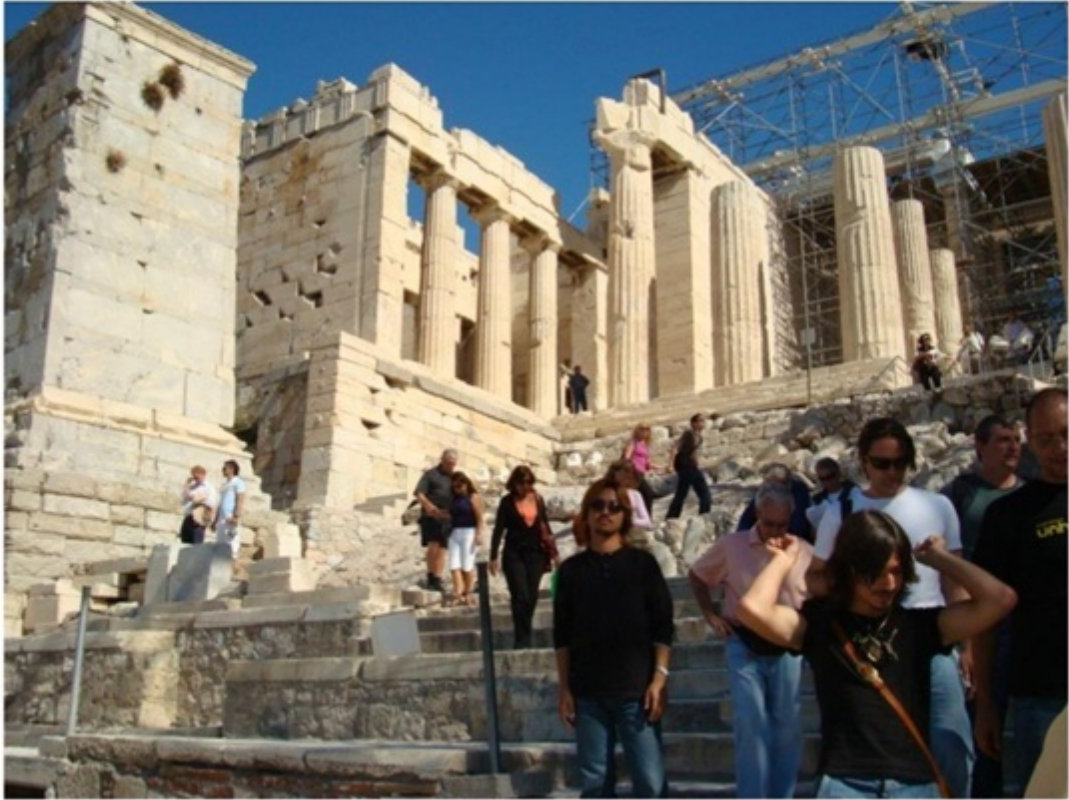
パルテノン神殿の近く。