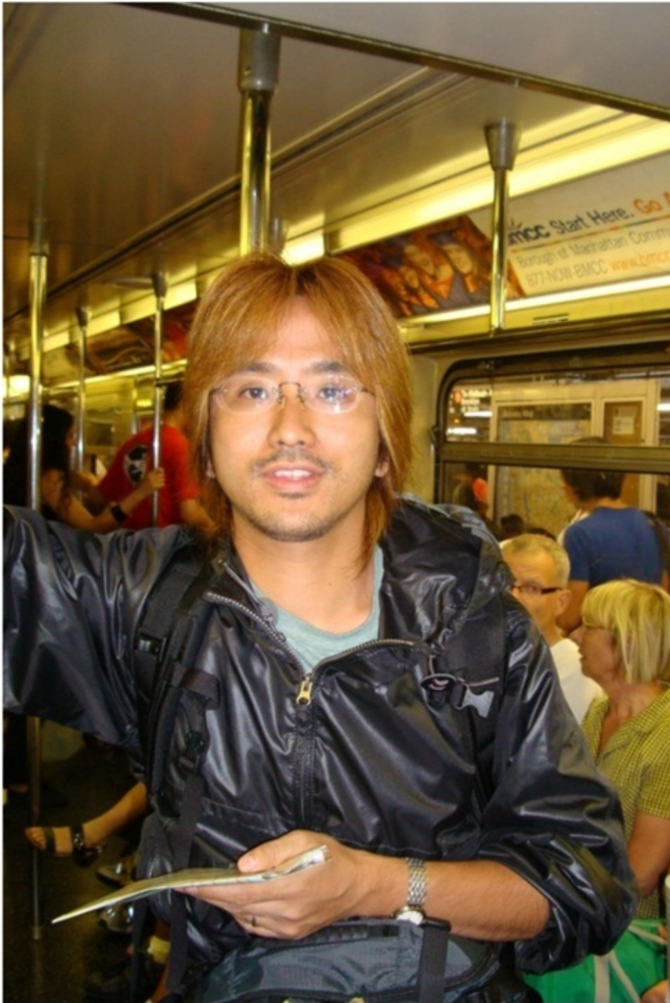
ニューヨークの地下鉄。思っていたよりも清潔で安全。