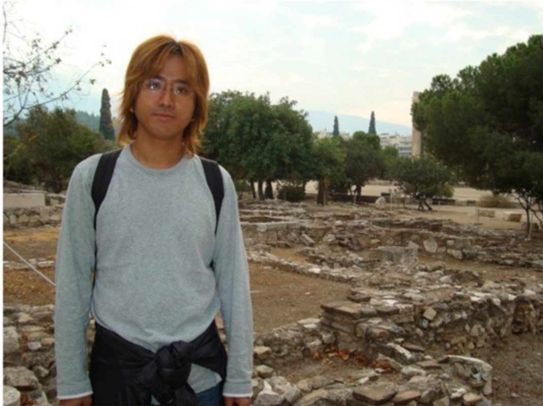
オリンピアのゼウス神殿跡。