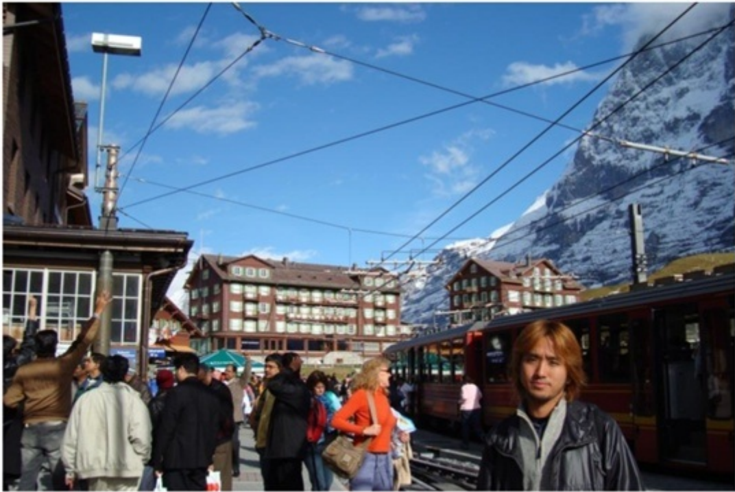
氷河鉄道の乗換駅。