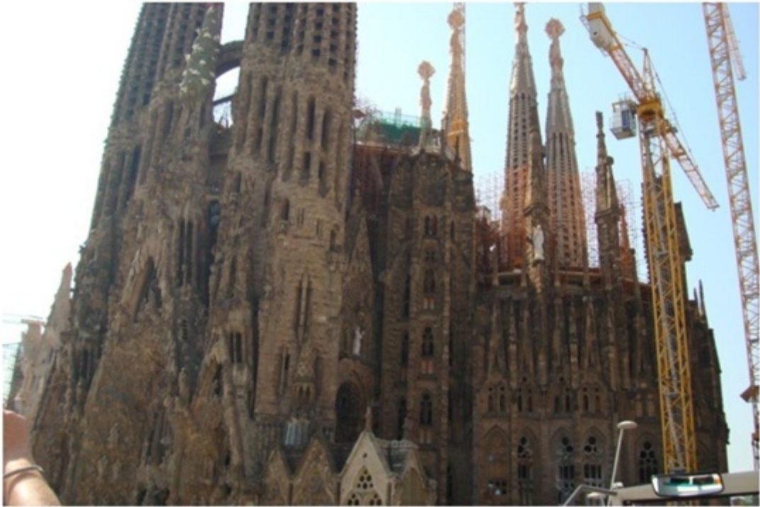
オープンバスにて市内観光。サクラダファミリア。