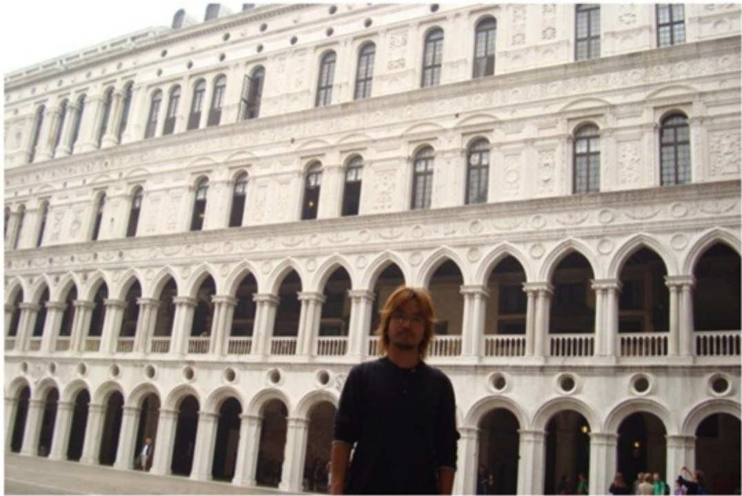
サンジョルジュマッジョーレ島の教会