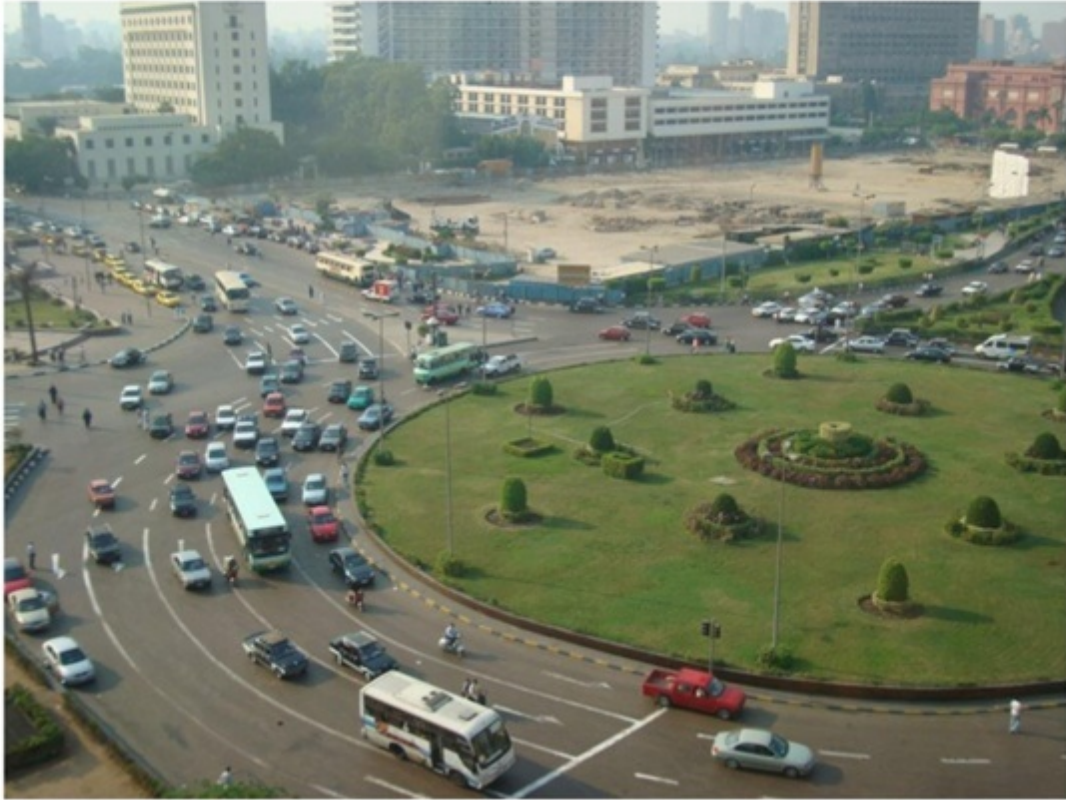
タハリール広場。カイロ中心に位置する広場。