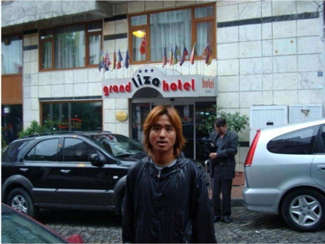
イスタンブールで泊まっていたホテル。