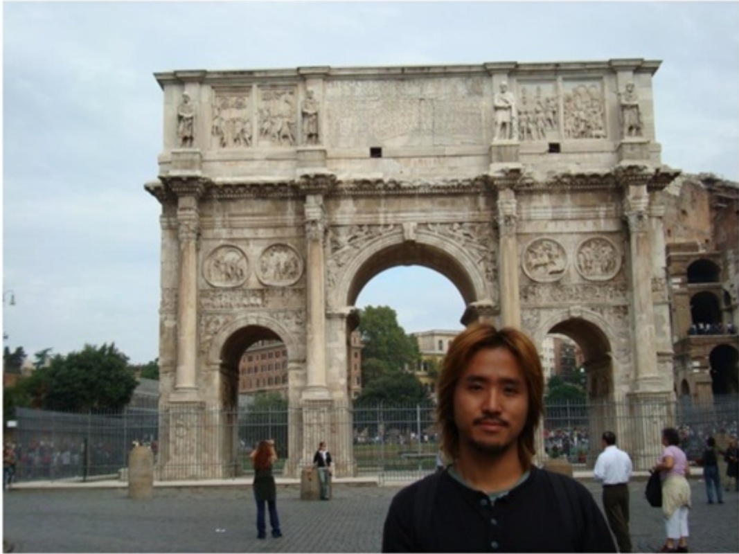
コロッセオの横にある凱旋門。