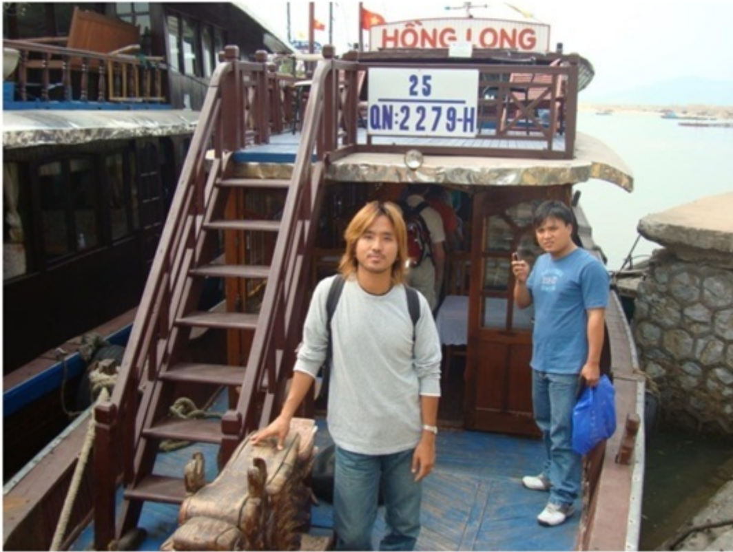
ハロン湾ツアー。ベトナムきっての景勝地の一つ。