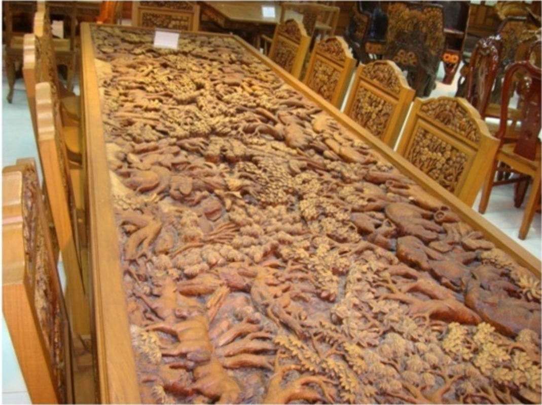
木彫り工場を見学。