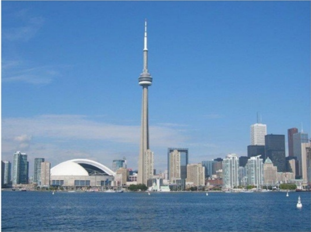
世界一のCNタワー（475メートル）。