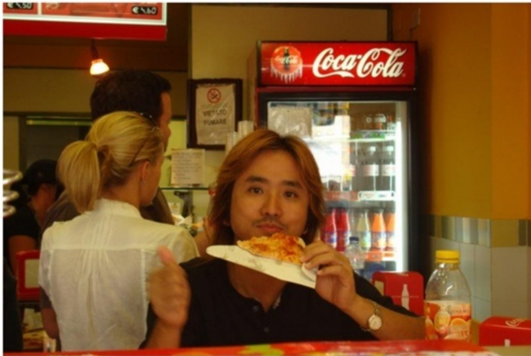
地元の人で賑わうピザ屋。