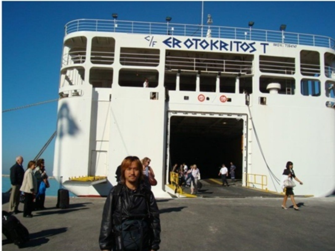
ブリンディッシから、ギリシャへ。17時間の船旅。