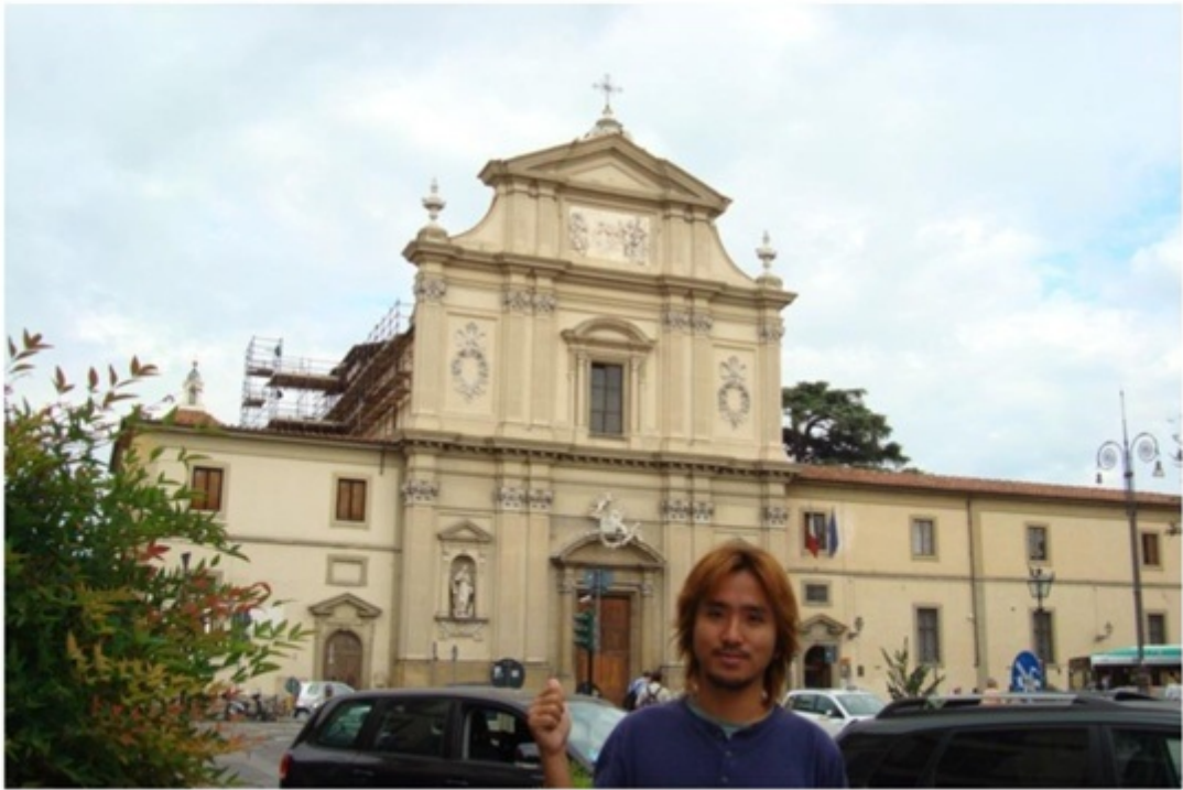
メディチ家の礼拝堂の近く。