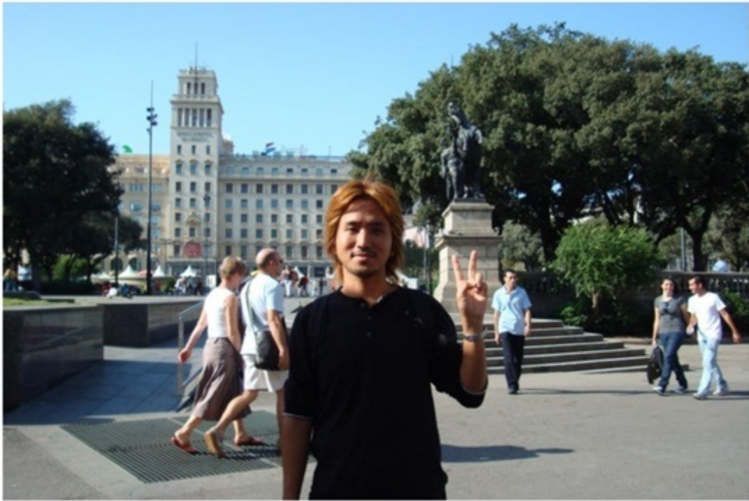
バルセロナのメインストリート近くの公園。