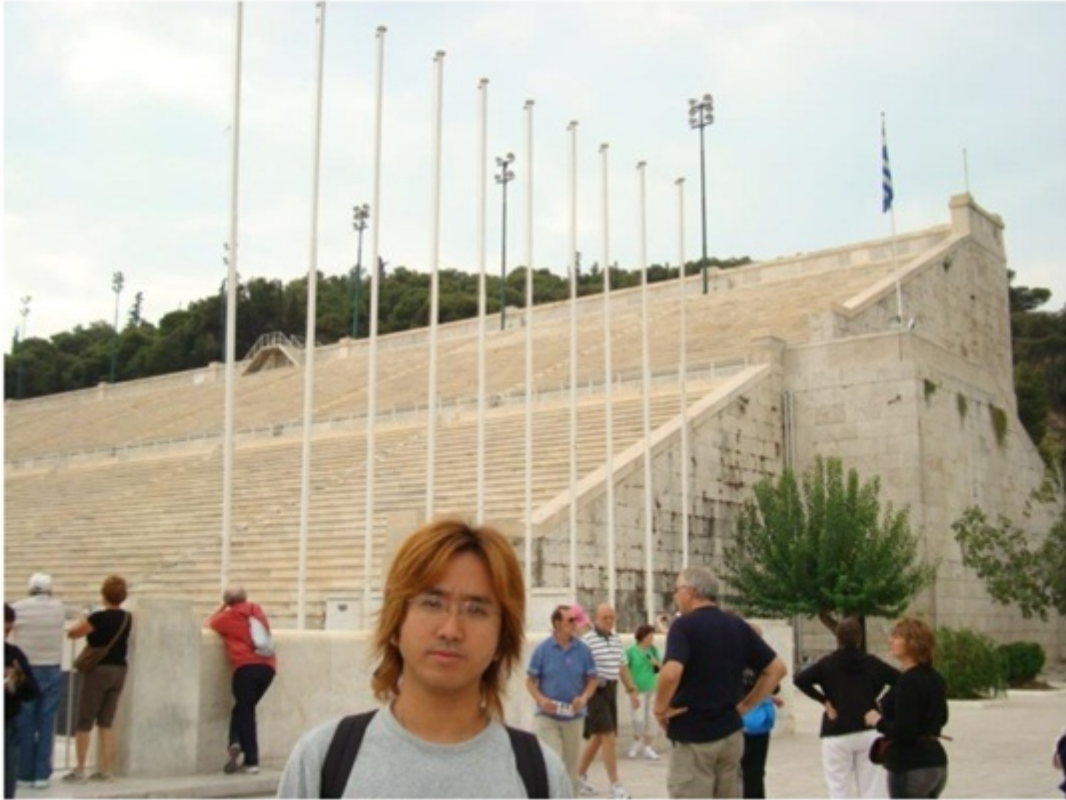
アテネオリンピック会場。