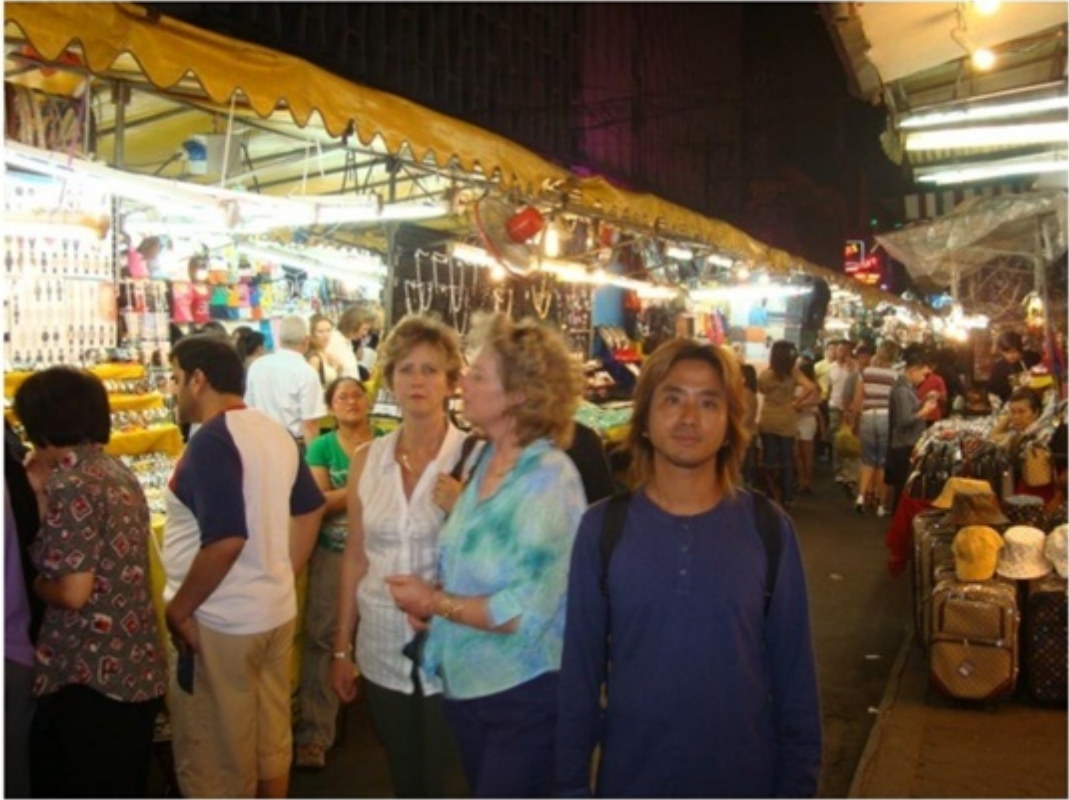
パッポン通り。バンコク最大の繁華街。