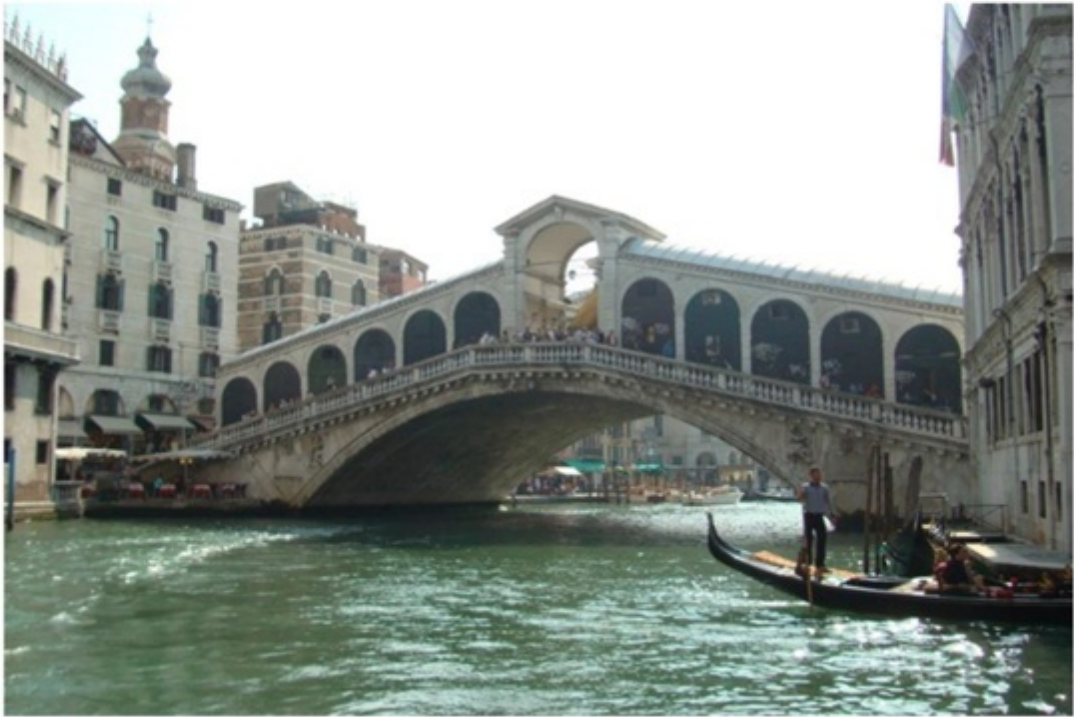
リアルト橋。ヴェネツィアで一番有名な橋。