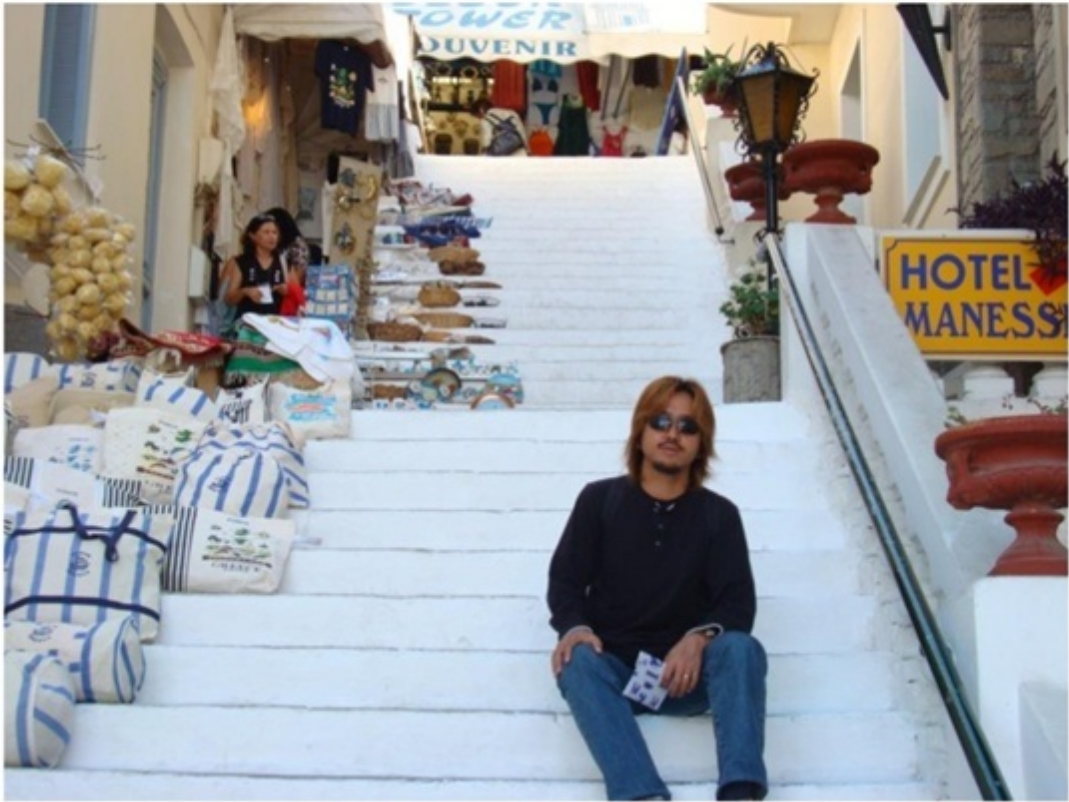
ポロス島、イドラ島、エギナ島など。