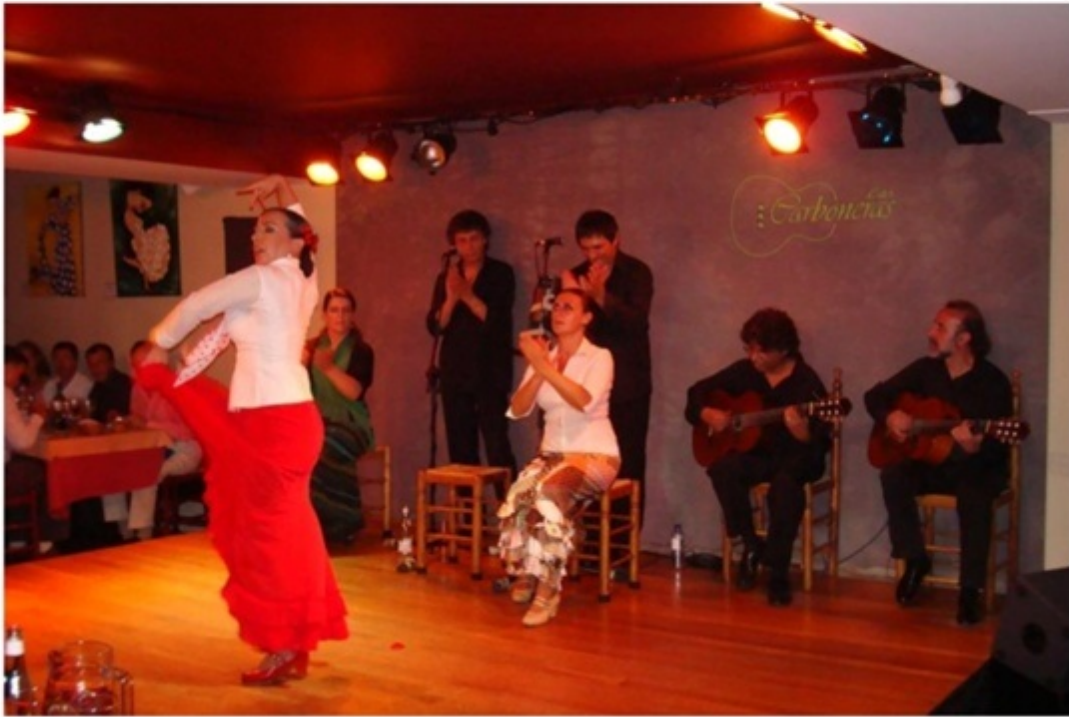
本場のフラメンコ。地元客でにぎわう有名なお店。