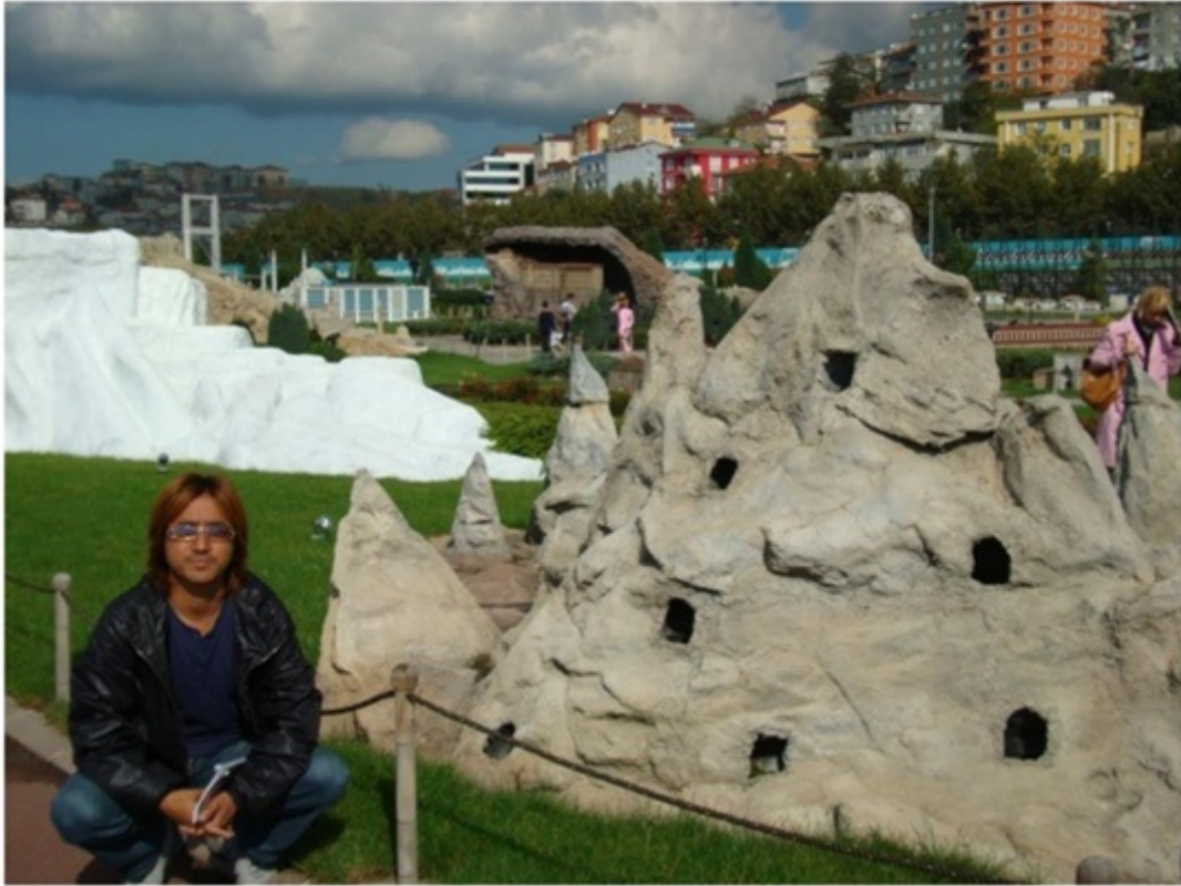
トルコのテーマパーク。トルコ各地のミニチュアが展示。