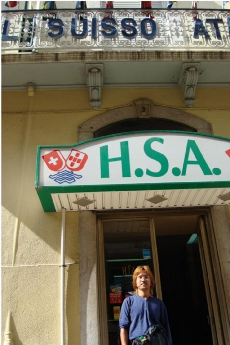
立地がいいリーズナブルなホテル。