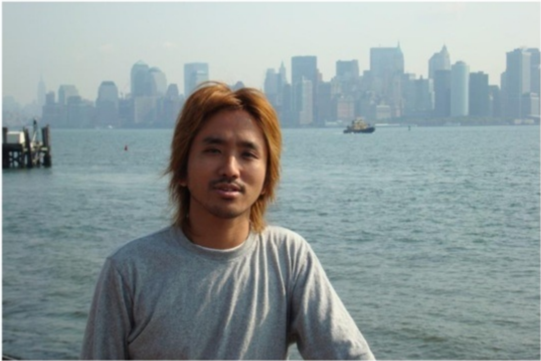
船から見たマンハッタン。