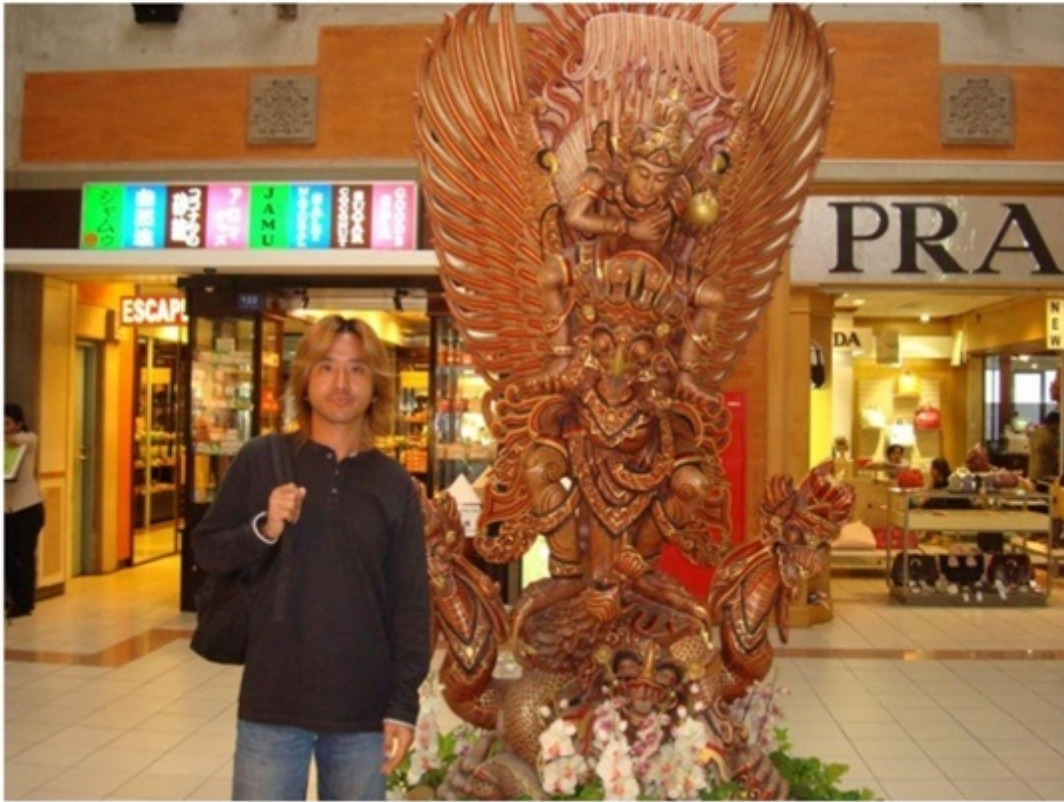
バリ島のデンパサール空港。タイのバンコクへ向かう。