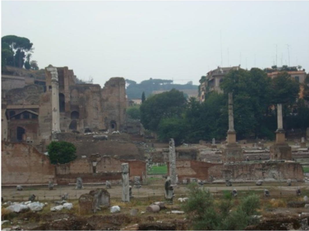
フォ・ロマーノ。古代では政治の中心地。