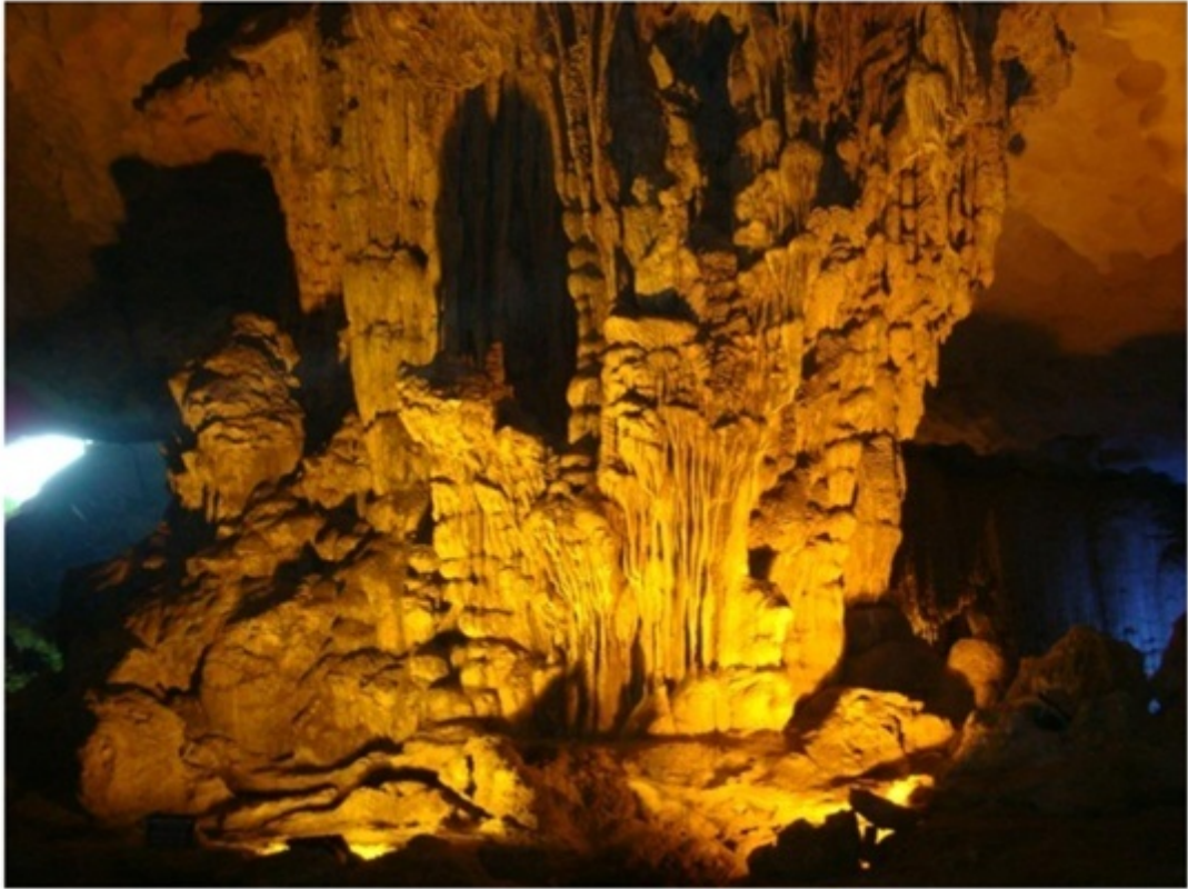
ティエンクン鍾乳洞。ハロン湾クルーズとセット。