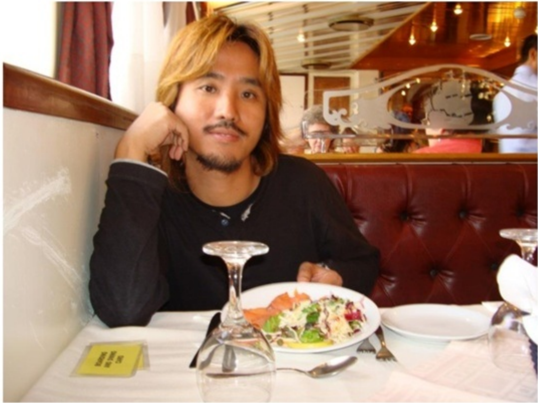
クルーズ船でコースランチ。