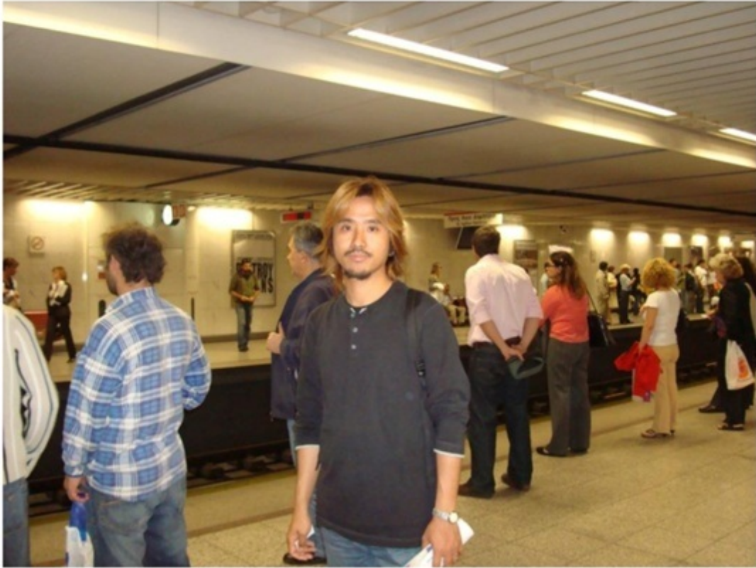
ギリシャの地下鉄。