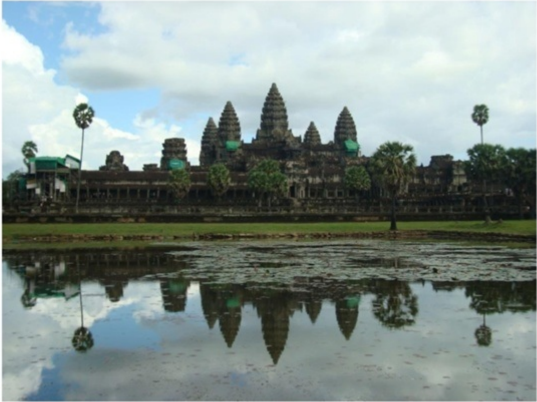
水辺に映るアンコールワット。