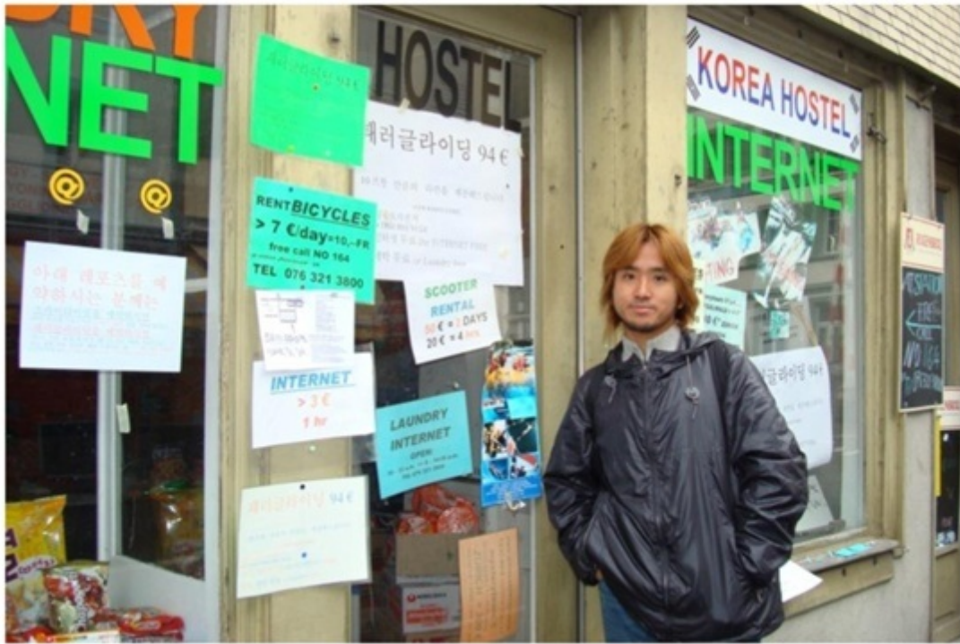
インターネットカフェ。