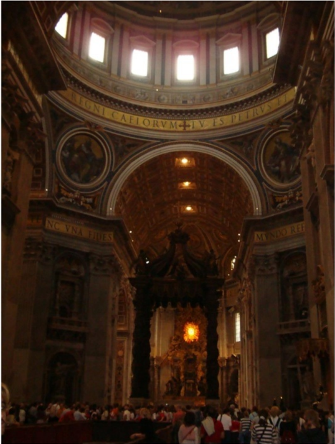
バチカンのサンピエトロ大聖堂。