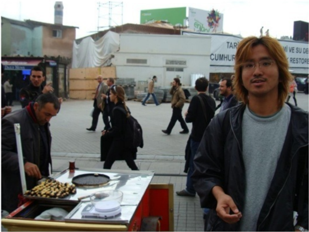
路上で栗を売っていた。なかなか美味しい。