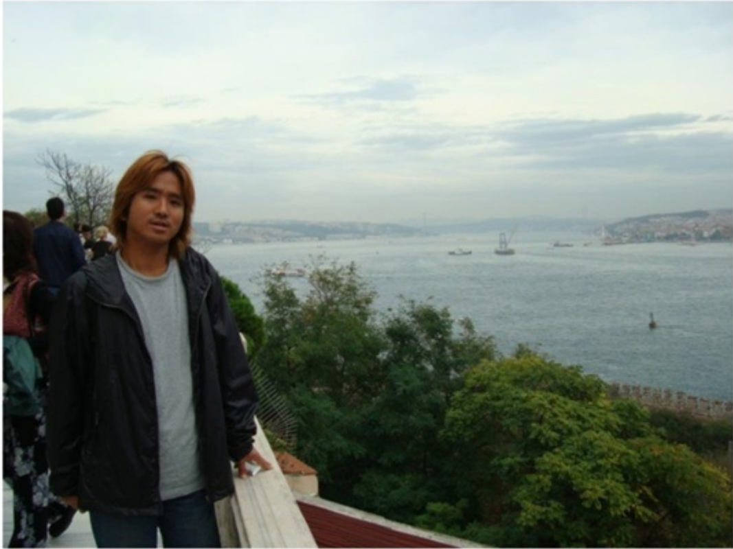
トプカプ宮殿からの街並み。眺めが最高。