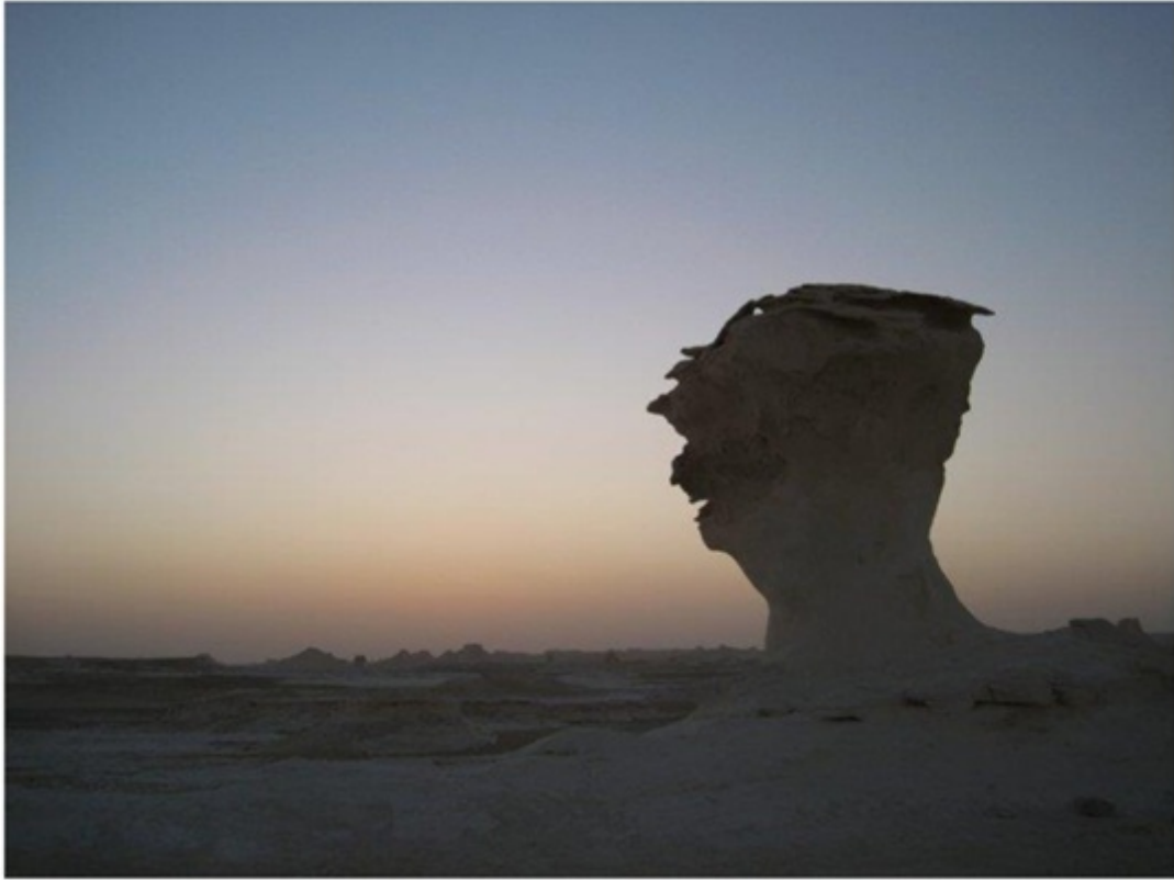
砂漠ツアーで見た日の出。