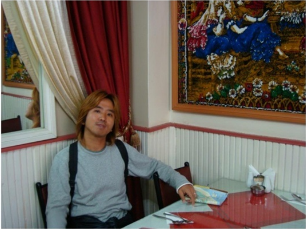
ホテル近くの食堂。物価は比較的安い。