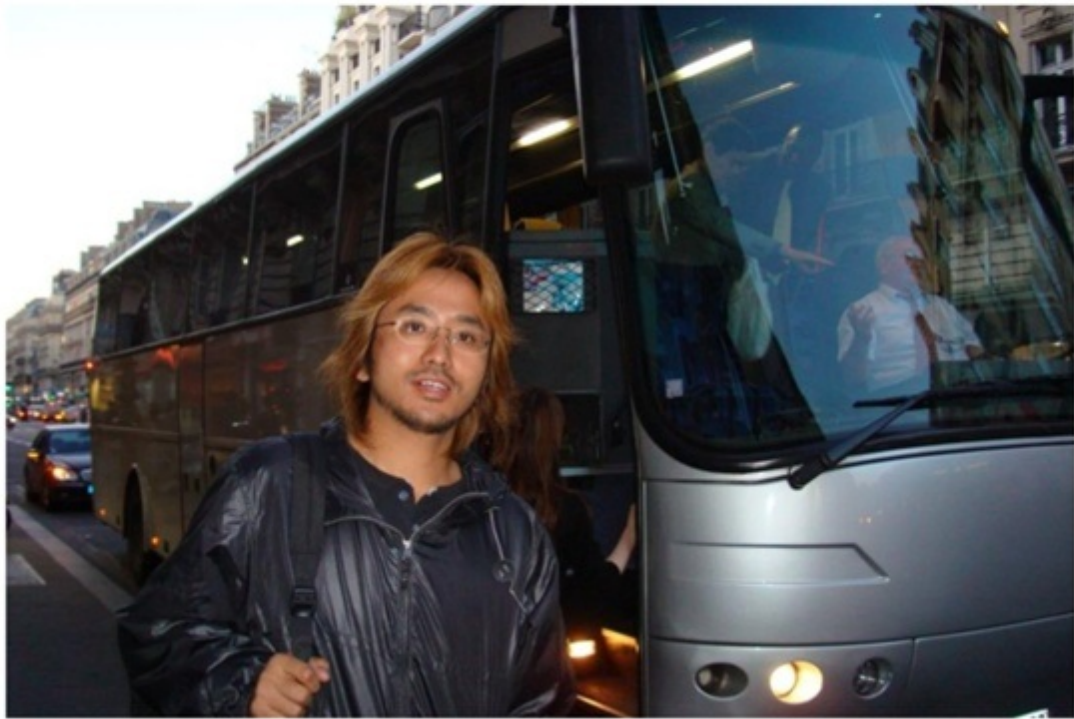
モンサンミッシェルのツアー。パリから片道約 450km の距離。