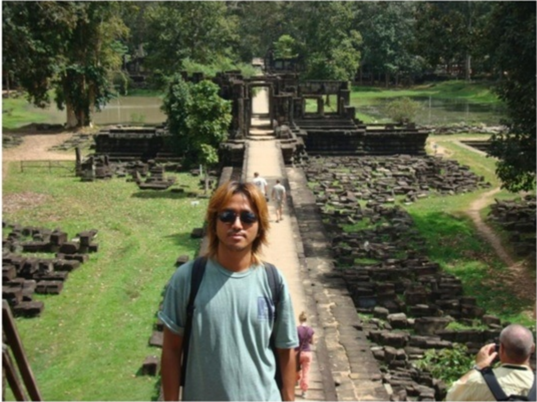
アンコール・トム。