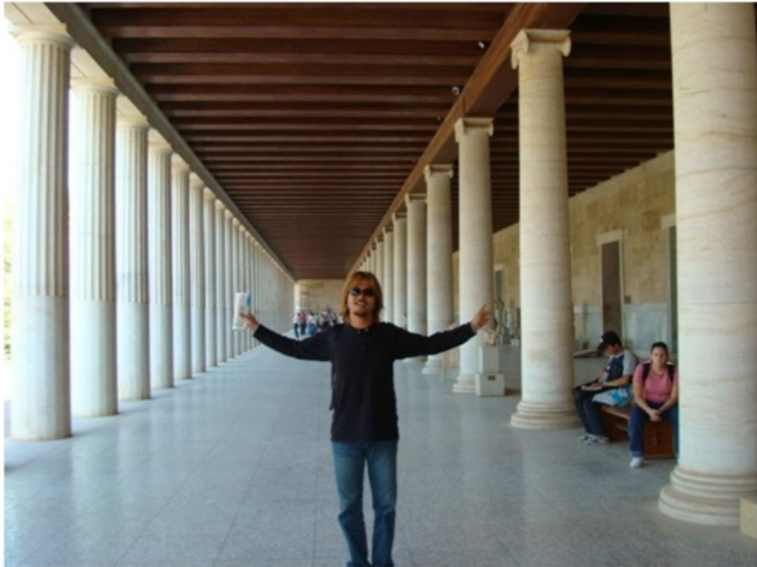
ヘファイストス神殿。アタロスの柱廊。