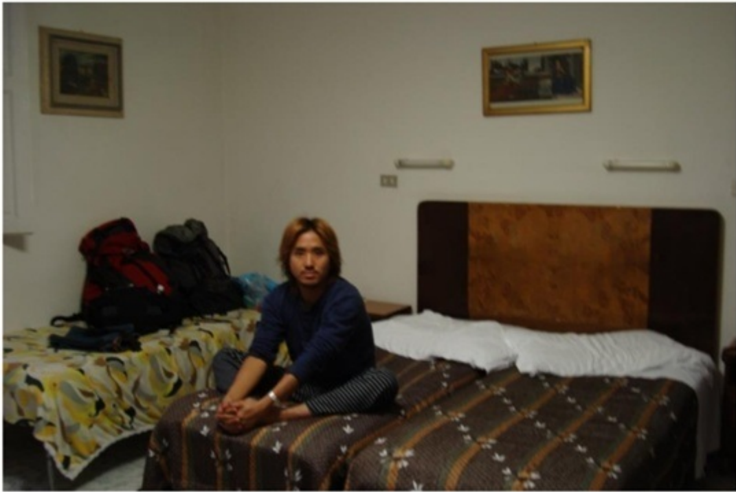
宿泊していたホテル。階段で4階まで行くので格安。