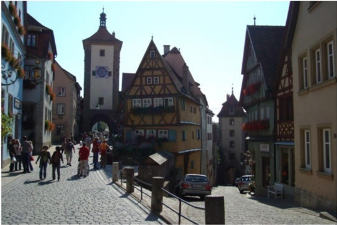
ポストカードの光景。右中央のホテルに宿泊。