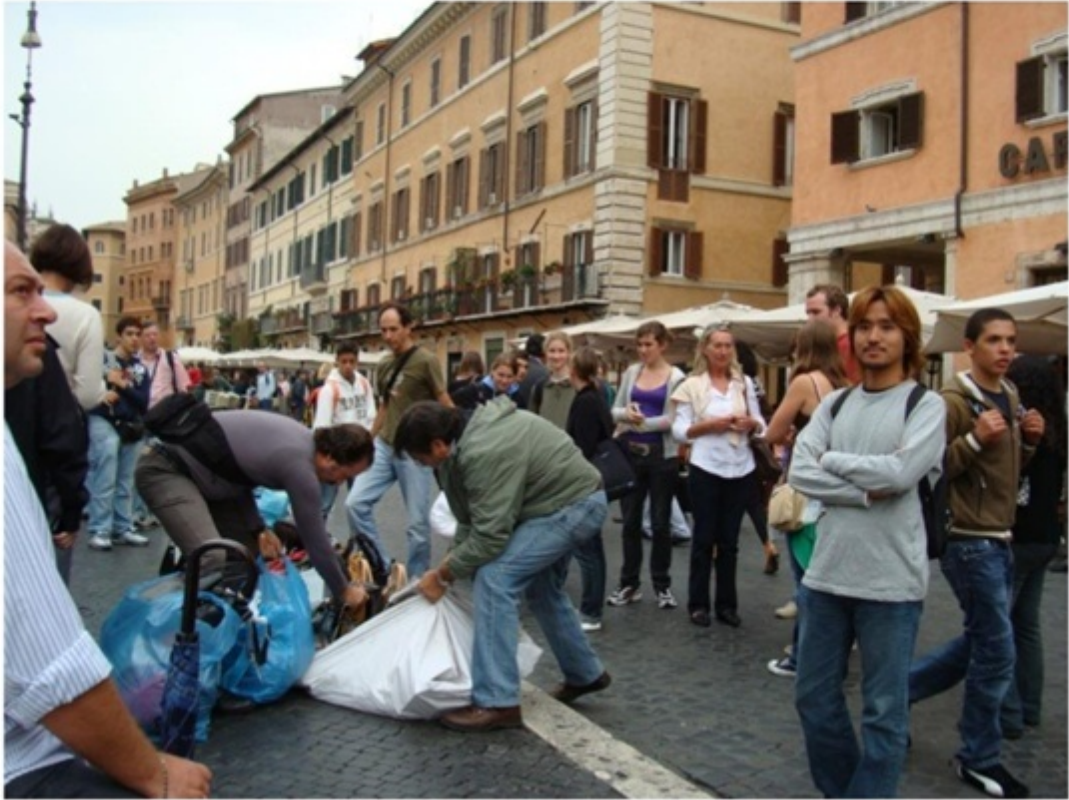
偽ブランド品の摘発の瞬間。