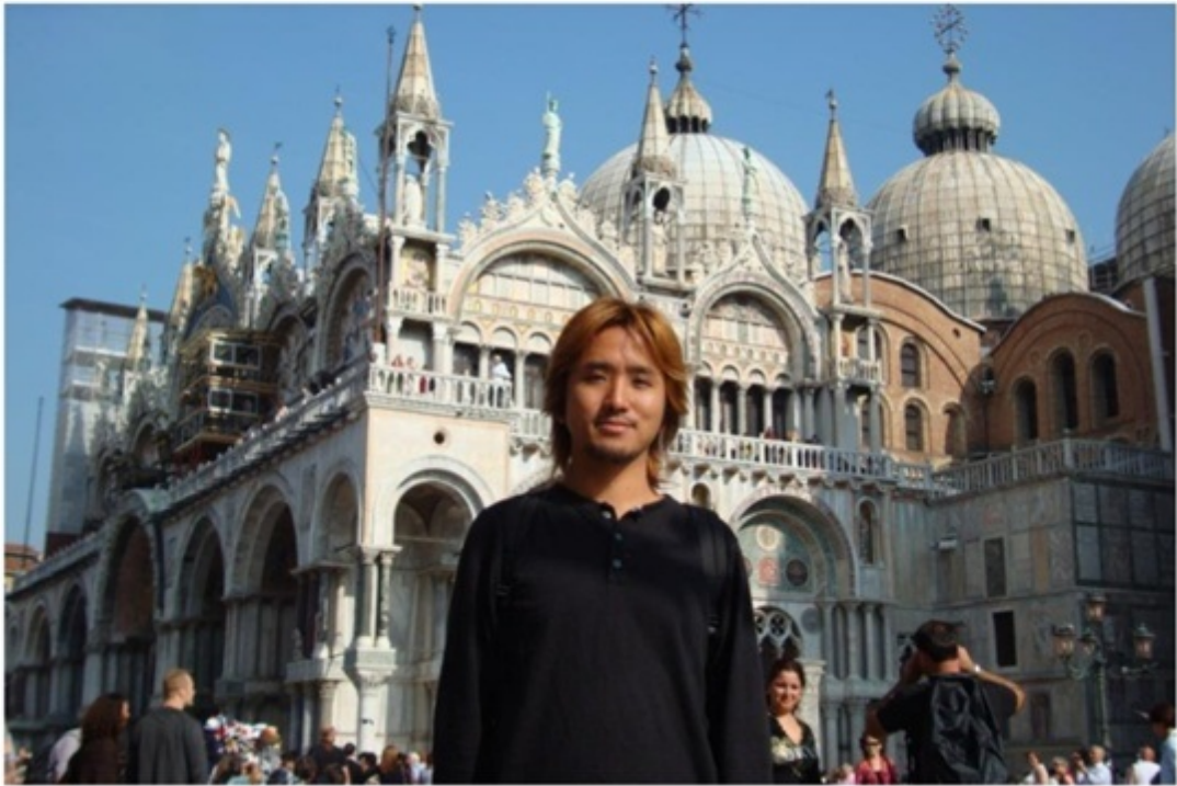
サンマルコ広場にある教会。