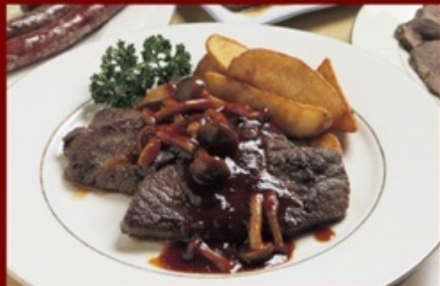
鹿肉のハンターステークセット/¥2,100(ライス・サラダ・コーヒー付き)

豊かな自然に恵まれた信州には、美味しい食材を育む風土があります。中でも、自然の中で生き抜いてきた野生の恵みである「ジビエ」は、私たちに滋養と、生きる力を与えてくれます。暖かい室内で、森の恵みをありがたください。冬の信州を楽しむ活力が湧いてきます。