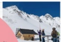
千畳敷カール (駒ヶ根市・宮田村)