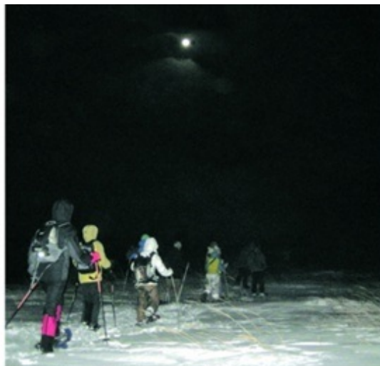
車山高原ではナイトスノーシューツアーも開催

〒茅野市北山3413 ☎0266-68-2626 (車山高原観光協会) 靴スノーシューレンタル1日1000円、半日500円 アクセス:中央道諏訪南ICから約50分、諏訪ICから約40分、上信越道佐久ICから約60分