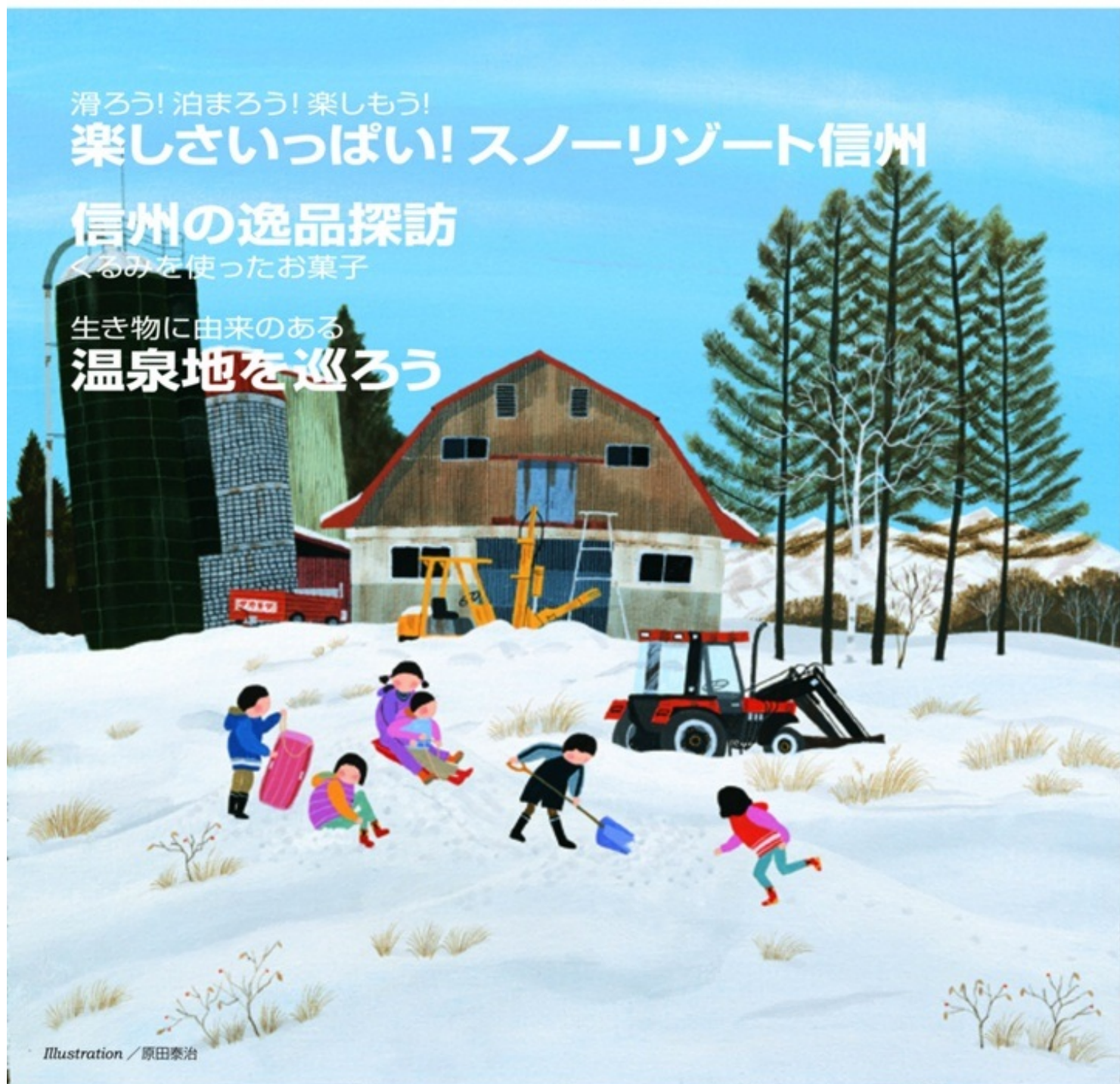
Illustration / 原田泰治