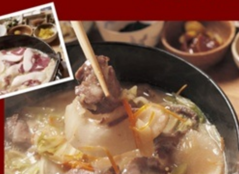
焼鍋/コース料理¥4,000～(要予約)

味噌仕立ての猪鍋は、とろけるほど美味しく柔らかい。和のジビエを、じっくりと堪能できます。