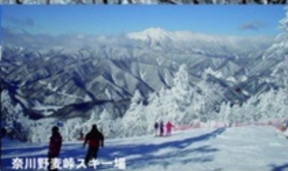
奈川野麦峠スキー場