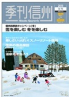
表紙デザイン・イラスト：藤田幸治 タイトル：【雪の牧場】長野県南佐久郡牧村