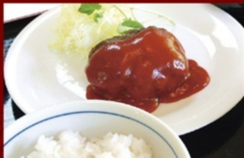
鹿肉ハンバーグ定食/¥900

村内で捕獲された新鮮な鹿肉の一番やわらかい、たたき用の背肉を使った「鹿のハンバーグ」が大人気。つなぎを使っていないのが自慢。また、「鹿の焼肉定食」「鹿のカレー」もおすすめ。