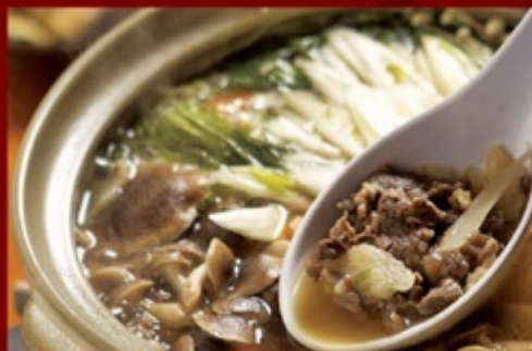
熊鍋/¥2,200(1人前・2人以上で要予約)

古来、秋山郷では、四季折々の山の恵みを糧として人々は暮らしていました。雄山荘の熊鍋は酒と醤油と砂糖だけであっさりした味付けです。