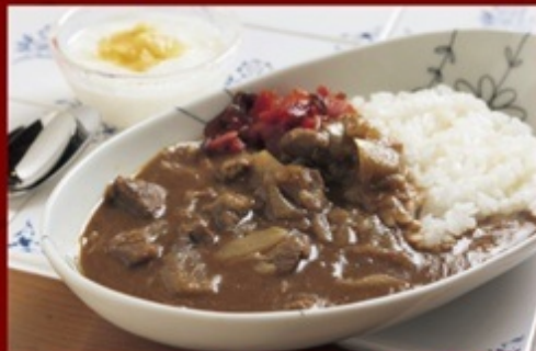
ジビエカレー/¥1,000 (3日前までに要事前予約)

カレーは、ジビエ初心者におすすめのメニューです。やわらかく煮込んだ鹿肉が、芳しい匂いで、食欲がわいてきます。