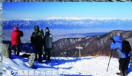
奥ヶ岳高原からの北アルプス