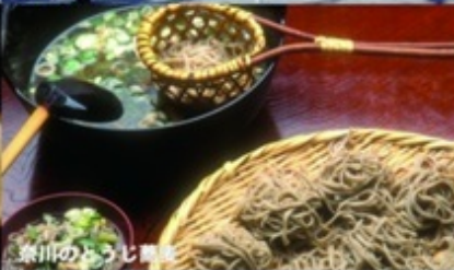
奈川のとうじ蕎麦