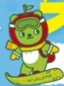
長野県観光PRキャラクター「アルクマ」