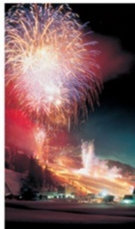
※写真は八方尾根スキー場