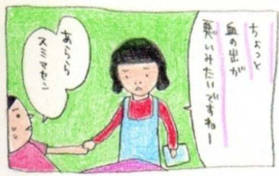
▲ ほっかいの太一なもの。