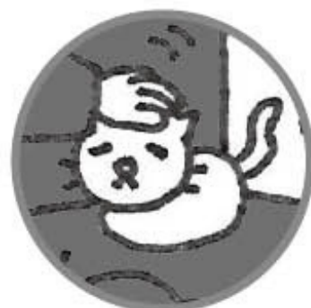
猫 ウメ (8才)