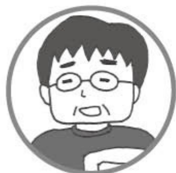
父 農 (51才)