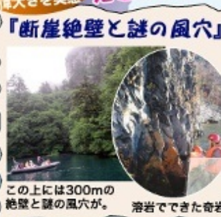
この上には300mの絶壁と謎の風穴が。溶岩でできた奇岩