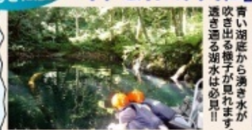
青い湖底から湧き水が吹き出る様子が見えます。遠く通る湖水は必見!!