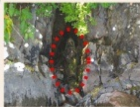
2011年8月に発見されたキリスト像

このボートツアーで2011年、異常洪水(3.11の影響?)した十和田湖の絶壁直下の水面下に伝説のキリスト像を発見しました。この像のある場所は「神代ヶ浦(かみやうら)」と呼ばれていた事もわかりました。約30年前、外国からの調査隊が発見できなかった伝説の像をこのツアーで発見!