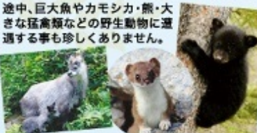
途中、巨大魚やカモシカ・熊・大きな猛禽類などの野生動物に遭遇する事も珍しくありません。

今年の夏は 何度も体験したくなる シュノーケリング 8月限定プラン 始めてみませんか? 1日いっぱい十和田湖を満喫しよう!!