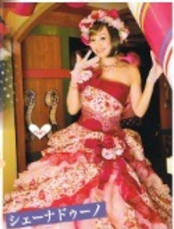
シェーナドゥーノ