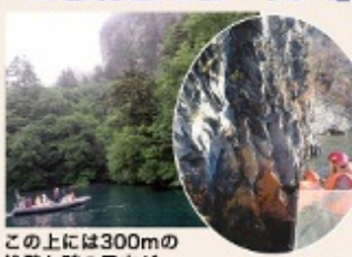
この上には300mの絶壁と謎の風穴が。 溶岩でできた奇岩