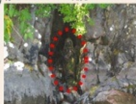
2011年8月に発見されたキリスト像

このボートツアーで2011年、異常満水(3.11の影響?)した十和田湖の絶壁直下の水面下に伝説のキリスト像を発見しました。この像のある場所は「神代ヶ浦(かみよがうら)」と呼ばれていた事もわかりました。約30年前、外国からの調査隊が発見できなかった伝説の像をこのツアーで発見!