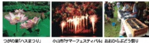
つがの里「ハスまつり」 小山市「サマーフェスティバル」 おおひらぶどう祭り