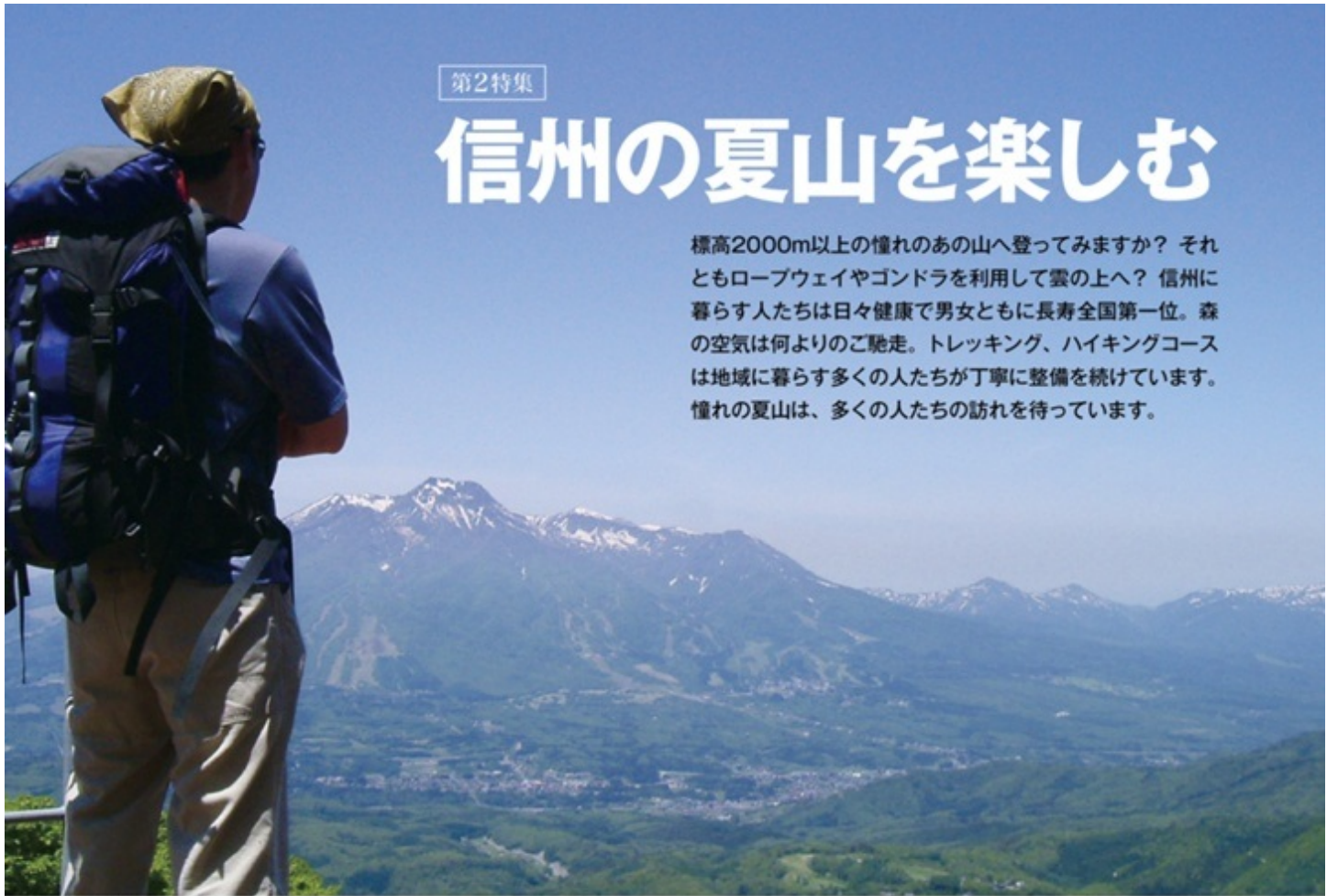
斑尾山(大明神岳)から妙高山を望む

標高2000m以上の憧れのあの山へ登って見ますか？ それともロープウェイや Gondola を利用して雲の上へ？ 信州に暮らす人たちは日々健康で男女ともに長寿全国第一位。森の空気は何よりのご馳走。トレッキング、ハイキングコースは地域に暮らす多くの人たちが丁寧に整備を続けています。憧れの夏山は、多くの人たちの訪れを待っています。