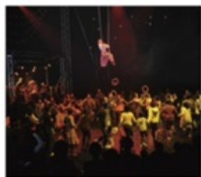
2011年にまつもと市民芸術館で公演の串田和美演出「空中キャバレー」の一場面から。舞台と観客が一体となり、秋本さん自身子舞のつかない、美しいのに怖い、独特の空間と時間が流れたという。再演となる今年は7月19日、20日、21日、24日、25日、26日、27日、28日に開催。

夏の思い出としては、小学校5、6年生のときに、美ヶ原高原に行ったのをよく覚えています。7、8時間かけて歩いて登り、何泊かして、また下りてくる……。今思うと、よく歩きましたよね（笑）。おかげで今でも山歩きは大好き。