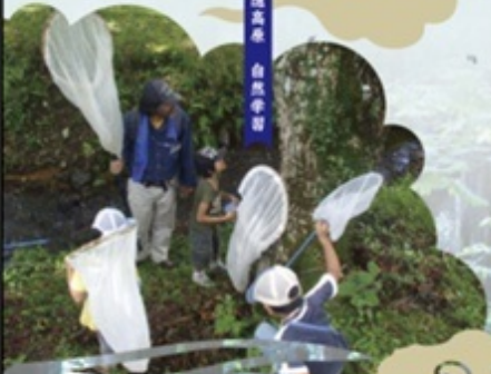
戸隠高原 自然学習