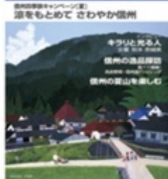
表紙デザイン・イラスト：原田幸治 タイトル：【真夏の午後】長野県上田市真田町