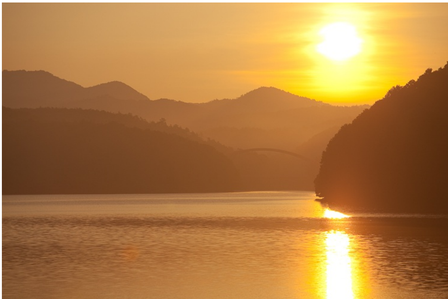
久しぶりの入鹿池。 2010.07.23 犬山