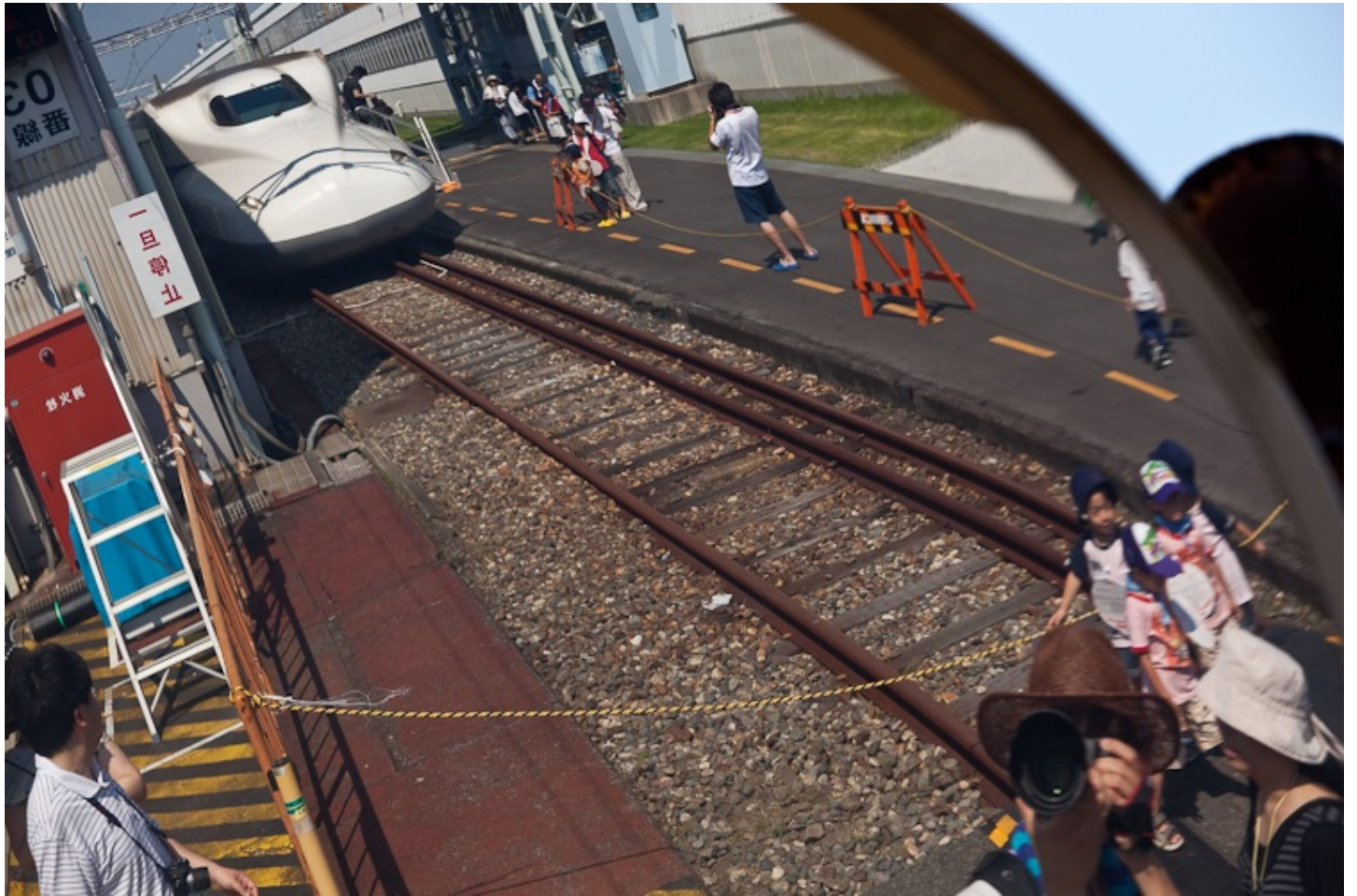
ボクはここにいるよ。 2010.07.24 浜松