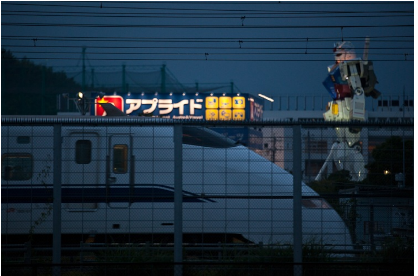
ガンダムと新幹線...日が沈みすぎた^^; 2010.07.24 東静岡駅