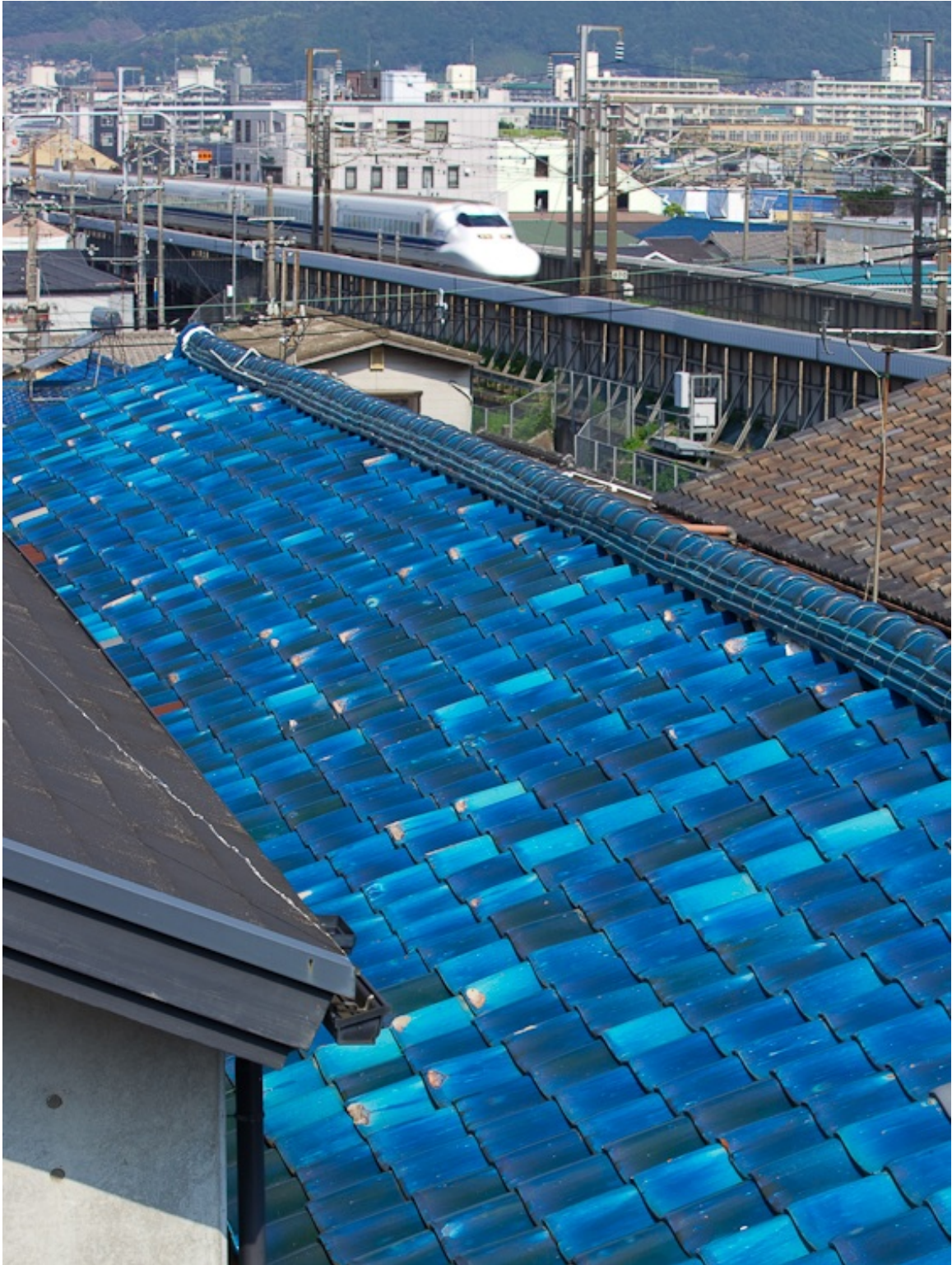
ブルーの瓦屋根。 2010.07.26 京都