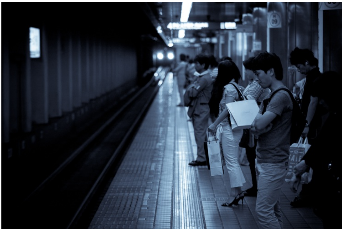
友達が名古屋に来た。 2010.07.10 名古屋