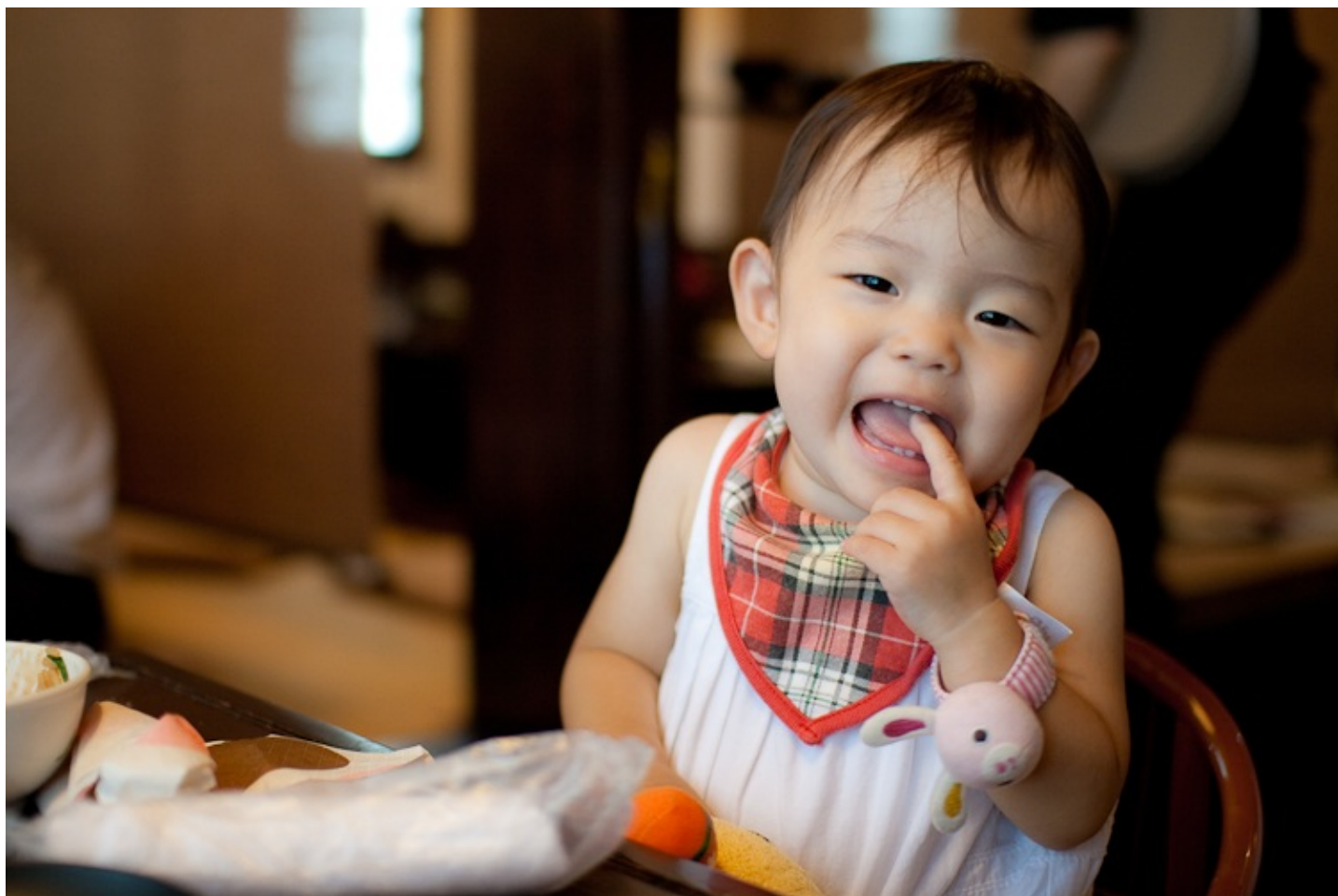
同級生とランチ行って来た。産まれて来たら電車見に行きまくちゃうよ。 2010.07.11 一宮