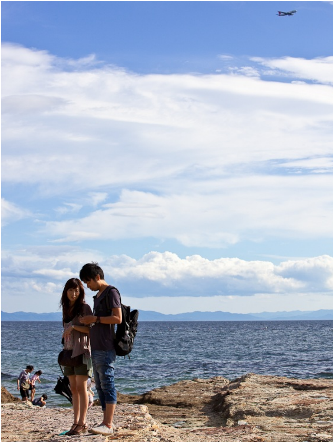
飛行機とパシャリ。居る居ないじゃ違う。そーゆー事。こーゆー事。 2010.07.04 常滑