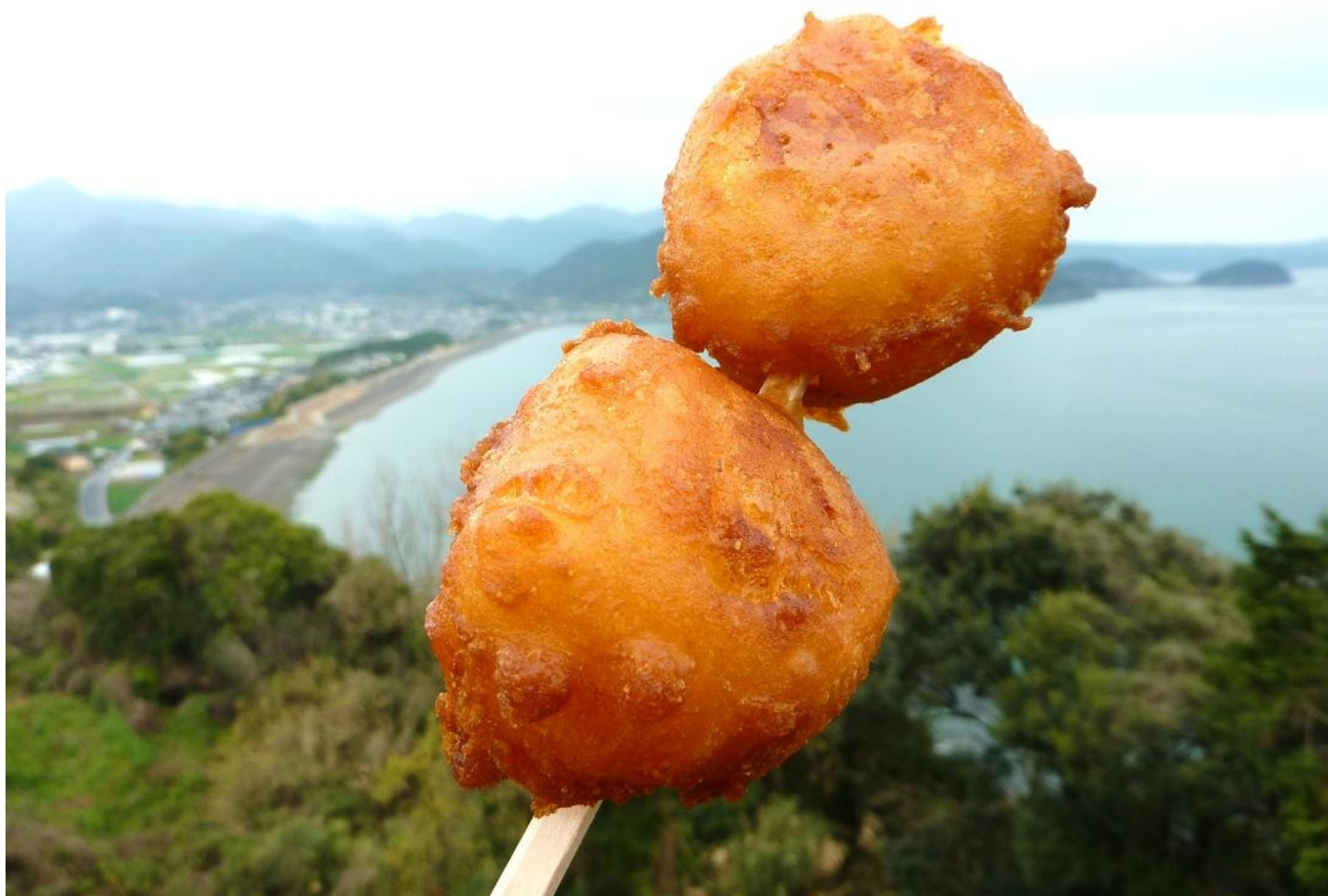
ここは 島原半島の入口、橘湾。