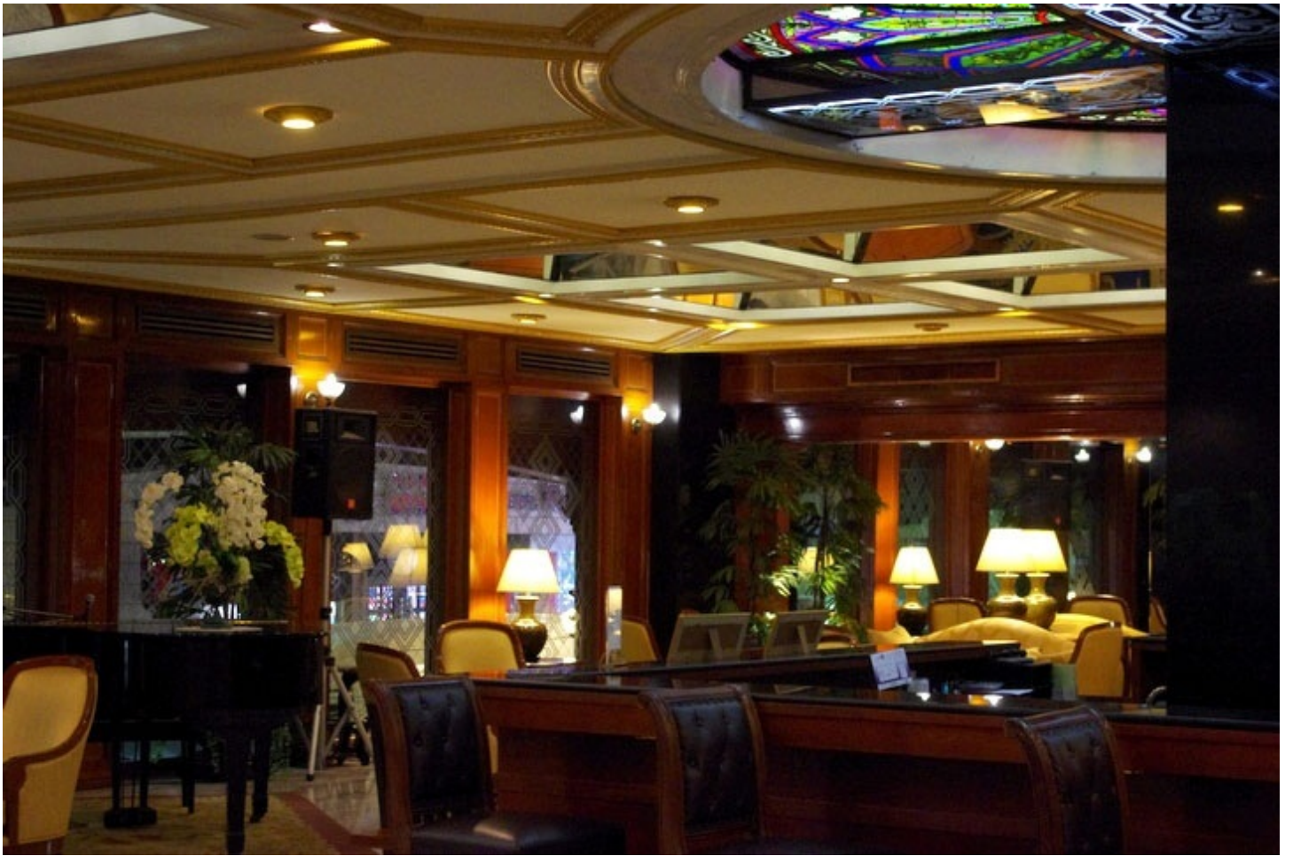
宿泊したバンコクのホテル。市街地へのアクセスも良く、快適でした。