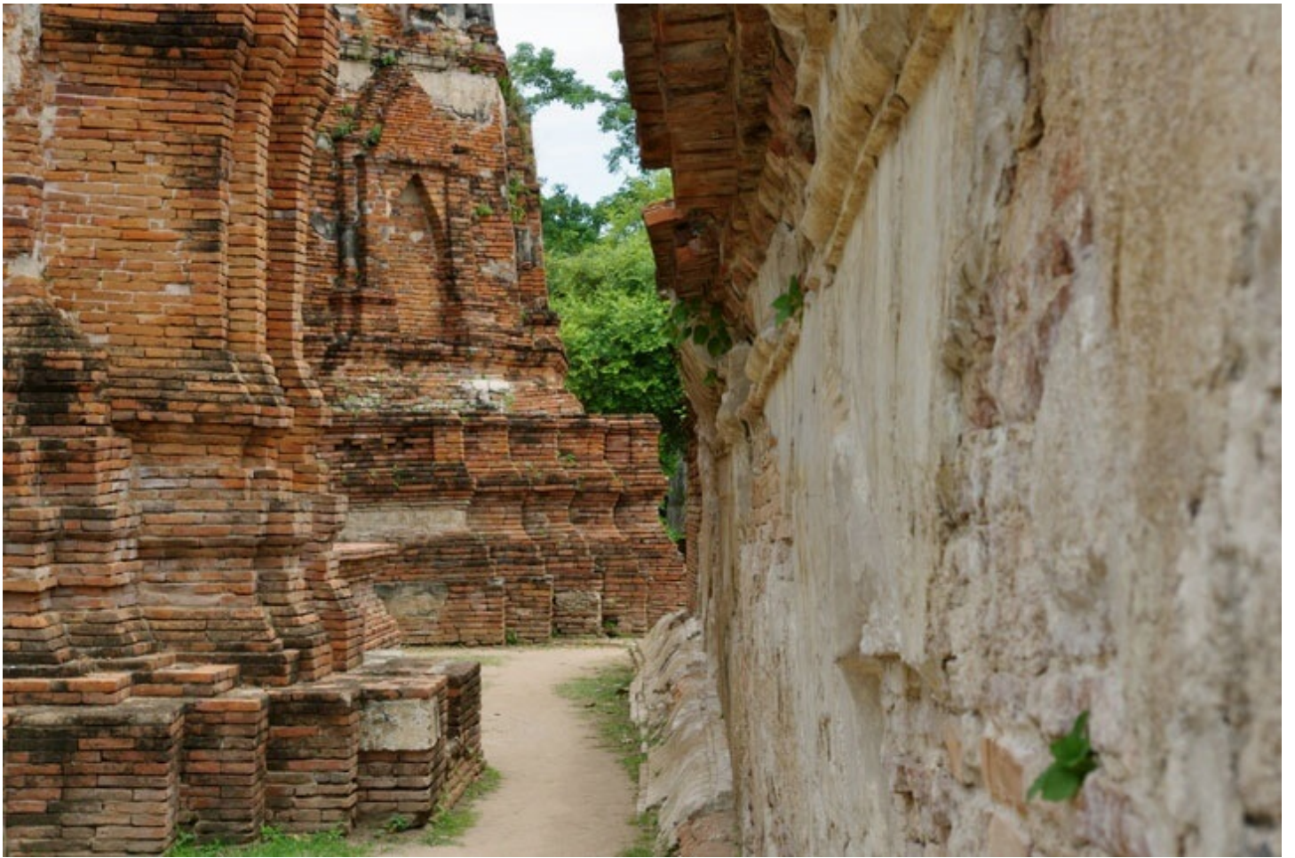
13世紀に建てられた寺院、ワットマ・ハタート。