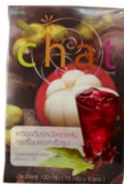
マンゴスチンジュース