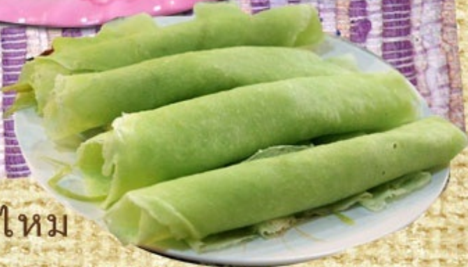
โรตีสายไหม