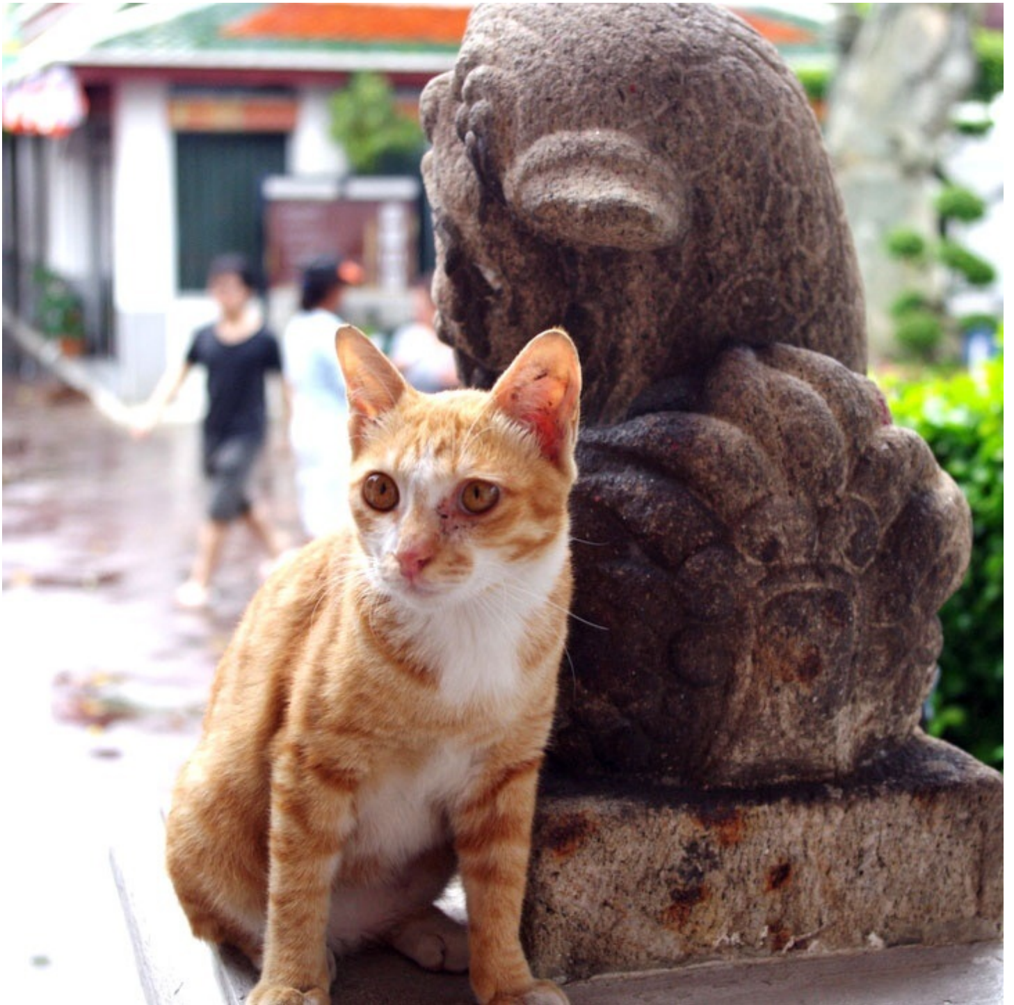
寝釈迦仏で有名なワット・ポーに行きました。寺院の中にいた猫。