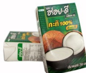
ココナッツミルク