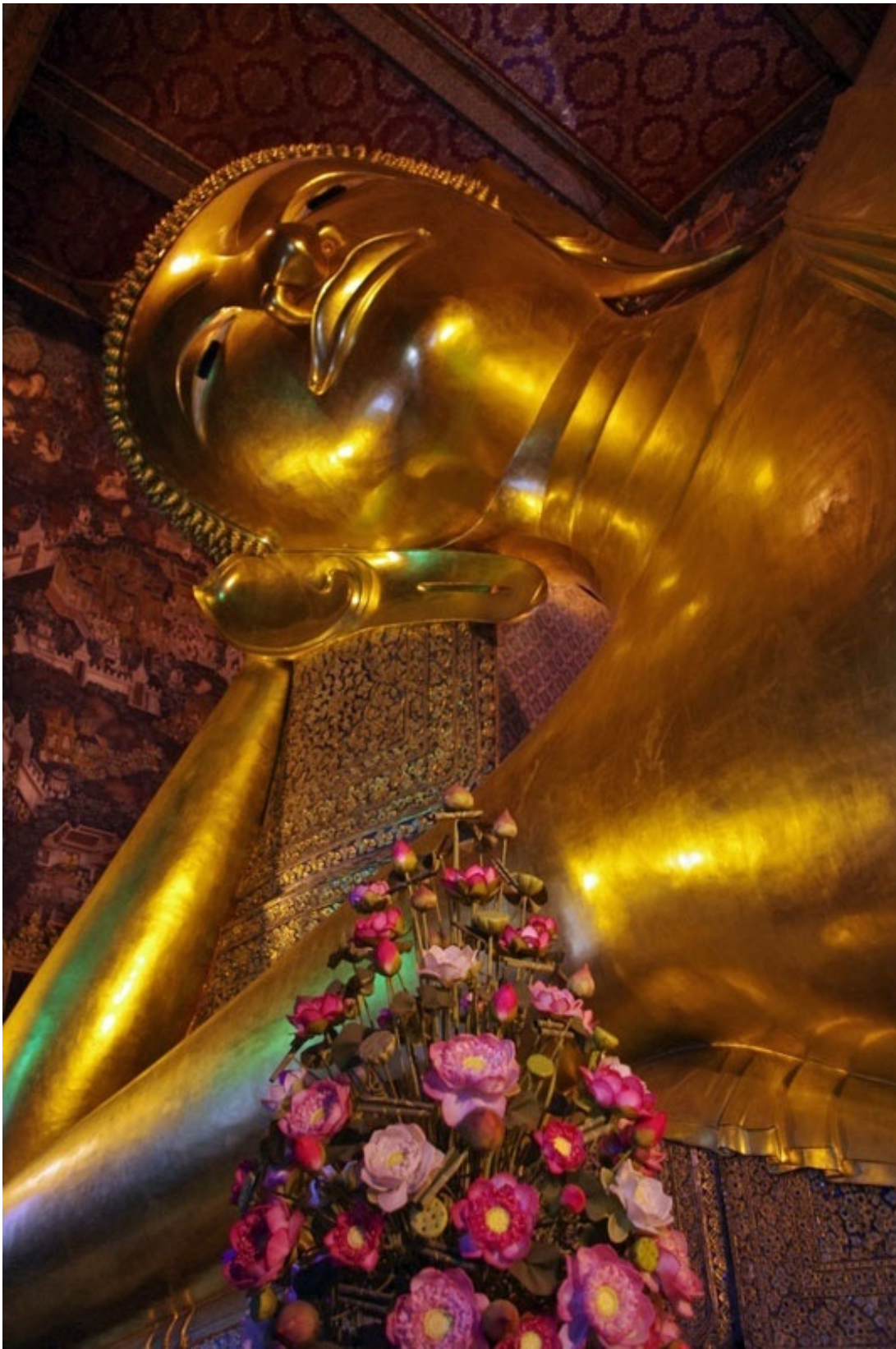
黄金に輝く涅槃仏。全長46メートル、高さは15メートルです。