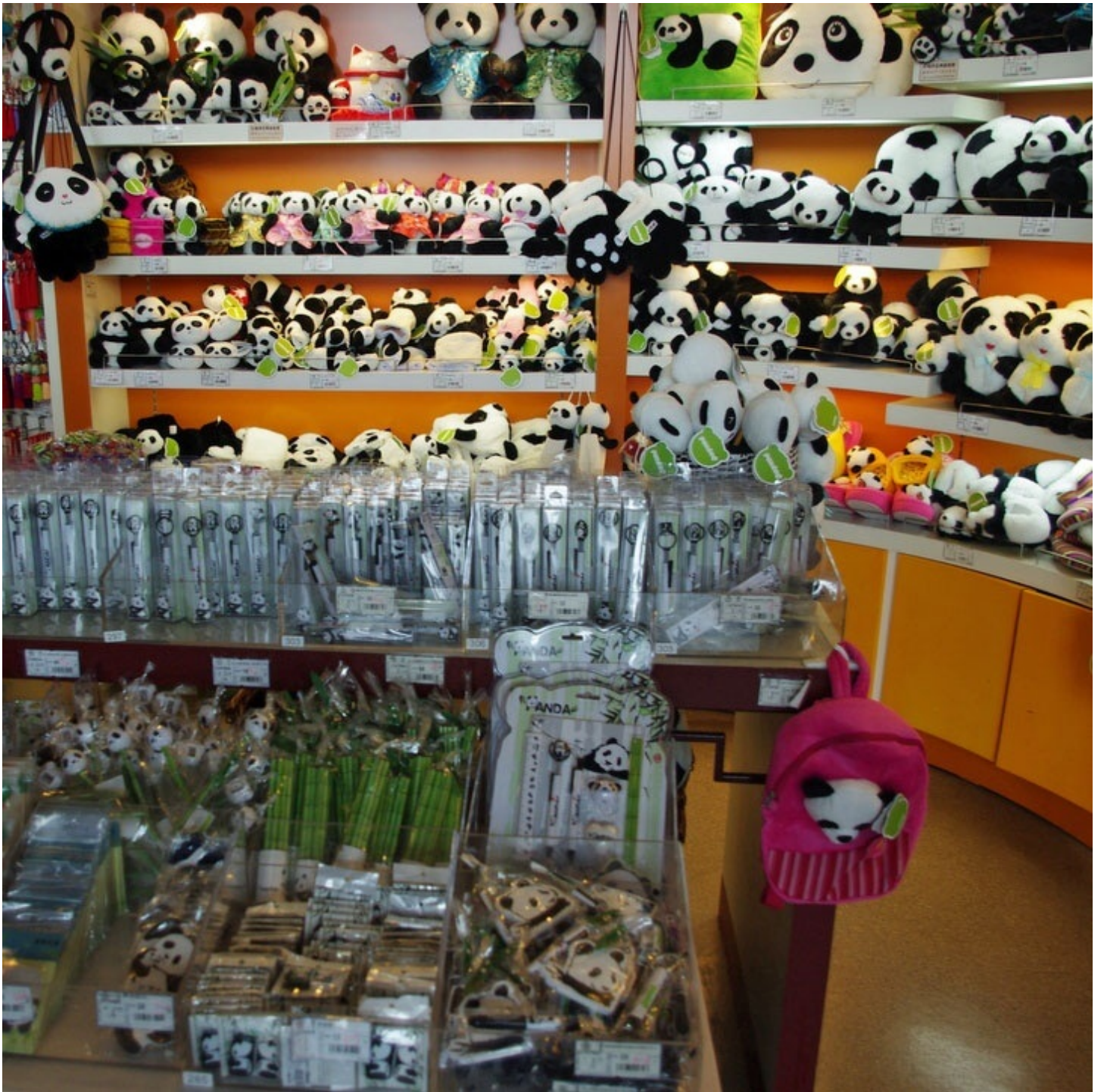
上海の空港ではパンダのグッズがたくさん売られていました。