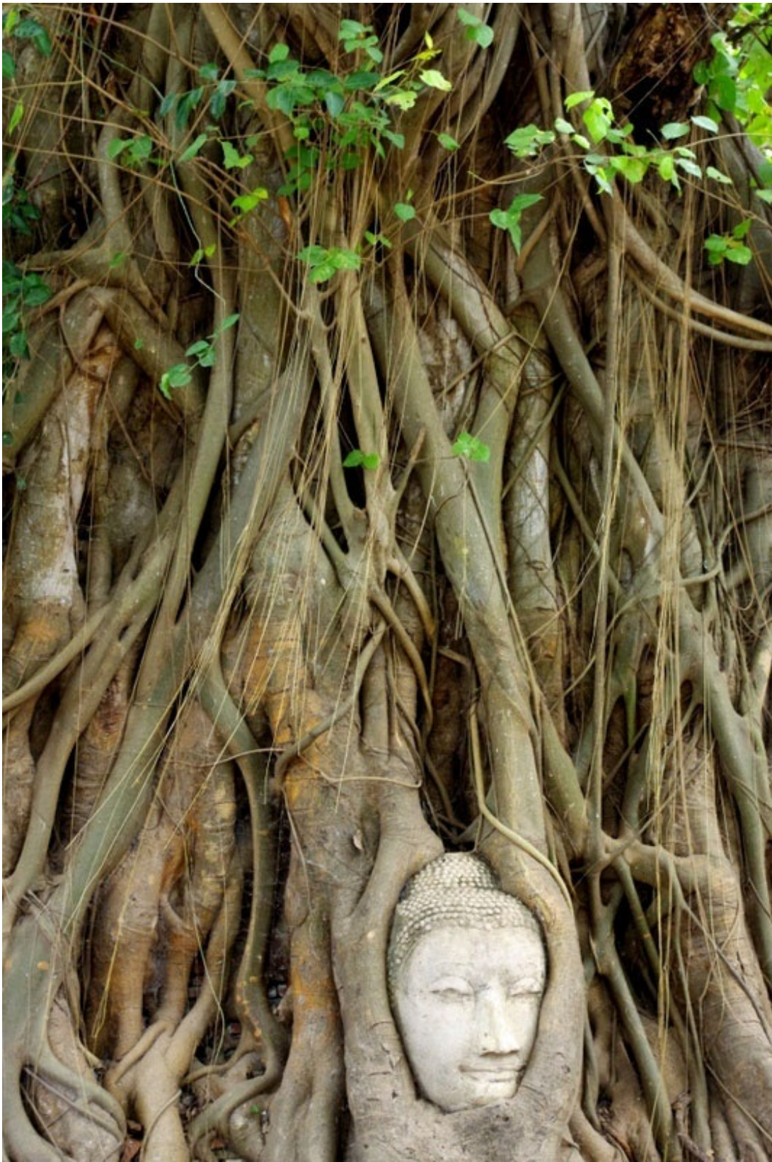
菩提樹の根に埋まった仏像の頭。