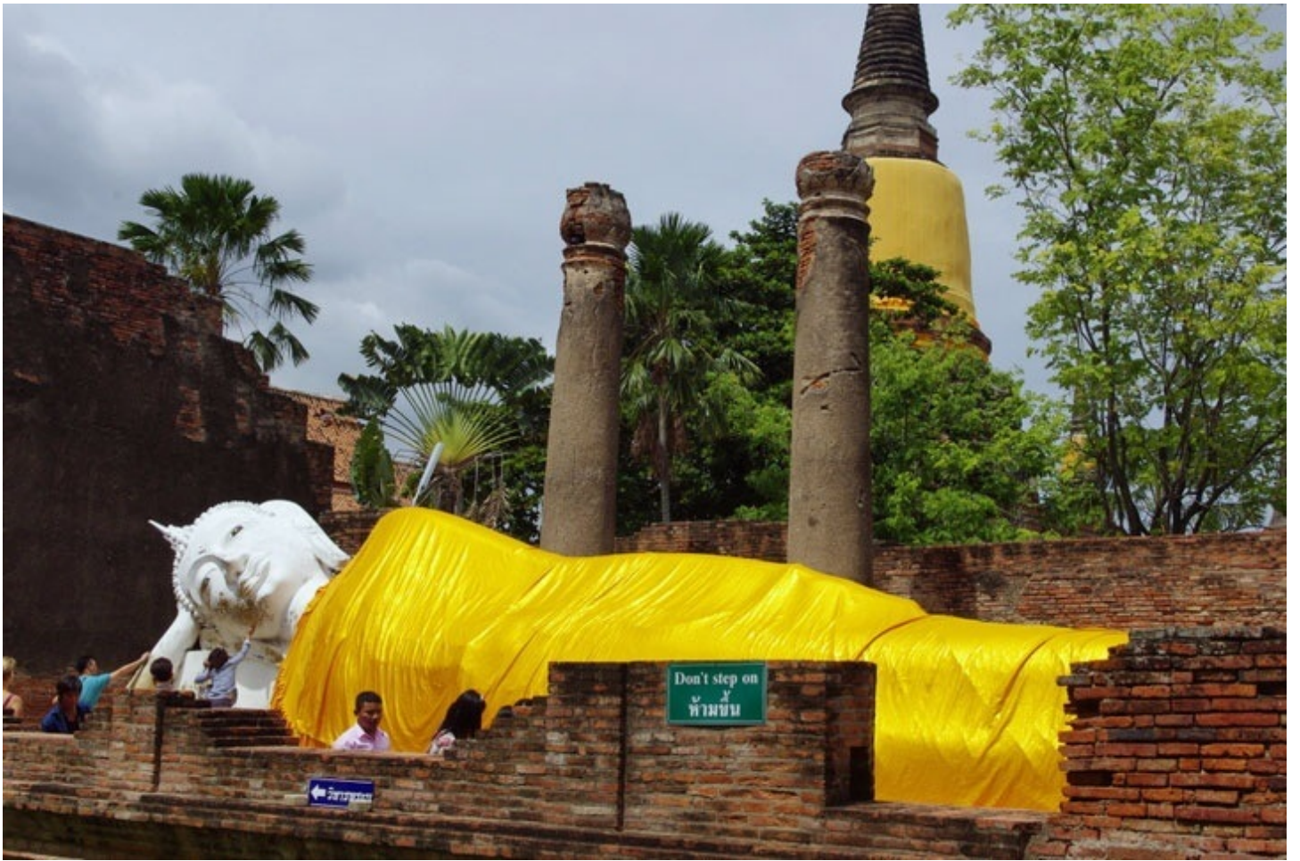
ワット・ヤイチャイモンコンの寝釈迦像。