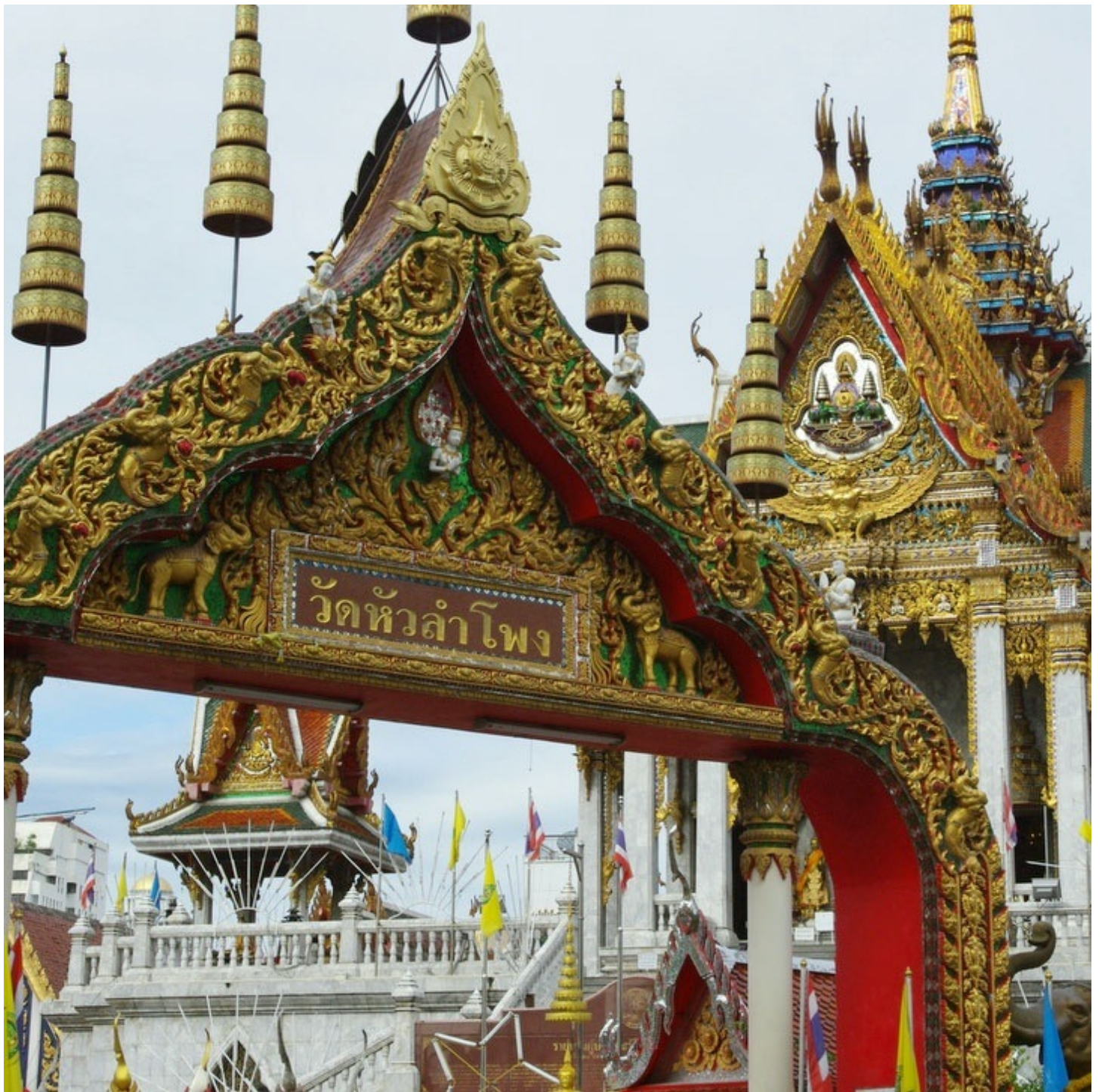
ホテルの近くの寺院「ワット・ファランポン」。