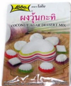
デザートミックス