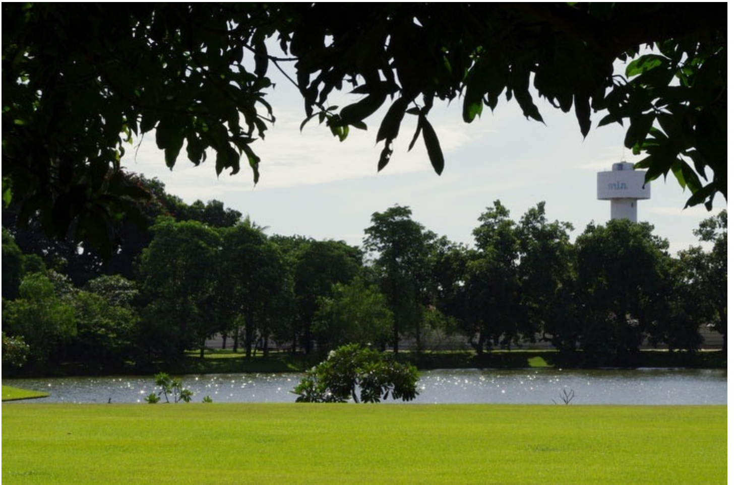
タイ国王の別荘であるバンパイン宮殿。