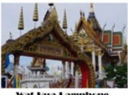
Wat Hua Lamphong