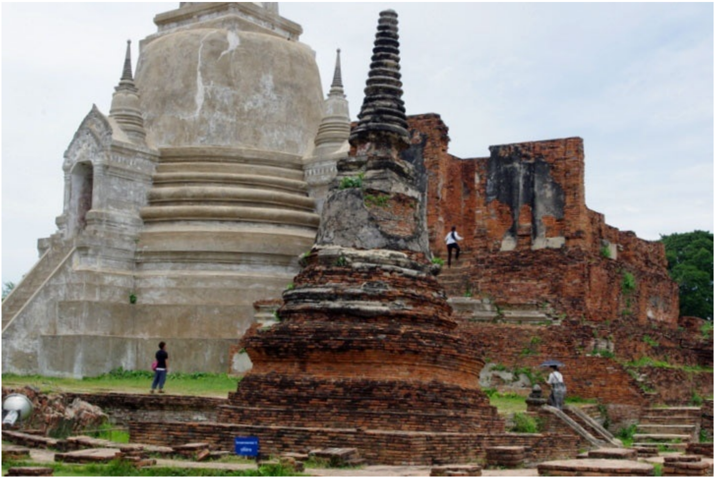
歴代の3人の王が眠る、ワット・プラ・シーサンペット。