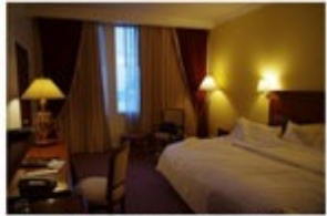
The Tawana Bangkok