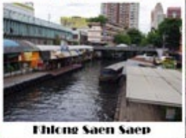
Ekkhaya Saen Saep