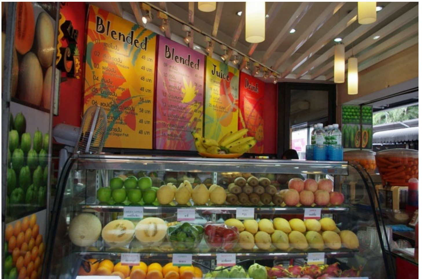
新鮮なフルーツを使ったジュースのお店。