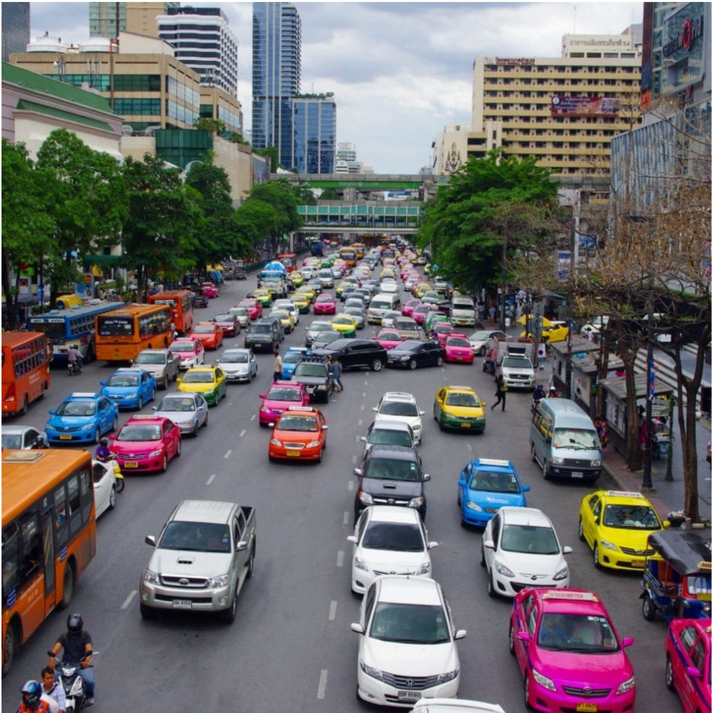
タイのタクシーはカラフルです。