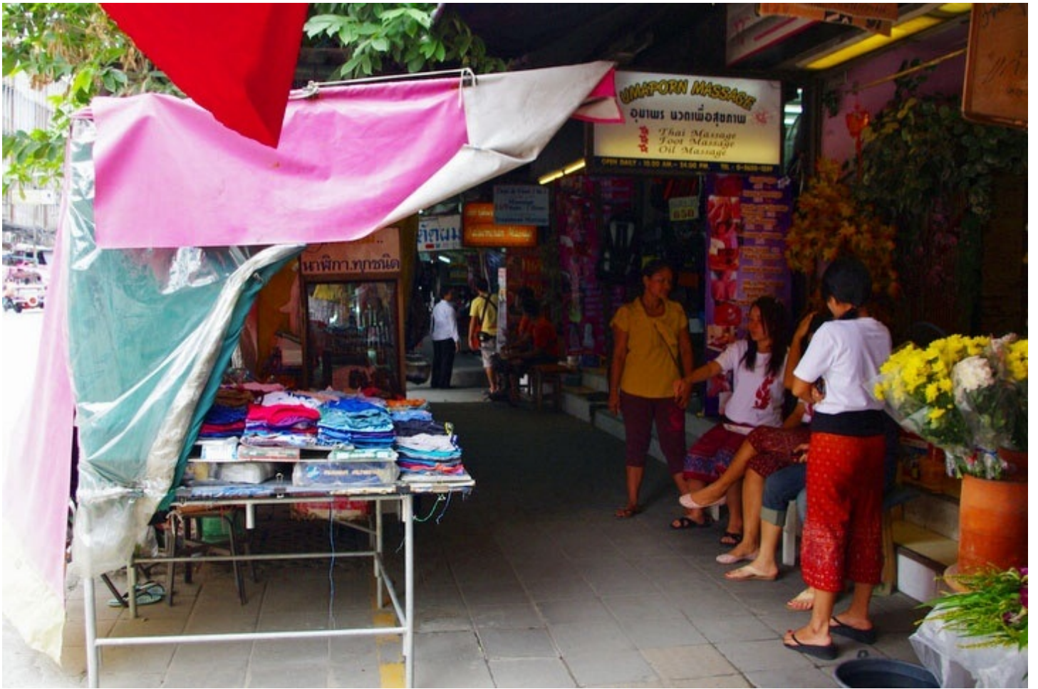
格安で服が手に入る問屋街のマーケット。