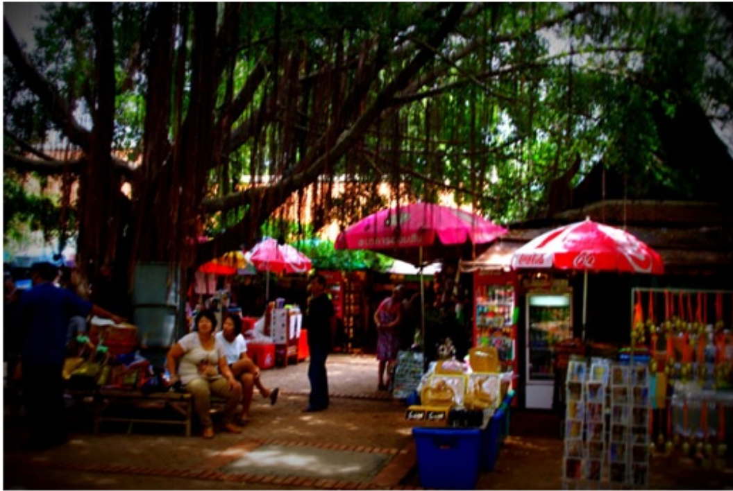
ワット・プラ・マハタートの売店。