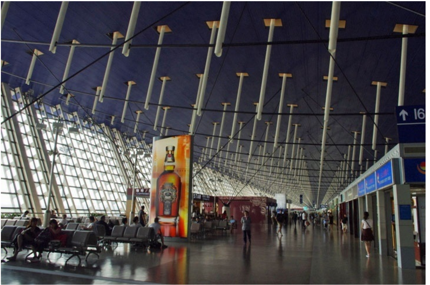
上海の空港で乗り継ぎ、タイへ向かいました。