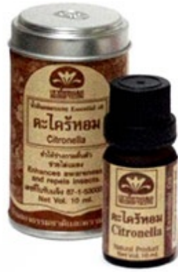
エッセンシャルオイル