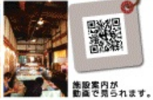
館内案内が動画で見られます。