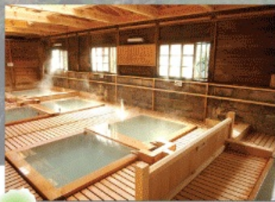
那須本 名湯1300年の鹿の湯

ひなびた木造建築が何ともいえない風情あふれる「鹿の湯」。白湯で那須の名湯を楽しめると多くの人が訪れます。白濁の湯を存分に堪能してください。