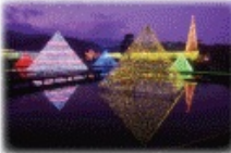
1月中旬まで開催しています