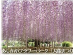
4月 あしかがフラワーパーク「大藤まつり」