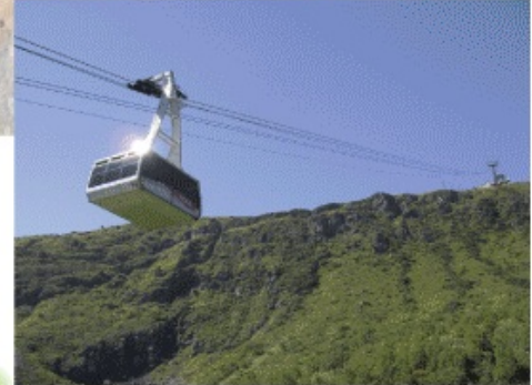
那須本 ロープウェイからの雄大な景色

山頂駅（9合目）までロープウェイで関東を代表する活火山に登って望む景色は、織り成す緑と青い空。漣がよければ雲の上です。山頂までも歩いて50分程なので軽いトレッキングにもおすすめです。