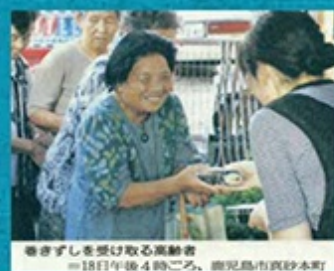
巻き寿司を受け取る高齢者 ＝15日午後4時ごろ、西尾島市西砂本町

少しでも地域へお返しをしたい…。創業当時から続いているのが「敬老の日の巻き寿司無料プレゼント」。毎年10月〇日、朝早くから仕込みをして巻き終わるころには、一人二人とご近所の高齢者がおみえになります。一人ひと