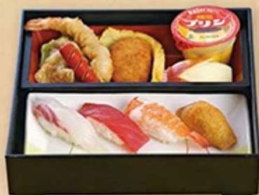
● お子様膳 1,260円