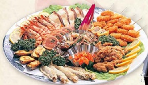
● オードブル 6,300円