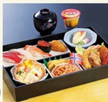
● お祝いお子様膳 2,100円(吸い物付)