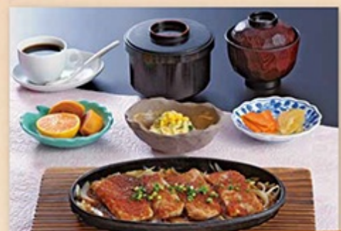
●マグロステーキランチ 1,050円 肉厚のマグロステーキ・サラダ・ご飯・吸い物・香の物・デザート・コーヒー