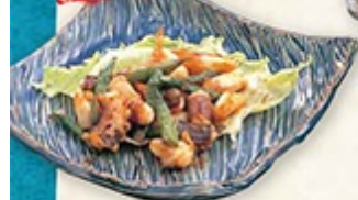
イカゲン みそバター 炒め