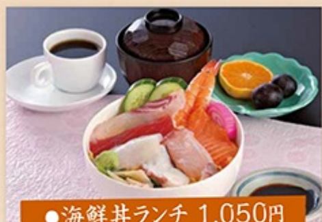
●海鮮丼ランチ 1,050円 ネタがぎっしりの海鮮丼・吸い物・デザート・コーヒー