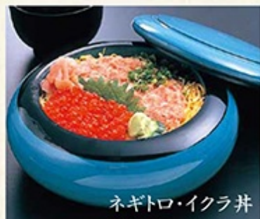
ネギトロ・イクラ丼