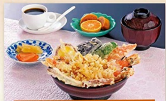
●天丼ランチ 850円 有頭大えび2尾と野菜の天丼・吸い物・香の物・デザート・コーヒー