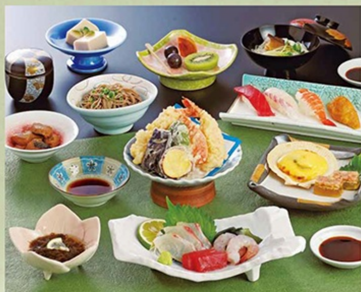
●法事会席 お一人様 3,200円より

法事が済んだら大切なお客様をおもてなし。皆さまで手作り、出来立てのお料理をお召し上がりください。