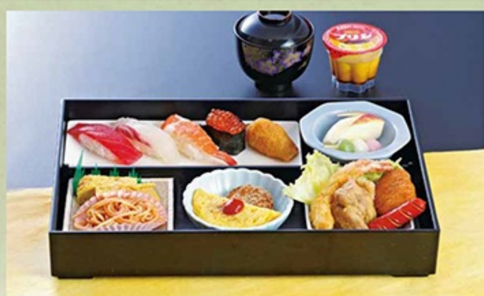
●お子様法事御膳 2,000円 (暖い物付)