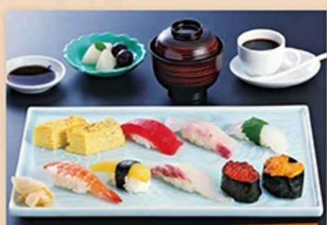
●上寿司ランチ 2,100円 にぎり寿司8個・吸い物・デザート・コーヒー