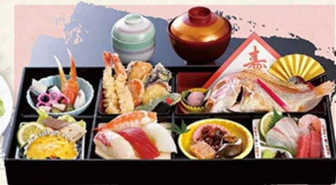
● お祝い松華堂 3,150円 (茶碗蒸し・吸い物付)