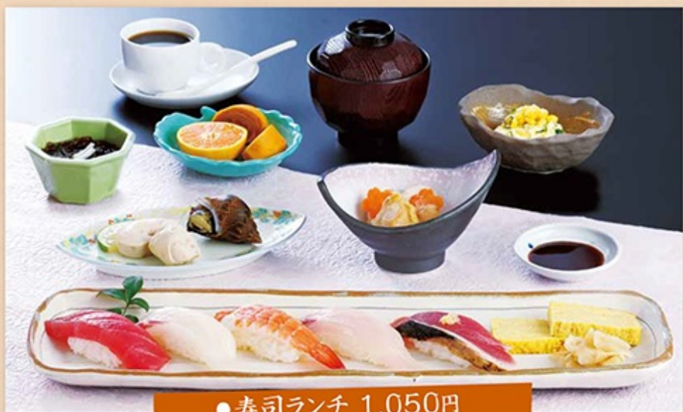
●寿司ランチ 1,050円 にぎり寿司5個・小鉢2品・煎の物・サラダ・吸い物・デザート・コーヒー