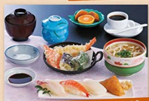
●寿司・天ぷら・うどんセット 1,050円 にぎり寿司・天ぷら・うどん・茶碗蒸し・吸い物・デザート・コーヒー