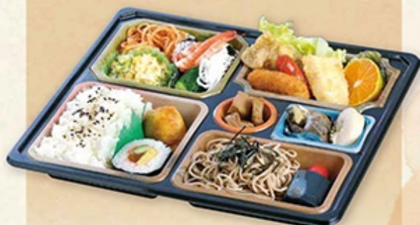
● パック弁当 1,050円 サービス品につきご注文は10個より承ります。