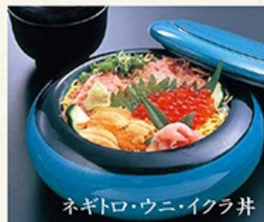
ネギトロ・ウニ・イクラ丼