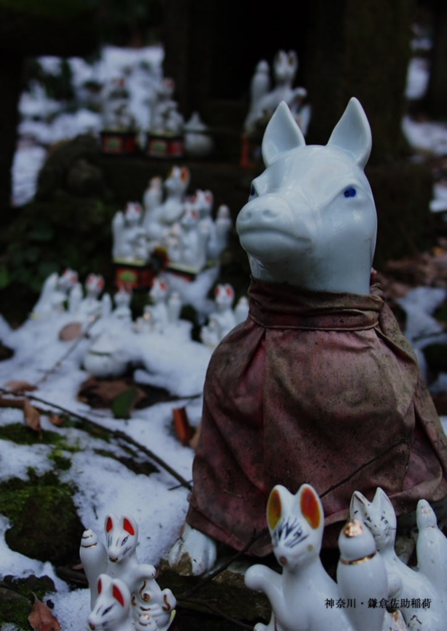
神奈川・鎌倉佐助稲荷