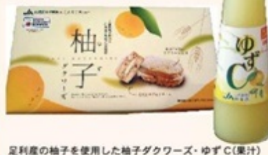
足利産の柚子を使用した柚子ダクワーズ・ゆずC(果汁)

大海原のような足利の麦秋は圧巻です! 大麦の食文化体験など盛りだくさんの1日をお楽しみいただけます。