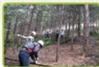
森林整備活動に活用します

【信州森林ecoコイン】のお問い合わせ先 信州キャンペーン実行委員会(事務局:長野県観光部観光振興課)