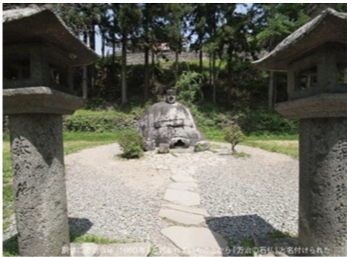
野沢温泉村のあちこちで見かける「湯」の文字は岡本太郎の手によるもの