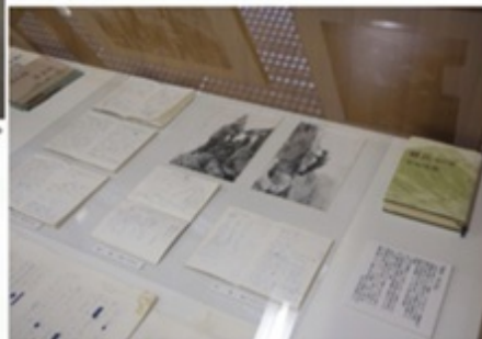
直筆のノートは取材メモ。執筆の原稿も展示されている