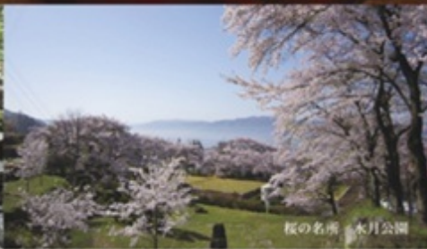
桜の名所 水月公園