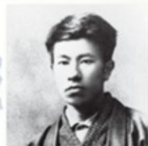
2 島崎藤村 小諸市・馬籠