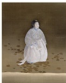
「菊慈童」（部分） 飯田市美術博物館 蔵

日本画家、1874（明治7）年、飯田藩士の子として生まれる。1890年に東京美術学校に入学。美術院に参加し、「朦朧体」の研究に取り組む。その後、東洋と西洋の美術を見聞し、新たな画風を模索した。飯田市美術博物館では30作品を所蔵。