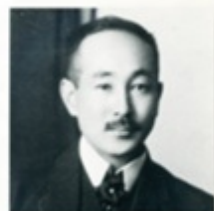
3 有島武郎 軽井沢町