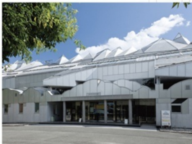
飯田市美術博物館。建物自体が美しい工芸品のよう