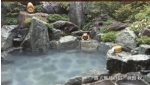
露天風呂の宮 旅館 紋