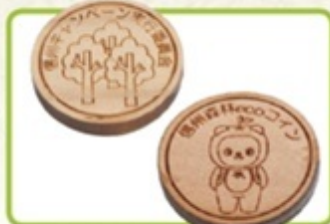
フロントで、コインを回収箱に