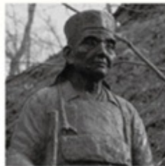
1 小林一茶 信濃町・小布施町・中野市・須坂市 山ノ内町・高山村・飯綱町・長野市