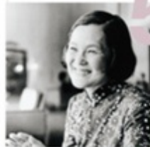
5 いわさきちひろ 松川村・信濃町