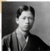
8 菱田春草 飯田市