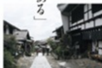
風情ある石畳が続く馬籠宿。明治の大火で焼失した生家跡地に藤村記念館が建つ