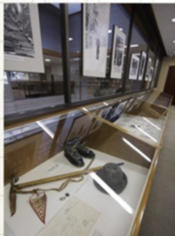
山岳小説さながらの装備で登山も行う。当時の靴やビッケルに球がある

市民の憩いの場として親しまれる図書館。上諏訪生まれの新田次郎の作品を展示している。その場にいるような、実際のボードレイアウトが飾ってあり、記念室内には直筆のノートも展示されている。 諏訪市海岸通り5-12-1B ☎0266-52-0429 営業・木は9時30分～18時30分、火・金は9時30分～19時、土・日、祝は10～18時 休毎週月曜、月末館内整理日(月曜以外の最後の平日)