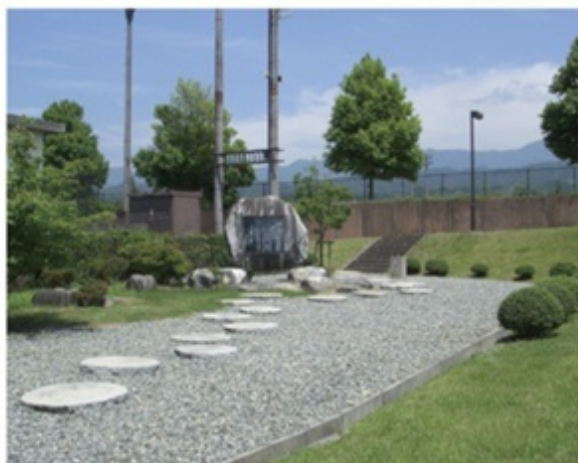
「ハイジの碑公園」には、鳩十の随筆の一節が碑となっている