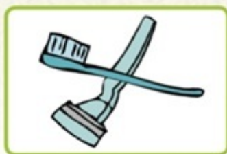
対象のアメニティを使わなかったら