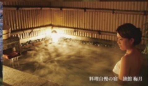
料理自慢の宮 旅館 梅月