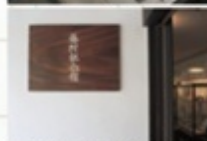
小諸市立藤村記念館では長男の精進氏による書道品を中心に約2000の資料を所蔵