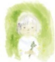
わらびを持つ少女 「あかまんまとうげ」(集社)より 1972年