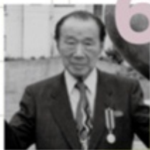
6 岡本太郎 野沢温泉村 下諏訪町