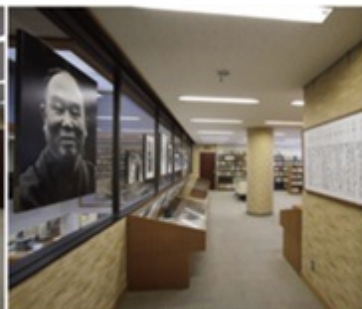
昨年、生誕100周年を数えた新田次郎のボードレイアウトが遊んでくれる展示場