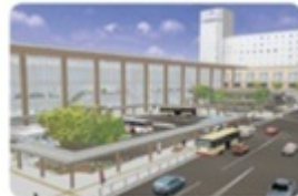
JR長野駅前再整備中(2015年春完成予定) ※イメージのため変更があります

モーツァルトが流れる伝統の酒蔵、予約で見学・試飲も可。 佐藤市岩船190 ☎0269-22-2503 立ヶ花駅から車で10分