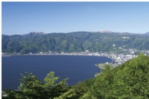
上諏訪で育った新田次郎。諏訪の美しい自然から出来上がった作品も多い