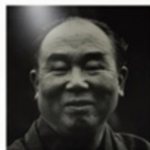
9 新田次郎 諏訪市