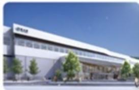
北陸新幹線飯山駅建設中(2015年春完成予定) ※北陸新幹線飯山駅デザイン原案

県内契約栽培による質の高い酒米使用の純米吟醸酒が自慢。 佐藤山市豊野町772-2 ☎026-257-3472 信濃支庁駅から徒歩3分 蔵見学要予約 松本本社：☎0263-47-0895