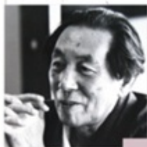
7 椋鳩十 喬木村