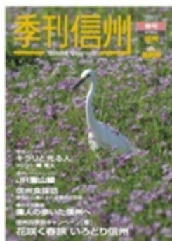
表紙デザイン：原田孝治（飯田市・白鷺）