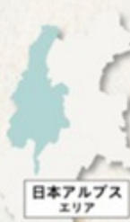
日本アルプス エリア

甘 いものを食べる瞬間のときめき は、五感をかなり刺激してくれるもの。特に春のスイーツは、長かった冬を越え、新しい季節がやってくる予感が伝わってくるようです。 お花見回りをたっぷり楽しんだあとの、次のお楽しみはやはり甘味ではないでしょうか。春の花をモチーフにしたものや、桜の塩漬けを添えたもの、旬のいちごをたっぷり使ったものにも、よもぎやお葉など春の息吹を感じさせるものまでさまざま、選ぶのに迷ってしまいます。食べる前からこれほどまでに心を弾ませてくれるスイーツには、春の午後の日だまりがよく似合います。