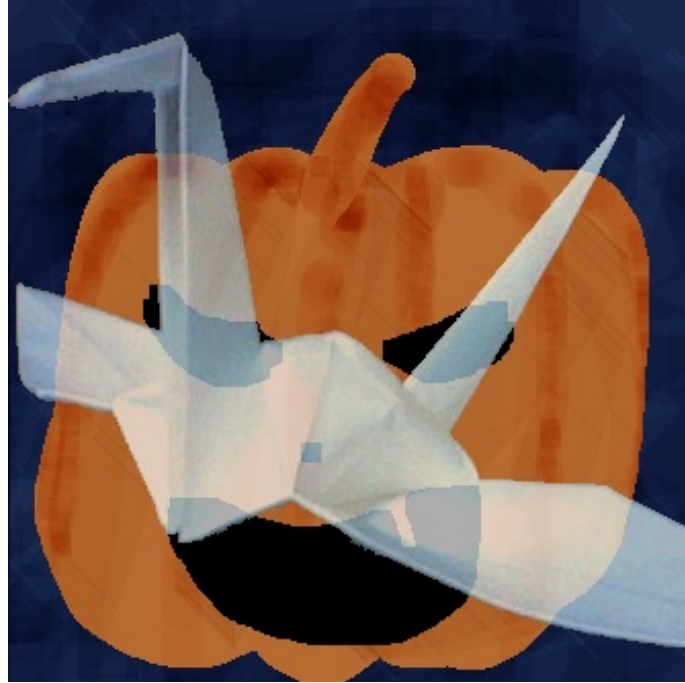
このクオで祭りをするという度胸 by タカト