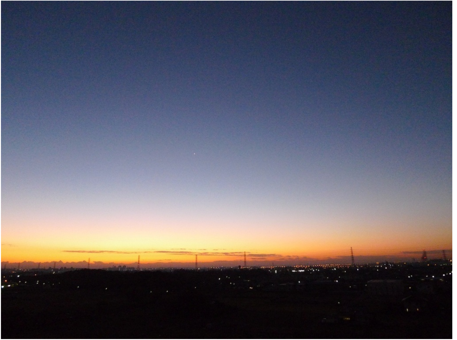
自宅のベランダから撮影した朝日上の直前です。