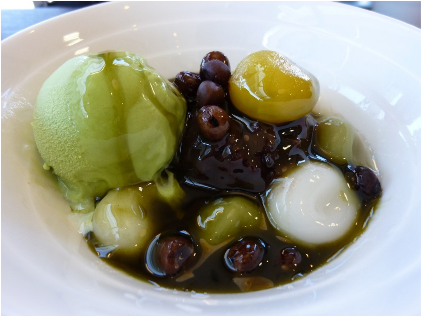
3枚目の写真はあんみつに蜜をかけたあとのものです。美味しかったですよ。