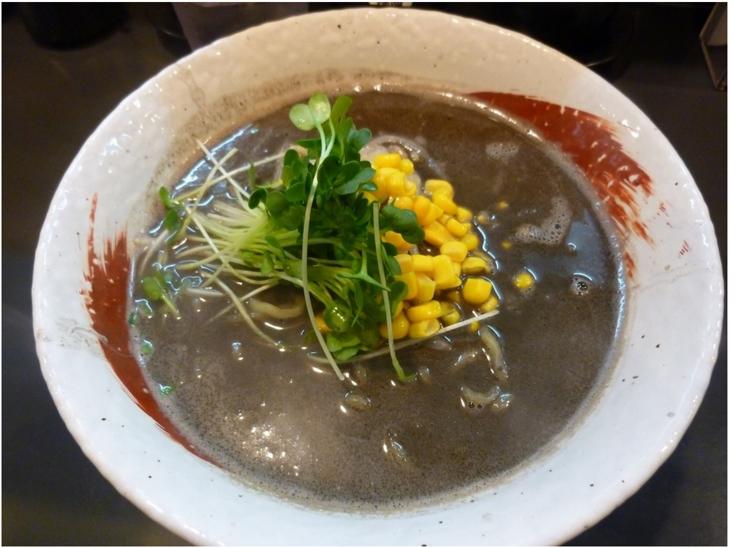
ごまペーストラーメン、ケーキ、わらび餅、そしてアナゴがはみでた天丼です。