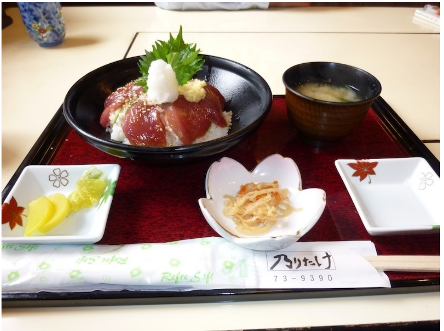
ジブンは刺身定食で、まずは刺身のアップ・・・