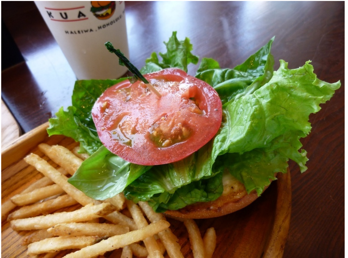
レタスとトマトが載った上側。 間のポテトスティックも中々に美味しかったです。