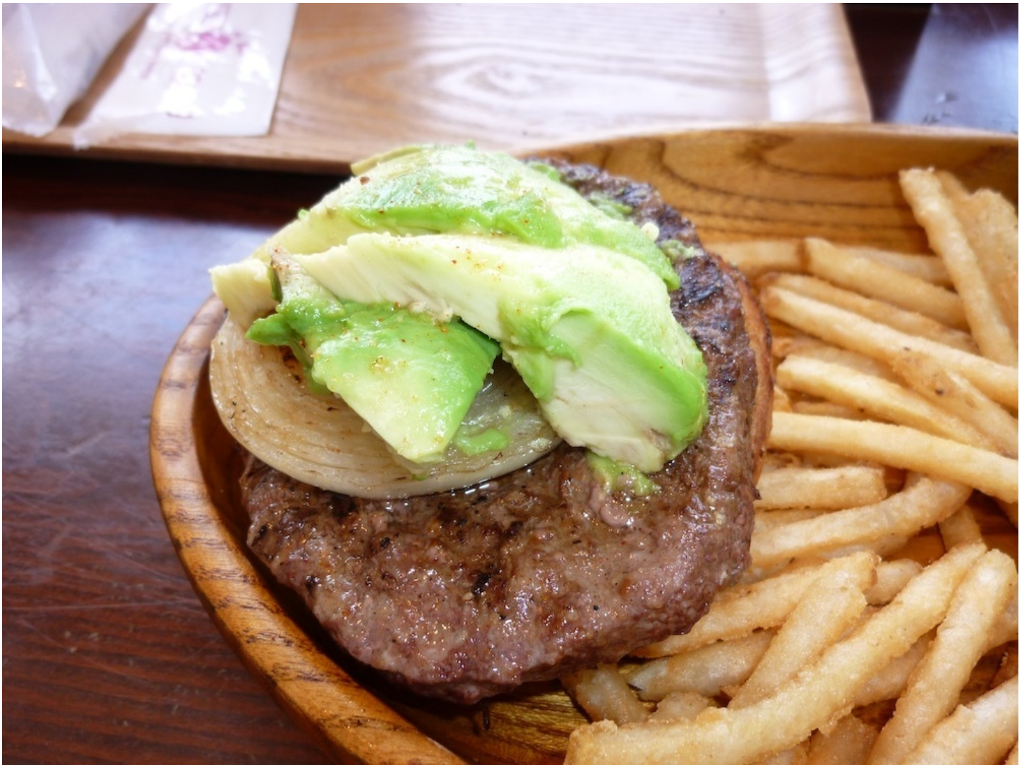
パテの上に乗っているのはアボガドです。見えにくいですが、下にパンズがあります。