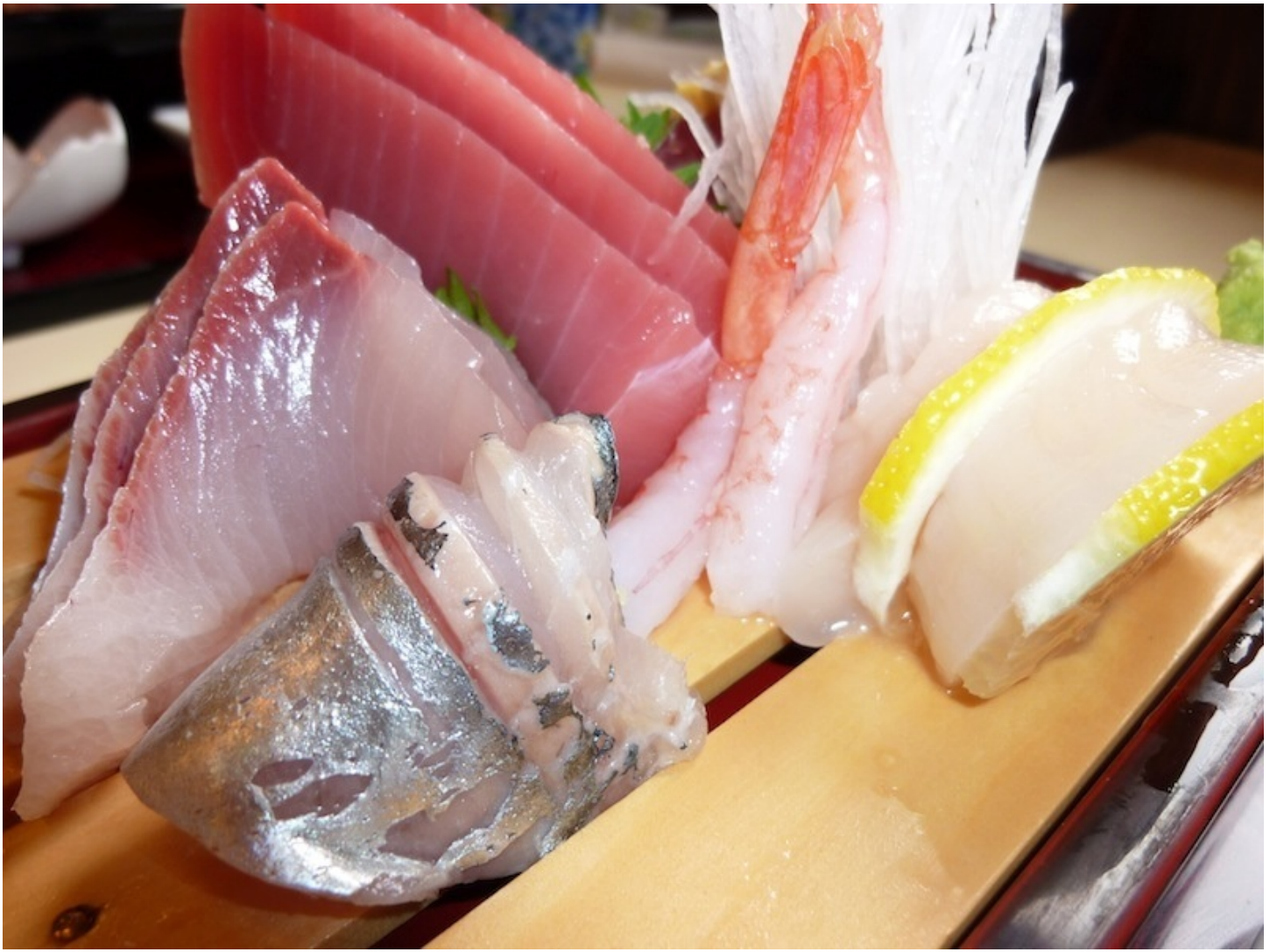
刺身定食の全体像です。