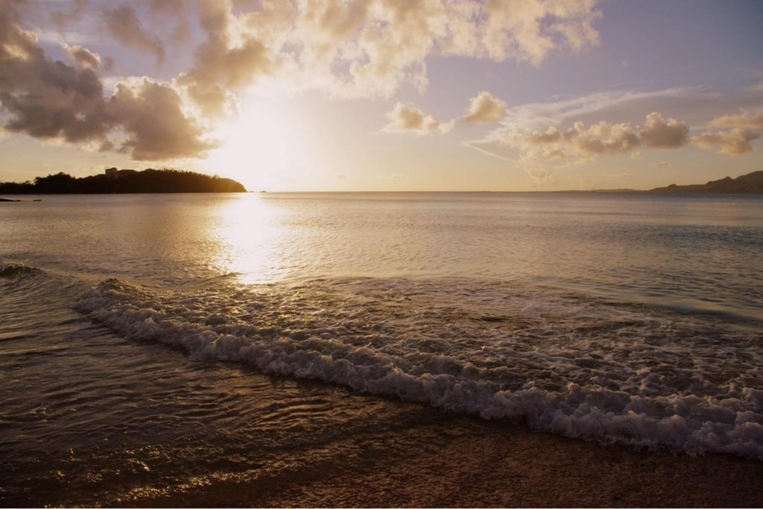
夕暮れの穏やかなビーチ。