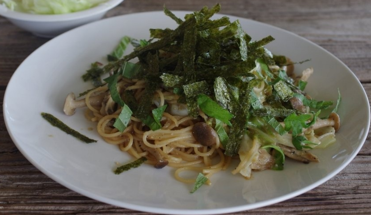
青菜とキノコの和風ペロンチーノ。ナチュラルでカントリーなテイストの店内では、雑貨も販売していました。