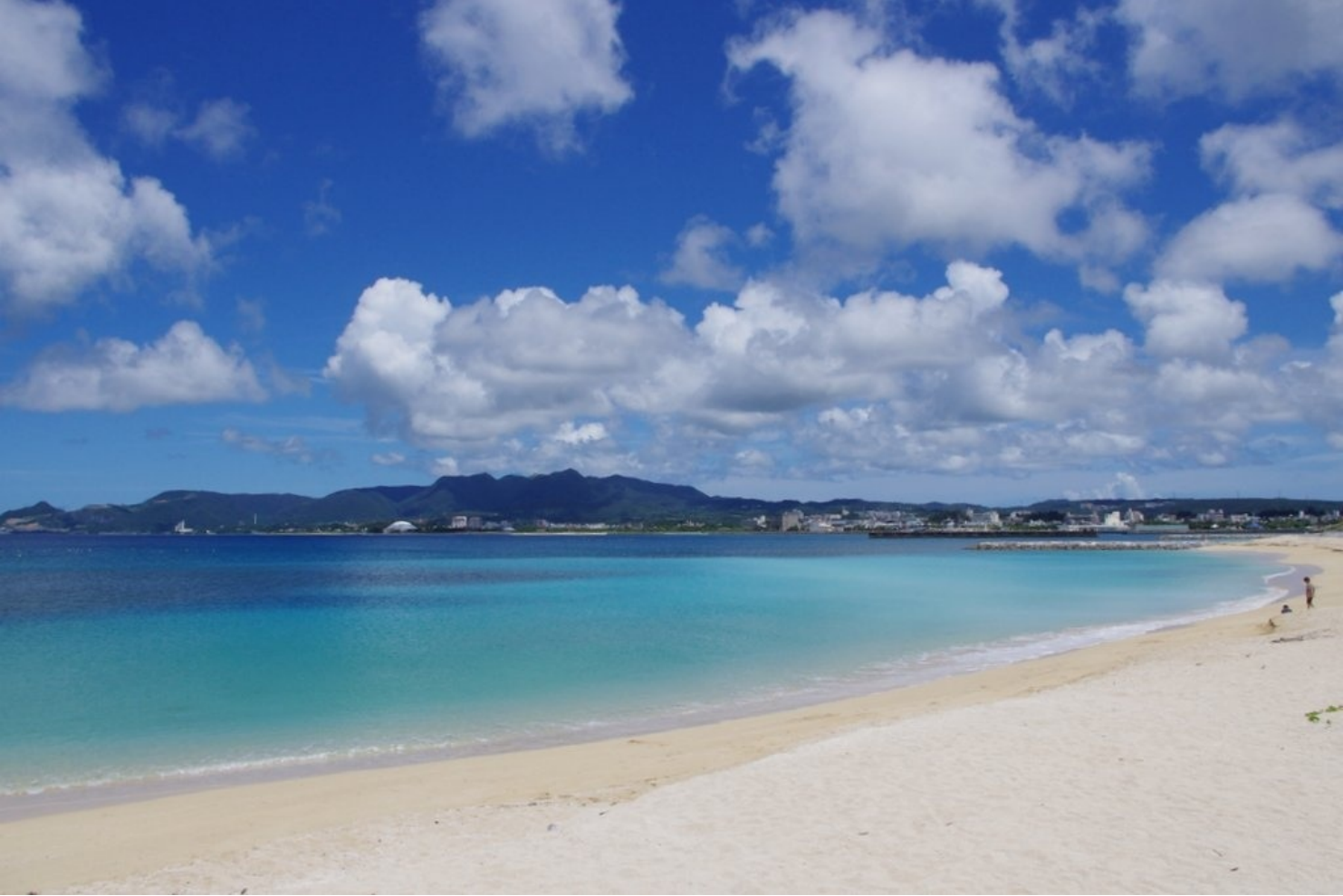
名護の白い砂浜。じりじりと焼け付く熱さ。