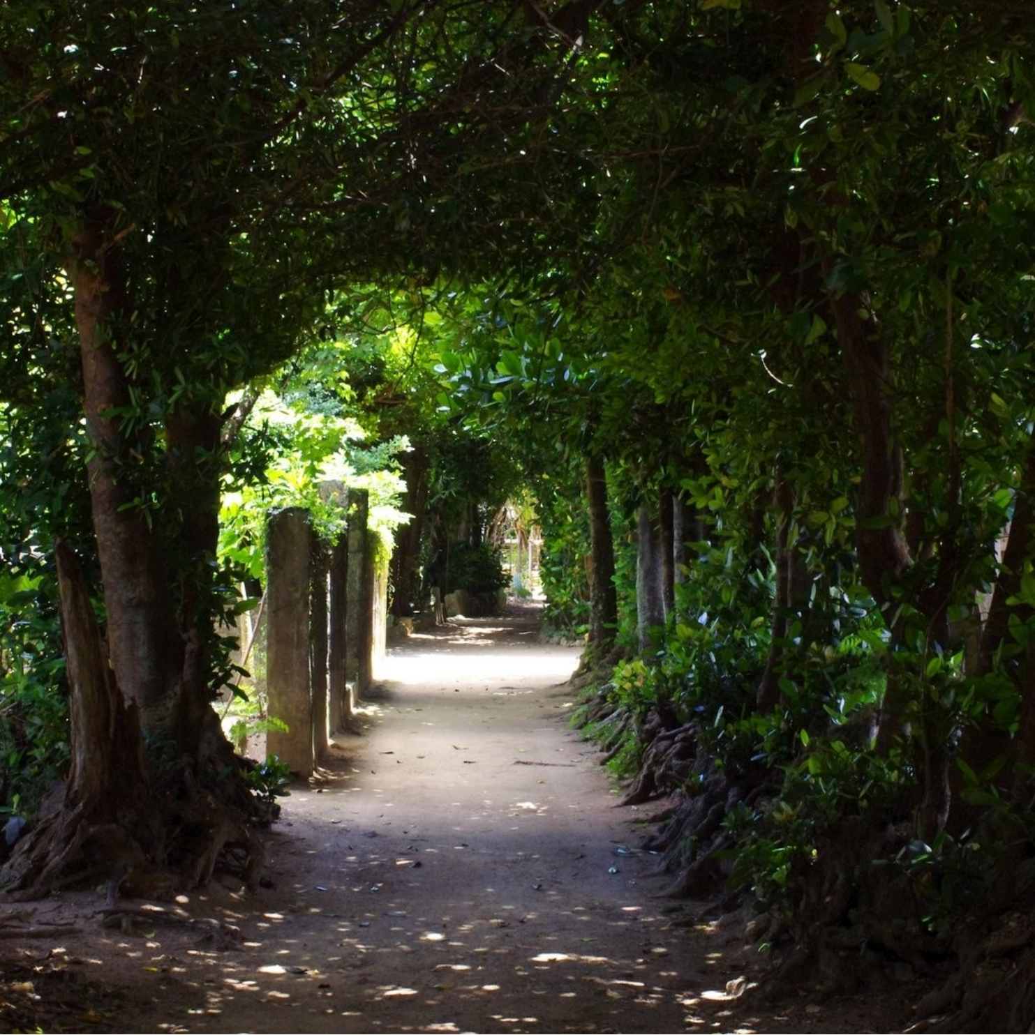
備瀬のフクギ並木。静かで独特の雰囲気です。