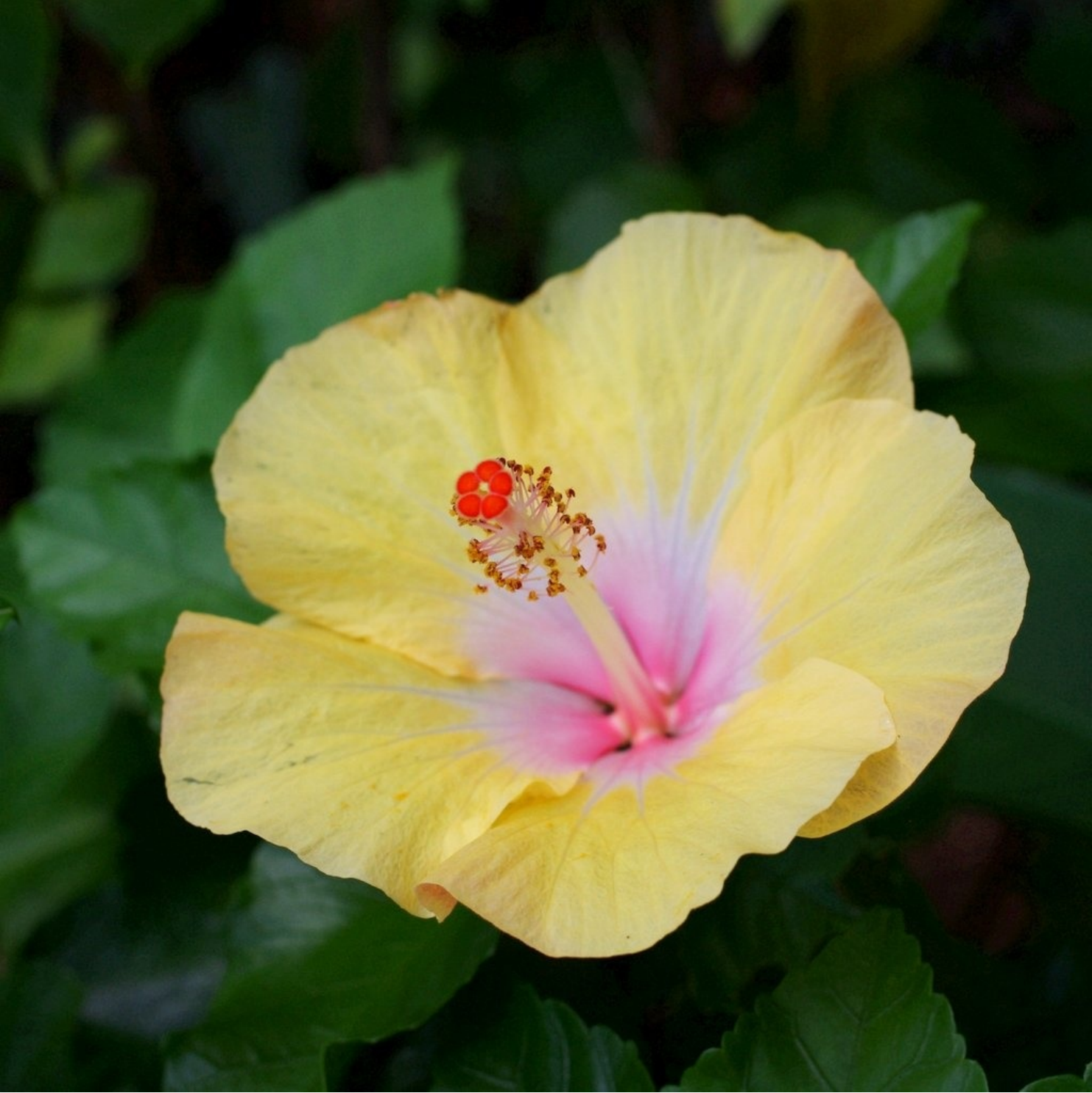
南国の花、ハイビスカス。