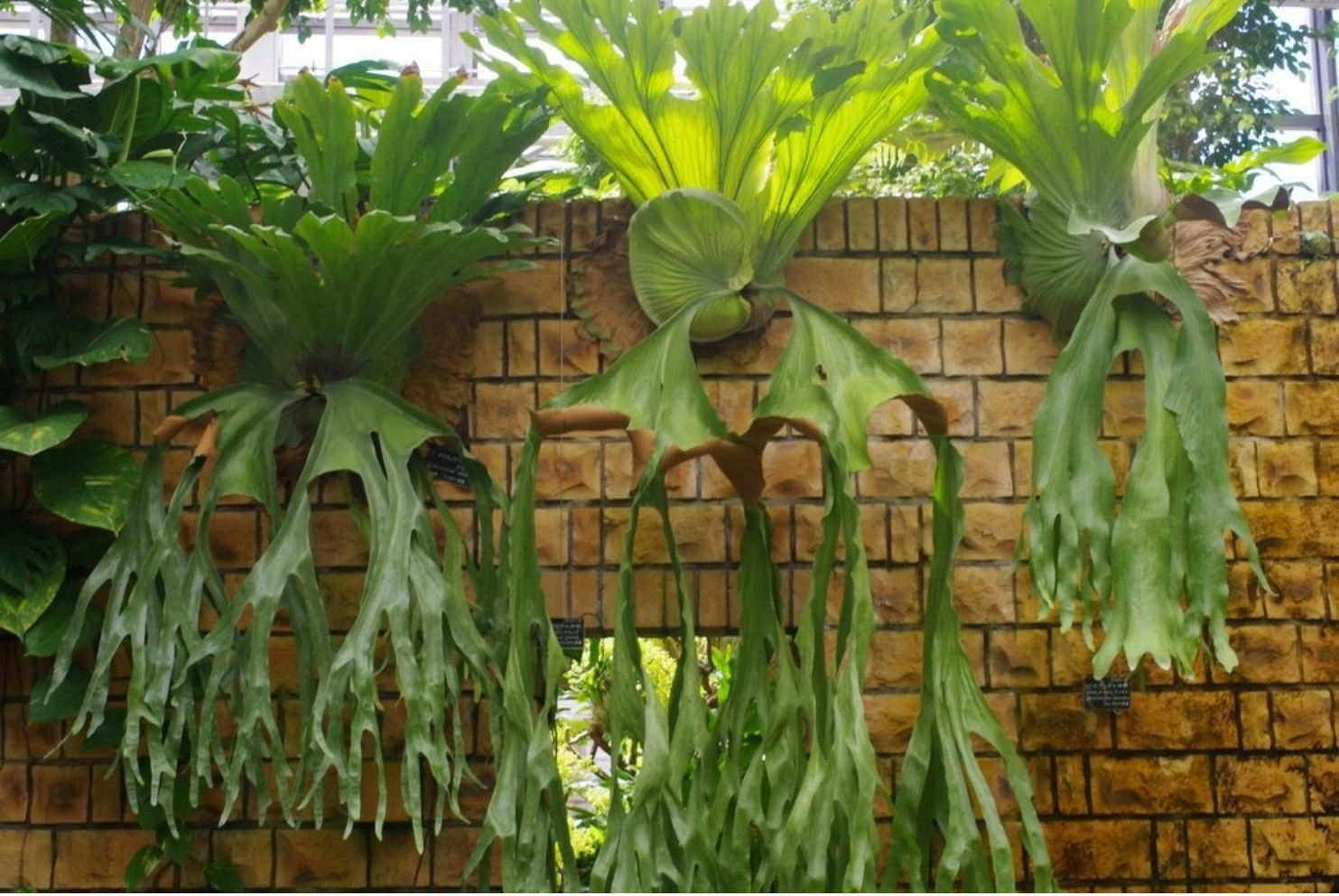
熱帯の不思議な植物たち。