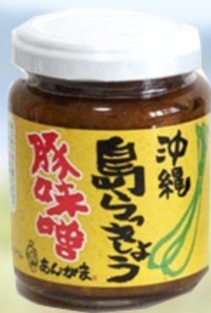
島らっきょう豚味噌