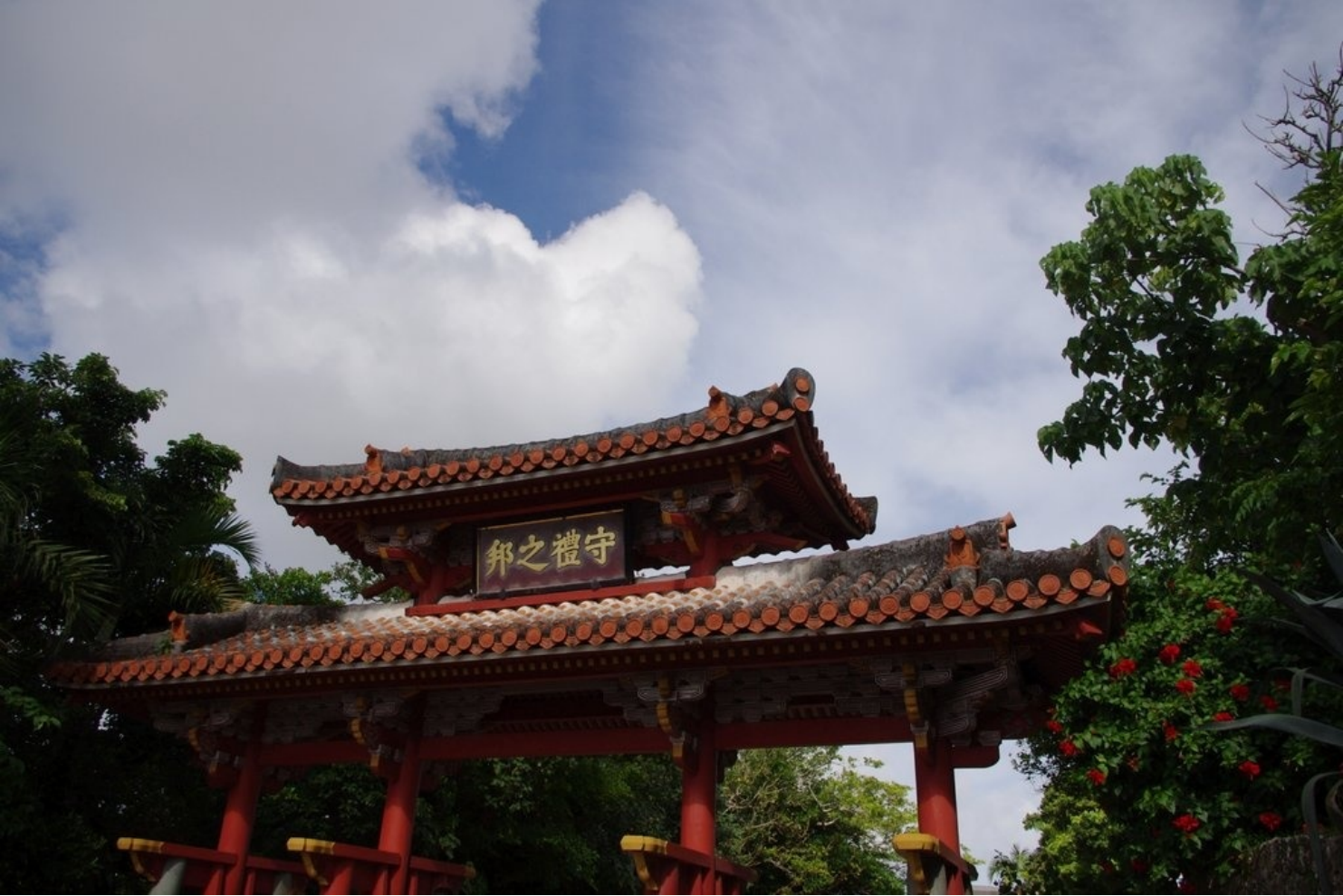
首里城。琉球王国の文化と政治の中心として栄華を誇った地。