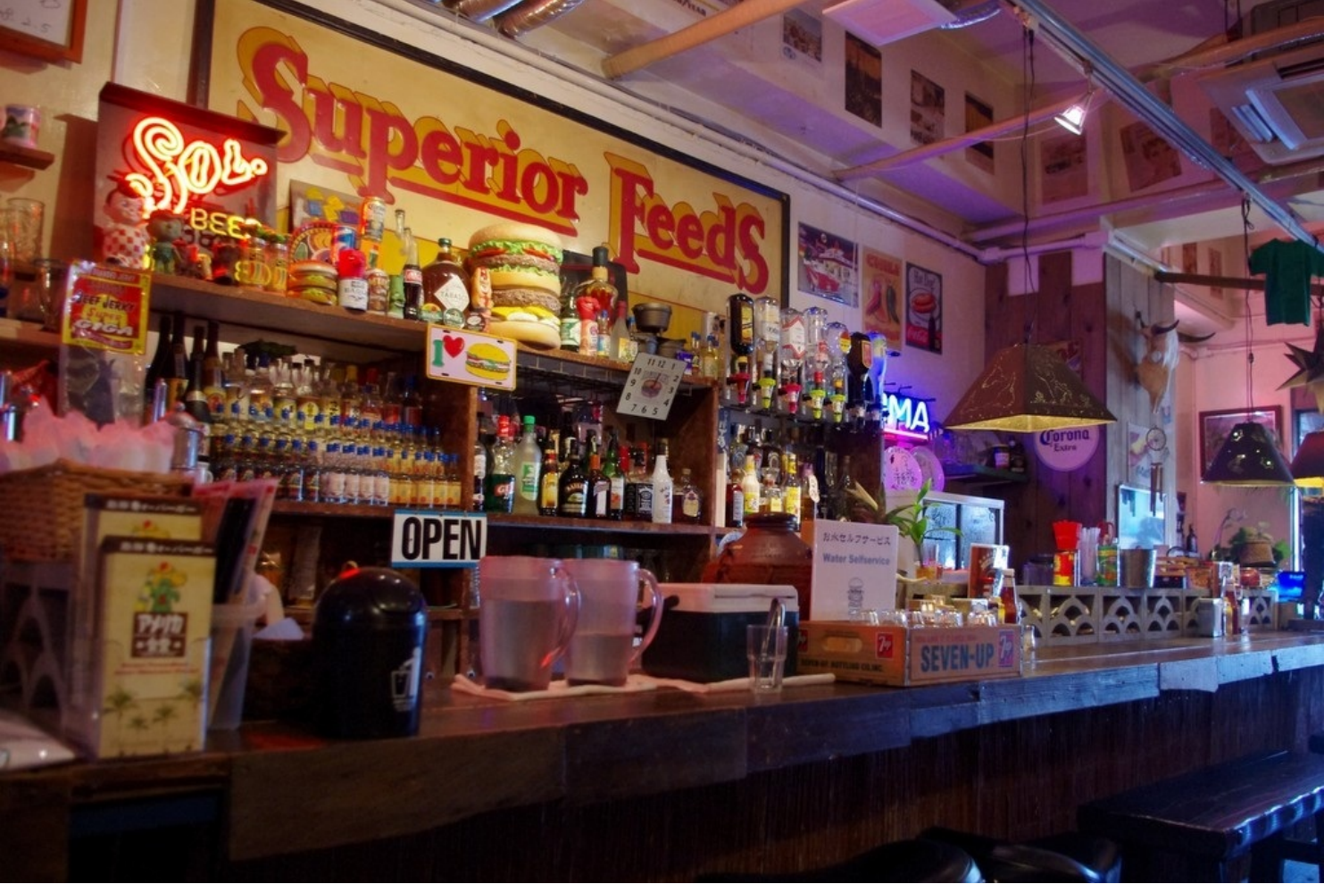
アメリカと沖縄の文化が混ざった那覇のカフェ&バー。