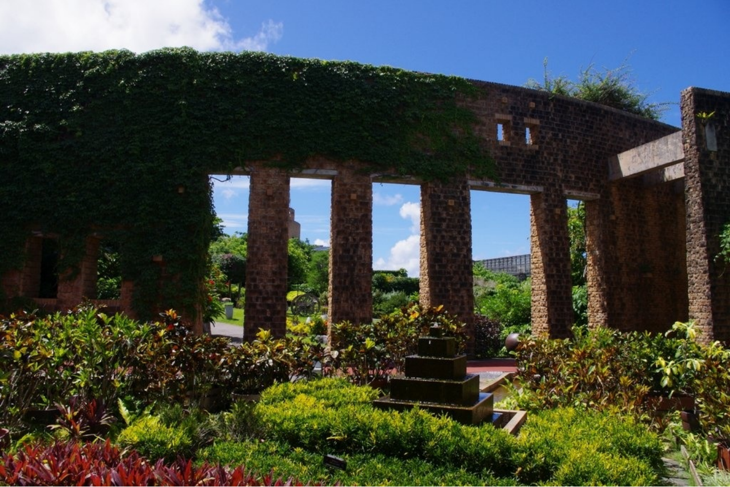
海洋博公園の熱帯ドリームセンター。真夏の植物たちはとても元気です。