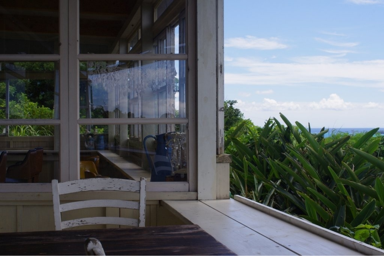
本部町のカフェ。高台から海を一望できます。