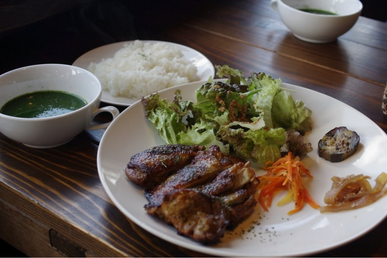
名護のビーチサイドにあるカフェで、ジャークチキンのランチプレート。