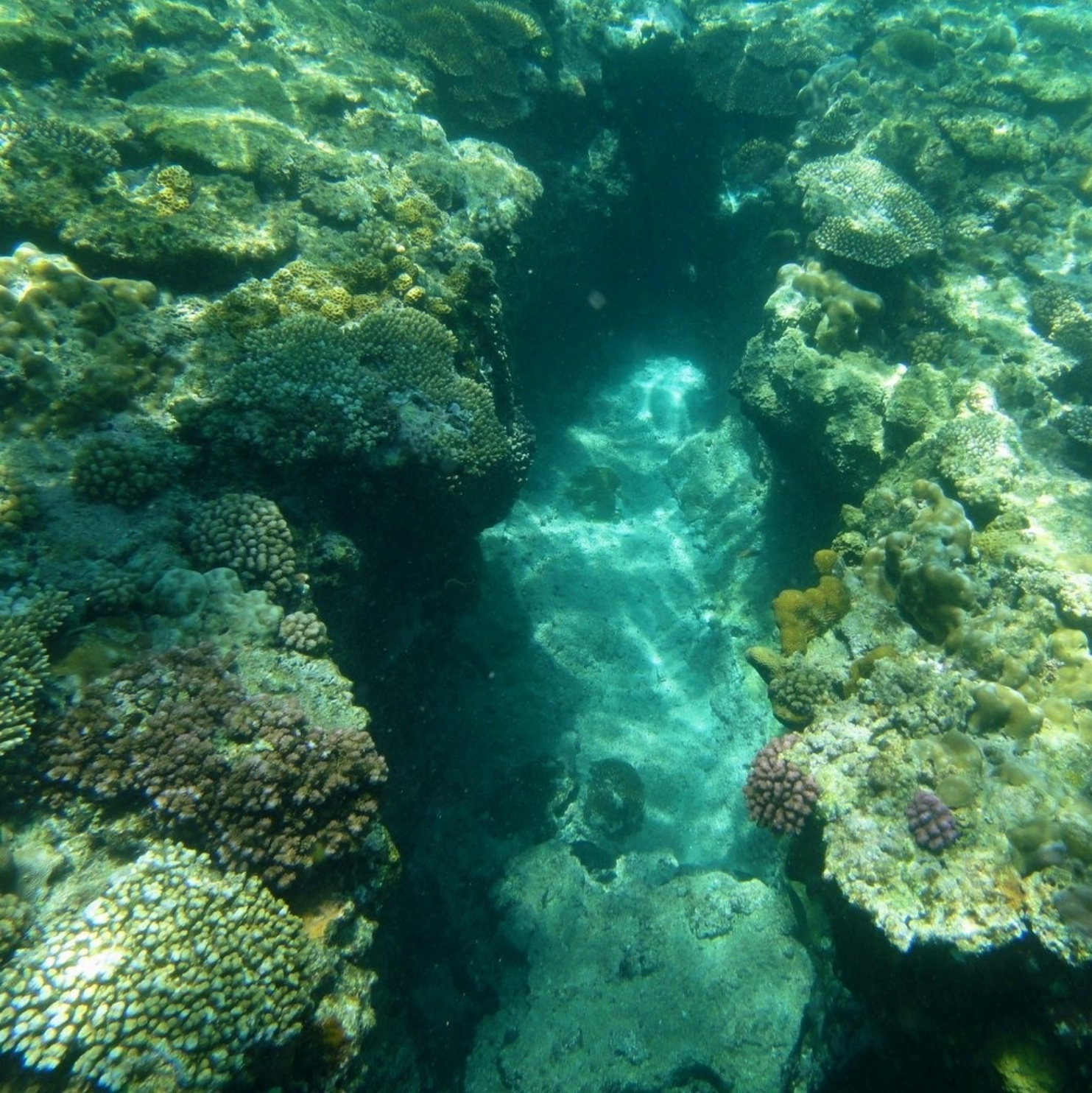
おさかなマンション。カラフルな魚がたまに顔を出します。