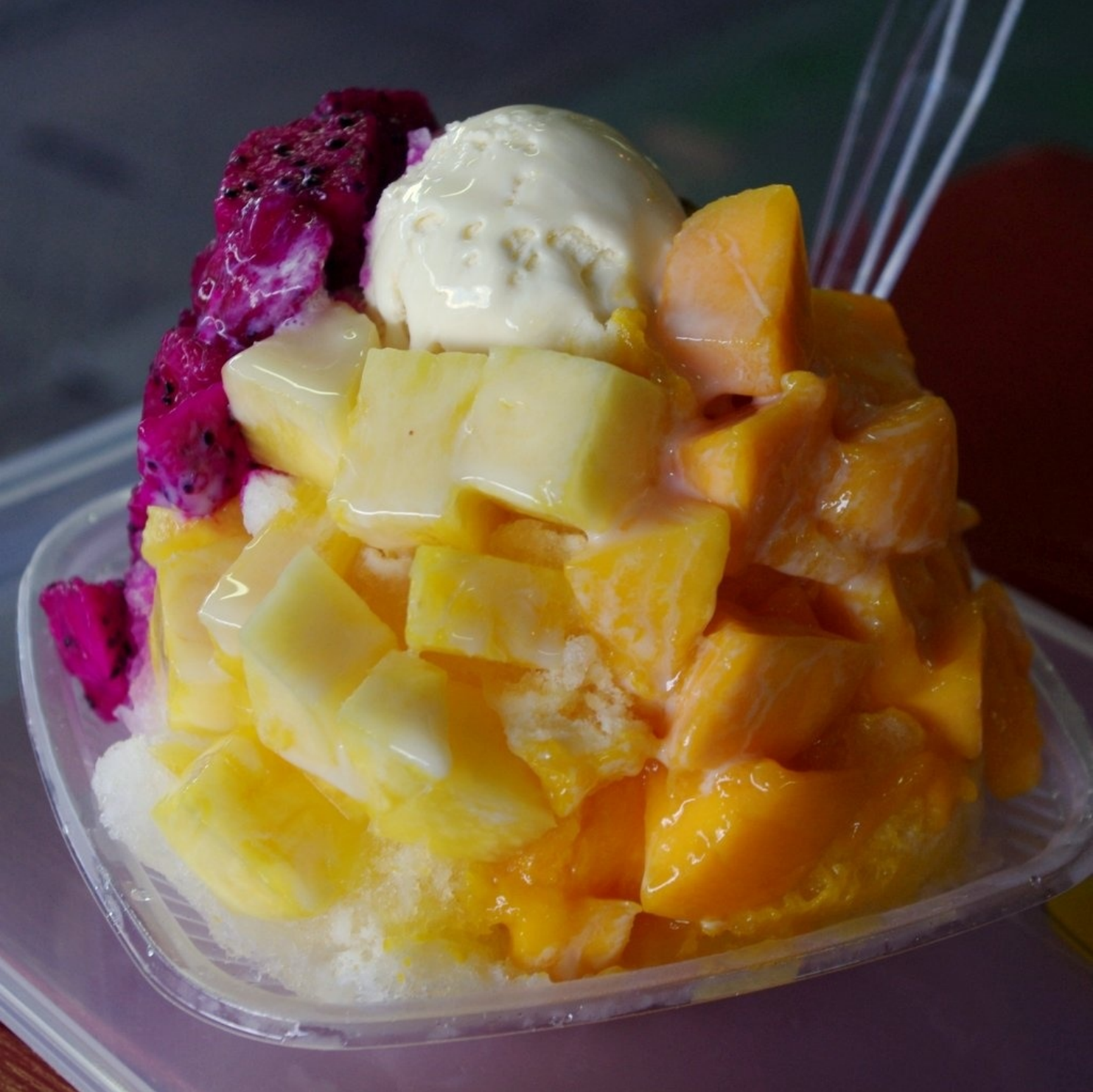
恩納村の道の駅で食べたかき氷。マンゴー、ドラゴンフルーツ、パッションフルーツ、パイナップル。新鮮で濃厚でした。