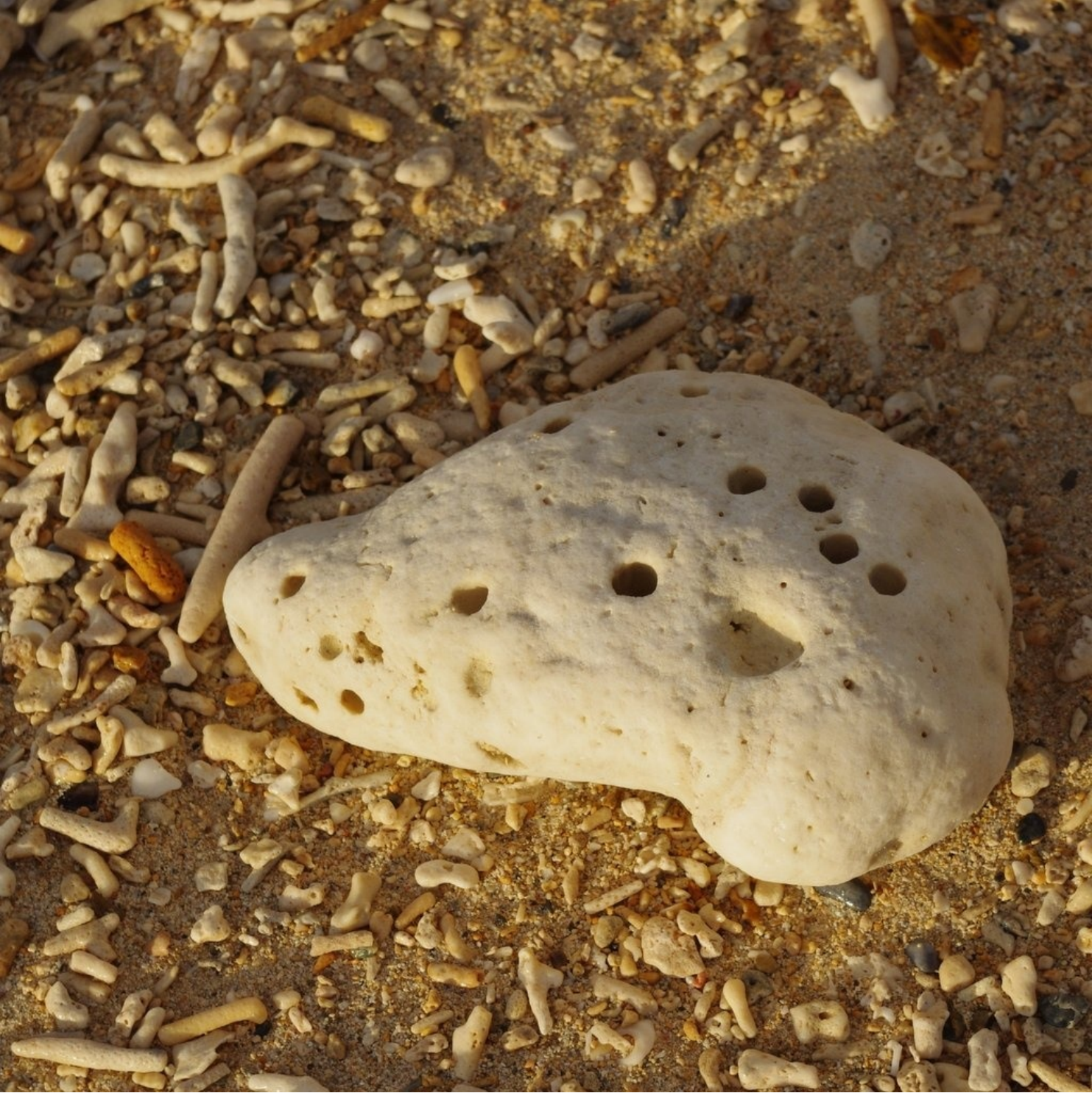
オカリナみたいなサンゴ。