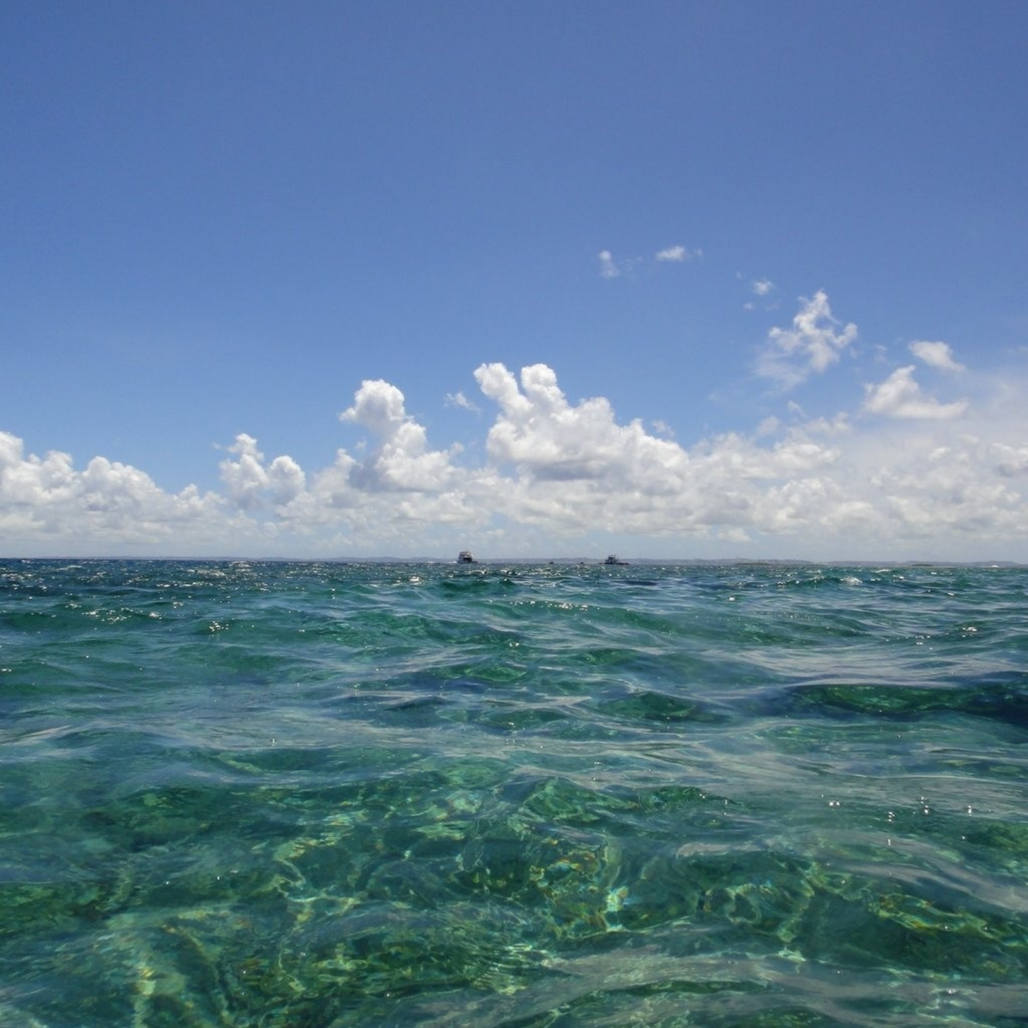
透明度の高い海。慶良間でボートシュノーケリングをしました。