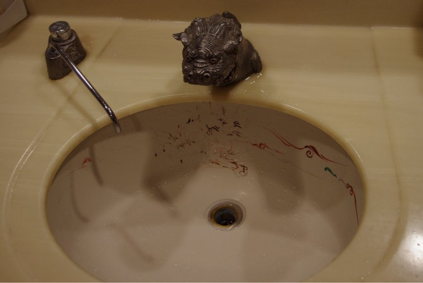
首里城のトイレは蛇口がシーサーでした。