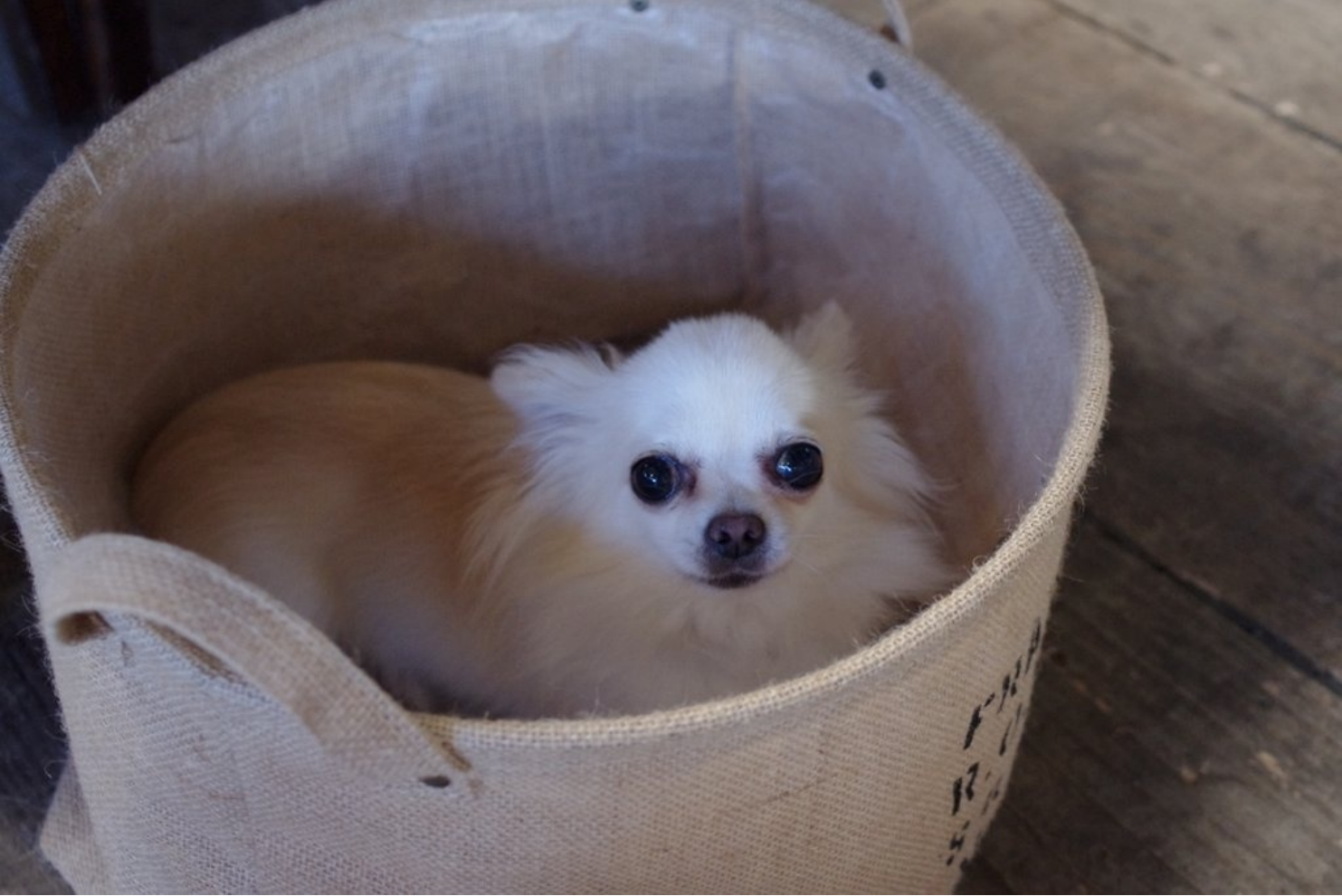
カフェの看板犬、チワワの太郎ちゃん。