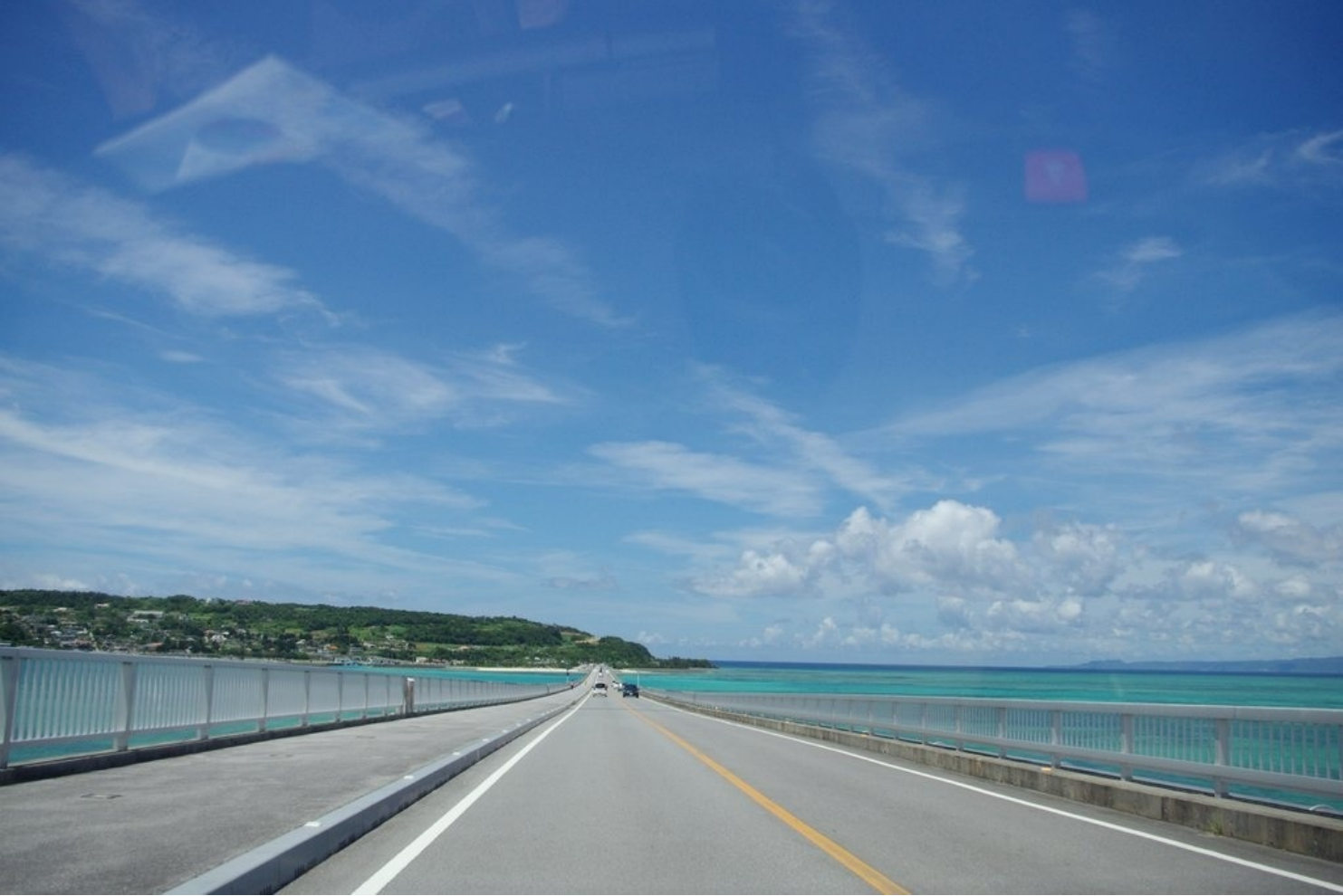
古宇利大橋。左右に広がる海を眺めながらドライブをしました。