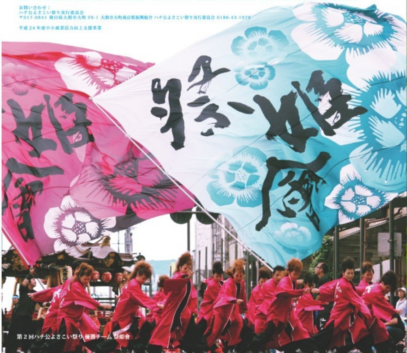
第2回ハチ公よさこい祭り 優勝チーム 景姫會