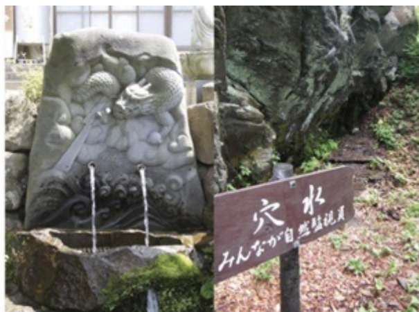
美女のお告げもたらした名水