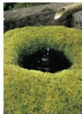
水の落ちる音が緑の中に 吸い込まれて行くような 神秘的な響き ●安曇野市清見寺