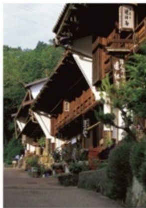
出梁や格子の民家が続く馬籠宿(岐阜県中津川市)。土産物店、飲食店も町並みに溶け込み、深い味わい