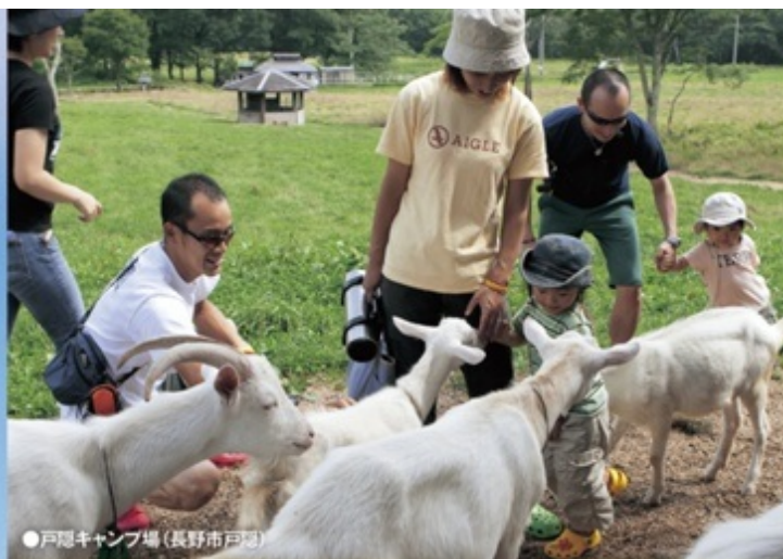
●戸隠キャンプ場(長野市戸隠)