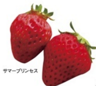
サマープリンセス

イチゴの名前は「サマープリンセス」。名の通り、夏に収穫されるイチゴで、生産地域はごくわずかに、高原野菜のレタスで有名な川上村を中心に、冷涼な気候を活かして生産されています。夏でも国産のイチゴを生で使いたいという要望を叶えた、夢のようなイチゴなのです。いちご一粒を大きく美味しくするため、摘果作業を丁寧に行っています。主に首都圏のホテルや洋菓子店に出荷されることから、県内では期間限定で川上村内の