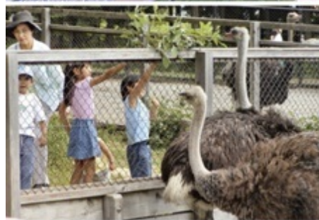
みはらしファームのダチョウ牧場では、ダチョウと触れ合うこともできる