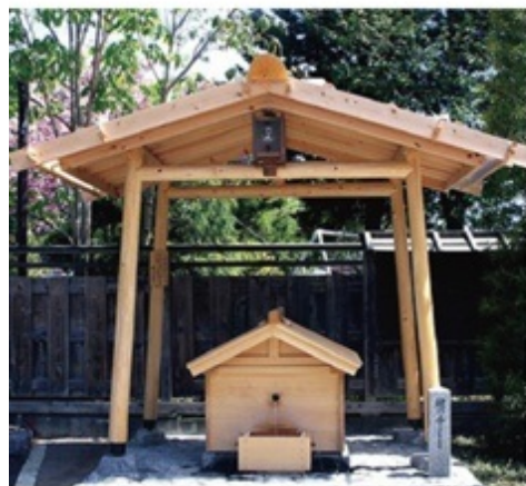
奈良井宿では、宿場のあちこちに水場を見ることができる。旅人と住民の憩いの場でもあり、夏の散策にもありがたい