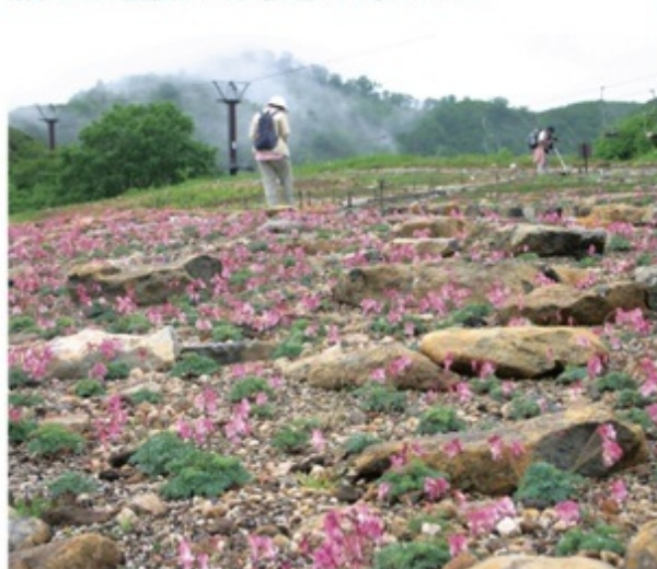
白馬五竜高山植物園はコマクサの群落で名高い、白馬Alps花三昧の会場でもある