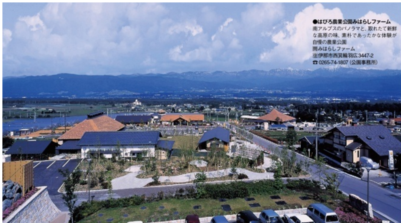
●はびろ農業公園みはらしファーム 南アルプスのパノラマと、取れたて新鮮な高原の味、素朴であったかな体験が自慢の農業公園 みはらしファーム 〒伊那市西箕輪羽広3447-2 ☎ 0265-74-1807 (公園事務所)