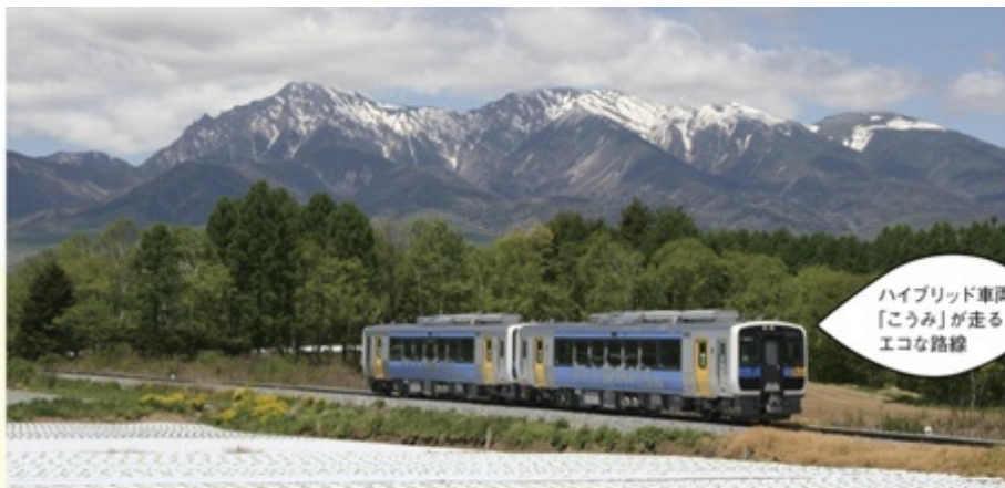
ハイブリッド車両 「こうみ」が走る エコな路線