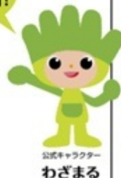
公式キャラクター わざまる