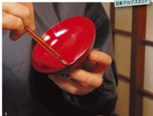
日本アルプスエリア