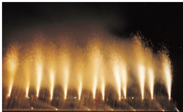
●みのわ祭り-手筒花火(箕輪町)