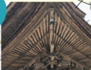
映画「一遍上人」 のロケ地