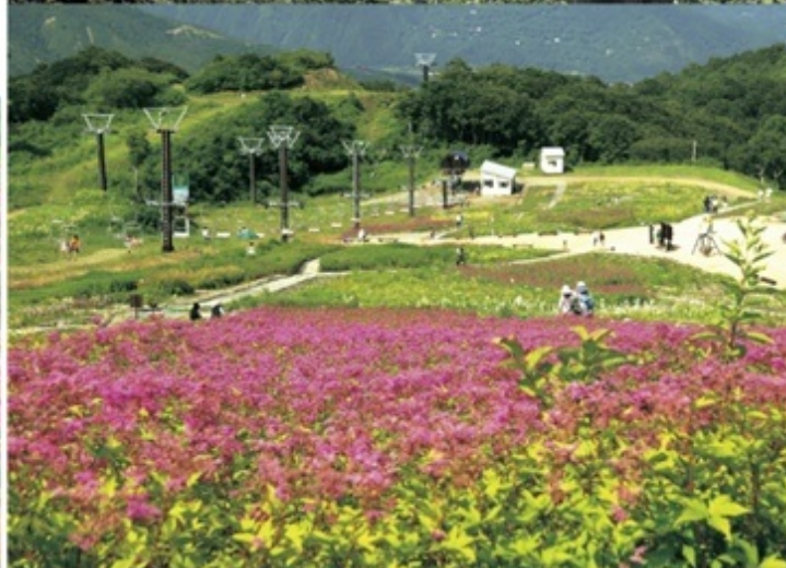
上/小遠見山頂(2007m)からの眺め。360度のパノラマが楽しめる 下/テレキャビンを降りると広がる白馬五竜高山植物園。季節の高山植物で彩られる

まだまだ自然を感じたいなら小遠見山までのトレッキングがおすすめです。その雄大さと手軽さに多くの山岳ファンを魅了しています。約2時間半から3時間の行程ですので、お弁当を持ってチャレンジしてみてもいいです。