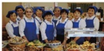
シルクミュージアムに併設されているレストランは、地元のお母さん達が作る郷土料理等が自慢

往時の歴史を知ることができる貴重な記念館。「体験工房」では、染物やシルククラフトの体験もできる