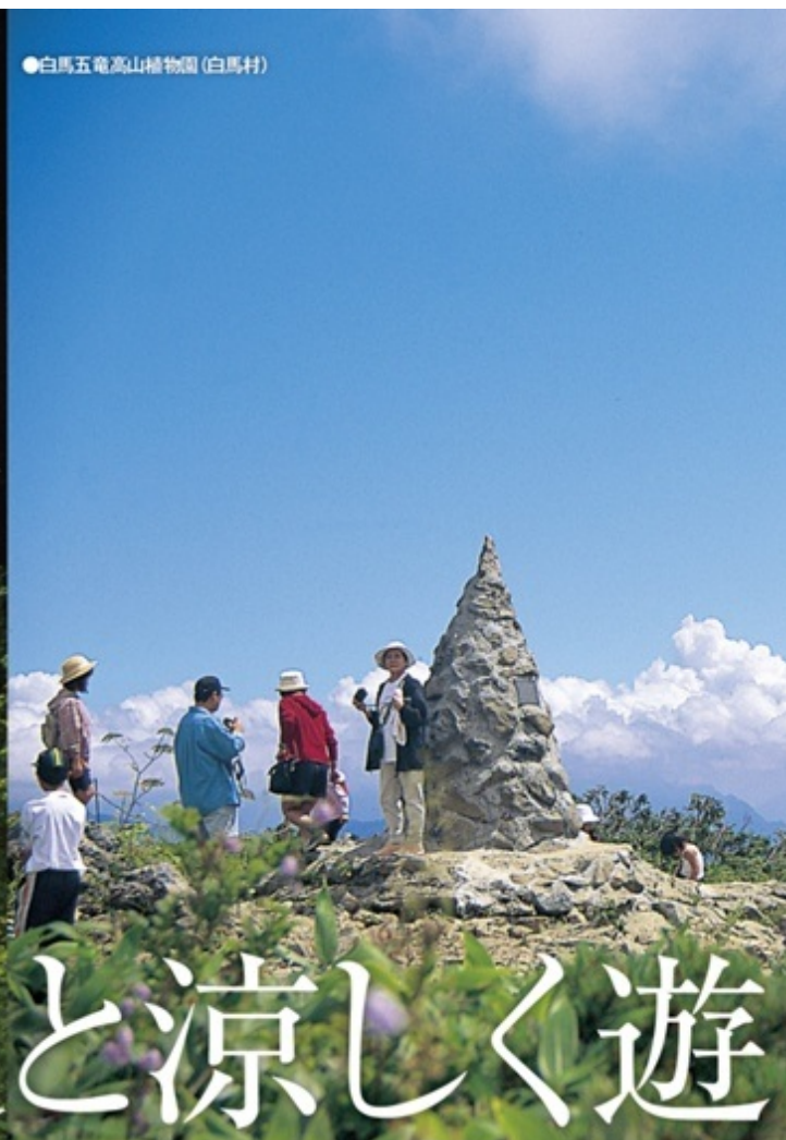
●白馬五竜高山植物園(白馬村)