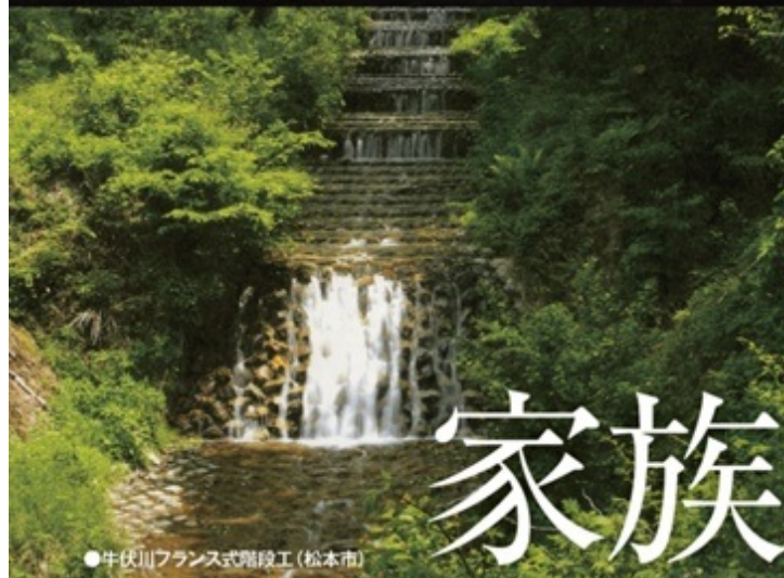
●牛伏川フランス式階段工(松本市)