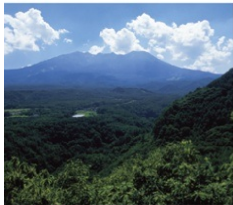
木曾谷を見守る天下の霊峰御嶽山。山岳信仰の対象として、古くから人びとに崇められてきた