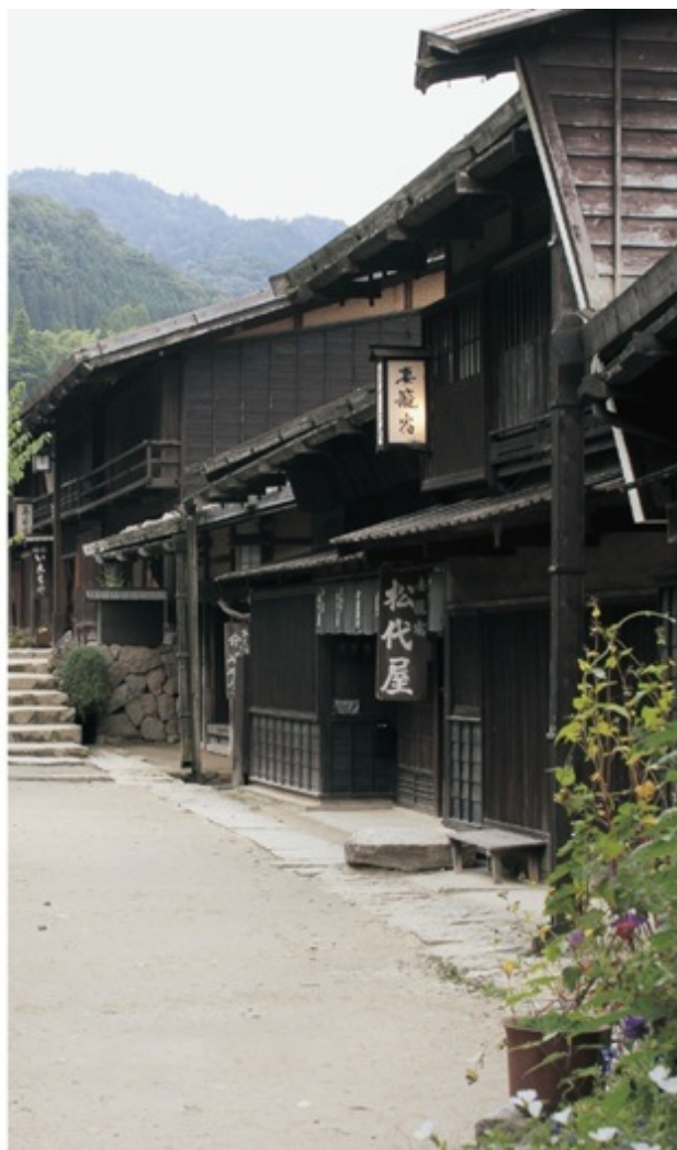
妻籠宿は全国で初めて古い街並みを保存した宿場町。訪れる人の心を懐かしい気持ちにさせてくれる