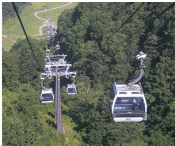
標高1515mの植物園まで一気に駆け上がる五竜テレキャビン