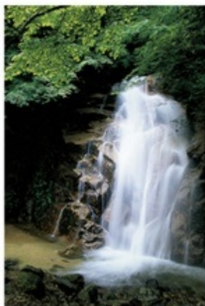
妻籠宿～馬籠宿の峠道にあり、古くから旅人に親しまれている男滝・女滝