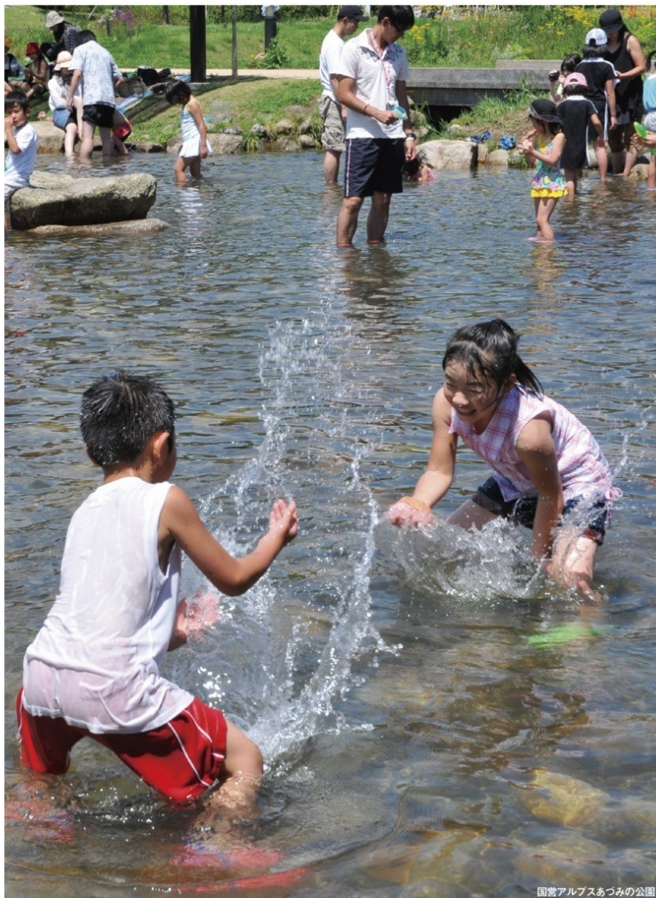
国営アルプスあつみの公園