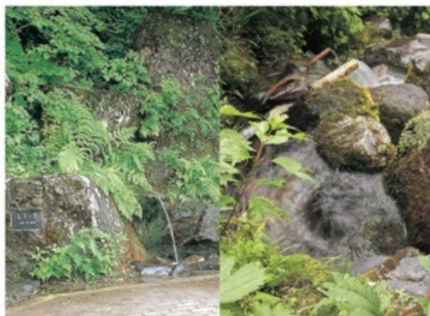
志賀高原有数の湧き水スポット