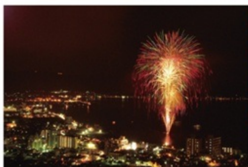
水上スターメイン

諏訪湖のほとりでは、約1カ月もの間、連日連夜15分間、音楽とともに花火が上がる。