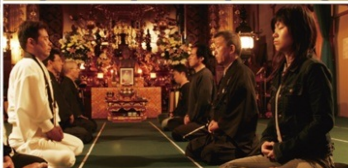
雑念払拭、吐き切る呼吸。座禅で心身を共に浄める。外は気温が上がリ蝉も鳴いているが、もう聞こえない ●参禅専門道場 大本山活禅寺 住長野市箱清水 3-29-60 ☎026-232-7565

次は名水を訪ねましょう。美人になる水、命が延びるという水、時間が経つても腐らない水と、信州の水には伝説がつきもの。そんなことを学びながら、水場を訪ねるのも楽しいものです。手を入れたら痺れるほどの冷たい水を召し上げられ。 日が暮れたあとは、美しい夜空の下でひんやり涼しいトレッキングがおすすめです。小さな虫たちの命に触れ、いろいろな想いが巡ることでしょう。信州だから味わえる、とおきの夏時間がここにあります。