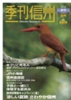
表紙デザイン：原田泰治