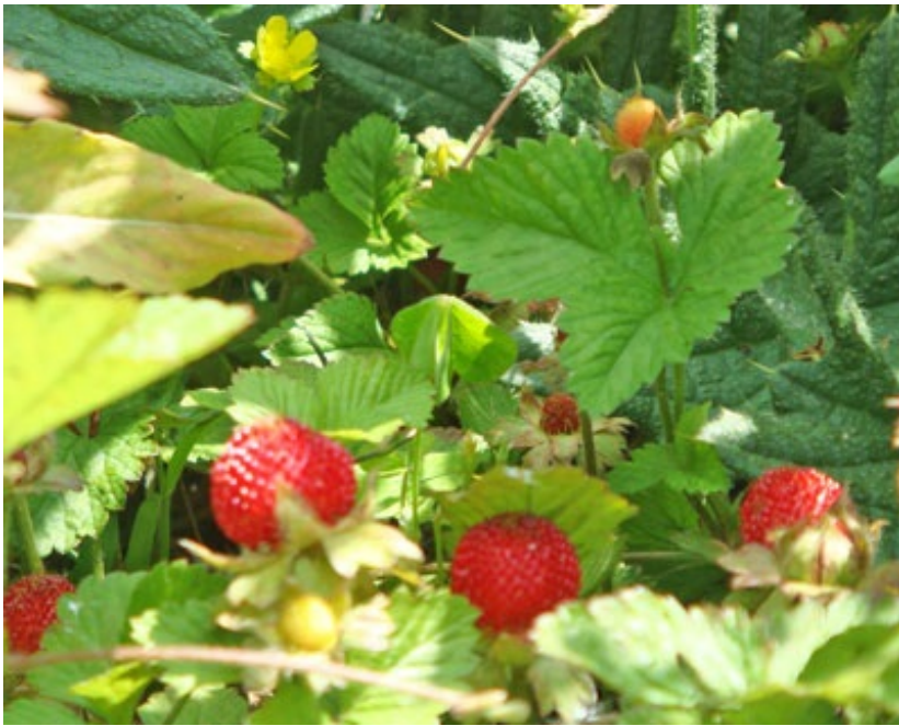
足元には、可愛いヘビイチゴ。