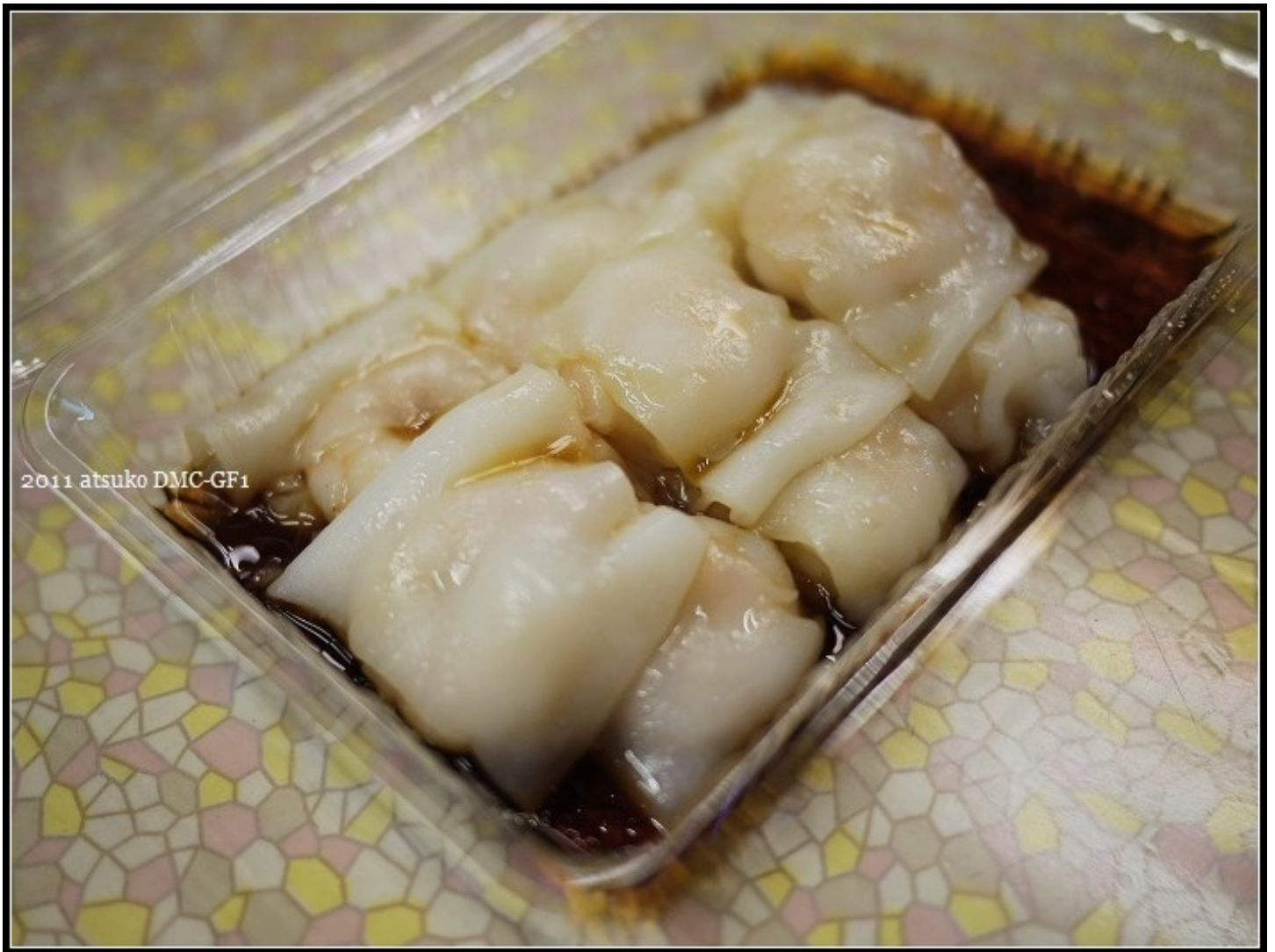
心心港式腸粉，蝦仁腸粉，一份NT$60