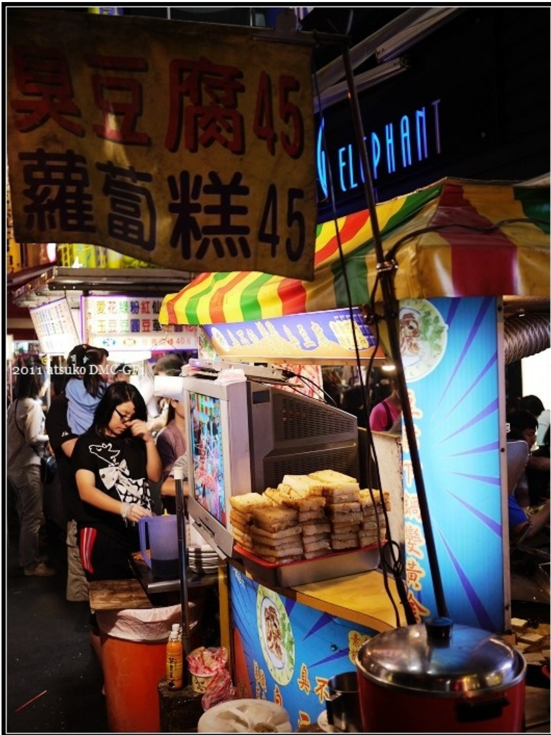
臭不怕港式脆皮臭豆腐，還有蘿蔔糕。 四塊，NT$45，中間挖洞注入醬汁與蒜泥，超級酥脆。