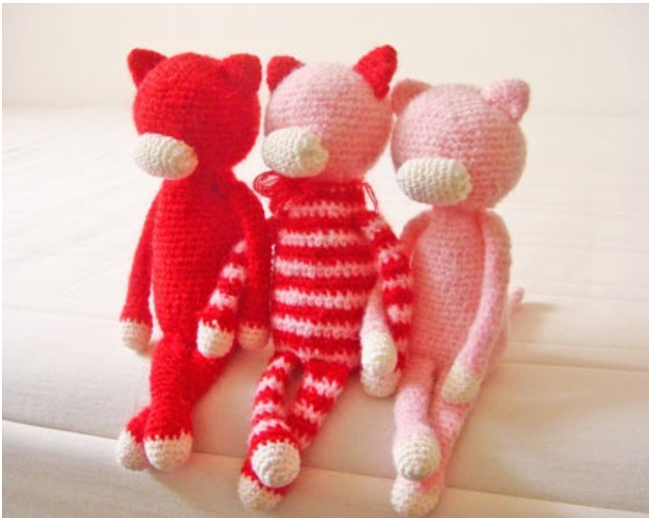
のっぺらぼう三姉妹。