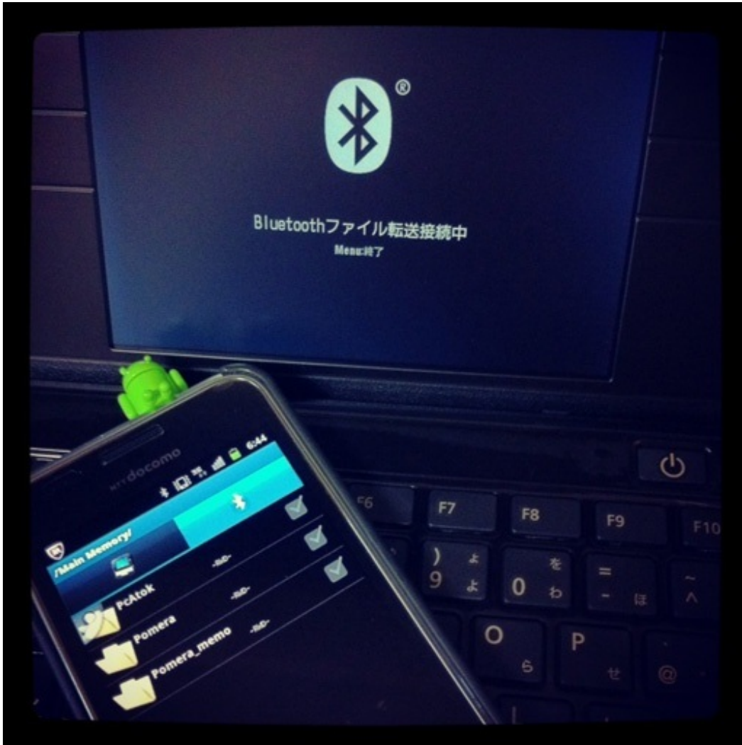
KING JIM デジタルメモ「ポメラ」 DM100クロ ブラック

AndroidケータイでBluetoothファイル転送を試してみました。AndroidのBluetoothファイル転送はできないという情報もありましたが、ちゃんとつながりました。