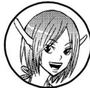
カノン(オンライン) Lv.20 エルフ 迷いの森で旅人を導く