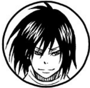
京介(オンライン) Lv.9999 最強プレイヤー 力と恐怖で世界を支配