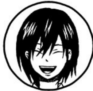
京介(リアル) 男子高校生 明るくクラスの人気者だった