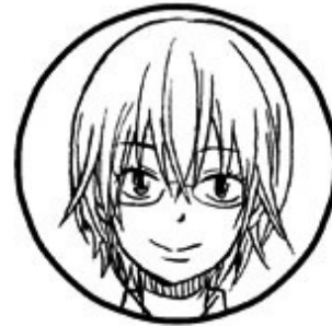
ユウコ(リアル) 女子高校生 ゲーム音痴