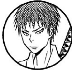
マサト(オンライン) Lv.172 伝説の剣士 強さを求め日々鍛錬している