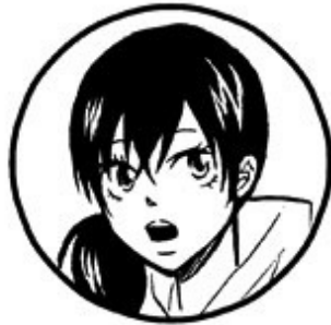
ユウコ(オンライン) Lv.1 旅人見習い ファイナルクエスト1最弱