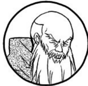
ナツメ(オンライン) Lv.203 大賢者 この世の黄金率を研究