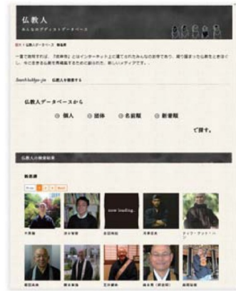
つながりという「ご縁」をふやす。 ネット寺院「彼岸寺」の仏教人データベース

ング」を僧侶が果たしてきたはずで、また、繰り返し顔を合わせることでお寺との距離感も近くなつて、お寺を応援してくれそうです。