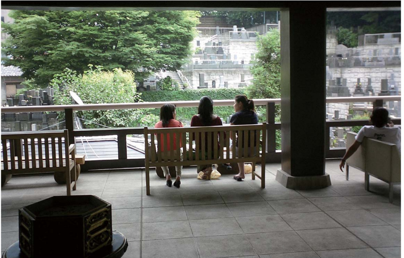
光明寺境内にある、お寺カフェ「ツナガルオテラ 神谷町オープンテラス」の様子