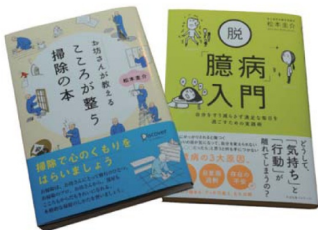
松本さん近刊の著作。「掃除」や「臆病」という仏教以外の用語をキーワードにすることで、仏教書コーナー以外の場所で仏教と出合っていたくのが狙いだったか